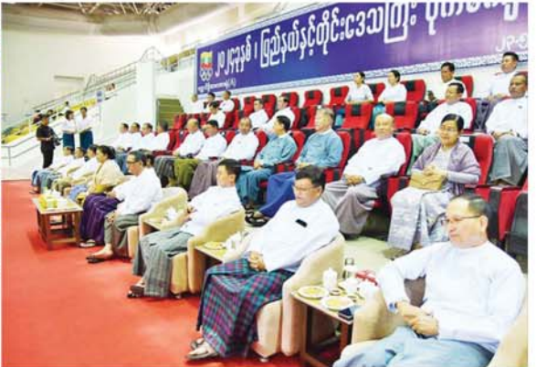
နိုင်ငံတော်စီမံအုပ်ချုပ်ရေးကောင်စီအဖွဲ့ဝင်များ ၂၀၂၄ ခုနှစ် ပြည်နယ်နှင့် တိုင်းဒေသကြီး ပိုက်ကျော်ခြင်းပြိုင်ပွဲ ဝိုင်းလှပစွာနှင့် ဆုချီးမြှင့်ပွဲအခမ်းအနားသို့ တက်ရောက်ကြည့်ရှုအားပေးပြီး ဆုများပေးအပ်ချီးမြှင့်

အနားသို့ တက်ရောက်လာကြသူ များနှင့်အတူ ၂၀၂၄ ခုနှစ် ပြည်နယ်နှင့် တိုင်းဒေသကြီး ပိုက်ကျော်ခြင်းပြိုင်ပွဲ ဝိုင်းလှပစွာနှင့် ဆုချီးမြှင့်ပွဲအခမ်းအနားကို ယနေ့ နံနက်ပိုင်းတွင် နေပြည်တော်ရှိ ဝဏ္ဏသိဒ္ဓိ အားကစားရုံ(A) ၌ ကျင်းပသည်။ အခမ်းအနားသို့ နိုင်ငံတော် စီမံအုပ်ချုပ်ရေးကောင်စီအဖွဲ့ဝင်များ ဖြစ်ကြသည့် ဒေါ်ခွဲဘူ၊ ပိုးရယ်အောင်သိန်း၊ မန်းငြိမ်းမောင်၊ ဒေါက်တာမူထန်၊ ဒေါက်တာဘရွှေ၊ ခွန်စံလွင်၊ ဦးရွှေကြိမ်း၊ ဦးရန်ကျော်၊ ပြည်ထောင်စုဝန်ကြီးများ၊ ပြည်ထောင်စုစာတမ်းအဖွဲ့ ဥက္ကဋ္ဌ၊ ဒုတိယဝန်ကြီးများ၊ နေပြည်တော်ကောင်စီဝင်၊ ဌာနဆိုင်ရာ တာဝန်ရှိသူများ၊ မြန်မာနိုင်ငံပိုက်ကျော်ခြင်းအဖွဲ့ချုပ်ဥက္ကဋ္ဌနှင့် တာဝန်ရှိသူများ၊ ပြိုင်ပွဲဝင်အသင်းများမှ အုပ်ချုပ်သူ နည်းပြများ၊ အားကစားသမားများ၊ ဝန်ကြီးဌာနများမှ ဝန်ထမ်းများနှင့် ဝါသနာရှင် ပြည်သူများ တက်ရောက်ကြည့်ရှုအားပေးကြသည်။