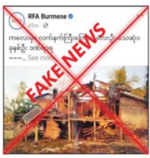
အမှားပြည်သူ့ ကြောက်ရွံ့ထိတ်လန့်စေရန်နှင့် လုံခြုံရေးတပ်ဖွဲ့ဝင်များအပေါ် အထင်အမြင်လွှဲ

စစ်ကိုင်းတိုင်းဒေသကြီး၊ ကလေးမြို့နယ်၌ နယ်မြေလုံခြုံရေးဆောင်ရွက်နေသည့် လုံခြုံရေးတပ်ဖွဲ့ဝင်များက မေ ၂၉ ရက်တွင် လက်နက်ကြီးပစ်ခတ်မှုကြောင့် တင်သားကျေးရွာအတွင်း ကျရောက်ပေါက်ကွဲခဲ့ပြီး ပြည်သူ့ လေးဦး သေဆုံးကာ ခုနစ်ဦး ထိခိုက်ဒဏ်ရာရခဲ့သည်ဟု မဟုတ်မမှန်စွာပျံ့နှံ့သွားသော သတင်းတို့ သတင်းအမှားများကို တရားမဝင်ပြည်ပျက်မီဒီယာများက ပြည်သူများ အထင်အမြင်လွှဲယောင်းစေရန် လှုံ့ဆော်ဝါဒဖြန့်ဝေနေသည်ကို တွေ့ရှိရသည်။ တရားမဝင်ပြည်ပျက်မီဒီယာများသည်