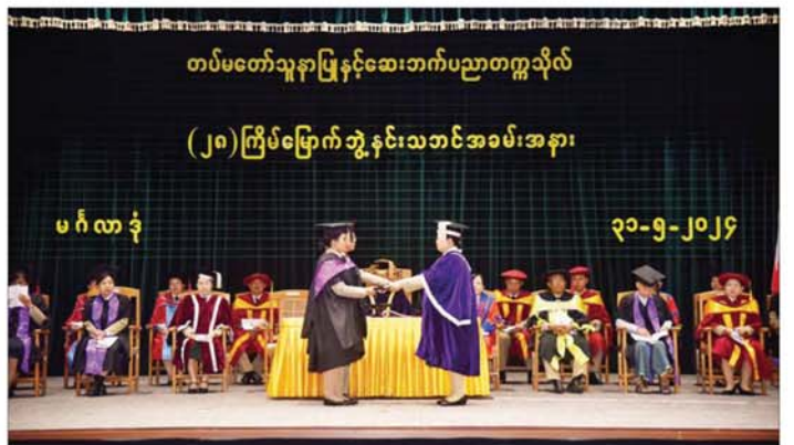
ပြပြီး ဘွဲ့နှင့်သဘင်မှတ်တမ်းစာအုပ်တွင် လက်မှတ်ရေးထိုးသည်။ ထို့နောက် ကျောင်းအုပ်ကြီးက ဘွဲ့နှင့်သဘင်

ကတိသစ္စာခံယူစေခြင်း၊ သက်ဆိုင်ရာ ပါမောက္ခများက ဘွဲ့ယူမည့်သူများကို ပါမောက္ခချုပ်ထံသို့ပို့ဆောင်ခြင်းတို့ကို အစီအစဉ်အတိုင်း ဆောင်ရွက်ကြသည်။ ဘွဲ့လက်မှတ်များချီးမြှင့် ယင်းနောက် ပါမောက္ခချုပ်က ပါရဂူဘွဲ့ (ဆေးဘက်ဆိုင်ရာဓာတ်မှန်နှင့် ပုံရိပ်ဖော်နည်းပညာ)၊ သူနာပြုမဟာသိပ္ပံဘွဲ့၊ အထူးကြပ်မတ်သူနာပြုစုမူမဟာသိပ္ပံဘွဲ့၊ ဆေးဝါးနှင့် ဆေးဘက်ဆိုင်ရာနည်းပညာမဟာသိပ္ပံဘွဲ့၊ ဆေးပညာသင်ကြားရေးဘွဲ့လွန်ဒီပလိုမာ၊ ဆေးဘက်ဆိုင်ရာ အသံလွန်လှိုင်းဖြင့် ရောဂါရှာဖွေခြင်းနည်းပညာဒီပလိုမာ၊ ခွဲစိတ်ခန်းသူနာပြုစုမူဒီပလိုမာ၊ နှလုံးရောဂါအထူးပြုသူနာပြုစုမူဒီပလိုမာရရှိသူများကို ဘွဲ့လက်မှတ်များ ချီးမြှင့်အပ်နှင်းသည်။ ဆက်လက်၍ ကျောင်းအုပ်ကြီးက ဘွဲ့ရသူများအား ဘွဲ့များနှင့်လျော်ညီသော အဆောင်အယောင်အမှတ်လက္ခဏာဖြစ်သည့် ဝတ်ရုံများကို တံဆိပ်ခွင့်