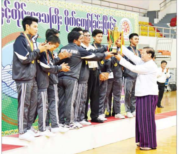
နိုင်ငံတော်စီမံအုပ်ချုပ်ရေးကောင်စီအဖွဲ့ဝင် ပိုးရယ်အောင်သိန်း အမျိုးသားတံခွန်စိုက်ဆုပေးလားရရှိသည့် မန္တလေးတိုင်းဒေသကြီးအသင်းအား တံခွန်စိုက်ဆုပေးလား ပေးအပ်ချီးမြှင့်စဉ်။