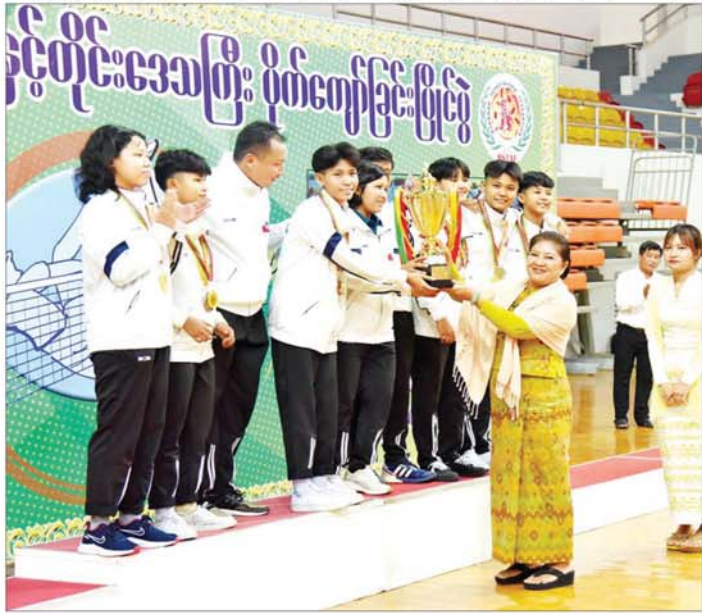
နိုင်ငံတော်စီမံအုပ်ချုပ်ရေးကောင်စီအဖွဲ့ဝင် ဒေါ်ဒွဲဘူ အမျိုးသမီးတံခွန်စိုက်ဆုပေးလားရရှိသည့် ရခိုင်ပြည်နယ်အသင်းအား တံခွန်စိုက်ဆုပေးလား ပေးအပ်ချီးမြှင့်စဉ်။

၂၀၂၄ ခုနှစ် ပြည်နယ်နှင့် တိုင်းဒေသကြီး ပိုက်ကျော်ခြင်း ဖြိုင်ပွဲကို ပြည်နယ်နှင့်တိုင်းဒေသကြီး