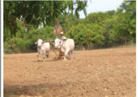
မိုးသီးနှံစိုက်ပျိုးရန် လယ်ယာမြေထွန်ယက်ခြင်း လုပ်ငန်းခွင်ဝင်ရောက်

မှားစေရန်အတွက် ဖြစ်စဉ်ဖြစ်ရပ်များအပေါ် အခြေခံကာ လုပ်ကြံရေးသားထားသည့် သတင်းတို့၊ သတင်းအမှားများကို ရည်ရွယ်ချက်ရှိရှိ လှုံ့ဆော်ဝါဒဖြန့်ဝေလျက်ရှိရာ ယခုဖြစ်စဉ်မှာလည်း ၎င်းကျေးရွာအနီး နယ်မြေလုံခြုံရေးဆောင်ရွက်ရန် ရောက်ရှိနေသည့် လုံခြုံရေးတပ်ဖွဲ့ဝင်များကို ပြည်သူများ ထင်ယောင်ထင်မှားဖြစ်စေရန်အတွက် မဟုတ်မမှန် လုပ်ကြံရေးသားထားခြင်းသာဖြစ်ပြီး လုံခြုံရေးတပ်ဖွဲ့ဝင်များက လက်နက်ကြီးပစ်ခတ်ခဲ့ခြင်းမရှိကြောင်း လုံခြုံရေးတာဝန်ရှိသူတစ်ဦး၏ ပြောကြားချက်အရ သိရသည်။ သတင်းစဉ်