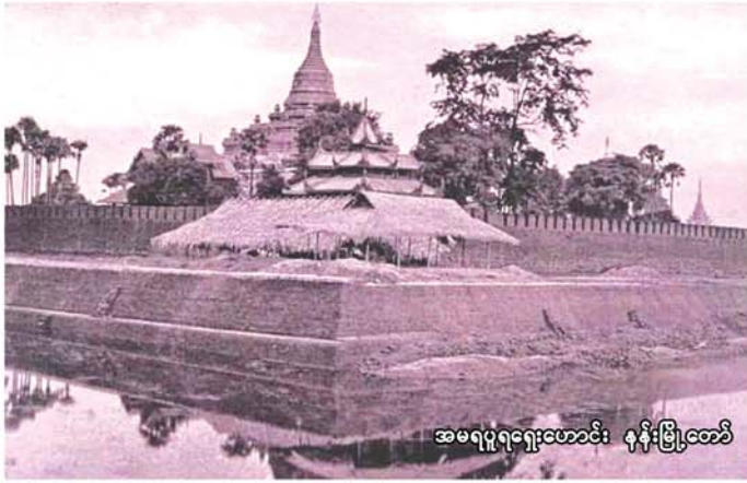
အမရပူရရှေးဟောင်း ရန်ဒြေအင်္ဂါ

အမရပူရသည် နှစ်ပေါင်း ၂၄၀ ကြာမြင့် ခဲ့ပြီဖြစ်သည့် ရှေးဟောင်းမြို့တော်ဖြစ်သည်။ ကုန်းဘောင်ခေတ်တွင် စည်ပင်ပြောခဲ့သည်။ ဘိုးတော်ဘုရား (ဗဒုံမင်း)က မြန်မာနှစ် ၁၁၄၄ ခုနှစ်တွင် တည်ထောင်ခဲ့သည်။ ဘိုးတော်ဘုရား သည် ကုန်းဘောင်မင်းဆက် ၁၁ ဆက်တွင် နန်းစံသက် အကြာမြင့်ဆုံးမင်း ဖြစ်သည်။