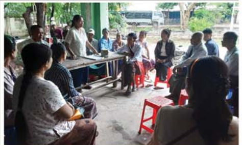
တောင်သူများ လူမှုစီးပွားဘဝဖွံ့ဖြိုးတိုးတက်စေရေး မိုးရာသီစိုက်ပျိုးစရိတ်များ ထုတ်ချေးပေး

ပြင်ဦးလွင်မြို့ သာယာလှပရေး၊ ဖွံ့ဖြိုးတိုးတက်ရေးအတွက် ဆောင်ရွက်သွားရမည်ဖြစ်ရာ လူနေရပ်ကွက်များတွင်လည်း ရှိသည့်ရိတ်ကန်သည့် သစ်ပင်များ၊ စည်းမျဉ်းစည်းကမ်းများနှင့်အညီ စိုက်ပျိုးနိုင်ရေး တိုက်တွန်းနှိုးဆော်ဆောင်ရွက်သွားရန် လိုအပ်သည်။ ထိုသို့ သစ်ပင်များ စိုက်ပျိုးခြင်းဖြင့် သဘာဝကို ထိန်းသိမ်းနိုင်သဖြင့် ပြင်ဦးလွင်ဒေသတွင် သစ်ပင်စိုက်ပျိုးခြင်းကို အားပေးဆောင်ရွက်သွားရမည်ဖြစ်ကြောင်း ရေးသားလိုက်ရပေသည်။