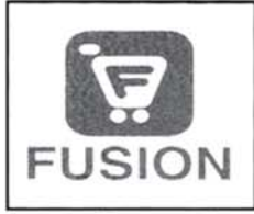
အမှတ်(၁၃၀၆/၂၀၂၄)