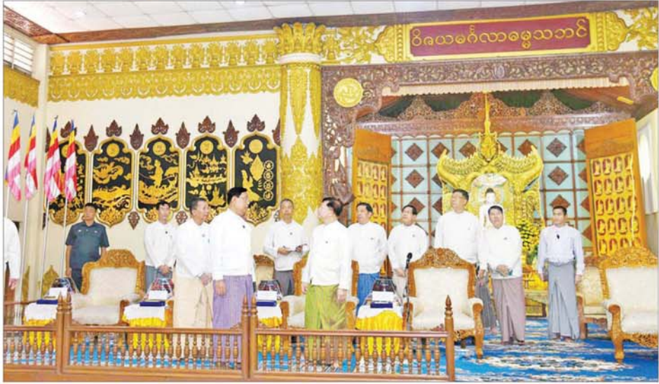
နိုင်ငံတော်စီမံအုပ်ချုပ်ရေးကောင်စီဥက္ကဋ္ဌ နိုင်ငံတော်ဝန်ကြီးချုပ် ဗိုလ်ချုပ်မှူးကြီး မင်းအောင်လှိုင် သိရိမင်္ဂလာကမ္ဘာအေးကုန်းမြေရှိ သာသနိကအဆောက်အအုံများကို ကြည့်ရှုစစ်ဆေးစဉ်။

ထို့နောက် နိုင်ငံတော်သံဃ မဟာနာယကအဖွဲ့ဥက္ကဋ္ဌ သန့်လျင် မင်းကျောင်း ဆရာတော်ကြီးက သမ္မာဒနိယ ဩဝါဒကထာကို မြှောက်ကြားချီးမြှင့်တော်မူသည်။ ယင်းနောက် နိုင်ငံတော်စီမံ အုပ်ချုပ်ရေးကောင်စီဥက္ကဋ္ဌ နိုင်ငံ တော် ဝန်ကြီးချုပ်က နိုင်ငံတော် သံဃမဟာနာယကအဖွဲ့ ဥက္ကဋ္ဌ သန့်လျင်မင်းကျောင်းဆရာတော် ကြီးနှင့် နိုင်ငံတော်သံဃမဟာ နာယကအဖွဲ့ အကျိုးတော်ဆောင်