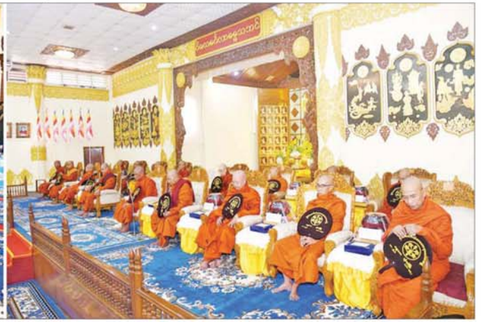
နိုင်ငံတော်စီမံအုပ်ချုပ်ရေးကောင်စီဥက္ကဋ္ဌ နိုင်ငံတော်ဝန်ကြီးချုပ် ဗိုလ်ချုပ်မှူးကြီးမင်းအောင်လှိုင်နှင့် တက်ရောက်လာကြသူများက ဆရာတော်ကြီးများ ရွတ်ပွားချီးမြှင့်တော်မူသည့် မေတ္တသုတ်ပရိတ် တရားတော်များကို နာယူကြစဉ်။