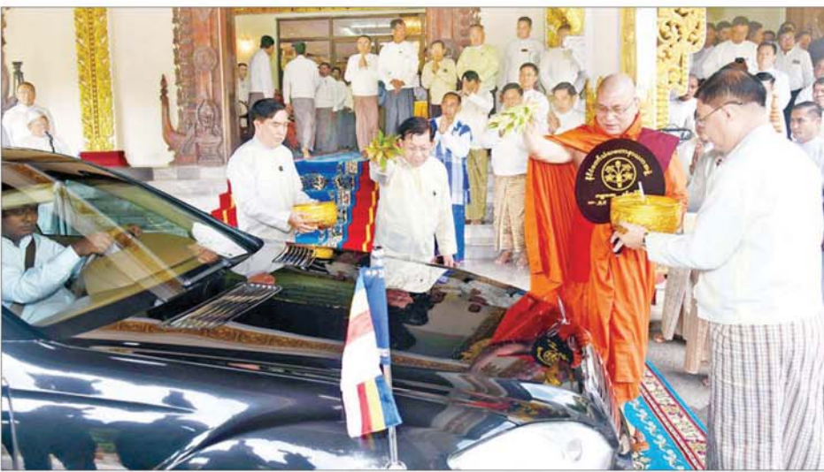
နိုင်ငံတော်သံဃမဟာနာယကအဖွဲ့ အကျိုးတော်ဆောင်ဆရာတော် ဘဒ္ဒန္တဝါသေဋ္ဌဘိဝံသနှင့် နိုင်ငံတော်စီမံအုပ်ချုပ်ရေးကောင်စီ ဥက္ကဋ္ဌ နိုင်ငံတော်ဝန်ကြီးချုပ် ဗိုလ်ချုပ်မှူးကြီးမင်းအောင်လှိုင်တို့က ဆရာတော်ကြီးထံ ဆက်ကပ်အပ်နှံထားရှိသည့် နိုင်ငံတော်အဆင့် အဆောင်အယောင်မော်တော်ယာဉ်အား ပရိတ်နံ့သာရည်များပက်ဖျန်း၍ သဒ္ဓါမင်္ဂလာ ဆင်ယင်ကြစဉ်။

ရှေ့မှ အဆိုပါ အခမ်းအနားသို့ နိုင်ငံတော်သံဃမဟာနာယကအဖွဲ့ ဥက္ကဋ္ဌ အဂ္ဂမဟာပဏ္ဍိတ အဂ္ဂမဟာ သဒ္ဓမ္မဇောတိကဓဇ သန့်လျှင် မင်းကျောင်းဆရာတော် ဒေါက်တာ ဘဒ္ဒန္တစန္ဒိမာဘိဝံသနှင့် နိုင်ငံတော် သံဃမဟာနာယကအဖွဲ့ အကျိုးတော်ဆောင် မန္တလေးမြို့ မစိုးရိမ် တိုက်သစ်မဟာနာယကဓမ္မသမိဒ္ဓိ ကျောင်းဆရာတော် အဂ္ဂမဟာ ပဏ္ဍိတ အဂ္ဂမဟာသဒ္ဓမ္မဇောတိက ဓဇမဟာဓမ္မကထိကဗဟုဓနဟိတ ဓရ ဘဒ္ဒန္တ ဝါသေဋ္ဌဘိဝံသတို့ အမျိုးပြုသည့် နိုင်ငံတော်သံဃ မဟာနာယကဆရာတော်ကြီးများ ကြွရောက် ချီးမြှင့်တော်မူကြပြီး နိုင်ငံတော်စီမံအုပ်ချုပ်ရေးကောင်စီ ဥက္ကဋ္ဌ နိုင်ငံတော်ဝန်ကြီးချုပ်နှင့် အတူခရီးစဉ်တွင်လိုက်ပါလာသည့် အဖွဲ့ဝင်များ၊ ရန်ကုန်တိုင်းဒေသ ကြီး ဝန်ကြီးချုပ်၊ ရန်ကုန်တိုင်း စစ်ဌာနချုပ်တိုင်းမှူးနှင့် တာဝန် ရှိသူများ တက်ရောက်ကြသည်။ ဆက်ကပ်လှူဒါန်း ဦးစွာ နိုင်ငံတော်စီမံအုပ်ချုပ်ရေး ကောင်စီဥက္ကဋ္ဌ နိုင်ငံတော်ဝန်ကြီး ချုပ်သည် ဝိဇယမင်္ဂလာဓမ္မသဘင်