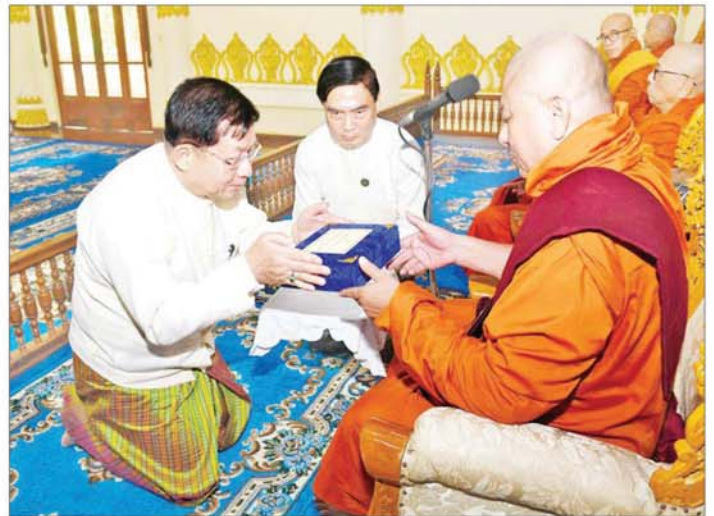
နိုင်ငံတော်စီမံအုပ်ချုပ်ရေးကောင်စီဥက္ကဋ္ဌ နိုင်ငံတော်ဝန်ကြီးချုပ် ဗိုလ်ချုပ်မှူးကြီးမင်းအောင်လှိုင် နိုင်ငံတော်သံဃမဟာနာယကအဖွဲ့ဥက္ကဋ္ဌ သန့်လျှင်မင်းကျောင်းဆရာတော် ဒေါက်တာ ဘဒ္ဒန္တစန္ဒိမာဘိဝံသနှင့် နိုင်ငံတော် သံဃမဟာနာယကအဖွဲ့ အကျိုးတော်ဆောင်ဆရာတော် ဒေါက်တာ ဘဒ္ဒန္တစန္ဒိမာဘိဝံသ ထံ နိုင်ငံတော်အဆင့် အဆောင်အယောင်မော်တော်ယာဉ် ဆက်ကပ်အပ်နှံစဉ်။