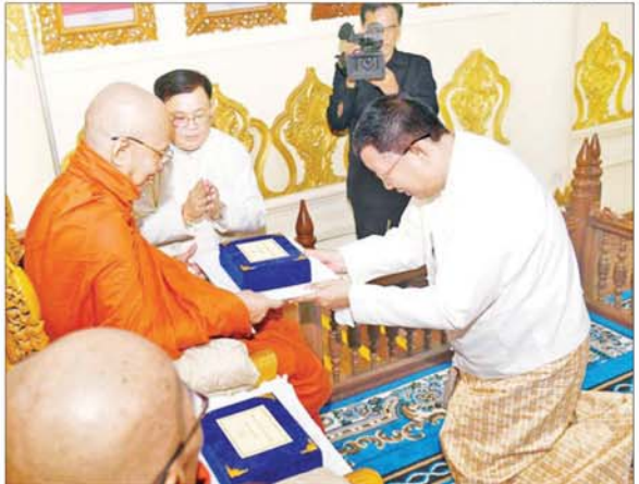
ပြည်ထောင်စု ဝန်ကြီး ဦးတင်ဦးလွင် ဆရာတော်ထံ နိုင်ငံတော် အဆောင် အယောင် မော်တော်ယာဉ် ဆက်ကပ် အပ်နှံစဉ်။

နှင့်စပ်လျဉ်းသည့်သာသနာတာဝန် မန္တလေးမြို့ မနိုးရိမ်တိုက်သစ် များကို စိတ်လက်ပေါင်းစွာဖြင့် မဟာနာယက ဆရာတော်ကြီးတို့ လွယ်ကူလျင်မြန်စွာ ထမ်းဆောင်