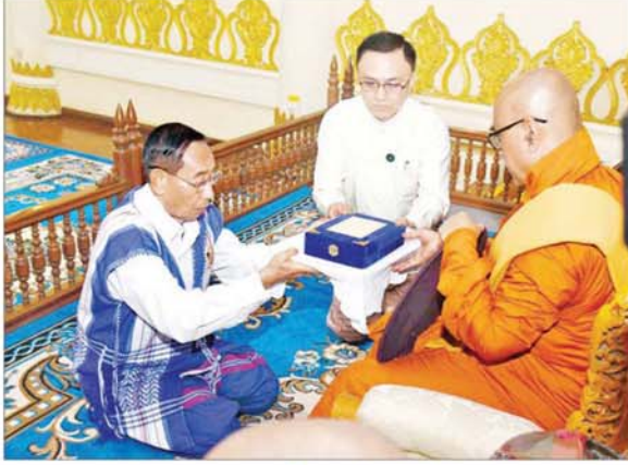
နိုင်ငံတော်စီမံအုပ်ချုပ်ရေးကောင်စီအဖွဲ့ဝင် မန်းငြိမ်းမောင် ဆရာတော်ထံ နိုင်ငံတော်အဆင့် အဆောင်အယောင်မော်တော်ယာဉ် ဆက်ကပ်အပ်နှံစဉ်။