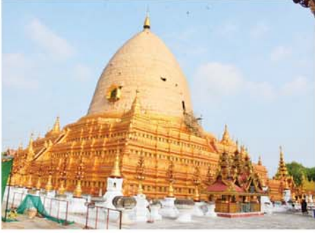
ဒါန်းနိုင်ကြသည့်အပြင် ညောင်ဦး (၉၈၄)၊ ဘဏ္ဍာတော်ထိန်းဂေါပက အဖွဲ့ရုံး(၀၉၂၀၄၃၅၄၈)တို့နှင့် ဆက်သွယ်၍လည်း လှူဒါန်းနိုင်ကြောင်းသိရသည်။ (အပေါ်ပုံ)

နေရာများအားလုံးတို့ကို မျက်ပါးရွှေဆိုင်(၂၆၀၀၀)ဖြင့် ရွှေသင်္ကန်းဆက်ကပ်လှူဒါန်းရန် စီစဉ်ထားရှိသည်။ သို့ဖြစ်ပါ၍ လှူဒါန်းလိုသူများအနေဖြင့် ရွှေပြားတစ်ချပ်လျှင် ငွေကျပ် ၁၂ သိန်းနှုန်း၊ ၂ လက်မပတ်လည်မျက်ပါးရွှေဆိုင်တစ်ဆိုင်လျှင် ငွေကျပ် ၁၅၀၀၀ နှုန်း၊ မျက်ပါးရွှေဆိုင်တစ်ကိုးငွေကျပ် ၇၅၀၀၀ နှုန်း၊ မျက်ပါးရွှေဆိုင် ၁၀ ရွက်ကို ငွေကျပ် ၁၅၀၀၀ နှုန်းတို့ဖြင့် လှူ