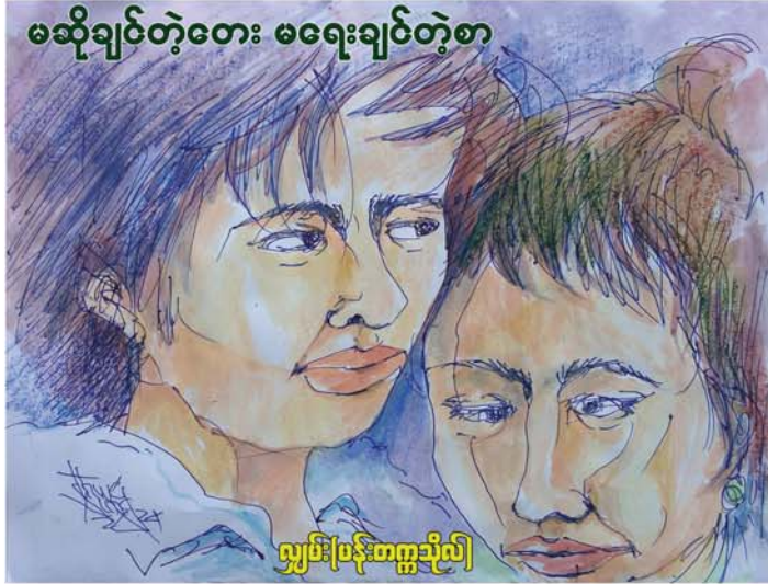
ကျွမ်းမြန်းစက္ကသိလိ