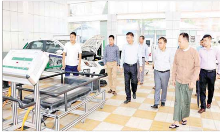
ဆက်လက်၍ ပြည်ထောင်စုဝန်ကြီးနှင့် အဖွဲ့ ကာပတ်ဝန်ကျောင်းသန့်ရှင်းသာယာလှပရေး၊ စိမ်းလန်း သည် အစိုးရစက်မှုလက်မှုသိပ္ပံ(အင်းစိန်)သို့ ရောက်ရှိ စိုပြည်ရေးနှင့် ကျောင်းဥပဒိရပ်ကောင်းမွန်ရေး

ဆောင်ရွက်ထားရှိမှုများကို ကြည့်ရှုစစ်ဆေးပြီး ပြည်ထောင်စုဝန်ကြီးက နည်းပညာပြန့်ပွားရေးနှင့် အရည်အသွေးပြည့်စုံသော ကျွမ်းကျင်ပညာရှင်များကို စဉ်ဆက်မပြတ်မွေးထုတ်ပေးရန်၊ စာတွေ့သမာဏ လက်တွေ့လုပ်ငန်းခွင် အသုံးချနိုင်သည့် သင်ကြား သင်ယူမှုများကို ဆောင်ရွက်ရန်၊ စက်မှုလုပ်ငန်းဆိုင်ရာ လိုအပ်ချက်များကို အကောင်အထိုးအပြည့်အဝ ဖြည့်ဆည်းပေးရန်နှင့် ကျောင်းသားများ၏ အလုပ် အကိုင် အခွင့်အလမ်းများကိုမြှင့်တင်ရန်၊ စက်မှု လုပ်ငန်းရှင်များနှင့် စက်ရုံများအကြား ပူးပေါင်း လုပ်ဆောင်မှုတိုးမြှင့်ရန်မှာကြား၍ တောလုံးကွင်းနှင့် အိမ်ဆောင်များကို လှည့်လည်ကြည့်ရှုစစ်ဆေးသည်။ မွန်းလွှဲပိုင်းတွင် ပြည်ထောင်စုဝန်ကြီးနှင့် အဖွဲ့ သည် သတင်းအချက်အလက်နည်းပညာတက္ကသိုလ်၌ ပင်မခြောက်ထပ်ဆောင် တည်ဆောက်နေမှုနှင့် ပြီးစီး မှုအခြေအနေများကို ကြည့်ရှုစစ်ဆေးပြီး အရည်အသွေး ပြည့်စုံစွာနှင့် အချိန်မီ ပြီးစီးနိုင်ရေးတို့ကို မှာကြားခဲ့ ကြောင်း သိရသည်။ သတင်းစဉ်