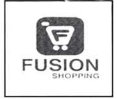
အမှတ်(၁၃၀၄/၂၀၂၄)

ကျွန်ုပ်တို့၏မိတ်ဆွေ KABAANGMYAY Co.,Ltd., သည် ပူးတွဲဖော်ပြပါ FUSION MART, MYANMAR FUSION, FUSION, FUSION MYANMAR ,FUSION SHOPPING အမှတ်တံဆိပ်အားလုံးတို့ကို တစ်ဦးတည်း မှပိုင်အမှတ်တံဆိပ်အဖြစ် မန္တလေးမြို့စာချုပ်စာတမ်း မှတ်ပုံတင်ဌာနမှူးရုံးတွင် မှတ်ပုံတင်စာချုပ်အမှတ်(၁၃၀၈/၂၀၂၄)၊ (၁၃၀၇/၂၀၂၄)၊ (၁၃၀၆/၂၀၂၄)၊ (၁၃၀၅/၂၀၂၄)၊ (၁၃၀၄/၂၀၂၄)အရ တရားဝင် မှတ်ပုံတင်သွင်းထားရှိခဲ့ပြီး FUSION MART, MYANMAR FUSION, FUSION, FUSION MYANMAR, FUSION SHOPPING အမည်များဖြင့် ပြည်တွင်း၊ ပြည်ပမှ လူသုံးကုန်ပစ္စည်းအမျိုးမျိုး၊ စားသောက်ကုန်ပစ္စည်းအမျိုးမျိုး၊ လျှပ်စစ်ပစ္စည်းအမျိုးမျိုးနှင့် ဆက်စပ်ပစ္စည်းများ၊ အလှကုန်ပစ္စည်းအမျိုးမျိုး၊ အိမ်သုံးပစ္စည်းအမျိုးမျိုး၊ သန့်ရှင်းရေးသုံးပစ္စည်းအမျိုးမျိုး၊ စာရေးကိရိယာအမျိုးမျိုး၊ အဝတ်အစားနှင့် အသုံးအဆောင်အမျိုးမျိုး၊ အိတ်အမျိုးမျိုး၊ ကျန်းမာရေးသုံးပစ္စည်းအမျိုးမျိုးတို့အား E-Commerce Platform စနစ်ဖြင့်ဖြစ်စေ၊ ဆိုင်များဖွင့်လှစ်၍ဖြစ်စေ ကုန်ပစ္စည်းအမှတ်တံဆိပ်အဖြစ် ကပ်နှိပ်/ရိုက်နှိပ်၍ဖြစ်စေ၊ လက်လီ/လက်ကားဖြန့်ဖြူးရောင်းချလျက်ရှိပါသည်။