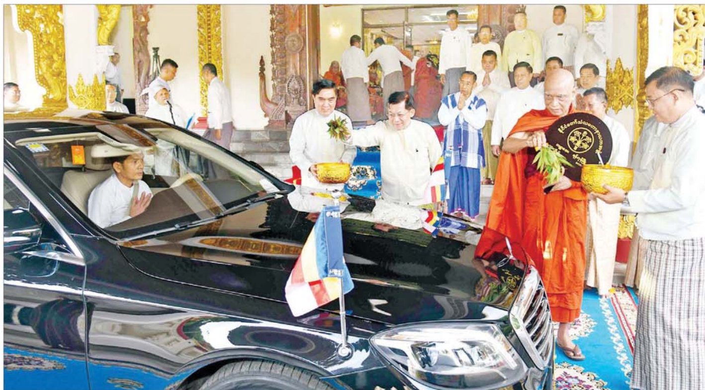
နိုင်ငံတော်သံသမဟာနာယကအဖွဲ့ဥက္ကဋ္ဌ သန့်လျင်မင်းကျောင်းဆရာတော်ကြီး ခေါက်တာဘဒ္ဒန္တ စန္ဒိမာတိဝံသနှင့် နိုင်ငံတော်စီမံအုပ်ချုပ်ရေးကောင်စီဥက္ကဋ္ဌ နိုင်ငံတော်ဝန်ကြီးချုပ် ဗိုလ်ချုပ်မှူးကြီးမင်းအောင်လှိုင်တို့က ဆရာတော်ကြီးထံ ဆက်ကပ်အပ်နှံထားရှိသည့် နိုင်ငံတော်အဆင့် အဆောင်အယောင်မော်တော်ယာဉ်များ ပရိတ်နံ့သာရည်များပက်ဖျန်း၍ သဒ္ဓါမင်္ဂလာ ဆင်ယင်ကြစဉ်။