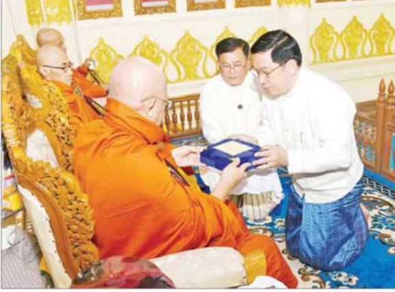
နိုင်ငံတော်စီမံအုပ်ချုပ်ရေးကောင်စီအဖွဲ့ဝင် ဒုတိယဗိုလ်ချုပ်ကြီး ညိုစော ဆရာတော်ထံ နိုင်ငံတော်အဆင့် အဆောင်အယောင်မော်တော်ယာဉ် ဆက်ကပ်အပ်နှံစဉ်။

တည်ထားပူဇော်နိုင်ခဲ့ နိုင်ငံတော် စီမံအုပ်ချုပ်ရေးကောင်စီသည် ပြည်ထောင်စုနယ်မြေ နေပြည်တော် ဒက္ခိဏသီရိမြို့နယ် ဗုဒ္ဓဗျာဉ်တော်ကြီးတွင် ပလ္လင်တော်အမြင့် ၁၈ ပေ၊ ဉာဏ်တော်အမြင့် ၆၃ ပေ စုစုပေါင်း ဉာဏ်တော် ၈၁ ပေ အမြင့်ဆောင်သည့်အတွက် ကမ္ဘာပေါ်ရှိ စကျင်ဗုဒ္ဓရုပ်ပွားတော်များအနက် ကမ္ဘာ့အကြီးဆုံး ဉာဏ်တော်အမြင့်ဆုံး ဖြစ်သည့် မာရဂိဇယဗုဒ္ဓရုပ်ပွားတော်မြတ်ကြီးကို မြန်မာနိုင်ငံတွင် ထေရဝါဒဗုဒ္ဓသာသနာတော်ကြီး နိုင်ငံမာစွာ ထွန်းလင်းတောက်ပလျက်ရှိမှုအား ကမ္ဘာကိုပြသရန်၊ မြန်မာနိုင်ငံသည် ထေရဝါဒဗုဒ္ဓသာသနာတော်ကြီး ဖြစ်စေရန် နိုင်ငံတော်ကြီး သာယာဝပြောမှုရှိစေရန်နှင့် ကမ္ဘာကြီး ငြိမ်းချမ်းသာယာမှု ဖြစ်စေရန် ဟူသော ကောင်းကျိုးမြတ်နိုးရည်သန်ဆန္ဒမှန်ဖြင့် စေတနာရှင်အများပြည်သူတို့ စုပေါင်းလှူဒါန်း၍ အောင်မြင်စွာ တည်ထားပူဇော်နိုင်ခဲ့ပါကြောင်း။