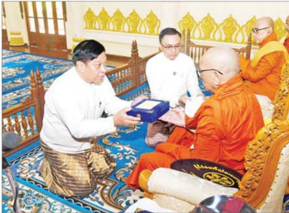
နိုင်ငံတော်စီမံအုပ်ချုပ်ရေးကောင်စီအဖွဲ့ဝင် ဒုတိယဝန်ကြီးချုပ်နှင့် ပြည်ထောင်စုဝန်ကြီး ဗိုလ်ချုပ်ကြီး တင်အောင်စန်း ဆရာတော်ထံ နိုင်ငံတော်အဆင့် အဆောင်အယောင်မော်တော်ယာဉ် ဆက်ကပ်အပ်နှံစဉ်။

တည်ထားပူဇော်နိုင်ခဲ့ နိုင်ငံတော် စီမံအုပ်ချုပ်ရေးကောင်စီသည် ပြည်ထောင်စုနယ်မြေ နေပြည်တော် ဒက္ခိဏသီရိမြို့နယ် ဗုဒ္ဓဗျာဉ်တော်ကြီးတွင် ပလ္လင်တော်အမြင့် ၁၈ ပေ၊ ဉာဏ်တော်အမြင့် ၆၃ ပေ စုစုပေါင်း ဉာဏ်တော် ၈၁ ပေ အမြင့်ဆောင်သည့်အတွက် ကမ္ဘာပေါ်ရှိ စကျင်ဗုဒ္ဓရုပ်ပွားတော်များအနက် ကမ္ဘာ့အကြီးဆုံး ဉာဏ်တော်အမြင့်ဆုံး ဖြစ်သည့် မာရဂိဇယဗုဒ္ဓရုပ်ပွားတော်မြတ်ကြီးကို မြန်မာနိုင်ငံတွင် ထေရဝါဒဗုဒ္ဓသာသနာတော်ကြီး နိုင်ငံမာစွာ ထွန်းလင်းတောက်ပလျက်ရှိမှုအား ကမ္ဘာကိုပြသရန်၊ မြန်မာနိုင်ငံသည် ထေရဝါဒဗုဒ္ဓသာသနာတော်ကြီး ဖြစ်စေရန် နိုင်ငံတော်ကြီး သာယာဝပြောမှုရှိစေရန်နှင့် ကမ္ဘာကြီး ငြိမ်းချမ်းသာယာမှု ဖြစ်စေရန် ဟူသော ကောင်းကျိုးမြတ်နိုးရည်သန်ဆန္ဒမှန်ဖြင့် စေတနာရှင်အများပြည်သူတို့ စုပေါင်းလှူဒါန်း၍ အောင်မြင်စွာ တည်ထားပူဇော်နိုင်ခဲ့ပါကြောင်း။