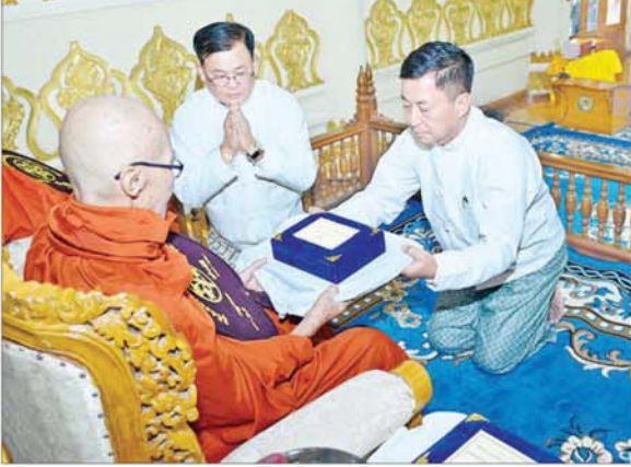
နိုင်ငံတော်စီမံအုပ်ချုပ်ရေးကောင်စီအဖွဲ့ဝင် ခွန်စုံလွင် ဆရာတော်ထံ နိုင်ငံတော်အဆင့် အဆောင်အယောင်မော်တော်ယာဉ် ဆက်ကပ်အပ်နှံစဉ်။