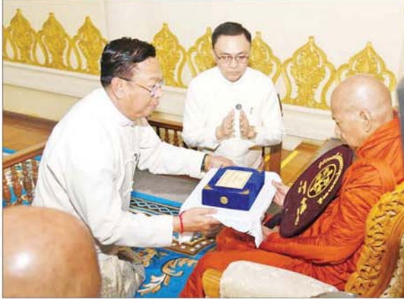
အမျိုးသားလုံခြုံရေးဆိုင်ရာ အကြမ်းပုဂ္ဂိုလ် ပြည်ထောင်စုဝန်ကြီး ဗိုလ်ချုပ်ကြီး မိုးအောင် ဆရာတော်ထံ နိုင်ငံတော်အဆင့် အဆောင်အယောင်မော်တော်ယာဉ် ဆက်ကပ်အပ်နှံစဉ်။

ကြီးအား ပစ္စည်းလေးပါးတို့ဖြင့် ထူးခြားစွာ အားပေးချီးမြှောက်ထောက်ပံ့လှူဒါန်းလျက်ရှိကြသည့် ပြည်တွင်း/ပြည်ပမှ လူပုဂ္ဂိုလ်များအား သာသနာတော်ဆိုင်ရာ ဘွဲ့တံဆိပ်တော်များကို နှစ်စဉ် မပျက် ဆက်ကပ်အပ်နှံခြင်းဖြင့် မြင်းဖြင့် ဗုဒ္ဓမြတ်စွာသာသနာတော်မြတ်ကြီးကို အားပေးထောက်ပံ့လျက်ရှိပါကြောင်း။ ထို့ပြင် နိုင်ငံတော်စီမံအုပ်ချုပ်ရေးကောင်စီအနေဖြင့် နိုင်ငံတော် သံဃမဟာနာယက ဆရာတော်ကြီးများ၏ သြဝါဒတော်များနှင့် အညီ ဗုဒ္ဓသာသနာတော်မြတ်ကြီး ထွန်းလင်းစေစဉ်အောင် စဉ်ဆက်မပြတ် ထောက်ပံ့ပူဇော်နိုင်ရန် အားစိုက်ကြိုးပမ်း ဆောင်ရွက်လျက်ရှိရာ ထူးခြားမွန်မြတ်သော ဓမ္မပုဇာတိသို့လ်တော်အဖြစ် ဆဋ္ဌသင်္ဂါယနာမူ ပိဋကတ်သုံးပိဋတော်(မြန်မာ၊ ရှိမန်)အက္ခရာနှစ်မျိုးဖြင့် (မြူရုထားသော ကျမ်းစာအုပ်များကို ပြည်တွင်း/ပြည်ပရှိ သာသနာ့တက္ကသိုလ်ကြီးများနှင့် ဘုန်းတော်ကြီးကျောင်းများသို့ လှူဒါန်းလျက်ရှိပါကြောင်း။