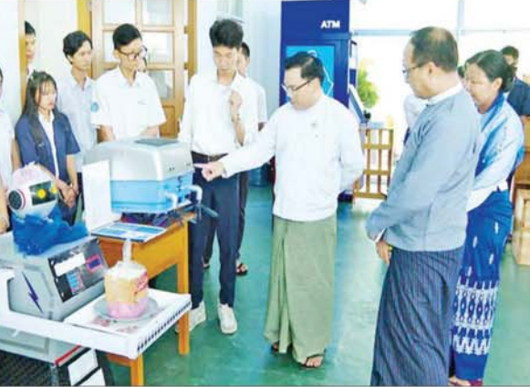
လျှပ်စစ်ဗုံးချွတ် အုပ်စုအပေါ်အင် ခေတ်စီဆန်းသစ်သော အိမ်သုံး ပရိဘောဂပစ္စည်းများ၊ EV ပြိုင်ကားများနှင့် နေပြည်တော် ဂျီတီအိုင်ကျောင်း လျှပ်စစ် သွယ်တန်းဖြန့်ဖြူးစနစ် ပုံစံငယ် တို့ကို ကြည့်ရှုအားပေးပြီး လိုအပ်သည်များကို ဖွဲ့စည်းသွားရန် နှင့် သုတေသနရလဒ်များကို စွန့်ဦးတီထွင် လုပ်ငန်းရှင်များနှင့် ပြည်သူများ လက်ဝယ် အရောက် ပြန့်ဝေပေးနိုင်ရေး ဆောင်ရွက်သွားရန်၊ ယခု ပရောဂျက်များ အောင်မြင်ရေး အဖွဲ့လိုက် ပူးပေါင်းဆောင်ရွက် သည့် အလေ့အကျင့်ကောင်းများ ကို လုပ်ငန်းခွင်နှင့် ဘဝ တစ်လျှောက်ထိန်းသိမ်းပြီး ဗလ

နေပြည်တော် ဇွန် ၉ သိပ္ပံနှင့်နည်းပညာဝန်ကြီးဌာန ဒုတိယဝန်ကြီး ဒေါက်တာ အောင်ဇေယျသည် ဇွန် ၇ ရက်မွန်းလွဲ ပိုင်းက အစိုးရစက်မှုလက်မှုသိပ္ပံ (နေပြည်တော်)၌ ပထမနှစ် အင်ဂျင်နီယာ သင်တန်းသားများ နှင့် ရင်းရင်းနှီးနှီး တွေ့ဆုံ၍ အားပေးစကား ပြောကြားသည်။ ဆက်လက်၍ ဒုတိယဝန်ကြီး သည် တတိယနှစ်အင်ဂျင်နီယာ သင်တန်းများရှိ မေဂျာစုံ ကျောင်းသားများဖြင့် စုဖွဲ့ ထားသော သုတေသနအဖွဲ့များက သုတေသန ပရောဂျက်များဖြစ် သည့် ဘုရားစေတီတော်ရိုင်ပြင် တော်ဝေါ်သန့်ရှင်းရေးလုပ်ငန်းသုံး စက်ရုပ်၊ စားသောက်ဆိုင်သုံး စားပွဲထိုးစက်ရုပ်၊ စီးသူကိုင်ယာဉ် ထိန်းချုပ် မောင်းနှင်နိုင်သည့်