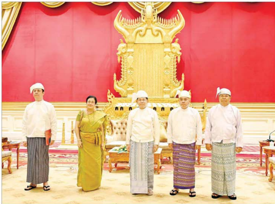
နိုင်ငံတော်စီမံအုပ်ချုပ်ရေးကောင်စီဥက္ကဋ္ဌ နိုင်ငံတော်ဝန်ကြီးချုပ် ဗိုလ်ချုပ်မှူးကြီးမင်းအောင်လှိုင် မြန်မာနိုင်ငံဆိုင်ရာ သီရိလင်္ကာနိုင်ငံသံအမတ်ကြီး H.E. Mrs. Ponnampereuma Arachige Prabashini Ponnampereuma အား လက်ခံတွေ့ဆုံစဉ်။

၎င်းရှေ့မှ ပူးပေါင်းဆောင်ရွက်ရေးဆိုင်ရာကိစ္စရပ်များနှင့် ကာကွယ်ရေးဆိုင်ရာကိစ္စရပ်များတွင် ပူးပေါင်းဆောင်ရွက်မှုများ တိုးမြှင့်ဆောင်ရွက်ရေးဆိုင်ရာကိစ္စရပ်များနှင့်စပ်လျဉ်းပြီး ရင်းရင်းနှီးနှီးဆွေးနွေးခဲ့ကြသည်။ တွေ့ဆုံပွဲအပြီးတွင် နိုင်ငံတော်စီမံအုပ်ချုပ်ရေးကောင်စီဥက္ကဋ္ဌ နိုင်ငံတော်ဝန်ကြီးချုပ်နှင့် မြန်မာနိုင်ငံဆိုင်ရာ သီရိလင်္ကာနိုင်ငံသံအမတ်ကြီးတို့သည် စုပေါင်းမှတ်တမ်းတင်ဓာတ်ပုံရိုက်ကြသည်။ အဆိုပါသံအမတ်ခန့်အပ်လွှာပေးအပ်ပွဲသို့ ကောင်စီတွဲဖက်အတွင်းရေးမှူး ဒုတိယဗိုလ်ချုပ်ကြီး ရဲဝင်းဦး၊ ဒုတိယဝန်ကြီးချုပ်နှင့် နိုင်ငံခြားရေးဝန်ကြီးဌာန ပြည်ထောင်စုဝန်ကြီး ဦးသန်းဆွေနှင့် နိုင်ငံခြားရေးဝန်ကြီးဌာန သံတမန်ရေးရာဦးစီးဌာန ညွှန်ကြားရေးမှူးချုပ် ဦးဝဏ္ဏလှန်တို့ တက်ရောက်ခဲ့ကြကြောင်း သိရသည်။