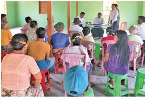
ရေနုတ်မြောင်းသည် အမှိုက်စွန့်ပစ်ရန် နေရာမဟုတ်ပါ။