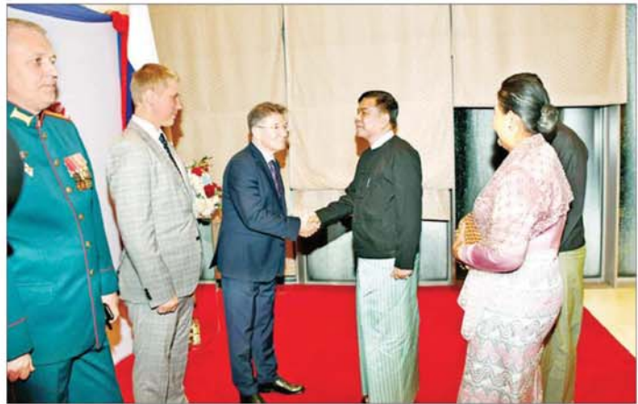
နိုင်ငံတော်စီမံအုပ်ချုပ်ရေးကောင်စီအဖွဲ့ဝင် ညိုနှိုင်းကွပ်ကဲရေးမှူး(ကြည်း၊ ရေ လေ) ဗိုလ်ချုပ်ကြီး မောင်မောင်အေးအား မြန်မာနိုင်ငံဆိုင်ရာ ရုရှားဖက်ဒရေးရှင်းနိုင်ငံ သံအမတ်ကြီး H.E. Mr. Iskander Azizov နှင့် တာဝန်ရှိသူများက ရင်းရင်းနှီးနှီးကြိုဆိုနှုတ်ဆက်ခဲ့ကြသည်။