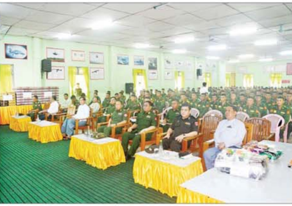
နိုင်ငံတော်စီမံအုပ်ချုပ်ရေးကောင်စီအဖွဲ့ဝင် ဒုတိယဝန်ကြီးချုပ်နှင့် ကာကွယ်ရေးဝန်ကြီးဌာန ပြည်ထောင်စုဝန်ကြီး ပြည်သူ့စစ်မှုထမ်းဆောင်ရေးဗဟိုအဖွဲ့ဥက္ကဋ္ဌ ဗိုလ်ချုပ်ကြီးတင်အောင်စန်း ပြည်သူ့စစ်မှုထမ်းသင်တန်းသားများအား တွေ့ဆုံအမှာစကားပြောကြားစဉ်။

တက်ရောက် တွေ့ဆုံပွဲများသို့ ရန်ကုန်တိုင်းဒေသကြီး ဝန်ကြီးချုပ် ဦးစိုးသိန်း၊ ရန်ကုန်တိုင်း စစ်ဌာနချုပ် ဒုတိယတိုင်းမှူး၊ တိုင်းဒေသကြီးအစိုးရအဖွဲ့ဝင် ဝန်ကြီးများ၊ တပ်မတော်အရာရှိကြီးများနှင့် ဌာနဆိုင်ရာတာဝန်ရှိသူများ တက်ရောက်ကြသည်။ တွေ့ဆုံပွဲများတွင် နိုင်ငံတော်စီမံအုပ်ချုပ်ရေး ကောင်စီအဖွဲ့ဝင် ဒုတိယဝန်ကြီးချုပ်နှင့် ပြည်ထောင်စုဝန်ကြီး ပြည်သူ့စစ်မှုထမ်းဆောင်ရေးဗဟိုအဖွဲ့ဥက္ကဋ္ဌ ဗိုလ်ချုပ်ကြီး တင်အောင်စန်းအား သက်ဆိုင်ရာ ကျောင်းအုပ်ကြီးများက ကျောင်းရုံး အစည်းအဝေးခန်းမများ၌ ပြည်သူ့စစ်မှုထမ်းသင်တန်းများ ဖွင့်လှစ်နေမှုနှင့်ပတ်သက်၍ ဆောင်ရွက်ထားရှိမှုအခြေအနေများကို ရှင်းလင်းပြောကြားကြပြီး ပြည်ထောင်စုဝန်ကြီးက လိုအပ်သည်များကို ပေါင်းစပ်ညှိနှိုင်းဆောင်ရွက်ပေးသည်။ ထို့နောက် ပြည်ထောင်စုဝန်ကြီးက ပြည်သူ့စစ်မှုထမ်းသင်တန်းခန်းမ