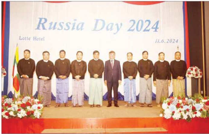
နိုင်ငံတော်စီမံအုပ်ချုပ်ရေးကောင်စီအဖွဲ့ဝင် ညိုနှိုင်းကွပ်ကဲရေးမှူး(ကြည်း၊ ရေ လေ) ဗိုလ်ချုပ်ကြီး မောင်မောင်အေး၊ မြန်မာနိုင်ငံဆိုင်ရာ ရုရှားဖက်ဒရေးရှင်းနိုင်ငံ သံအမတ်ကြီး H.E. Mr. Iskander Azizov နှင့် တာဝန်ရှိသူများ စုပေါင်းမှတ်တမ်းတင်ဓာတ်ပုံ ရိုက်ကူးခဲ့ကြသည်။