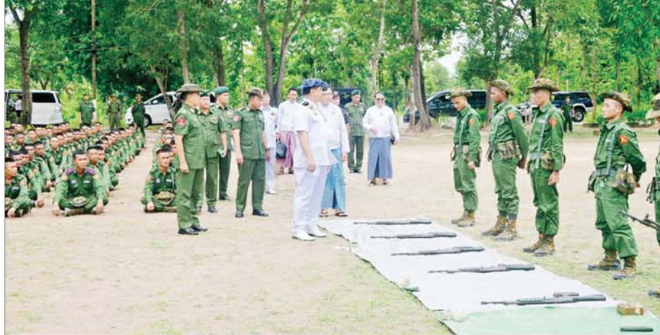
နိုင်ငံတော်စီမံအုပ်ချုပ်ရေးကောင်စီအဖွဲ့ဝင် ဒုတိယဝန်ကြီးချုပ်နှင့် ကာကွယ်ရေးဝန်ကြီးဌာန ပြည်ထောင်စုဝန်ကြီး ပြည်သူ့စစ်မှုထမ်းဆောင်ရေးဗဟိုအဖွဲ့ဥက္ကဋ္ဌ ဗိုလ်ချုပ်ကြီးတင်အောင်စန်း ပြည်သူ့စစ်မှုထမ်းသင်တန်းသားများအား လက်နက်ငယ်သင်ခန်းစာပို့ချနေမှုကို ကြည့်ရှုစစ်ဆေးစဉ်။

ထို့နောက် ပြည်ထောင်စုဝန်ကြီးနှင့် တာဝန်ရှိသူများသည် လေ့ကျင့်ရေးကွင်း အသီးသီး၌ လက်နက်ငယ် သင်ခန်းစာနှင့် ခန်းမအတွင်း စစ်နည်းဗျူဟာ သင်တန်းပို့ချနေမှုများ၊ သင်တန်းသားများ အိပ်ခန်းများ၊ သင်တန်းသားစားရိပ်သာနှင့် စားဖိုဆောင်များကို လှည့်လည်ကြည့်ရှုစစ်ဆေးပြီး လိုအပ်သည်များ မှာကြားသည်။ အောင်မြင်စွာ ဖွင့်လှစ်နိုင်ခဲ့ နိုင်ငံသား တိုင်းသည် ပြည်ထောင်စု မပြိုကွဲရေး၊ တိုင်းရင်းသားစည်းလုံးညီညွတ်မှု မပြိုကွဲရေးနှင့် အချုပ်အခြာအာဏာ တည်တံ့ခိုင်မြဲရေး ဟူသည့် ဒီတော့အရေးသုံးပါးကို ထိန်းသိမ်း စောင့်ရှောက်ရန် တာဝန်ရှိကြသဖြင့် ယင်းတာဝန်များကို ထမ်းဆောင်ရန်အတွက် စစ်ပညာသင်ကြားရန်နှင့် နိုင်ငံတော် ကာကွယ်ရေးအတွက် စစ်မှုထမ်းဆောင်နိုင်ရန် ရည်ရွယ်၍ ပြည်သူ့စစ်မှုထမ်းဥပဒေကို ၂၀၁၀ ပြည့်နှစ် နိုဝင်ဘာလတွင် ဥပဒေအမှတ် (၂၇/၂၀၁၀)ဖြင့် ပြဋ္ဌာန်းခဲ့ပြီး ၂၀၂၄ ခုနှစ် ဖေဖော်ဝါရီ ၁၀ ရက်တွင် စတင်အာဏာသက်ဝင်စေခဲ့ကာ ပြည်သူ့စစ်မှုထမ်းသင်တန်း အပတ်စဉ် (၁) နှင့် (၂) တို့ကို တိုင်းဒေသကြီးနှင့် ပြည်နယ်အသီးသီး တို့တွင် အောင်မြင်စွာ ဖွင့်လှစ်နိုင်ခဲ့ပြီးဖြစ်ကြောင်း သိရသည်။