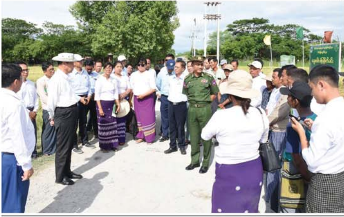
သတင်း-စာမျက်နှာ ၇