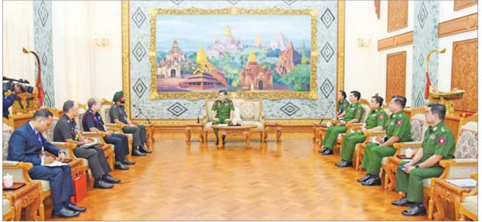
အတူ ကာကွယ်ရေးဦးစီးချုပ်ရုံး(ကြည်း)မှ ဒုတိယဗိုလ်ချုပ်ကြီး ကိုကိုဦးနှင့် တပ်မတော်အရာရှိကြီးများ တက်ရောက်ကြပြီး အိန္ဒိယတပ်မတော်မှ တွဲဖက်ထောက်လှမ်းရေးညွှန်ကြားရေးမှူးချုပ်နှင့်အတူ မြန်မာနိုင်ငံ ဆိုင်ရာ အိန္ဒိယစစ်သံမှူး Colonel Jaswinder Singh Gill နှင့် အိန္ဒိယတပ်မတော်မှအရာရှိကြီးများ တက်ရောက်ခဲ့ကြကြောင်း သိရသည်။ သတင်းစဉ်

တွေ့ဆုံပွဲအပြီးတွင် ညှိနှိုင်းကွပ်ကဲရေးမှူး(ကြည်း၊ ရေ၊ လေ)နှင့် အိန္ဒိယတပ်မတော်မှ တွဲဖက်ထောက်လှမ်းရေးညွှန်ကြားရေးမှူးချုပ် တို့သည် အမှတ်တရလက်ဆောင်များ အပြန်အလှန်ပေးအပ်ကြပြီး တက်ရောက်လာကြသူများနှင့်အတူ မှတ်တမ်းတင်ဓာတ်ပုံရိုက်ကြသည်။ အဆိုပါတွေ့ဆုံပွဲသို့ ညှိနှိုင်းကွပ်ကဲရေးမှူး(ကြည်း၊ ရေ၊ လေ)နှင့်