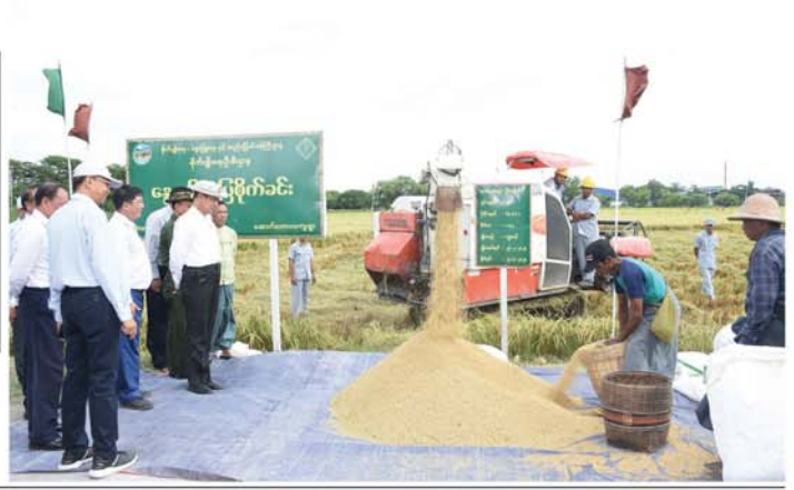
သတင်း-စာမျက်နှာ ၆