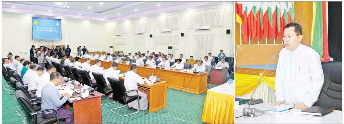
နိုင်ငံတော်စီမံအုပ်ချုပ်ရေးကောင်စီ ဒုတိယဥက္ကဋ္ဌ ဒုတိယဝန်ကြီးချုပ် ဒုတိယဗိုလ်ချုပ်မှူးကြီးစိုးဝင်း မြန်မာနိုင်ငံလုံးဆိုင်ရာပညာရေးညီလာခံ(၂၀၂၄) ကျင်းပရေး ဦးစီးကော်မတီ ညှိနှိုင်းအစည်းအဝေးတွင် အမှာစကားပြောကြားစဉ်။