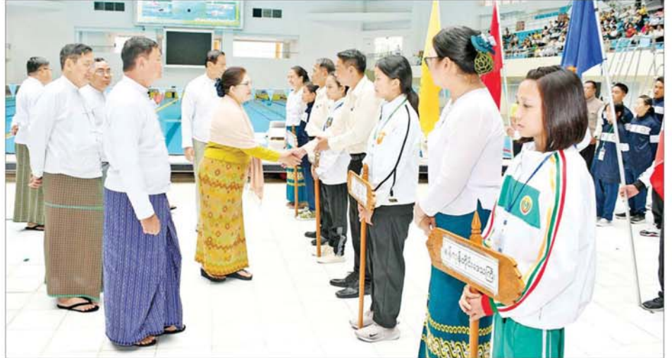
နိုင်ငံတော်စီမံအုပ်ချုပ်ရေးကောင်စီအဖွဲ့ဝင်များနှင့် တာဝန်ရှိသူများက ပြိုင်ပွဲဝင်အားကစားသမားများကို ရင်းရင်းနှီးနှီး နှုတ်ဆက်စဉ်။

ဂုဏ်ဆောင် အားကစားသမားကောင်းများဖြစ်လာစေရန် ကြိုးစားသွားကြစေလိုကြောင်း တိုက်တွန်းပြောကြားပြီး ၂၀၂၄ ခုနှစ်ပြည်နယ်နှင့် တိုင်းဒေသကြီး ရေကူးပြိုင်ပွဲကို ဖွင့်လှစ်ပေးသည်။ ထို့နောက် ပြိုင်ပွဲဝင်အားကစား