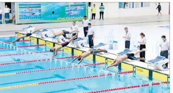
နိုင်ငံတော်စီမံအုပ်ချုပ်ရေးကောင်စီအဖွဲ့ဝင်များ ၂၀၂၄ ခုနှစ် ပြည်နယ်နှင့် တိုင်းဒေသကြီး ရေကူးပြိုင်ပွဲ ဖွင့်ပွဲအခမ်းအနားသို့ တက်ရောက်ကြည့်ရှုအားပေးစဉ်။

တက်ရောက် အခမ်းအနားသို့ နိုင်ငံတော်စီမံအုပ်ချုပ်ရေးကောင်စီအဖွဲ့ဝင်များ ဖြစ်ကြသည့် ဒေါ်ဒွါဒွာ၊ ပိုးရယ်အောင်သိန်း၊ ဒေါက်တာမာထုန်၊ ဒေါက်တာဘရွှေ၊ ခွန်စံလှိုင်၊ ဦးရွှေကြီးနှင့် ဦးရန်ကျော်၊ ပြည်ထောင်စုဝန်ကြီးများ၊ ဒုတိယဝန်ကြီးများ၊ ဌာနဆိုင်ရာတာဝန်ရှိသူများ၊ မြန်မာနိုင်ငံရေကူးအဖွဲ့ချုပ်