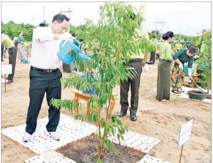
ခန့်ခွဲရေး မြေယာပြန်လည်ဖြူပြင်ပေး"ဟူ၍ ဖြစ်ပါကြောင်း၊ ကမ္ဘာကြီးစိမ်းလန်းစိုပြည်စေရန် လူသားအားလုံး ပူးပေါင်းပါဝင်ဆောင်ရွက်ရမည်ဖြစ်ကြောင်း၊ သစ်ပင်များစိုက်ပျိုးရာတွင် အချိန်၊ ငွေ၊ လုပ်အား၊ အရင်းအနှီးများစွာ စိုက်ထုတ်ဆောင်ရွက်ရသည့်အတွက် တစ်ပင်စိုက် တစ်ပင်ရှင်၊ စိုက်သမျှအပင်ရှင်သန်စေရန်အတွက် စတင်စိုက်ပျိုးသည့်မှစ၍ စဉ်ဆက်မပြတ် ပြုစုထိန်းသိမ်းသွားရန်လိုကြောင်း ပြောကြားသည်။ ထို့နောက် ပြည်ထောင်စုဝန်ကြီးနှင့် ဇနီးတို့က သတင်းစဉ်

၂၀၂၄ ခုနှစ် ပြည်ထဲရေးဝန်ကြီးဌာန မိုးရာသီသစ်ပင်စိုက်ပျိုးပွဲအခမ်းအနားကို ယနေ့တွင် နေပြည်တော် ဧမ္မာသီရိမြို့နယ် မြို့ပတ်လမ်းဘေးရှိ အထွေထွေအုပ်ချုပ်ရေးဦးစီးဌာန အုပ်ချုပ်ရေးပညာ ဖွံ့ဖြိုးမှု သင်တန်းကျောင်းမြေနေရာ၌ ကျင်းပရာ နိုင်ငံတော်စီမံအုပ်ချုပ်ရေးကောင်စီအဖွဲ့ဝင် ပြည်ထဲရေးဝန်ကြီးဌာန ပြည်ထောင်စုဝန်ကြီး ဒုတိယဗိုလ်ချုပ်ကြီးရာပြည့်၊ ပြည်ထဲရေးဝန်ကြီးဌာန ပြည်ထောင်စုဝန်ကြီးရုံးနှင့် ကွပ်ကဲမှုအောက်ရှိ တပ်ဖွဲ့နှင့် ဦးစီးဌာနများမှ အရာရှိကြီးများနှင့်ဇနီးများ၊ တပ်ဖွဲ့ဝင်များနှင့် ဝန်ထမ်းများ တက်ရောက်ကြသည်။