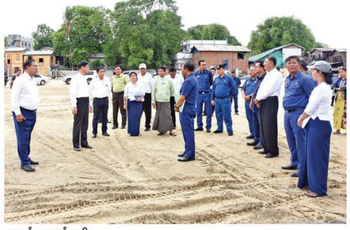
သတင်း-စာမျက်နှာ ၆