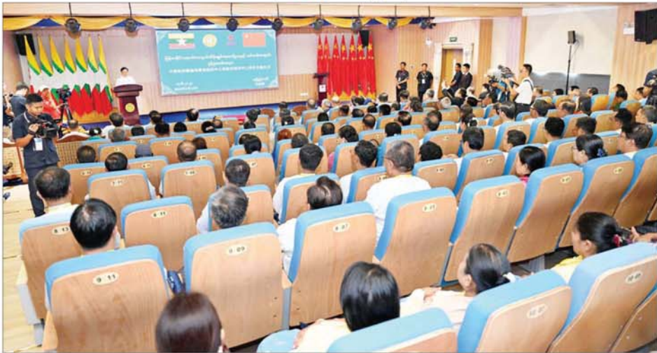
နိုင်ငံတော်စီမံအုပ်ချုပ်ရေးကောင်စီဥက္ကဋ္ဌ နိုင်ငံတော်ဝန်ကြီးချုပ်ကိုယ်စား နိုင်ငံတော်စီမံအုပ်ချုပ်ရေးကောင်စီ အတွင်းရေးမှူး ဒုတိယဗိုလ်ချုပ်ကြီး အောင်လင်းဒွေး မြန်မာနိုင်ငံ ရောဂါကာကွယ်ထိန်းချုပ်ရေးဗဟိုဌာနနှင့် သင်တန်းကျောင်းဖွင့်ပွဲ အခမ်းအနားတွင် အမှာစကားပြောကြားစဉ်။

ရောဂါထိန်းချုပ်ရေး ဗဟိုဌာနများ ဖွင့်လှစ်တည်ထောင်ကြပြီး ရောဂါ နှိမ်နင်းရေး လုပ်ငန်းများကို ထိထိရောက်ရောက် ဆောင်ရွက် လာကြကြောင်း၊ မိမိတို့ မြန်မာ နိုင်ငံတွင် နိုင်ငံတကာအဆင့်မီ ရောဂါ ကာကွယ်ထိန်းချုပ် ရေး၊ သုတေသနပြုလုပ်ရေးနှင့် ကျန်းမာရေး လူ့စွမ်းအား အရင်း အမြစ်များ ဖွံ့ဖြိုးရေးဗဟိုဌာန တစ်ခု ထူထောင်နိုင်ရန်အတွက် မြန်မာနိုင်ငံနှင့် တရုတ်ပြည်သူ့ သမ္မတနိုင်ငံတို့၏ နှစ်နိုင်ငံ ချစ်ကြည်ရေး သင်္ကေတအဖြစ် တရုတ်ပြည်သူ့သမ္မတနိုင်ငံ အစိုးရ က ကူညီတည်ဆောက်ထူထောင် ပေးခြင်းဖြစ်ကြောင်း၊ မြန်မာနိုင်ငံ ရောဂါကာကွယ် ထိန်းချုပ်ရေး ဗဟိုဌာနနှင့် သင်တန်းကျောင်း စီမံကိန်းကို တရုတ်ယူမ်ငွေ သန်း ၃၃၀ ခန့်ဖြင့် ပြည်ထောင်စုနယ်မြေ နေပြည်တော် ဒက္ခိဏသိရိမြို့နယ် တွင် ယခုကဲ့သို့ အကောင်အထည် ဖော် တည်ဆောက်ခဲ့ခြင်းဖြစ် ကြောင်း၊ Myanmar CDC Center ထူထောင်နိုင်ခြင်းဖြင့် မြန်မာနိုင်ငံ