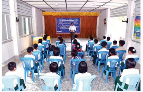
အဆိုပါ ပြိုင်ပွဲများကို ဇွန်လ ၁၃ ရက်က စတင်ကာ ၂ ရက်ကြာ ကျင်းပသွားမည်ဖြစ်သည်။ စာစီစာကုံး၊ ကဗျာရွတ်၊ ပုံပြော၊ ဆေးရောင်ခြယ်ပြိုင်ပွဲများနှင့်အတူ မြို့နယ်(ပြန်/ဆက်)

ပုသိမ်ကြီး ဇွန် ၁၃ ရက်နေ့၊ ဇွန် ၁၄ ရက်နေ့၊ ဇွန် ၁၅ ရက်နေ့၊ ဇွန် ၁၆ ရက်နေ့၊ ဇွန် ၁၇ ရက်နေ့၊ ဇွန် ၁၈ ရက်နေ့၊ ဇွန် ၁၉ ရက်နေ့၊ ဇွန် ၂၀ ရက်နေ့၊ ဇွန် ၂၁ ရက်နေ့၊ ဇွန် ၂၂ ရက်နေ့၊ ဇွန် ၂၃ ရက်နေ့၊ ဇွန် ၂၄ ရက်နေ့၊ ဇွန် ၂၅ ရက်နေ့၊ ဇွန် ၂၆ ရက်နေ့၊ ဇွန် ၂၇ ရက်နေ့၊ ဇွန် ၂၈ ရက်နေ့၊ ဇွန် ၂၉ ရက်နေ့၊ ဇွန် ၃၀ ရက်နေ့၊ ဇွန် ၃၁ ရက်နေ့