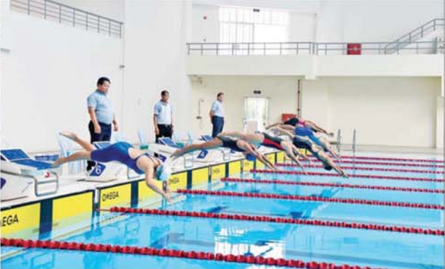
နိုင်ငံတော်စီမံအုပ်ချုပ်ရေးကောင်စီအဖွဲ့ဝင်များ ၂၀၂၄ ခုနှစ် ပြည်နယ်နှင့် တိုင်းဒေသကြီးရေကူးပြိုင်ပွဲ အမျိုးသမီး မိတာ ၂၀၀ လွန်းပျံအလွတ်ကူးပြိုင်ပွဲ ဗိုလ်လုပွဲ ယှဉ်ပြိုင်နေမှုကို ကြည့်ရှုအားပေးစဉ်။

တက်ရောက် အခမ်းအနားသို့ နိုင်ငံတော်စီမံအုပ်ချုပ်ရေးကောင်စီအဖွဲ့ဝင်များဖြစ်ကြသည့် ဒေါ်ဒွဲဘွား၊ ပိုးရယ်အောင်သိန်း၊ မန်းငြိမ်းမောင်၊ ဒေါက်တာမူထန်၊ ဒေါက်တာဘရွှေခွန်စံလွင်၊ ဦးရွှေကြိမ်းနှင့် ဦးရန်ကျော်၊ ပြည်ထောင်စုဝန်ကြီးများ၊ ဒုတိယဝန်ကြီးများ၊ ဌာနဆိုင်ရာတာဝန်ရှိသူများ၊ မြန်မာနိုင်ငံရေကူးအဖွဲ့ချုပ်မှ တာဝန်ရှိသူများ၊ ပြိုင်ပွဲအသင်းများမှ အုပ်ချုပ်သူ၊ နည်းပြများနှင့် အားကစားသမားများ တက်ရောက်ကြသည်။