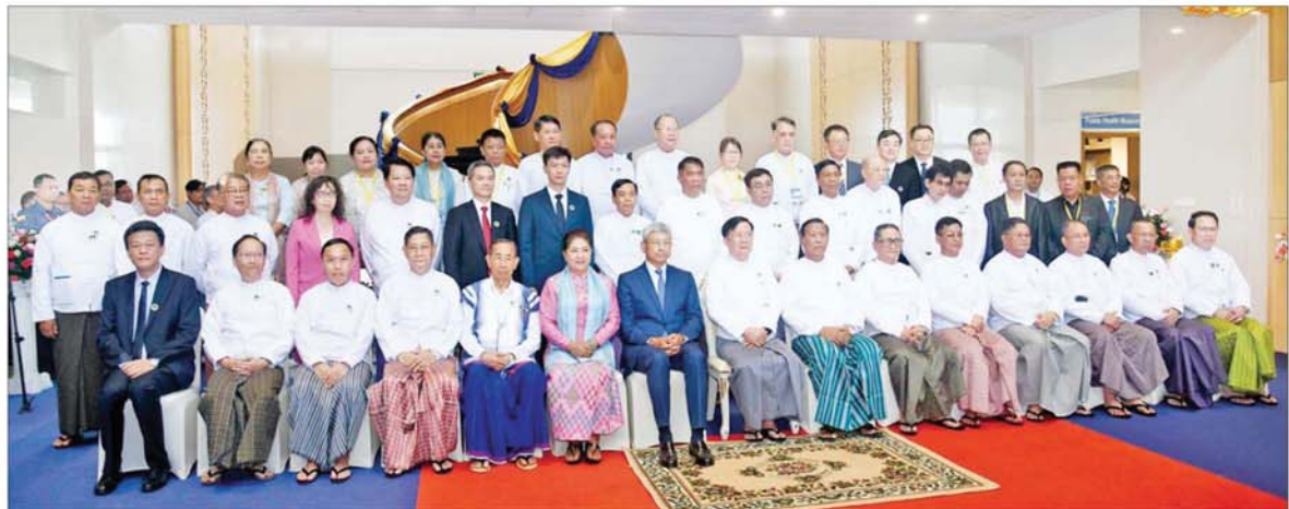
နိုင်ငံတော်စီမံအုပ်ချုပ်ရေးကောင်စီ အတွင်းရေးမှူး ဒုတိယဗိုလ်ချုပ်ကြီး အောင်လင်းဒွေးနှင့် အခမ်းအနားတက်ရောက်လာသူများ စုပေါင်းမှတ်တမ်းတင် ဓာတ်ပုံရိုက်စဉ်။

ဆောင်ရွက်မှုများ ပြုလုပ် ဓာတ်ခွဲခန်းများတွင် တာဝန် ထမ်းဆောင်ကြမည့် ကျွမ်းကျင် ပညာရှင် ၃၅ ဦးကိုလည်း တရုတ် ပြည်သူ့သမ္မတနိုင်ငံ ကျန်းစု ပြည်နယ် ရောဂါကာကွယ်ထိန်းချုပ် ရေးဗဟိုဌာနသို့ စေလွှတ်ပြီး (၆) လကြာ စာတွေ့၊ လက်တွေ့ လေ့ကျင့် သင်ကြားစေခဲ့ပြီးဖြစ် ကြောင်း။ ယခုဖွင့်လှစ်ပြီးသည့် နောက်တွင်လည်း တရုတ်ပြည် ဘူးများနှင့်အတူ လက်တွဲပြီး လက်တွေ့စမ်းသပ်ဆောင်ရွက်မှု များ ပြုလုပ်မည်ဖြစ်သည်ဟု သိရှိ ရကြောင်း။ ဓာတ်ခွဲခန်းများ၏ စွန့်ပစ်ပစ္စည်းများမှ တစ်ဆင့် ပတ်ဝန်းကျင်ကို ဘေးအန္တရာယ် မရှိစေရန် ရေဆိုးသန့်စင်စနစ်၊ မီးရှို့စနစ်များ ပါရှိပြီးဖြစ်သည့် အတွက် နောက်ဆက်တွဲအန္တရာယ် ကာကွယ်မှုများ ပါဝင်သည်ဟု သိရှိရကြောင်း။ ရောဂါနှိမ်နင်းရေး အဆောက်အအုံ၏ အုပ်ချုပ်ဆောင် တွင်လည်း ပြည်သူ့ကျန်းမာရေး အရေးပေါ် ကွပ်ကဲမှုစင်တာနှင့် အစည်းအဝေးခန်းမများ GIS/GPS စနစ်ကို အခြေခံအသုံးပြုထားသည့် ရောဂါစောင့်ကြပ်ကြည့်ရှုသည့်စနစ် များ ပါရှိပါကြောင်း။ ယခုဗဟိုဌာန ကြီးတွင် မြန်မာနိုင်ငံ၏ ကျန်းမာ ရေးကာဏ္ဍနှင့်ဆိုင်သည့် စောင့်မြင် မှုမှတ်တမ်းများ၊ ကမ္ဘာ့ကျန်းမာရေး အဖွဲ့မှ အသိအမှတ်ပြုထားသည့် ကူးစက်ရောဂါများ ကင်းစင် ပပျောက်မှု သမိုင်းမှတ်တိုင်များ၊ နိုင်ငံတကာမှ ချီးမြှင့်ခဲ့သည့် ပြည်သူ့ကျန်းမာရေး ဆိုင်ရာ ဂုဏ်ပြုမှတ်တမ်းများ၊ ဆုတံဆိပ် များ၊ ကိုဗစ်-၁၉ ကမ္ဘာ့ကပ်ရောဂါ နှင့်ပတ်သက်၍ အောင်မြင်စွာ ထိန်းချုပ် ဆောင်ရွက်နိုင်ခဲ့သည့် အောင်မြင်မှုများ၊ သဘာဝဘေး အန္တရာယ်ကျရောက်ခဲ့သည့် ဒေသ များတွင် ပြည်သူ့ကျန်းမာရေး