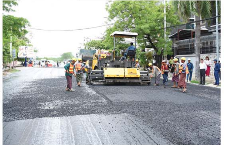
(မန္တလေးနေ့စဉ်)