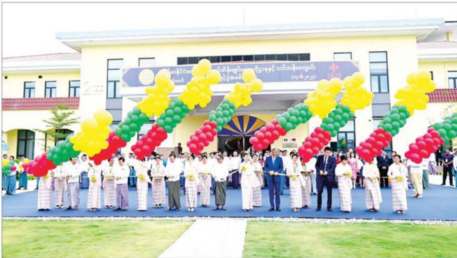
နိုင်ငံတော်စီမံအုပ်ချုပ်ရေးကောင်စီအဖွဲ့ဝင် ဒေါက်တာမူထန်၊ ပြည်ထောင်စုဝန်ကြီး ဒေါက်တာသက်ခိုင်ဝင်း၊ နေပြည်တော်ကောင်စီဥက္ကဋ္ဌ ဦးသန်းထွန်းဦး၊ ဒုတိယဝန်ကြီး ဒေါက်တာအေးထွန်း၊ မြန်မာနိုင်ငံဆိုင်ရာ တရုတ်ပြည်သူ့သမ္မတနိုင်ငံ သံအမတ်ကြီး မစ္စတာချန်းဟိုင်၊ China CDC မှ Deputy Director General ဒေါက်တာလီချင်နှင့် ပြည်သူ့ကျန်းမာရေးဦးစီးဌာန ညွှန်ကြားရေးမှူးချုပ် ဒေါက်တာမြင့်မြင့်သန်းတို့က မြန်မာနိုင်ငံ ရောဂါကာကွယ်ထိန်းချုပ်ရေးဗဟိုဌာနနှင့် သင်တန်းကျောင်းဖွင့်ပွဲအခမ်းအနားကို ဖဲကြိုးဖြတ်ဖွင့်လှစ်ပေးကြစဉ်။

ဖဲကြိုးဖြတ်ဖွင့်လှစ် ဦးစွာ နိုင်ငံတော်စီမံအုပ်ချုပ်ရေးကောင်စီအဖွဲ့ဝင် ဒေါက်တာမူထန်၊ ကျန်းမာရေးဝန်ကြီးဌာန ပြည်ထောင်စုဝန်ကြီး ဒေါက်တာသက်ခိုင်ဝင်း၊ နေပြည်တော်ကောင်စီဥက္ကဋ္ဌ ဦးသန်းထွန်းဦး၊ ဒုတိယဝန်ကြီး ဒေါက်တာအေးထွန်း၊ မြန်မာနိုင်ငံဆိုင်ရာ တရုတ်ပြည်သူ့သမ္မတ နိုင်ငံသံအမတ်ကြီး မစ္စတာချန်းဟိုင်၊ China CDC မှ Deputy Director General ဒေါက်တာလီချင်နှင့် ပြည်သူ့ကျန်းမာရေး ဦးစီးဌာန ညွှန်ကြားရေးမှူးချုပ် ဒေါက်တာမြင့်မြင့်သန်းတို့က မြန်မာနိုင်ငံ ရောဂါကာကွယ် ထိန်းချုပ်ရေး ဗဟိုဌာနနှင့် သင်တန်းကျောင်း ဖွင့်ပွဲအခမ်းအနားကို ဖဲကြိုးဖြတ်ဖွင့်လှစ်ပေးကြသည်။