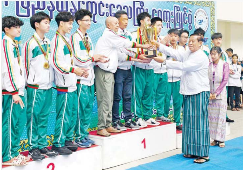
နိုင်ငံတော်စီမံအုပ်ချုပ်ရေးကောင်စီအဖွဲ့ဝင် ပိုးရယ်အောင်သိန်း အမျိုးသားတံခွန်စိုက် ဆုလေးရရှိသည့် ရန်ကုန်တိုင်းဒေသကြီး အမျိုးသားအသင်းကို တံခွန်စိုက်ဆုလေး ပေးအပ်ချီးမြှင့်စဉ်။

အမျိုးသမီး အားကစားသမားဆုနှင့် အကောင်အမျိုးသား အားကစားသမားဆုရရှိကြသူများကို ဆုလေးနှင့် ဂုဏ်ပြုဆုငွေများ ပေးအပ်ချီးမြှင့်သည်။ ယင်းနောက် နိုင်ငံတော်စီမံအုပ်ချုပ်ရေး ကောင်စီအဖွဲ့ဝင် မန်းငြိမ်းမောင်နှင့် ပိုးရယ်အောင်သိန်းတို့က အမျိုးသမီး တံခွန်စိုက်ဆုလေးနှင့် အမျိုးသား တံခွန်စိုက် ဆုလေးရရှိကြသည့် ရန်ကုန်တိုင်းဒေသကြီး အမျိုးသမီးအသင်းနှင့် အမျိုးသားအသင်းတို့ကို တံခွန်စိုက်ဆုလေးများ ပေးအပ်ချီးမြှင့်ကြသည်။