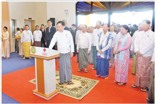
နိုင်ငံတော်စီမံအုပ်ချုပ်ရေးကောင်စီဥက္ကဋ္ဌ နိုင်ငံတော်ဝန်ကြီးချုပ်ကိုယ်စား နိုင်ငံတော်စီမံအုပ်ချုပ်ရေးကောင်စီ အတွင်းရေးမှူး ဒုတိယဗိုလ်ချုပ်ကြီး အောင်လင်းဒွေး မြန်မာနိုင်ငံ ရောဂါကာကွယ်ထိန်းချုပ်ရေးဗဟိုဌာနနှင့် သင်တန်းကျောင်း သင်တန်းကျောင်းအဆောက်အအုံကို စက်လေ့တံ့ပံ့ပိုးလှူဒါန်းပေးစဉ်။