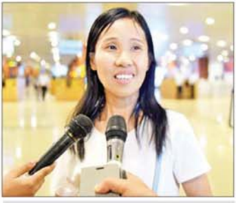
မသက်သက်လင်း

နိုင်ငံတော်အစိုးရအနေဖြင့် ပြည်ပတွင်ရောက်ရှိနေသည့် အမိန့်ငံသားများ အခက်အခဲကြုံတွေ့နေရပါက နိုင်ငံသားများအပေါ် အလေးအနက် တန်ဖိုးထားသည့်အနေဖြင့် မည်သို့သောအခြေအနေနှင့် တွေ့ကြုံရသည့်တိုင် မြန်မာကောင်စစ်ဝန်ချုပ်ရုံး၊ မြန်မာသံရုံးနှင့် သက်ဆိုင်ရာနိုင်ငံသံရုံးများ ချိတ်ဆက်၍ အမိန့်ငံသားများ မြန်မာနိုင်ငံသို့ အမြန်ဆုံး အေးချမ်းလုံခြုံစွာပြန်လည်ရောက်ရှိနိုင်ရေး ဆောင်ရွက်ပေးလျက်ရှိသည်။