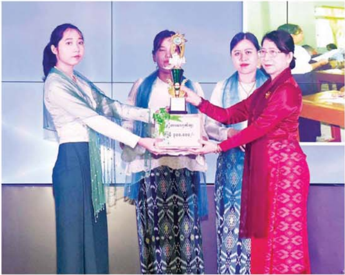
ပြည်ထောင်စုဝန်ကြီး ဦးမောင်မောင်အုန်း၏ဇနီး သုံးဘာသာဂုဏ်ထူးဖြင့် ထူးချွန်စွာအောင်မြင်ခဲ့သူအား ဂုဏ်ပြုဆု ပေးအပ်ချီးမြှင့်စဉ်။

နေပြည်တော် ဇွန် ၁၄ ပြန်ကြားရေး ဝန်ကြီးဌာန ၂၀၂၃-၂၀၂၄ ပညာသင်နှစ် တက္ကသိုလ်ဝင်တန်း အောင်မြင် သူများအား ဂုဏ်ပြုဆုချီးမြှင့်ခြင်း နှင့် ၂၀၂၄-၂၀၂၅ ပညာသင်နှစ် အတွက် ဝန်ထမ်းများ၏ သား၊ သမီးများအား ပညာသင်စရိတ် ထောက်ပံ့ပေးအပ်ခြင်း အခမ်း အနားကို ယနေ့ နံနက် ၁၀ နာရီ တွင် နေပြည်တော်ရှိ ပြန်ကြားရေး ဝန်ကြီးဌာန စုဝေးခန်းမ၌ ကျင်းပ သည်။ တက်ရောက် အခမ်းအနားသို့ ပြန်ကြားရေး ဝန်ကြီးဌာန ပြည်ထောင်စုဝန်ကြီး ဦးမောင်မောင်အုန်းနှင့် ဇနီး၊ ဒုတိယဝန်ကြီးဦးရဲတင့်၊ အမြဲတမ်း အတွင်းဝန် ဦးဝင်းကျော်အောင်၊ ဌာနဆိုင်ရာ အကြီးအကဲများ၊ တာဝန်ရှိသူများ၊ ကျောင်းသား မိဘများနှင့် ကျောင်းသား ကျောင်းသူများ တက်ရောက်ကြ သည်။ ဦးစွာ ကျောင်းသား ကျောင်းသူ များက မြန်မာ့ကျောင်း အဖွင့် သီချင်းဖြင့် သီဆိုဖျော်ဖြေကြပြီး “ပညာရည်မြင့်မားရေး ဆောင် ရွက်မှုမှသည် နိုင်ငံတော်ဖွံ့ဖြိုး တိုးတက်ရေးအထိ” မှတ်တမ်း ဗွီဒီယိုကို ပြသသည်။ ထို့နောက် ပြည်ထောင်စု ဝန်ကြီး ဦးမောင်မောင်အုန်း က အမှာစကားပြောကြားရာ တွင် နိုင်ငံတော်အစိုးရအနေဖြင့် တစ်မျိုးသားလုံးပညာရည်မြင့်မား ရေးဆိုသည့် ပညာရေးဆိုင်ရာ အမျိုးသားရေး မျှော်မှန်းချက်ကို ချမှတ်၍ ပညာရေးပြုပြင်ပြောင်း လဲမှုကို ခေတ်နှင့်လျော်ညီစွာ စီမံ