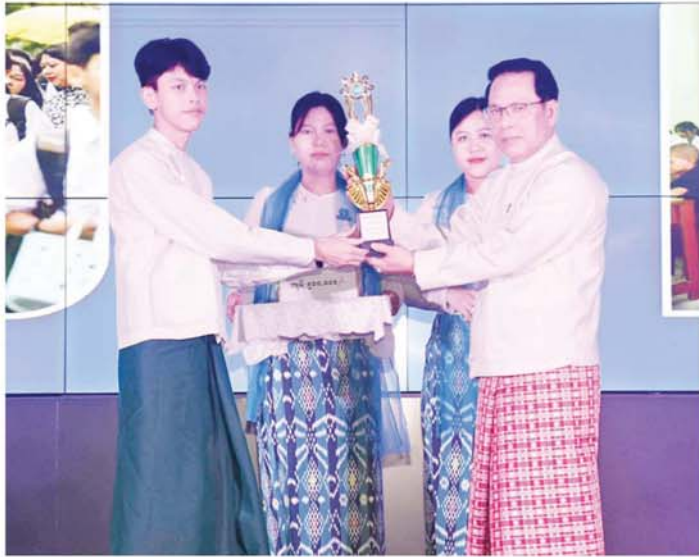
ပြည်ထောင်စုဝန်ကြီး ဦးမောင်မောင်အုန်း၊ ငါးဘာသာဂုဏ်ထူးဖြင့် ထူးချွန်စွာအောင်မြင်ခဲ့သူအား ဂုဏ်ပြုဆု ပေးအပ်ချီးမြှင့်စဉ်။