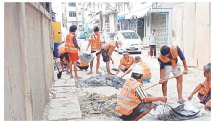
မြောင်းစာနှင့် အမှိုက်များ ဆယ်ယူရှင်းလင်းခြင်းနှင့် ဣတချောင်းမြောင်း ရေစီးရေလာကောင်းမွန်ရေးအတွက် ၁၀လမ်းနှင့် ၁၂လမ်းကြား၌ မြောင်းအတွင်းမှ အမှိုက်နှင့် ဒိုက်များကို လုပ်သားများက ဆယ်ယူရှင်းလင်းခြင်းနှင့် အနိပ်တော်ရပ်ကွက် ရေစီးရေလာကောင်းမွန်ရေးအတွက် ၂၁လမ်း၊ ချမ်းမြေ့အောင်လမ်းမြောင်းအတွင်းမှ အမှိုက်နှင့် မြောင်းစာများကို E-35 ဘက်ဟိုးစက်အသုံးပြု၍ လမ်း၆၀

အတွက် ၅၄လမ်း အနောက်ဘက်ခြမ်းမြောင်းအတွင်းမှ ဒိုက်နှင့် မြောင်းစာများကို E-35ဘက်ဟိုးစက်အသုံးပြု၍ ၄၄လမ်းနှင့် ၄၅လမ်းကြား၌ ဆယ်ယူရှင်းလင်းခြင်းနှင့် ၅၆လမ်းအနောက်ဘက်ဟိုးစက်အသုံးပြု၍ ၅၇လမ်းနှင့် မြို့ပတ်သလမ်းကြား၌ ဆယ်ယူရှင်းလင်းခြင်းနှင့် ၆၆လမ်း အနောက်ဘက်ခြမ်းမြောင်း၌ ဆယ်ယူရှင်းလင်းခြင်းနှင့် ၆၀D လမ်း အနောက်ဘက်ခြမ်းမြောင်းအတွင်းမှ အမှိုက်နှင့် မြောင်းစာများကို Hitachi-70 ဘက်ဟိုးစက်အသုံးပြု၍ ၃၁လမ်းနှင့် ၃၂လမ်းကြား၌ ဆယ်ယူရှင်းလင်းခြင်းနှင့် သိပ္ပံလမ်းတောင်ဘက်ခြမ်းမြောင်းရေစီးရေလာကောင်းမွန်ရေးအတွက် မြောင်းစာများကို လုပ်သားများက ဆယ်ယူရှင်းလင်းဆောင်ရွက်ခဲ့ကြသည်။