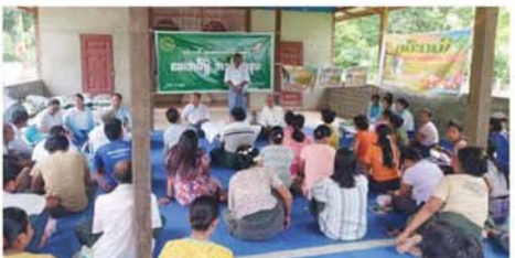
ပုသိမ်ကြီး ဇွန် ၁၄ ရွာရှိ ရိုးမမြိုင် စိုက်ပျိုးထုတ် မန္တလေးတိုင်းဒေသကြီး၊ လုပ်ရေးသမဝါယမအသင်းအား ပုသိမ်ကြီးမြို့နယ်၊ ရေမကျေး မန္တလေးတိုင်းဒေသကြီး သမဝါ

ယမ အသင်းစုချုပ်မှ စမ်းဝတ် မိုးနွယ်၊ မန္တလေးတိုင်းဒေသကြီး သဘာဝမြေသစ်ထောက်ပံ့ပေးအပ်ခြင်း အခမ်းအနားကို ယမန်နေ့က အဆိုပါကျေးရွာ၌ ကျင်းပသည်။