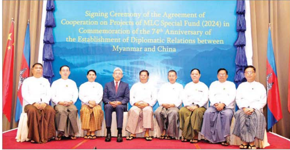
ဒုတိယဝန်ကြီးချုပ်နှင့် ပြည်ထောင်စုဝန်ကြီး ဦးသန်းဆွေနှင့် မြန်မာနိုင်ငံဆိုင်ရာ တရုတ်ပြည်သူ့သမ္မတနိုင်ငံ သံအမတ်ကြီး မစ္စတာချန်းဟိုင်တို့ အခမ်းအနားတက်ရောက်လာကြသူများနှင့်အတူ စုပေါင်းမှတ်တမ်းတင်ဓာတ်ပုံရိုက်စဉ်။

မြို့ရေးနှင့် ဆည်မြောင်းဝန်ကြီးဌာန ပြည်ထောင်စုဝန်ကြီး ဦးမင်းဇော်၊ သမဝါယမနှင့် ကျေးလက်ဖွံ့ဖြိုးရေးဝန်ကြီးဌာန ပြည်ထောင်စုဝန်ကြီး ဦးလှစိုး၊ သယံဇာတနှင့် သဘာဝပတ်ဝန်းကျင်ထိန်းသိမ်းရေးဝန်ကြီးဌာန ပြည်ထောင်စုဝန်ကြီး ဦးခင်မောင်ရှိ၊ စက်မှုဝန်ကြီးဌာန ပြည်ထောင်စုဝန်ကြီး ဒေါက်တာချာလီသန်း၊ သိပ္ပံနှင့် နည်းပညာဝန်ကြီးဌာန ပြည်ထောင်စုဝန်ကြီး ဒေါက်တာမျိုးသိန်းကျော်၊ နိုင်ငံခြားရေးဝန်ကြီးဌာန ဒုတိယဝန်ကြီး ဦးလွင်ဦးနှင့် သက်ဆိုင်ရာဝန်ကြီးဌာနများမှ အဆင့်မြင့်အရာရှိကြီးများ တက်ရောက်ကြသည်။