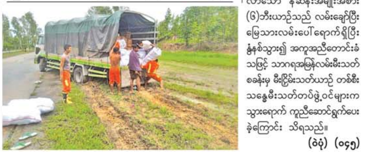
(၆)ဘီးယာဉ်လမ်းချော်ပြီး မြေသားလမ်းပေါ်ရောက်ရှိ

တို့နှစ်ဦးအား မြစ်ကြီးနားမြို့ နယ်မြေ ရဲတပ်ဖွဲ့စခန်းမှ အမှုဖွင့် လှမ်းအရေး ယူထားကြောင်းသိရ သည်။ (၄၄၄)