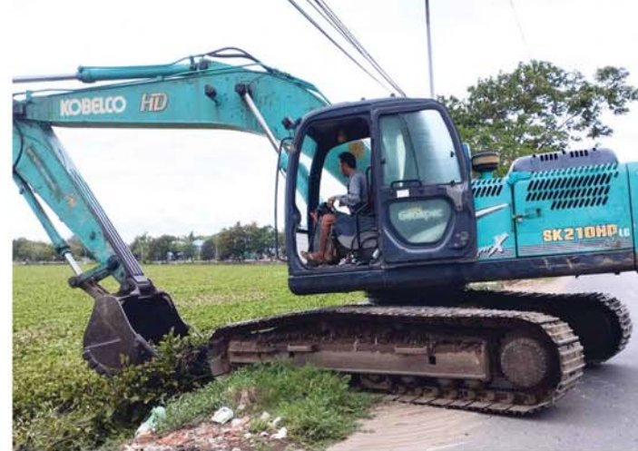
(ဝဲပုံ) (မန္တလေးနေ့စဉ်-၃)