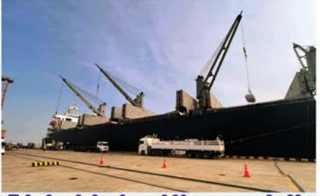
ပြည်ပသို့ ဆန်နှင့် ဆန်ကွဲ တန်ချိန် ၇၀၀၀၀ ကျော်တင်ပို့ခဲ့

ရှေး အသိပညာပေးဟောပြောပွဲနှင့် စာအုပ်စာစောင်၊ နံရံကပ်စာစောင်ပြပွဲ ပြုလုပ်ရခြင်း၏ ရည်ရွယ်ချက်၊ ကလေးအလုပ်သမားဥဒေနှင့် ပြစ်မှုဖြစ်ဒဏ်များအကြောင်း ရှင်းလင်းပြောကြားခဲ့ကြသည်။ ဆက်လက်ပြီး ခရိုင်ပြန်ကြားရေးနှင့် ပြည်သူ့ဆက်ဆံရေးဦးစီးဌာန လူထုအခြေပြုဗဟိုဌာနမှ ခင်းကျင်းပြသထားသည့် သုတ၊ ရသ စာအုပ်၊ စာစောင်များနှင့် ကလေးအလုပ်သမားပျောက်ရေးအသိပညာပေး နံရံကပ်စာစောင်များကို ကျောင်းသား၊ ကျောင်းသူများမှ လေ့လာကြည့်ရှုခဲ့ကြကြောင်း သိရသည်။ (၀၅၇)