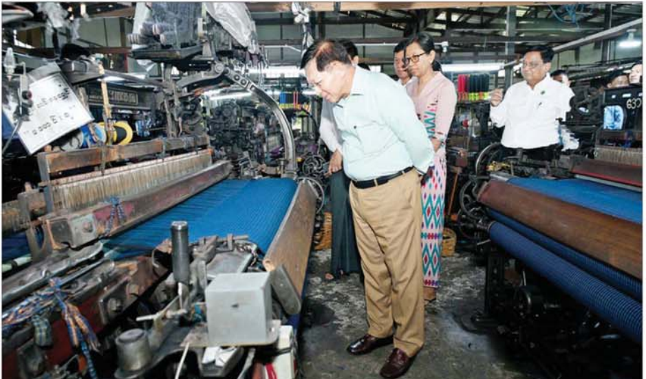
လှည့်လည်ကြည့်ရှု နိုင်ငံတော်စီမံ အုပ်ချုပ်ရေး ကောင်စီဥက္ကဋ္ဌ နိုင်ငံတော် ဝန်ကြီးချုပ် ဗိုလ်ချုပ်မှူးကြီး မင်းအောင်လှိုင် ရွှေသဲတော ကုမ္ပဏီ ကိနွေရီချည်ချောလုံချည် ထုတ်လုပ်ရေးလုပ်ငန်းစုတွင် လှည့်လည်ကြည့်ရှုစဉ်။