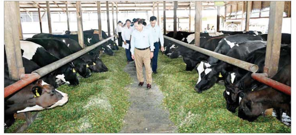
နိုင်ငံတော်စီမံအုပ်ချုပ်ရေးကောင်စီဥက္ကဋ္ဌ နိုင်ငံတော်ဝန်ကြီးချုပ် ဗိုလ်ချုပ်မှူးကြီး မင်းအောင်လှိုင် ကောင်းထက်စံနို့စားနွားမွေးမြူရေးခြံ တွင် လှည့်လည်ကြည့်ရှုစဉ်။

ရက်ကန်းခတ်လုပ်ငန်း ဆောင်ရွက် မှု၊ ဒေသတွင်း အလုပ်အကိုင်ဖော် ဆောင်ပေးနိုင်မှုနှင့် အရည်အသွေး ထိန်းသိမ်းရေး လုပ်ငန်းများ ဆောင်ရွက်လျက်ရှိသည့် အခြေ အနေများကို လိုက်လံရှင်းလင်း တင်ပြကြပြီး ထုတ်လုပ်ထားသည့် ပုဆိုးများကို ခင်းကျင်းပြသသည်။ ရှင်းလင်း တင်ပြမှုများအပေါ် နိုင်ငံတော် စီမံအုပ်ချုပ်ရေး ကောင်စီဥက္ကဋ္ဌ နိုင်ငံတော်ဝန်ကြီး ချုပ်က ပြည်တွင်းအထည်အလိပ် ထုတ်လုပ်ရေး လုပ်ငန်းများ၌ အချို့သောချည်များကို ပြည်ပမှ တင်သွင်းနေကြောင်း၊ ပြည်တွင်း ထုတ် ချည်မှုရှင်များကို အရည် အသွေးပြည့်စုံအောင် ဆောင်ရွက် ပြီး အသုံးပြုနိုင်ပါက ပိုမိုအကူအညီ စေမည်ဖြစ်ပြီး ထုတ်လုပ်မှုကုန်ကျ စရိတ်များလည်း လျော့ကျလာ စေမည်ဖြစ်ကြောင်း၊ ထို့ကြောင့် ပြည်တွင်းမှထွက်ရှိသည့်ချည်များ ဖြင့် အထည်များ ထုတ်လုပ်နိုင်ရေး သုတေသနပြုဆောင်ရွက်သွားရန် လိုကြောင်း ဆွေးနွေးပြောကြား ပြီး လုပ်ငန်းခွင်အခက်အခဲများ အား မေးမြန်းကာ လိုအပ်သည် များ ညှိနှိုင်းဆောင်ရွက်ပေးခဲ့ ကြောင်း သိရသည်။ သတင်းစဉ်