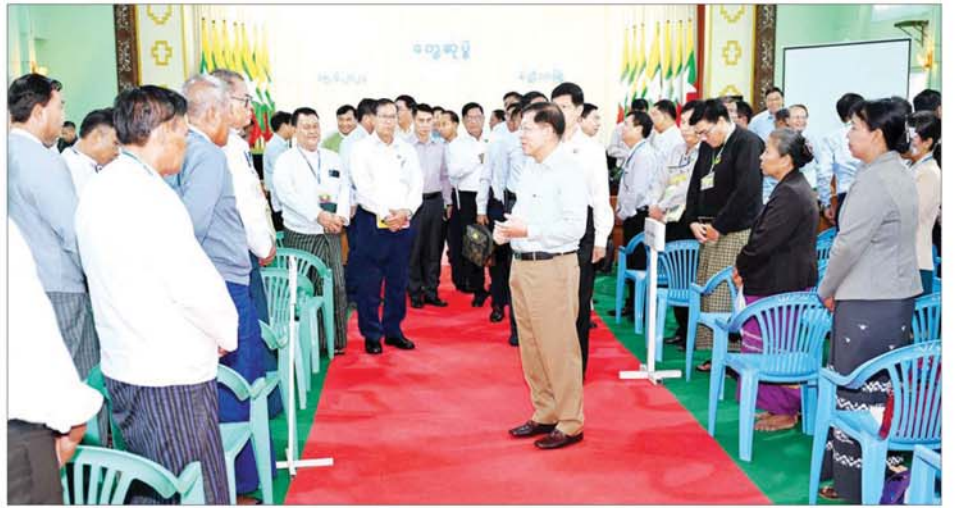
နိုင်ငံတော်စီမံအုပ်ချုပ်ရေးကောင်စီဥက္ကဋ္ဌ နိုင်ငံတော်ဝန်ကြီးချုပ် ဗိုလ်ချုပ်မှူးကြီးမင်းအောင်လှိုင် မိတ္ထီလာခရိုင်နှင့် မြို့နယ်အဆင့်ဌာနဆိုင်ရာ ဝန်ထမ်းများနှင့် မြို့မိမြို့ဖများကို ရင်းရင်းနှီးနှီး နှုတ်ဆက်စဉ်။

ပြည်ထောင်စု ဝန်ကြီးများက ဝါစိုက်တောင်သူများ မျိုးကောင်း မျိုးသန့်ရရှိရေးအတွက် ပြည်တွင်း ပြည်ပမှ ဝါမျိုးများကို သုတေသန ပြုလုပ် စမ်းသပ်လျက်ရှိမှု၊ စပါး မျိုးကောင်းမျိုးသန့် ရရှိရေး၊ မိတ္ထီလာခရိုင်အတွင်း သွင်းအားစု များ သင့်တင့်မျှတသည့် ဈေးနှုန်း ဖြစ်စေရေးနှင့် စိုက်ပျိုးရေး လုံလောက်စွာရရှိရေးတို့အတွက် သက်ဆိုင်ရာ ဝန်ကြီးဌာနများမှ ကြိုးပမ်းဆောင်ရွက်လျက်ရှိ သဖြင့် လိုအပ်ချက်ရှိသည်များကို ချိတ်ဆက် ဆောင်ရွက်သွားရန်