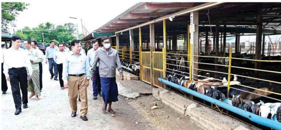
နိုင်ငံတော်စီမံအုပ်ချုပ်ရေးကောင်စီဥက္ကဋ္ဌ နိုင်ငံတော်ဝန်ကြီးချုပ် ဗိုလ်ချုပ်မှူးကြီး မင်းအောင်လှိုင် မိတ္ထီလာ-သာစည်လမ်းရှိ ဦးမြဟန် ဆိတ်နှင့်သိုး မွေးမြူရေးလုပ်ငန်းတွင် လှည့်လည်ကြည့်ရှုစဉ်။

နေပြည်တော် ၅ နဂါး နိုင်ငံတော် စီမံအုပ်ချုပ်ရေး ကောင်စီဥက္ကဋ္ဌ နိုင်ငံတော် ဝန်ကြီးချုပ် ဗိုလ်ချုပ်မှူးကြီး မင်းအောင်လှိုင်သည် ယနေ့ မွန်းလွဲပိုင်းတွင် ခရီးစဉ်တွင် လိုက်ပါလာသည့် အဖွဲ့ဝင်များ၊ မန္တလေးတိုင်းဒေသကြီး၊ မကွေး တိုင်းဒေသကြီး၊ စစ်ကိုင်းတိုင်း ဒေသကြီးတို့မှ ဝန်ကြီးချုပ်များ၊ အလယ်ပိုင်း တိုင်းစစ်ဌာနချုပ် တိုင်းမှူးနှင့်တာဝန်ရှိသူများလိုက် ပါ၍ မန္တလေးတိုင်းဒေသကြီး မိတ္ထီလာခရိုင် မိတ္ထီလာမြို့နှင့် ဝမ်းတွင်းမြို့နယ် တို့အတွင်းရှိ ပုဂ္ဂလိက မွေးမြူရေးလုပ်ငန်းများ နှင့် ဒေသထုတ်ကုန်လုပ်ငန်းများ ဆောင်ရွက်နေမှုအခြေအနေများကို သွားရောက်ကြည့်ရှုအားပေးသည်။ ဆိတ်နှင့်သိုး မွေးမြူရေးလုပ်ငန်း ဦးစွာ နိုင်ငံတော်စီမံအုပ်ချုပ် ရေးကောင်စီဥက္ကဋ္ဌ နိုင်ငံတော် ဝန်ကြီးချုပ်နှင့် အဖွဲ့ဝင်များသည် မိတ္ထီလာ-သာစည်လမ်းရှိဦးမြဟန် ဆိတ်နှင့်သိုး မွေးမြူရေးလုပ်ငန်း သို့ရောက်ရှိကြရာ လုပ်ငန်းရှင် ဦးမြဟန်က ဆိတ်နှင့်သိုးများမွေး မြူထားရှိမှု၊ ဒေသထုတ်ကုန်များ ဖြစ်သည့် ပါစတီး၊ ဆီခွံ၊ ပဲနောက်၊ ပဲတီစိမ်းဖတ်များ၊ မြေပဲရိုးများဖြင့် စပ်စာ ကျွေးမွေးလျက်ရှိမှု၊