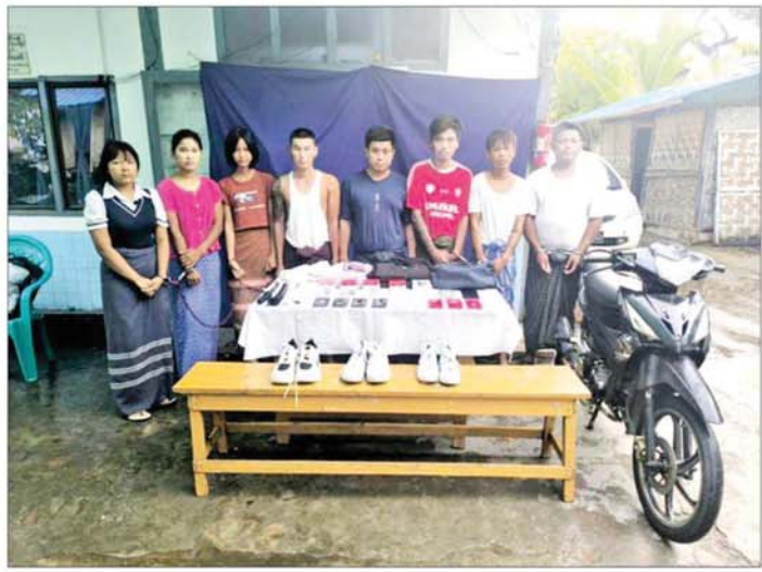
Sky Mobile Phone အရောင်းဆိုင်နှင့် Paradise Mobile Phone အရောင်းဆိုင်တို့အား လုယက်မှုကျူးလွန်ခဲ့သူ တရားခံ ရှစ်ဦးနှင့် သက်သေခံပစ္စည်းများ ဖမ်းဆီး/သိမ်းဆည်းရမိမှု။

ဆေးရုံအနီး၊ ရန်ကုန်-မန္တလေး ကားလမ်းဟောင်း ဘေးရှိ နတ်ရေကန်ကျေးရွာအနီး၊ ပြည်ကြီး တံခွန်မြို့နယ်အတွင်းရှိ ရန်ကုန်- မန္တလေး ကားလမ်းဟောင်းရှိ တံခွန်တိုင်အပိုင်းအနီး၊ ၇၃ လမ်းရှိ ယာယီကားကြီးကွင်း အနီး စုစုပေါင်း နေရာ ခုနစ်ခုတို့တွင် ဆိုင်ကယ်စီးနင်း သွားလာသူများ ထံမှ ရွှေထည်ပစ္စည်းများအား လုယက်မှုခုနစ်ကြိမ်ကျူးလွန်ခဲ့သူ ဖြစ်ကြောင်း ဖော်ထုတ်သိရှိရပြီး အမှုများမှ သက်သေခံပစ္စည်းများ အား သိမ်းဆည်းနိုင်ရေးနှင့် အမှုမှ ဖမ်းဆီးရန်ကျန် တရားခံ မျိုးမင်း လတ်အား ဖမ်းဆီးရမိနိုင်ရေး ဆက်လက် ဆောင်ရွက်လျက်ရှိ သည်။ အလားတူ ၂၀၂၄ ခုနှစ် ဇွန် ၂ ရက်နှင့် ၃ ရက်တို့တွင် မန္တလေး တိုင်းဒေသကြီး အောင်မြေသာစံ မြို့နယ်နှင့်မဟာအောင်မြေမြို့နယ် တို့ရှိ Sky Mobile Phone အရောင်း ဆိုင်နှင့် Paradise Mobile Phone အရောင်းဆိုင်တို့ရှိ လက်ကိုင်ဖုန်း မျိုးစုံ ၂၅ လုံးအား ဓားရှည်များ ကိုင်ဆောင်အသုံးပြု၍ လုယက် ယူဆောင်ခဲ့သူ တရားခံများအား ဖမ်းဆီးရမိနိုင်ရေး လုံခြုံရေး