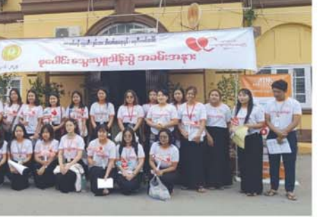
စုပေါင်းသွေးလှူဒါန်းပွဲ အသင်းအား

အသင်း၊ ဓမ္မပါလသွေးလှူရှင် အသင်း၊ KBZတက်သွေးလှူရှင် အသင်း၊ Diamond Century သွေးလှူရှင်အသင်းတို့မှ စေတနာ့ သွေးသန် သွေးလှူရှင်များသွေး များလှူဒါန်းရာ သွေးလှူဘဏ် တာဝန်ခံကျော်ဂါဗေဒဆရာဝန်ကြီး