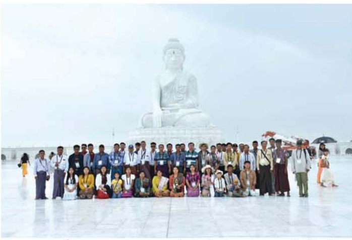
မန္တလေး ဇွန် ၁၅ သာယာရေးကော်မတီ ဝန်ထမ်း မိသားစုများ ပဉ္စမအကြိမ် ဘုရား ဖူးသွားရောက်ခဲ့သည်။ မန္တလေးမြို့တော်စည်ပင်

အကြိမ်အဖြစ် စနေနေ့ ရုံးပိတ် ရက်တွင် နေပြည်တော်သို့ ယနေ့ နံနက်ပိုင်းက ထွက်ခွာပြီး မာရ ဝိယ ဘုရားကြီးနှင့် ဥပ္ပါတသန္တ ဘုရားကြီးသို့ သွားရောက်ဖူးမြော် ရာ သက်ဆိုင်ရာ ဝေါဟာအဖွဲ့ များက ဘုရားသမိုင်းမှတ်တမ်း စီဒီယိုမှတ်တမ်းပြသပြီး ဘုရား အား လှည့်လည်ဖူးမြော်ခဲ့သည်။ ထို့နောက် မွန်လုံပိုင်းတွင် နေပြည်တော်မှ မန္တလေးမြို့သို့ ပြန်လည်ထွက်ခွာလာခဲ့ပြီး ယင်း ဘုရားဖူးအစီအစဉ်ကို အပတ်စဉ် စနေနေ့တိုင်း ဝန်ထမ်းမိသားစု များ အလှည့်ကျ သွားရောက် ဖူးမြော်ကြမည်ဖြစ်ကြောင်း သိ ရသည်။ (အေဝါဝဲ) (မန္တလေးနေ့စဉ်-၃)