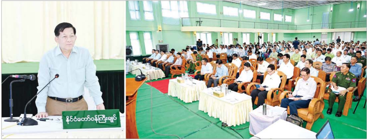
နိုင်ငံတော်စီမံအုပ်ချုပ်ရေးကောင်စီဥက္ကဋ္ဌ နိုင်ငံတော်ဝန်ကြီးချုပ် ဗိုလ်ချုပ်မှူးကြီး မင်းအောင်လှိုင် မိတ္တီလာခရိုင်အတွင်းရှိ ခရိုင်၊ မြို့နယ်အဆင့် ဌာနဆိုင်ရာတာဝန်ရှိသူများ၊ မြို့မိမြို့ဖများအား တွေ့ဆုံ၍ ဒေသဖွံ့ဖြိုးရေးဆိုင်ရာများ ဆွေးနွေးပြောကြားစဉ်။

နိုင်ငံတော်စီမံအုပ်ချုပ်ရေးကောင်စီဥက္ကဋ္ဌ နိုင်ငံတော်ဝန်ကြီးချုပ် ဗိုလ်ချုပ်မှူးကြီး မင်းအောင်လှိုင်သည် ယနေ့နံနက်ပိုင်းတွင် မန္တလေးတိုင်းဒေသကြီး မိတ္တီလာခရိုင်အတွင်းရှိ ခရိုင်၊ မြို့နယ်အဆင့် ဌာနဆိုင်ရာတာဝန်ရှိသူများ၊ မြို့မိမြို့ဖများအား မိတ္တီလာမြို့ ကန်တော်မင်္ဂလာခန်းမ၌တွေ့ဆုံ၍ ဒေသဖွံ့ဖြိုးတိုးတက်ရေးဆိုင်ရာများကို ဆွေးနွေးပြောကြားသည်။ စာမျက်နှာ ၃ သို့ ၀