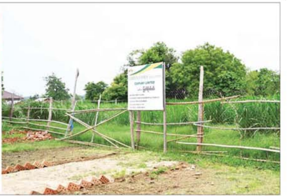
နိုင်ငံတော်စီမံအုပ်ချုပ်ရေး ကောင်စီဥက္ကဋ္ဌ နိုင်ငံတော် ဝန်ကြီးချုပ် ဗိုလ်ချုပ်မှူးကြီး မင်းအောင်လှိုင် GARDEN FAMILY ဆိတ်မွေးမြူရေးလုပ်ငန်းတွင် နေမီယာမြက်စိုက်ခင်းဆောင်ရွက် ထားရှိမှုကို ကြည့်ရှုစဉ်။