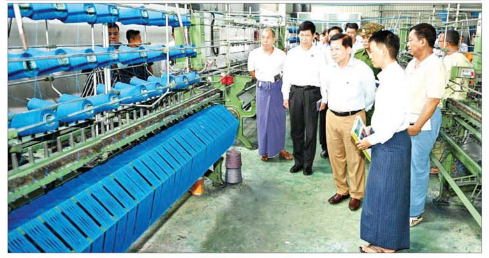
နိုင်ငံတော်စီမံအုပ်ချုပ်ရေး ကောင်စီဥက္ကဋ္ဌ နိုင်ငံတော် ဝန်ကြီးချုပ် ဗိုလ်ချုပ်မှူးကြီး မင်းအောင်လှိုင် Leader of Textile Public Co.,Ltd. တွင် လှည့်လည်ကြည့်ရှုစဉ်။

ရက်ကန်းခတ်လုပ်ငန်း ဆောင်ရွက် မှု၊ ဒေသတွင်း အလုပ်အကိုင်ဖော် ဆောင်ပေးနိုင်မှုနှင့် အရည်အသွေး ထိန်းသိမ်းရေး လုပ်ငန်းများ ဆောင်ရွက်လျက်ရှိသည့် အခြေ အနေများကို လိုက်လံရှင်းလင်း တင်ပြကြပြီး ထုတ်လုပ်ထားသည့် ပုဆိုးများကို ခင်းကျင်းပြသသည်။ ရှင်းလင်း တင်ပြမှုများအပေါ် နိုင်ငံတော် စီမံအုပ်ချုပ်ရေး ကောင်စီဥက္ကဋ္ဌ နိုင်ငံတော်ဝန်ကြီး ချုပ်က ပြည်တွင်းအထည်အလိပ် ထုတ်လုပ်ရေး လုပ်ငန်းများ၌ အချို့သောချည်များကို ပြည်ပမှ တင်သွင်းနေကြောင်း၊ ပြည်တွင်း ထုတ် ချည်မှုရှင်များကို အရည် အသွေးပြည့်စုံအောင် ဆောင်ရွက် ပြီး အသုံးပြုနိုင်ပါက ပိုမိုအကူအညီ စေမည်ဖြစ်ပြီး ထုတ်လုပ်မှုကုန်ကျ စရိတ်များလည်း လျော့ကျလာ စေမည်ဖြစ်ကြောင်း၊ ထို့ကြောင့် ပြည်တွင်းမှထွက်ရှိသည့်ချည်များ ဖြင့် အထည်များ ထုတ်လုပ်နိုင်ရေး သုတေသနပြုဆောင်ရွက်သွားရန် လိုကြောင်း ဆွေးနွေးပြောကြား ပြီး လုပ်ငန်းခွင်အခက်အခဲများ အား မေးမြန်းကာ လိုအပ်သည် များ ညှိနှိုင်းဆောင်ရွက်ပေးခဲ့ ကြောင်း သိရသည်။ သတင်းစဉ်