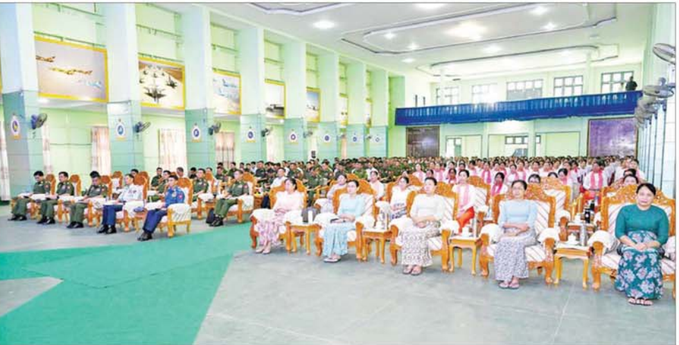
နိုင်ငံတော်စီမံအုပ်ချုပ်ရေးကောင်စီဥက္ကဋ္ဌ တပ်မတော်ကာကွယ်ရေးဦးစီးချုပ် ဗိုလ်ချုပ်မှူးကြီးမင်းအောင်လှိုင် အလယ်ပိုင်းတိုင်းစစ်ဌာနချုပ် မိတ္ထီလာတပ်နယ်မှ အရာရှိ၊ စစ်သည်၊ မိသားစုများအား တွေ့ဆုံအမှာစကားပြောကြားစဉ်။