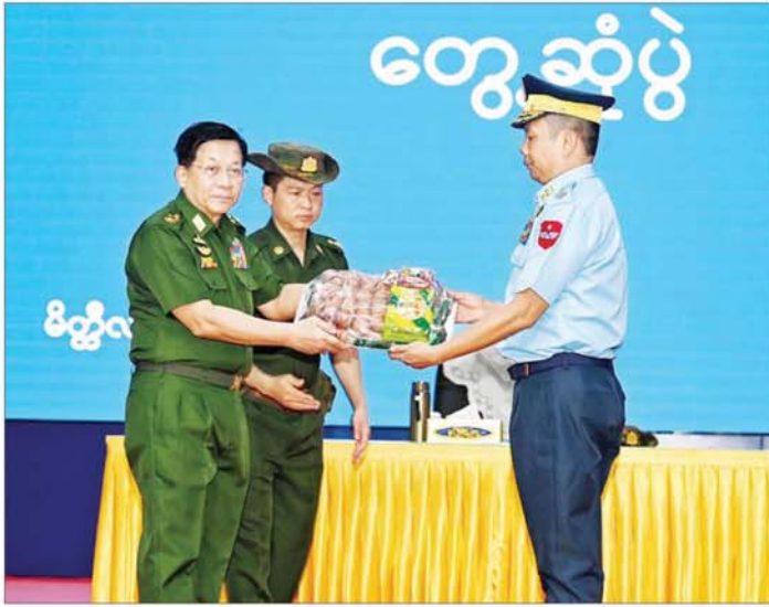
နိုင်ငံတော်စီမံအုပ်ချုပ်ရေးကောင်စီဥက္ကဋ္ဌ တပ်မတော်ကာကွယ်ရေးဦးစီးချုပ် ဗိုလ်ချုပ်မှူးကြီး မင်းအောင်လှိုင် မိတ္ထီလာတပ်နယ်မှ အရာရှိ၊ စစ်သည်၊ မိသားစုများအတွက် စားသောက်ဖွယ်ရာပစ္စည်းများ ပေးအပ်စဉ်။