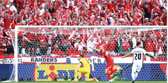
အဲရစ်ဆင် ဒိန်းမတ်အသင်းအတွက် ဂိုးသွင်းယူပြီးနောက် အောင်ပွဲခံနေစဉ်။

အသင်းအတွက် ဦးဆောင်ဂိုးရယူ ပေးနိုင်ခဲ့သည်။ ဆလိုဗေးနီးယား အသင်းကလည်း ချေပဂိုးပြန်လည် ရရှိရေး ကြိုးပမ်းခဲ့သော်လည်း ကောင်းမွန်သော ဖန်တီးမှုများ ပြုလုပ်နိုင်ခြင်း မရှိခဲ့ပေ။ ပထမ ပိုင်းပွဲစဉ်ပြီးဆုံးချိန်တွင် ဒိန်းမတ် အသင်းက ဆလိုဗေးနီးယား အသင်းအား တစ်ဂိုး၊ ဂိုးမရှိဖြင့် ဦးဆောင်ထားသည်။ ဒုတိယပိုင်းတွင်လည်း ဒိန်း မတ်အသင်းနှင့် ဆလိုဗေးနီးယား အသင်းတို့ တစ်ဖက်နှင့်တစ်ဖက် တိုက်စစ်ဆင်ကစားခဲ့ကြသည်။ ပွဲချိန်ကြာလာသည်နှင့်အမျှ ဆလို ဗေးနီးယားအသင်းက စုဖွဲ့မှုအား ကောင်းကောင်းဖြင့် အတွေ့အကြုံ ရှိသည့် ဒိန်းမတ်အသင်းဘက်ကို ပြန်လည်ဖိအားပေးကစားနိုင်ခဲ့ပြီး ပွဲချိန် ၇၇ မိနစ်တွင် ဂျန်ဇက်က ချေပဂိုးပြန်လည် ရယူပေးနိုင်ခဲ့ သည်။ နောက်ပိုင်းတွင် နှစ်သင်း စလုံး ဂိုးရရှိရေး ကြိုးပမ်းခဲ့ကြ သော်လည်း ဂိုးထပ်မံသွင်းယူ နိုင်ခြင်းမရှိသောကြောင့် ပွဲစဉ်ပြီး ဆုံးချိန်တွင် ဒိန်းမတ်အသင်းနှင့် ဆလိုဗေးနီးယားအသင်းတို့ တစ်ဖက်တစ်ဖက်စီ သရေရလဒ်သာ ထွက်ပေါ်ခဲ့သည်။ (NGB)