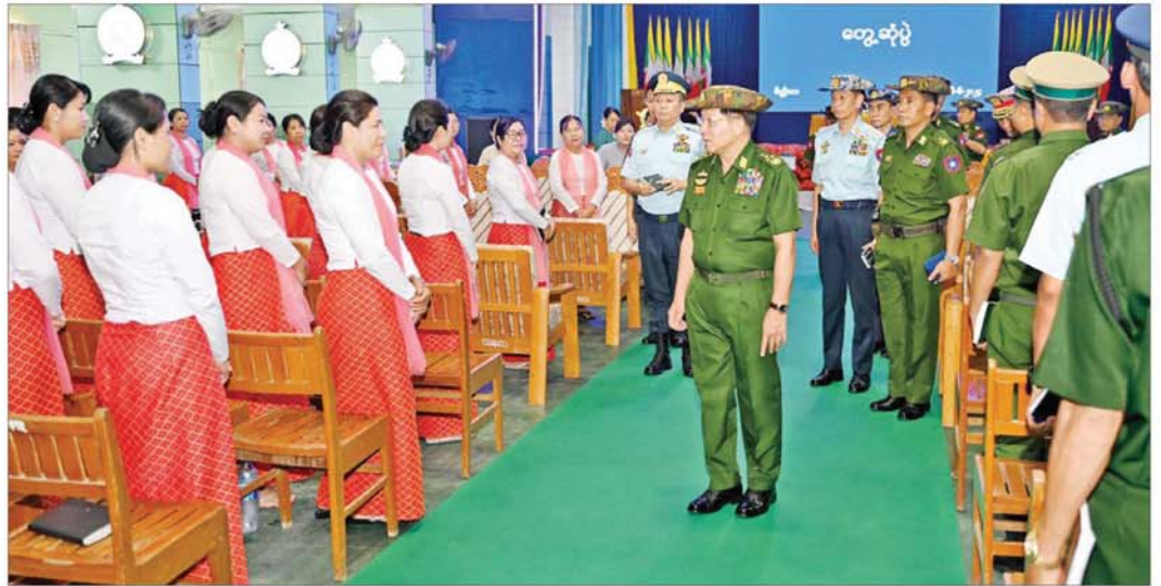
နိုင်ငံတော်စီမံအုပ်ချုပ်ရေးကောင်စီဥက္ကဋ္ဌ တပ်မတော်ကာကွယ်ရေးဦးစီးချုပ် ဗိုလ်ချုပ်မှူးကြီးမင်းအောင်လှိုင် မိတ္ထီလာတပ်နယ်မှ အရာရှိ၊ စစ်သည်၊ မိသားစုများအား ရင်းရင်းနှီးနှီးနှုတ်ဆက်စဉ်။

သက်သာချောင်ချိရေးနှင့်ပတ်သက်၍ တပ်ပိုင် နှင့် တစ်နိုင်တစ်ပိုင် စိုက်ပျိုးမွေးမြူရေးလုပ်ငန်းများ ကို အောင်မြင်အောင်ဆောင်ရွက်ကြစေလိုကြောင်း၊ မိသားစုဝင်များ၏ စီးရီးချောင်စားရေးကို အထောက် အကူဖြစ်စေနိုင်သည့်သီးနှံများကို စိုက်ပျိုးခြင်းဖြင့် ပိုလျှံလာသည့် ငွေကြေးများကိုအခြားနေရာများ၌ အသုံးပြုနိုင်မည်ဖြစ်ကြောင်း၊ တပ်ပိုင်စိုက်ပျိုးမွေးမြူ ရေးလုပ်ငန်းများကို အောင်မြင်အောင် ဆောင်ရွက်ပြီး အရာရှိ၊ စစ်သည်၊ မိသားစုဝင်များ၏ သက်သာ ချောင်ချိရေးကို အဓိကထားဖြည့်ဆည်းပေးနိုင် ရန်လိုကြောင်း၊ ထို့ပြင် မိမိတို့တပ်မတော်သားများ၏