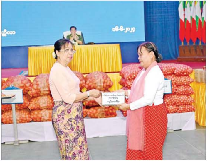
နိုင်ငံတော်စီမံအုပ်ချုပ်ရေးကောင်စီဥက္ကဋ္ဌ တပ်မတော်ကာကွယ်ရေးဦးစီးချုပ် ဗိုလ်ချုပ်မှူးကြီး မင်းအောင်လှိုင်၏ဇနီး ဒေါ်ကြူကြူလှ တပ်နယ်မိခင်နှင့်ကလေးစောင့်ရှောက်ရေးအသင်းအတွက် ချီးမြှင့်ငွေများ ပေးအပ်စဉ်။

၀ ရှေ့ဖူးမှ ဆွေးနွေးပြောကြားနိုင်ရန်လာရောက်စဉ် မိတ္ထီလာ တပ်နယ်မှ အရာရှိ၊ စစ်သည်၊ မိသားစုဝင်များအား တွေ့ဆုံခြင်းဖြစ်ကြောင်း၊ မိတ္ထီလာဒေသအနေဖြင့် မြန်မာနိုင်ငံအလယ်ပိုင်းတွင်ရှိပြီး လမ်းပန်း ဆက်သွယ်မှုတွင် အချက်အချာကျသည့် ထူးခြား သည့်ဒေသတစ်ခုဖြစ်ကြောင်း၊ မြန်မာနိုင်ငံအနှံ့သို့ သွားရောက်နိုင်သည့် လမ်းဆုံနေရာဖြစ်သည့်အတွက် အသွားအလာများပြားသည့် ဒေသတစ်ခုလည်းဖြစ် ကြောင်း၊ စိုက်ပျိုးမွေးမြူရေးနှင့်ပတ်သက်၍လည်း အောင်မြင်စွာ ဆောင်ရွက်နိုင်သည့် ဒေသတစ်ခု ဖြစ်သကဲ့သို့ ပညာရေးနှင့်ပတ်သက်၍လည်း တက္ကသိုလ်များ၊ ကောလိပ်များ၊ ကျောင်းများ ပြည့်စုံ စွာရှိသည့် ဒေသတစ်ခုဖြစ်ကြောင်း၊ မိတ္ထီလာကို ဗဟိုပြု၍ စံပြုဖွံ့ဖြိုးတိုးတက်အောင် ဆောင်ရွက်မည် ဆိုပါက မိမိတို့နိုင်ငံတိုးတက်ရေးကိုလည်း များစွာ အထောက်အကူဖြစ်စေနိုင်မည်ဖြစ်ကြောင်း၊ ဒုတိယ ကမ္ဘာစစ်ကာလအတွင်း ဂျပန်နှင့် အင်္ဂလိပ်တို့မိတ္ထီလာ လွင်ပြင်၌ တိုက်ပွဲများဖြစ်ပွားခဲ့ပြီး မိတ္ထီလာတိုက်ပွဲ အဖြစ် နာမည်ကြီးခဲ့ကြောင်း၊ လွတ်လပ်ရေးရပြီး ပြည်တွင်းသောင်းကျန်းမှုကာလအတွင်း လက်နက် ကိုင်သောင်းကျန်းသူများကို မိတ္ထီလာလွင်ပြင်၌ မြန်မာတပ်မတော်က စစ်ဆင်တိုက်ခိုက်ခဲ့မှုသမိုင်း ဖြစ်ရရှိခဲ့ကြောင်း၊ ထို့ကြောင့် မိတ္ထီလာတပ်နယ်တွင် တာဝန်ထမ်းဆောင်ရသည့် အရာရှိ၊ စစ်သည်များနှင့် မိသားစုများအနေဖြင့် ထူးခြားသည့်သမိုင်းကြောင်း အခြေအနေအထားများကို ပိုင်ဆိုင်ထား သည့်ဒေသတွင် တာဝန်ထမ်းဆောင်နေကြရခြင်း ဖြစ်ကြောင်း၊ မိတ္ထီလာတပ်နယ်တွင် လက်ရုံးတပ်များ ပြည့်စုံစွာတည်ရှိပြီး သမိုင်းကြောင်းအစဉ်အလာ ကောင်းသည့် တပ်နယ်တစ်ခုဖြစ်သဖြင့် အရာရှိ၊ စစ်သည်များအနေဖြင့် ဂုဏ်ယူစွာဖြင့် တာဝန် ထမ်းဆောင်ကြရန်နှင့် အစဉ်အလာကောင်းများကို ဆက်လက်ထိန်းသိမ်းသွားကြရန် လိုအပ်မည်ဖြစ် ကြောင်း။