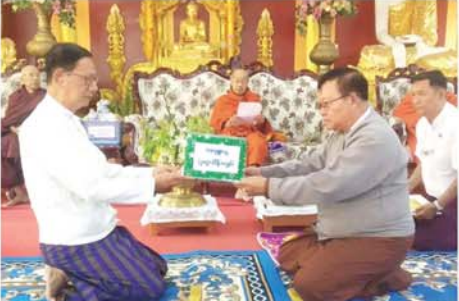
ဆရာတော် ဓမ္မာသီဝကျောင်း ဆရာတော်ထံ သီလင်ယူ ဆောက်တည်ခြင်း၊ ဆရာတော်ကြီးများအား လှူဒါန်းဆက်ကပ်ကြပြီး လှူဒါန်းမှုအစုအတွက် အဖွဲ့ကျောင်း ဆရာတော်ကြီးက အနုမောဒနာ ရေစက်ချဘုရားကို ချီးမြှင့်တော်မူခဲ့ကြောင်း သိရသည်။ (အပေါ်ပုံ)(၀၇၀)