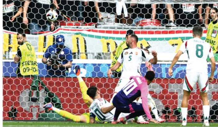
နိုင်ငံကမ္ဘာ

ယူရို ၂၀၂၄ ဥရောပလား ဘောလုံးပြိုင်ပွဲ၊ အုပ်စု(က)ပွဲစဉ်တွင် အိမ်ရှင် ဂျာမနီအသင်းသည် ပွဲစဉ် ၂၅ကစားပြီး ၂၅စွဲလုံးအနိုင်ရရှိကာ ရမှတ် ၆မှတ်ဖြင့် ၁၆သင်းအဆင့်သို့ စောစီးစွာ တက်ရောက်နိုင်ခဲ့သည်။