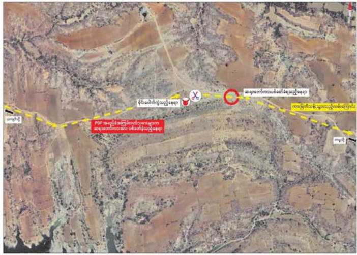
ဝင်းနိမ္မိတာရုံကျောင်းဆရာတော်များ စီးနင်းလိုက်ပါလာသည့် မော်တော်ယာဉ်တစ်စီးအား PDF အမည်ခံအကြမ်းဖက်သမားများက လက်နက်ငယ်များဖြင့် ပစ်ခတ်ခဲ့သည့်ဖြစ်စဉ်ပြပုံ။

ဖြစ်စဉ်တွင် ပျံလွန်တော်မူ ခဲ့သည့် ဆရာတော်၏ ရုပ်ကလာပ် တော်နှင့် ဒဏ်ရာရရှိထားသော ဆရာတော်၊ ယာဉ်မောင်းတို့အား မန္တလေးမြို့ တံတားဦးပြည်သူ့ ဆေးရုံမှ တစ်ဆင့် ဆေးကုသမှု ခံယူနေကြောင်း သိရှိရသည်။