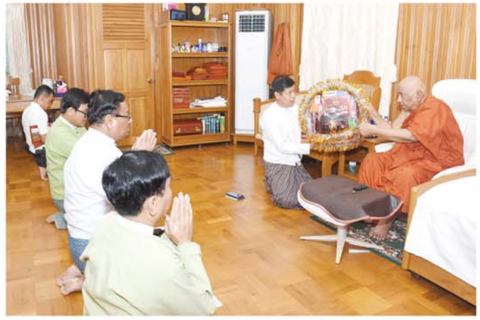
မန္တလေး၊ ဇွန် ၁၉