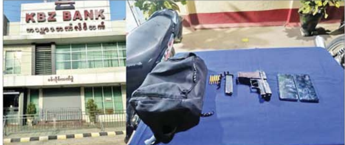
စစ်ကိုင်းတိုင်းဒေသကြီး စစ်ကိုင်းမြို့ ပန်းဘဲတန်းရပ်ကွက်ရှိ ကမ္ဘောဇဘဏ်(၁)ကို ဝင်ရောက်လုယက်စားပြုတိုက်ခဲ့သည့်အဖွဲ့အား လုံခြုံရေးတပ်ဖွဲ့ဝင်များက ဝင်ရောက် စီးနင်းဖမ်းဆီးခဲ့ရာမှ သက်သေခံပစ္စည်းများ သိမ်းဆည်းရမိမှု မှတ်တမ်းဓာတ်ပုံ။

ထိုသို့ဆောင်ရွက်ခဲ့ရာ ၁၀ မိနစ် ခန့်အကြာတွင် ပူးပေါင်းလှည့်ကင်း အဖွဲ့သည် ကမ္ဘောဇဘဏ် (၁)သို့ ရောက်ရှိပြီး ဝင်ရောက်စီးနင်း ဖမ်းဆီးရာ လုယက်စားပြုတိုက်သူ အကြမ်းဖက်သမား အမျိုးသား တစ်ဦးအား အသေဖမ်းဆီးရမိ သည့်အပြင် ၎င်းတို့ ဓားပြတိုက်