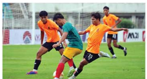
ဇွန် ၁၅ ရက်တွင် MNL Club ပြိုင်ကစားခဲ့ပြီး ၄ ဂိုး၊ ၂ ဂိုးဖြင့် ဒဂုံစတားအသင်းနှင့် ခြေစမ်းပွဲအနိုင်ရရှိထားသည်။ (NGB)

ပဏာမလက်ရွေးစင်မြန်မာယူ-၁၉ အသင်းနှင့် MNL Club ရတနာပုံ အသင်းတို့သည် ယနေ့ညနေပိုင်းက သုဝဏ္ဏကွင်းတွင် ခြေစမ်းပွဲ ယှဉ်ပြိုင်ကစားခဲ့ရာ မြန်မာယူ-၁၉ အသင်းက ၃ ဂိုး၊ ၁ ဂိုးဖြင့် အနိုင်ရရှိခဲ့သည်။ လာမည့် ဇူလိုင်လအတွင်း ကျင်းပမည့် အာဆီယံချန်ပီယံရှစ်ပြိုင်ပွဲအတွက် လေ့ကျင့်ပြိုင်ဆင်နေသည့် ယူ-၁၉အသင်းသည် ပြိုင်ပွဲအကြိုပြိုင်ဆင်မှုအဖြစ် ယခုလအစောပိုင်းက တရုတ်နိုင်ငံတွင် Joint Training သွားရောက်ခဲ့ပါသည်။ ပြီးခဲ့သည့်