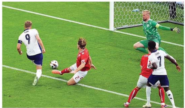
တိုက်စစ်မှု ပာယ်ရိုက်နိး အင်္ဂလန်အသင်းအတွက် ဦးဆောင်ပွဲ သွင်းယူနေစဉ်။