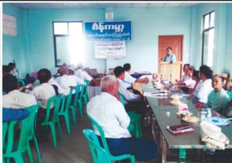
စီမံကိန်း အလင်းရောင်စာကြည့်တိုက် ဖွင့်ပွဲ ကျင်းပ

ဖွံ့ဖြိုးတိုးတက်ရေးလုပ်ငန်း စီမံကိန်း (VDP)ရန်ပုံငွေဖြင့် ကျေးရွာနေပြည်သူများ၏ လုပ်အား၊ ငွေအား ထည့်ဝင်မှုဖြင့် ကျေးရွာဖွံ့ဖြိုးရေးလုပ်ငန်းများကို မြို့နယ်ကျေးလက်ဒေသဖွံ့ဖြိုးတိုးတက်ရေးဦးစီးဌာနမှ ဝန်ထမ်းများ၏ နည်းပညာပံ့ပိုးမှုအနီးကပ်ကြီးကြပ်မှုတို့ဖြင့် ကျေးရွာသူ၊ ကျေးရွာသားများကိုယ်တိုင် အကောင်အထည်ဖော်ဆောင်ရွက်သွားမည်ဖြစ်ကြောင်း ဝမ်းတွင်းမြို့နယ် ကျေးလက်ဒေသဖွံ့ဖြိုးတိုးတက်ရေးဦးစီးဌာနမှ မြို့နယ်ဦးစီးမှူးက ပြောသည်။ (၀၄၀)