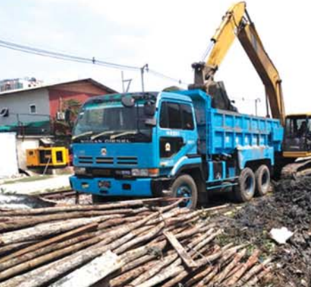
နေ့စဉ်ဆောင်ရွက်လျက်ရှိ

ကျောင်း၌ ဆယ်ယူရှင်းလင်းဆောင် ရွက်ကြသည်။ ချမ်းမြသာစည် မြို့နယ် သန့်ရှင်းရေးဌာန တာဝန် ရှိသူများသည် ၄၆ လမ်းအနောက် ဘက်ခြမ်းမြောင်း ရေစီးရေလာ ကောင်းမွန်ရေးအတွက် မြောင်း အတွင်းမှ အမှိုက်နှင့် မြောင်းစာ များကို Hitachi-70 ဘက်ဟိုး စက်အသုံးပြု၍ ၁၁၄ လမ်းနှင့် ၁၀၅ လမ်းကြား၌ ဆယ်ယူရှင်း လင်းခြင်းနှင့် ကန်သာယာ ရပ်ကွက် ရေစီးရေလာကောင်းမွန် ရေးအတွက် နဒီမြောင်းအတွင်းမှ ဒိုက်နှင့် နွဲများကို Longam စက်အသုံးပြု၍ ၁၁၂ လမ်းနှင့် ၁၁၃ လမ်းကြား၌ ဆယ်ယူ ရှင်းလင်းဆောင်ရွက်ခဲ့ကြသည်။ ပြည်ကြီးတံခွန်မြို့နယ် သန့်ရှင်း ရေးဌာန တာဝန်ရှိသူများသည် ၅၇ လမ်း အနောက်ဘက်ခြမ်း မြောင်း ရေစီးရေလာကောင်းမွန် ရေးအတွက် မြောင်းအတွင်းမှ အမှိုက်နှင့် မြောင်းစာများကို Takeuchi ဘက်ဟိုးစက်အသုံး ပြု၍ ၁၃၁ လမ်းနှင့် ၁၃၂ လမ်း ကြား၌ ဆယ်ယူရှင်းလင်းခြင်း၊ ၆၄ လမ်း အနောက်ဘက်ခြမ်း မြောင်း ရေစီးရေလာကောင်းမွန် ရေးအတွက် မြောင်းအတွင်းမှ အမှိုက်နှင့် မြောင်းစာများကို Hitachi ဘက်ဟိုးစက် အသုံး ပြု၍ ၆၁ လမ်းနှင့် ၆၂ လမ်း