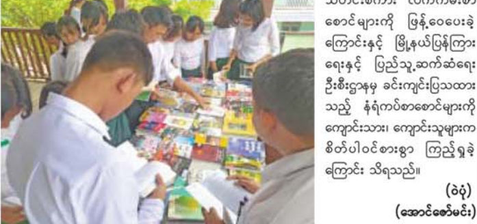
(ဝဲ) (အောင်စော်မင်း)

သွားမည်ဖြစ်ကြောင်း သိရသည်။ အဆိုပါ သင်တန်းသို့ ကျောက်ဆည်ခရိုင်ရုံးနှင့် ခရိုင်ကြီးကြပ်မှုအောက်ရှိ ကျောက်ဆည်၊ စဉ့်ကိုင်၊ မြစ်သား၊ တံတားဦးမြို့နယ်များရှိ ပြန်ကြားရေးနှင့်ပြည်သူ့ဆက်ဆံရေးဦးစီးဌာနမှ ဒုတိယဦးစီးများ၊ စာကြည့်တိုက်လက်ထောက်(၃)၊ ရုပ်သံကျွမ်းကျင်(၃)၊ အငယ်တန်းစာရေးများ တက်ရောက်ခဲ့ပြီး သင်တန်းအား ဇွန် ၂၀ ရက်မှ ၂၁ ရက်နေ့အထိ ၂ ရက်ကြာ စာတွေ့လက်တွေ့ စနစ်တကျ သင်ကြားပေးသွားမည်ဖြစ်ကြောင်း သိရသည်။ (၄၈၅)