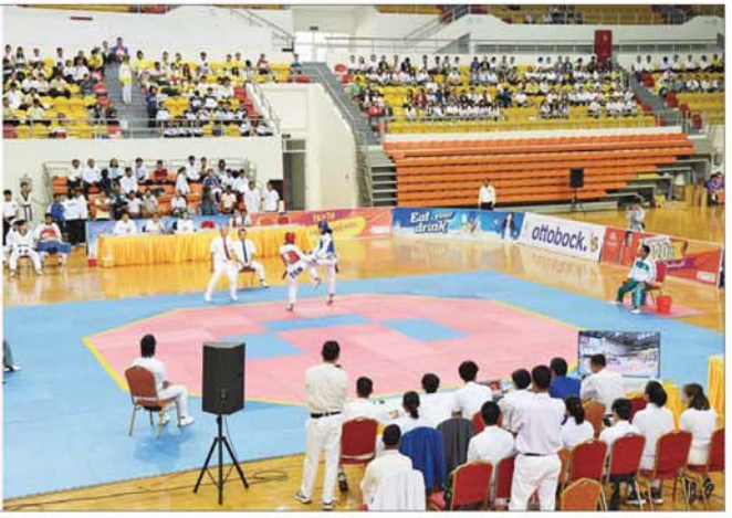
နိုင်ငံတော်စီမံအုပ်ချုပ်ရေးကောင်စီအဖွဲ့ဝင်များ ၂၀၂၄ ခုနှစ် ပြည်နယ်နှင့်တိုင်းဒေသကြီး တိုက်ကွမ်ဒိုပြိုင်ပွဲ ဗိုလ်လုပွဲအား ကြည့်ရှုအားပေးစဉ်။

၂၀၂၄ ခုနှစ် ပြည်နယ်နှင့် တိုင်းဒေသကြီး တိုက်ကွမ်ဒိုပြိုင်ပွဲ ဗိုလ်လုပွဲနှင့် ဆုချီးမြှင့်ပွဲအခမ်းအနားသို့ တက်ရောက်လာကြ များအဖြစ် ကိုလိုတန်းအလိုက် အမျိုးသား၊ အမျိုးသမီး အတိုက် ပြိုင်ပွဲများ ယှဉ်ပြိုင်ကစားနေမှုကို ကြည့်ရှုအားပေးကြသည်။ ထို့နောက် ဆုချီးမြှင့်ပွဲကို ကျင်းပရာ ပြည်ထောင်စုဝန်ကြီး Jeng Phang နော်တောင်၊ ဦးမင်းသိန်းနှင့် ဒေါက်တာမျိုးသိန်းကျော်တို့က အမျိုးသမီး ၄၉-၅၃ ကီလိုတန်း အတိုက်ပြိုင်ပွဲ၊ အမျိုးသား ၆၈-၇၄ ကီလိုတန်း အတိုက်ပြိုင်ပွဲနှင့် အမျိုးသမီး ၄၃-၄၆ ကီလိုတန်း အတိုက်ပြိုင်ပွဲတွင် ပထမ၊ ဒုတိယ၊ တတိယနှင့် ပူးတွဲတတိယဆု ရရှိကြသူများကို ဂုဏ်ပြုဆုတံဆိပ်နှင့် ဂုဏ်ပြုဆု ငွေများ ပေးအပ်ချီးမြှင့်ကြသည်။ ယင်းနောက် နိုင်ငံတော်စီမံအုပ်ချုပ်ရေး ကောင်စီအဖွဲ့ဝင် ဦးရန်ကျော်၊ ဦးရွှေကြိမ်းနှင့် ခွန်စံလွင်တို့က အမျိုးသား ၄၆-၅၀ ကီလိုတန်း အတိုက်ပြိုင်ပွဲ၊ အမျိုးသား ၅၀-၅၄ ကီလိုတန်း အတိုက်ပြိုင်ပွဲနှင့် အမျိုးသား ၅၄-၅၈ ကီလိုတန်း အတိုက်ပြိုင်ပွဲတွင် ပထမ၊ ဒုတိယ၊ တတိယနှင့်