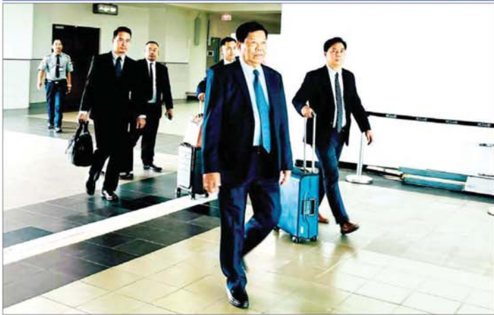
နေပြည်တော် ဇွန် ၂၁ ဒုတိယဝန်ကြီးချုပ်နှင့် နိုင်ငံခြားရေးဝန်ကြီးဌာန ပြည်ထောင်စုဝန်ကြီး ဦးသန်းဆွေ ဦးဆောင်သည့် မြန်မာကိုယ်စားလှယ် အဖွဲ့သည် အီရန်အစွလာမ်မစ် သမ္မတနိုင်ငံ တီဟီရန်မြို့၌ ကျင်းပမည့် အာရှပူးပေါင်း ဆောင်ရွက်ရေးဆိုင်ရာ ဆွေးနွေးပွဲအဖွဲ့ (အေစီဒီ) အဖွဲ့ဝင် နိုင်ငံများ၏ (၁၇) ကြိမ်မြောက် နိုင်ငံခြားရေးဝန်ကြီးများ အစည်းအဝေးသို့ ပါဝင်တက်ရောက်ရန် အတွက် ယနေ့နံနက်ပိုင်းတွင် လေကြောင်းခရီးဖြင့် မန္တလေး အပြည်ပြည်ဆိုင်ရာ လေဆိပ်မှ အီရန်အစွလာမ်မစ်သမ္မတနိုင်ငံသို့ ထွက်ခွာသွားကြောင်း သိရသည်။ သတင်းစဉ်