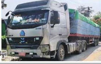
မန္တလေးတိုင်းဒေသကြီး၌ ဖမ်းဆီးရမိမှု။