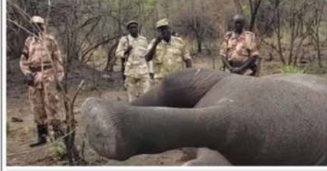
တောင်ဆူဒန်ရှိ နီမူလေအမျိုးသားဥယျာဉ်အတွင်း၌ ဆင်စွယ်ရယူ ရန် တရားမဝင်သတ်ဖြတ်ခံခဲ့ရသည့် ဆင်တစ်ကောင်ကို အစိုးရသစ် တောအရာရှိများ စစ်ဆေးကြည့်ရှုနေကြစဉ်။

တက္ကသိုလ်၊ ကောလိပ်များတွင် ဆေးကျောင်းသား ၁၀၀၀၀၀ ဦး ခေါ်ယူမည်ဖြစ်ပြီး ဝင်ခွင့်ဖြေဆို သူပေါင်း ၂ ဒသမ ၄ သန်းခန့် ရှိခဲ့သည်။ တက္ကသိုလ်၊ ကောလိပ်ဝင် ခွင့်စာမေးပွဲများ၌ အမှတ်ပေးရာ တွင်လည်း စာစစ်သူများ အင်္ဂတီ လိုက်စားမှုရှိခဲ့သည်ဟု မကျေနပ် သော ကျောင်းသား၊ ကျောင်းသူ များက တိုင်ကြားခဲ့ကြောင်းသိရ သည်။ Mon