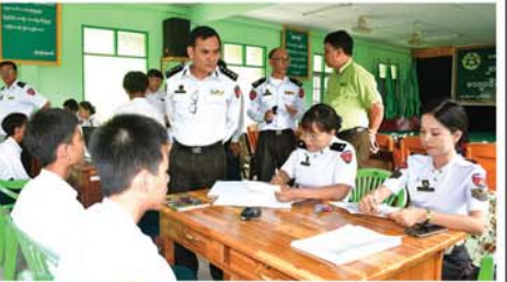
နိုင်ငံသားစိစစ်ရေးကော်မရှင်း ကွင်းဆင်းဆောင်ရွက်

ပဲခူးမြို့ ဝင်းနိမ္မိတာရုံကျောင်းဆရာတော် ဘဒ္ဒန္တမုနိန္ဒာဘိဝံသ ပျံလွန်တော်မူခဲ့ရသည့် ဖြစ်စဉ်နှင့်ပတ်သက်၍ ဖြစ်စဉ်မှန်ပေါ်ပေါက်ရေး စိစစ်ဖော်ထုတ်လျက်ရှိ