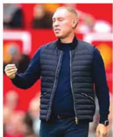
အဆိုပါနည်းပြသည် နည်းပြဘဝတစ်လျှောက်တွင် ဆွစ်ဇာလ်၊ နော်ဝေတင်ဟမ်ဗောဂရစ်၊ အင်္ဂလန် U-16၊ အင်္ဂလန် U-17 အသင်းများအား ကိုင်တွယ်ပြီး အတွေ့အကြုံရှိသည့် နည်းပြတစ်ဦးဖြစ်ခြင်းကြောင့် လက်စတာစီးတီးအသင်းက နည်းပြသစ်အဖြစ် ခန့်အပ်ခဲ့ခြင်း ဖြစ်သည်။