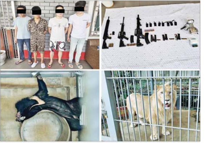
တာချီလိတ်မြို့နယ်၌ မြန်မာနိုင်ငံအတွင်း တရားမဝင် ဝင်ရောက်နေထိုင်လျက်ရှိသော တရုတ်နိုင်ငံသား လေးဦးအား လက်နက်၊ ခဲယမ်းများ၊ ဆက်သွယ်ရေးစက်များ၊ မူးယစ်ဆေးဝါးများ၊ တရားမဝင် လက်ဝယ်ထားရှိသည့် တောရိုင်းတိရစ္ဆာန်များနှင့်အတူ ဖမ်းဆီးရမိမှုမှတ်တမ်းဓာတ်ပုံ။