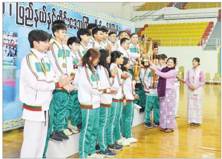
နိုင်ငံတော်စီမံအုပ်ချုပ်ရေးကောင်စီအဖွဲ့ဝင် ဒေါ်ဒွေဘူ စုပေါင်းတံခွန်စိုက်ဆုလားရရှိသည့် ရန်ကုန်တိုင်း ဒေသကြီးအသင်းကို စုပေါင်းတံခွန်စိုက်ဆုလား ပေးအပ်ချီးမြှင့်စဉ်။

ဒေါ်ဒွေဘူက စုပေါင်းတံခွန်စိုက် ဆုလားရရှိသည့် ရန်ကုန်တိုင်း ဒေသကြီးအသင်းကို စုပေါင်း တံခွန်စိုက်ဆုလား ပေးအပ် ချီးမြှင့်သည်။ ၂၀၂၄ ခုနှစ် ပြည်နယ်နှင့် တိုင်း ဒေသကြီး တိုက်ကွမ်ဒိုပြိုင်ပွဲကို ပြည်နယ်နှင့် တိုင်းဒေသကြီးများမှ အားကစားသမားများ ချစ်ကြည် ရင်းနှီးမှုရရှိစေရန်၊ ပြည်ထောင်စု စိတ်ဓာတ် မြှင့်မားလာစေရန်နှင့် အပြည်ပြည်ဆိုင်ရာ တိုက်ကွမ်ဒို ပြိုင်ပွဲများတွင် နိုင်ငံ့ဂုဏ်ကို ဆောင်နိုင်မည့် ထူးချွန်ထက်မြက် သည့် မျိုးဆက်သစ်အားကစား သမားများ ပေါ်ထွက်လာစေရန် ရည်ရွယ်၍ ဇွန် ၁၇ ရက်မှ ၂၁ ရက် အထိ ဝဏ္ဏသိဒ္ဓိအားကစားရုံ(A)၌ ကျင်းပပေးခဲ့ခြင်း ဖြစ်ပြီး ပြည်နယ်နှင့် တိုင်းဒေသကြီးများမှ ပြိုင်ပွဲဝင်အမျိုးသားအသင်း ၁၅ သင်းနှင့် အမျိုးသမီးအသင်း ၁၅ သင်းတို့မှ အားကစားသမားစုစု ပေါင်း ၂၆၃ ဦး ပါဝင်ယှဉ်ပြိုင်ခဲ့ကြ ကြောင်း သိရသည်။ သတင်းစဉ်