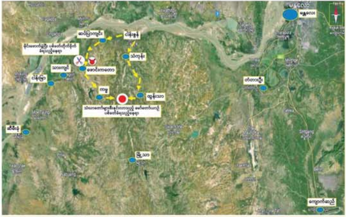
၂၀၂၄ ခုနှစ် ဇွန်လ ၁၉ ရက်နေ့ ငါးဖွေး- မြို့သာဒေသဖြစ်စဉ် ပြပုံ။