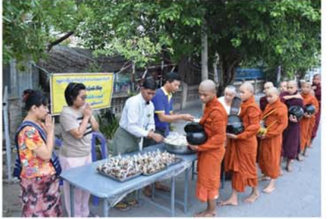
မန္တလေးမြို့တော်စည်ပင်သာယာရေးကော်မတီ မဟာပြိုင်ဝန်ထမ်းအိမ်ရာမိသားစု ဘုံဆွမ်းလောင်းလှူကြွယ်ပွဲ

မန္တလေး ဇွန် ၂၄ ဆရာတော်ကြီး ဘဒ္ဒန္တတိက္ကဋ္ဌ ဦးဆောင်သော နယ်စပ်၊ တောင်တန်းနှင့် ကမ်းရိုးတန်းဒေသ ဗုဒ္ဓဘာသာပြန့်ပွားရေးအသင်းချုပ် (မန္တလေး) သည် မြန်မာနိုင်ငံ တစ်ဝန်းရှိ လေးလံခေါင်ဖျားပြီး သွားလာရခက်ခဲသော နယ်စပ်၊ တောင်တန်းဒေသနှင့် ကမ်းရိုးတန်းဒေသတွင် သာသနာပြုနေသော ဘုန်းကြီးကျောင်း ၁၇၀ ကျောင်းမှ သီတင်းသုံးနေသော သံဃာတော်များကို ဝါဆိုဆန်နှင့် ဝါဆိုသင်္ကန်းများ လှူဒါန်းမည်ဖြစ်ကြောင်း သိရသည်။