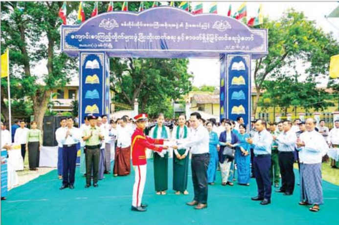
ပြည်ထောင်စုဝန်ကြီး ဦးမောင်မောင်အုန်း ပန်းဖွားအဖွဲ့နှင့် တင်ခရာအဖွဲ့တို့ကို ဂုဏ်ပြုချီးမြှင့်ငွေ များပေးအပ်စဉ်။

ကျောင်းစာကြည့်တိုက်များ ဖွံ့ဖြိုးတိုးတက်ရေးနှင့် ကျောင်းသား ကျောင်းသူများ စာအုပ်စာပေ လေ့လာဖတ်ရှုနိုင်ရန်နှင့် စာပေလေ့လာဖတ်ခြင်းမှ ရရှိသော အသိပညာဗဟုသုတများကို ပြန်လည် အသုံးပြုနိုင်ရန် ရည်ရွယ်၍ ကျောင်းစာကြည့် တိုက်များ ဖွံ့ဖြိုးတိုးတက်ရေးနှင့် စာဖတ်ရရှိနိုင်ခြင်း ပုံစံတော် ဖွင့်ပွဲအခမ်းအနားကို ယနေ့နံနက်ပိုင်းတွင် စစ်ကိုင်းမြို့ အမှတ်(၁) အခြေခံပညာအထက်တန်း ကျောင်း၌ ကျင်းပရာ ပြန်ကြားရေးဝန်ကြီးဌာန ပြည်ထောင်စုဝန်ကြီး ဦးမောင်မောင်အုန်းနှင့် စစ်ကိုင်း တိုင်းဒေသကြီးဝန်ကြီးချုပ် ဦးမြတ်ကျော်တို့ တက်ရောက်အားပေးသည်။