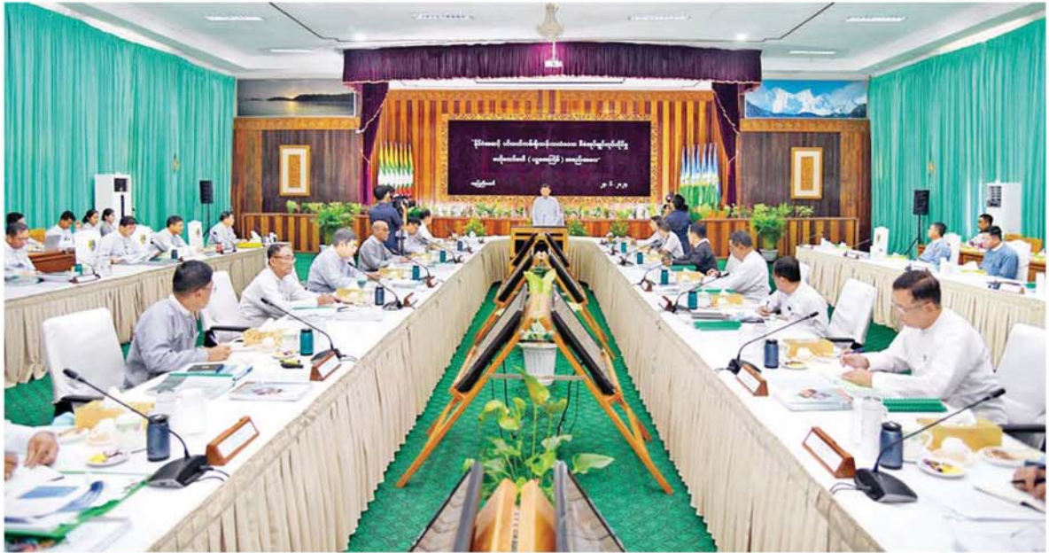
နိုင်ငံတော်စီမံအုပ်ချုပ်ရေးကောင်စီအဖွဲ့ဝင် ဒုတိယဝန်ကြီးချုပ်နှင့် ပြည်ထောင်စုဝန်ကြီး ဝိုင်းချုပ်ကြီး မြထွန်းဦး နိုင်ငံအဆင့်ပင်လယ်ကမ်းရိုးတန်း သယ်စာတစ်စုံအုပ်ချုပ်လုပ်ကိုင်မှုဗဟိုကော်မတီ(ပဉ္စမအကြိမ်)အစည်းအဝေးတွင် အမှာစကားပြောကြားစဉ်။

နေပြည်တော် ၅.၄.၂၄ နိုင်ငံအဆင့် ပင်လယ်ကမ်းရိုးတန်းသယ်စာတစ်စုံအပြင် လုပ်ကိုင်မှုဗဟိုကော်မတီ၏(ပဉ္စမအကြိမ်)အစည်းအဝေးကို ယနေ့ ဖွန်းလွှဲပိုင်းတွင် နေပြည်တော်ရှိ သယ်စာတစ်ခု သဘာဝပတ်ဝန်းကျင်ထိန်းသိမ်းရေးဝန်ကြီးဌာန သစ်တောဦးစီးဌာန အင်ကြင်းခန်းမ၌ ကျင်းပရာ နိုင်ငံအဆင့် ပင်လယ်ကမ်းရိုးတန်းသယ်စာတစ်စုံအပြင်လုပ်ကိုင်မှု ဗဟိုကော်မတီဝဌာန နိုင်ငံတော်စီမံအုပ်ချုပ်ရေးကော်မတီအဖွဲ့ဝင် ဒုတိယဝန်ကြီးချုပ်နှင့် ပို့ဆောင်ရေးနှင့် ဆက်သွယ်ရေးဝန်ကြီးဌာန ပြည်ထောင်စုဝန်ကြီး ဝိုင်းချုပ်ကြီး မြထွန်းဦး တက်ရောက်အမှာစကားပြောကြားသည်။