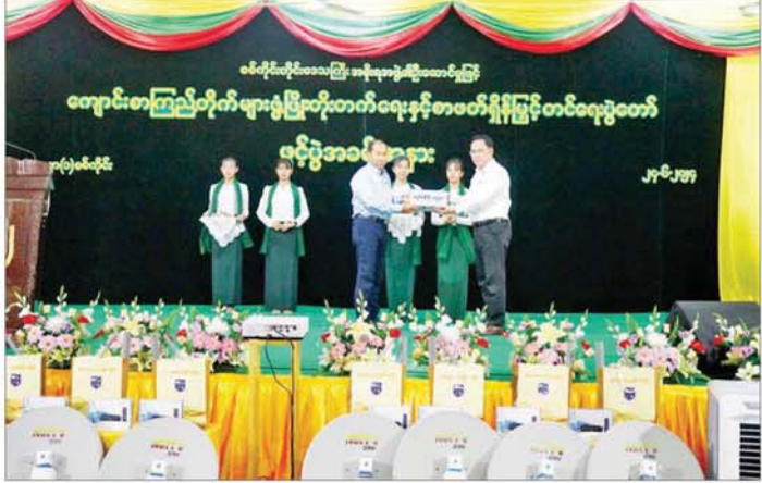
ပြည်ထောင်စုဝန်ကြီး ဦးမောင်မောင်အုန်း ကျေးရွာစာကြည့်တိုက်များ ဆောက်လုပ်နိုင်ရေး အလှူငွေ ပေးအပ်လှူဒါန်းရာ တိုင်းဒေသကြီးဝန်ကြီးချုပ် ဦးမြတ်ကျော်က လက်ခံရယူစဉ်။

ဆွေးနွေးပြောကြား ထို့နောက် ပြည်ထောင်စုဝန်ကြီးနှင့် တိုင်းဒေသ ကြီးဝန်ကြီးချုပ်တို့သည် စစ်ကိုင်းတောင်ရိုးရှိ ဆွမ်းဦးပညာရှင်စေတီတော်ကြီးအား သွားရောက် ဖူးမြော်ကြည့်ရှု၍ စေတီတော်ကြီး လုံးတော်ပြည့် ရွှေသင်္ကန်း ကပ်လှူပူဇော်ရေးကော်မရှုများနှင့် ပတ်သက်၍ ကူညီဆောင်ရွက်ပေးနိုင်မည့်အခြေ အနေများကို ဆွေးနွေးပြောကြားသည်။ ဆွမ်းဦးပညာ ရှင်စေတီတော်ကြီးကို လွန်ခဲ့သော ကိုးနှစ်ခန့်က လုံးတော်ပြည့် ရွှေသင်္ကန်းကပ်လှူပူဇော်ခဲ့ပြီး ယခုအခါ ရွှေသင်္ကန်းပြန်လည်ကပ်လှူပူဇော်ရန် အတွက် စစ်ကိုင်းတိုင်းဒေသကြီးအစိုးရအဖွဲ့က စီစဉ်ဆောင်ရွက်လျက်ရှိကြောင်းနှင့် စေတီတော်ကြီး သို့ လာရောက်သည့် ဘုရားဖူးပြည်သူများ အဆင် ပြေစွာ တည်းခိုနိုင်ရေးအတွက် ရွှေတောင်ရိုး မိုတယ် ဖွင့်လှစ်၍ စီစဉ်ဆောင်ရွက်ပေးလျက်ရှိကြောင်း သိရသည်။ သတင်းစဉ်