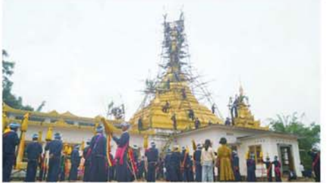
တော်များကို နာယုမုတ်သားကာ မိမိတို့ပြုလုပ်သည့် ကုသိုလ်တော်ကောင်းမှုအတွက် ရေစက်သွန်းချအမျှပေးစေသည်။ အဆိုပါ ရွှေဘုန်းပွင့်စေတီတော်၌ ကျင်းပသည့် အသံမစ်မဟာပဋ္ဌာန်း၊ မဟာသမယသုတ်ရွတ်ဖတ်ပူဇော်ပွဲကို အကြိမ်(၃၀) မြောက် ပြည့်မြောက်ကျင်းပခဲ့ပြီဖြစ်ကြောင်း သိရသည်။ (အပေါ်ပုံ) (ကဆ)

နောင်တရား ဇွန် ၂၄ ရှမ်းပြည်နယ်(တောင်ပိုင်း)၊ ပအိုဝ်းကိုယ်ပိုင်အုပ်ချုပ်ခွင့်ရဒေသ၊ နောင်တရားမြို့၌ ရတနာရန်နိုင်စေတီတော် ထီးတော်တင်လှူပူဇော်ပွဲကို နယုန်လပြည့် နံနက် ၈ နာရီခွဲတွင် ဆရာတော်ကြီးများနှင့် အလှူဒါယကာ၊ ဒါယိကာမများက ထီးတော်တင်လှူပူဇော်ပွဲကို ရတနာရန်နိုင်စေတီတော်၌ ကျင်းပခဲ့ကြောင်း သိရသည်။