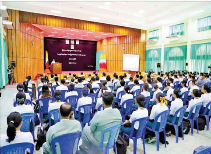
မဲစာရင်းများကို သမားရိုးကျနည်းလမ်းများဖြင့်သာ ရွေးကောက်ပွဲတွင် မဲစာရင်းများပြုစုခြင်းကို ရေးသွင်းပြုစုခဲ့ကြကြောင်း၊ ၂၀၁၄ ခုနှစ် အထွေထွေ ကွန်ပျူတာဆောင်ပုံနှင့် စတင်အသုံးပြုရန် ကြိုးပမ်း

ထပ်မံပြည့်သွင်းဆောင်ရွက်ပေးသွားမည့် ဦးစွာ ပြည်ထောင်စုရွေးကောက်ပွဲကော်မရှင် ဥက္ကဋ္ဌ ဦးကိုကိုက ပထမအကြိမ်ဆွေးနွေးပွဲသို့ တက်ရောက်ခဲ့ကြသည့် ဝန်ထမ်းများအနေဖြင့် မဲဆန္ဒရှင်စာရင်းစီမံခန့်ခွဲမှုစနစ်နှင့် စပ်လျဉ်းပြီး အတွေ့အကြုံကောင်းများ၊ အထောက်အကူကောင်းများ ရရှိခဲ့ကြကြောင်း၊ အလုပ်ရုံဆွေးနွေးပွဲသို့ တက်ရောက်ခဲ့ကြသည့် ဝန်ထမ်းများ၏ တွေ့ကြုံနေရသည့် အခက်အခဲများ၊ အကြံဉာဏ်များကို ရယူပြီး မဲဆန္ဒရှင်စာရင်းစီမံခန့်ခွဲမှုစနစ်၏ နည်းပညာပိုင်းဆိုင်ရာအလုပ်ချက်များလည်း ထပ်မံပြည့်သွင်းဆောင်ရွက်ပေးသွားမည်ဖြစ်ကြောင်း၊ ကျင်းပပြီးစီးခဲ့သည့် ၂၀၁၀ ပြည့်နှစ် အထွေထွေရွေးကောက်ပွဲတွင်