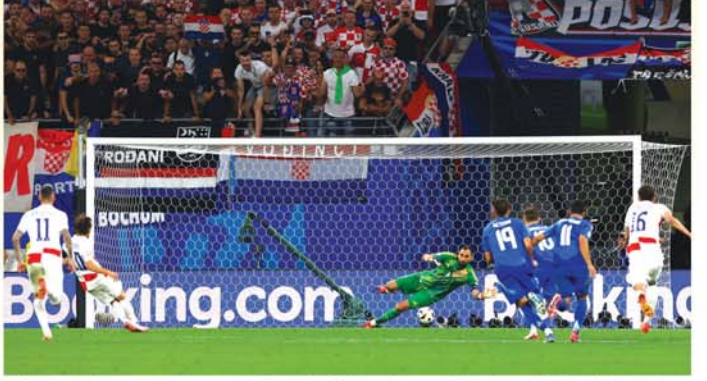
အယ်လ်ဘားနီးယားအသင်းမှာမူ ရမှတ် ၁မှတ်တို့ဖြင့် အုပ်စု အဆင့်မှပင် လှည့်ပြန်ခဲ့ရပြီဖြစ်သည်။ နိုင်ကမ္ဘာ

ဂျာမနီနိုင်ငံက အိမ်ရှင်အဖြစ် လက်ခံကျင်းပသည့် ယူရို ၂၀၂၄ ဥရောပဖလား ဘောလုံးပြိုင်ပွဲ၊ အုပ်စု(ခ)ပွဲစဉ်အဖြစ် မြန်မာစံတော်ချိန် နံနက် ၁နာရီ ၃၀မိနစ်က ဂျာမနီနိုင်ငံ၊ ဒပ်ဆဲလ်ဒေါ့မြို့၊ ဒပ်ဆဲလ်ဒေါ့ဘောလုံးကွင်းတွင် စပိန်အသင်းနှင့် အယ်လ်ဘားနီးယားအသင်းတို့ ယှဉ်ပြိုင်ကစားကြရာ စပိန်အသင်းက အယ်လ်ဘားနီးယားအသင်းအား တစ်ဂိုး၊ ဂိုးမရှိဖြင့် အနိုင်ရရှိခဲ့သည်။ စပိန်အသင်းအတွက် သွင်းဂိုးကို ပွဲချိန် ၃၀မိနစ်တွင် ဖာရန်တောရက်စ်က လှလှပပသွင်းယူပေးခဲ့ သည်။ ဂျာမနီနိုင်ငံ၊ လိုက်ပဇစ်မြို့၊ လိုက်ပဇစ်ဘောလုံးကွင်းတွင် မြန်မာစံတော်ချိန် နံနက် ၁နာရီ ၃၀မိနစ် က ခရိုအေးရှားအသင်းနှင့် အီတလီအသင်းတို့ ယှဉ်ပြိုင်ကစားကြရာ တစ်ဖက်တစ်ရိုးဖြင့် သရေရလဒ်သာ ထွက်ပေါ်ခဲ့သည်။ ခရိုအေးရှားအသင်းအတွက် သွင်းဂိုးတစ်ဂိုးကို ပွဲချိန် ၅၅မိနစ်တွင် လူကာမိုဒရစ်က သွင်းယူပေးခဲ့ပြီး၊ အီတလီအသင်းအတွက် သွင်းဂိုးတစ်ဂိုးကို ပွဲချိန် ၉၈မိနစ်တွင် ဇက်ကာနီက သွင်းယူပေးခဲ့သည်။ ယူရို ၂၀၂၄ ဥရောပဖလား ဘောလုံးပြိုင်ပွဲ၊ အုပ်စု(ခ)ပွဲစဉ်အားလုံးကစားအပြီးတွင် စပိန်အသင်းက ရမှတ် ၉မှတ် အုပ်စုပထမဖြင့် ၁၆သင်းအဆင့် တက်ရောက်ခဲ့သလို၊ အီတလီအသင်းက ရမှတ် ၄ မှတ် အုပ်စုဒုတိယဖြင့် ၁၆သင်းအဆင့်တက်ရောက်နိုင်ခဲ့ပြီး၊ ခရိုအေးရှားအသင်းသည်လည်း ရမှတ် ၂မှတ်၊