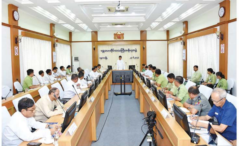
မူရမြို့ပြပွဲပြီးရေးစီမံကိန်းနှင့် ပတ်သက်၍ ရှင်းလင်းတင်ပြရာ တိုင်းဒေသကြီးအစိုးရအဖွဲ့ဝန်ကြီးများက ဖြည့်စွက်ဆွေး နွေးပြီး တိုင်းဒေသကြီးဝန်ကြီး ခုံရုံးချုပ်စကားပြောကြားခဲ့ ကြောင်း သိရသည်။ (မန္တလေးနေ့စဉ်) ၀-၀-၀-၀

ကို အထောက်အကူပြုသည့် တိုင်းဒေသကြီးအတွင်း ရင်းနှီး မြှုပ်နှံမှုကဏ္ဍများတွင် ရင်းနှီး မြှုပ်နှံမှုလုပ်ငန်းများ ဖွံ့ဖြိုးတိုး တက်စေရန်၊ ပိုမိုအားကောင်း လာစေရန် လုပ်ငန်းရှင်များအား ရင်းနှီးမြှုပ်နှံမှု လုပ်ငန်းနှင့် ပတ် သက်၍ အခက်အခဲမဖြစ်စေရန် ဥပဒေ၊ နည်းဥပဒေ၊ ညွှန်ကြား ချက်များ၊ လုပ်ထုံးလုပ်နည်းများ နှင့်အညီ အလေးထားဆောင် ရွက်ပေးနေပါကြောင်း၊ ယခု စီမံကိန်းနှင့်ပတ်သက်၍ ယခင် ခွင့်ပြုခဲ့မှု၊ ယခုဆောင်ရွက်နေမှု နှင့် ဆက်လက်ဆောင်ရွက်မည့် အစီအစဉ်များအား တင်ပြ ချက် တောင်းခံသွားမည်ဖြစ်ပါ ကြောင်း ပြောကြားခဲ့သည်။ ၎င်းနောက် အမရပူရမြို့ပြ စီမံကိန်းအထောက်အကူပြု ကော်မတီဥက္ကဋ္ဌ တိုင်းဒေသကြီး အစိုးရအဖွဲ့၊ စည်ပင်သာယာရေး ဝန်ကြီးနှင့် အဖွဲ့ဝင်များက အမရ