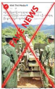
အကြမ်းဖက် လုပ်ငန်းများ လုပ်ဆောင်ရန် PDF အမည်ခံ အကြမ်းဖက်သမားများ ဇွန် ၂၃ ရက် ၂၁ ဝ နာရီခန့်က ရောက်ရှိ

နေပြည်တော် ဇွန် ၂၅ မန္တလေးတိုင်းဒေသကြီး စဉ်ကူးမြို့နယ်ရှိကျေးရွာများကို ဇွန် ၂၃ ရက်က လုံခြုံရေးတပ်ဖွဲ့ဝင်များက လက်နက်ကြီးများဖြင့် ပစ်ခတ်မှုကြောင့် မြသီတာကျေးရွာမှ ဒေသခံပြည်သူများ ထိခိုက်ဒဏ်ရာရရှိခဲ့ကြောင်း မဟုတ်မမှန် စွပ်စွဲရေးသားထားသည့် သတင်းတု၊ သတင်းအမှားများကို တရားမဝင် ပြည်ဖျက်မီဒီယာများက ပြည်သူများ အထင်အမြင်လွှဲမှားစေရန် လှုံ့ဆော်ဝါဒဖြန့်ဝေနေသည်ကို တွေ့ရှိရသည်။ ဖြစ်စဉ်အမှန်မှာ စဉ်ကူးမြို့နယ်အတွင်းရှိ ကျေးရွာအချို့တွင်