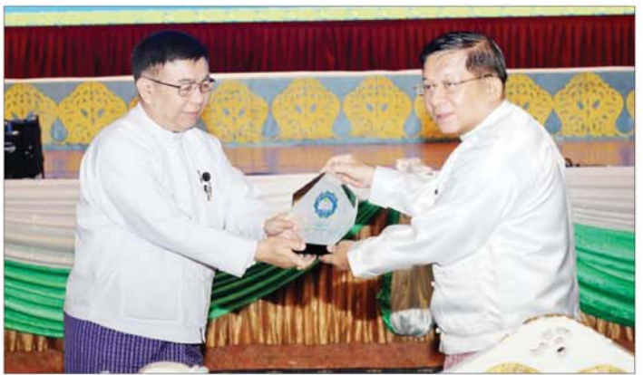
နိုင်ငံတော်စီမံအုပ်ချုပ်ရေးကောင်စီဥက္ကဋ္ဌ နိုင်ငံတော်ဝန်ကြီးချုပ် ဗိုလ်ချုပ်မှူးကြီးမင်းအောင်လှိုင် ထံ ပြည်ထောင်စုဝန်ကြီး ဒေါက်တာညွန့်ဖေက မြန်မာနိုင်ငံလုံးဆိုင်ရာပညာရေးညီလာခံ (၂၀၂၄) အထိမ်းအမှတ်လက်ဆောင်ကို ဂါရဝပြုပေးအပ်စဉ်။

ဒီမိုကရေစီ နိုင်ငံတော်ကြီးကို တည်ဆောက်သွားနိုင်ရန် ယခု ညီလာခံကို တက်ရောက်လာသည့် ပညာရှင်များအားလုံးက "လူ့စွမ်း အားအရင်းအမြစ် ဖွံ့ဖြိုးတိုးတက် ရေး ပညာရေးကို ပိုမိုမြှင့်တင်ပေး" ဆိုသည့် ဦးတည်ချက်နှင့် ဖတ်ကြား ဆွေးနွေးကြမည့် ညီလာခံစာတမ်း ၃၆ စောင်အပေါ် အခြေပြုညှိနှိုင်း ဆွေးနွေးအခြေပြုကာ ရေတို ရေရှည် လုပ်ငန်းအစီအမံများ ချမှတ်ပြီး အောင်မြင်အောင် အကောင်အထည်ဖော်ဆောင်ရွက် သွားနိုင်ကြပါစေဟု ဆန္ဒရှိကြောင်း တောင်းပင်ကြောင်း ပြောကြား သည်။ ထို့နောက် ပြန်ကြားရေး ဝန်ကြီးဌာန မြန်မာအသံနှင့် ရုပ်မြင်သံကြား ပြည်သူ့ဆက်ဆံ ရေးနှင့် စိတ်ဓာတ်စစ်ဆင်ရေး ညွှန်ကြားရေးမှူးရုံး ကွပ်ကဲမှု အောက်ရှိ မြဝတီရုပ်မြင်သံကြား