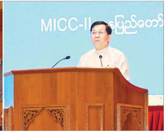
နိုင်ငံတော်စီမံအုပ်ချုပ်ရေးကောင်စီဥက္ကဋ္ဌ နိုင်ငံတော်ဝန်ကြီးချုပ် ဗိုလ်ချုပ်မှူးကြီး မင်းအောင်လှိုင် မြန်မာနိုင်ငံလုံးဆိုင်ရာ ပညာရေးညီလာခံ (၂၀၂၄) ဖွင့်ပွဲအခမ်းအနားတွင် မိန့်ခွန်းပြောကြားစဉ်။