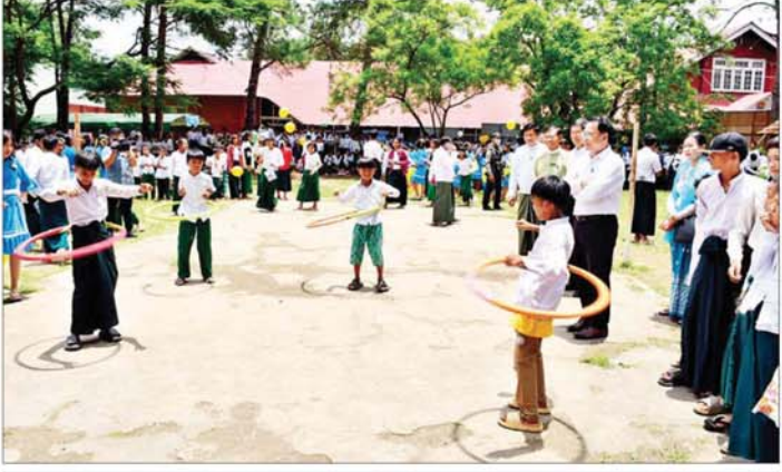
ပြည်ထောင်စုဝန်ကြီး ဦးမောင်မောင်အုန်း ကျောင်းစာကြည့်တိုက်များ ဖွံ့ဖြိုးတိုးတက်ရေးနှင့် စာဖတ်ရန်မြှင့်တင်ရေးပွဲတော်အခမ်းအနားတွင် ကမ်းပြင်ပွဲများ ကျင်းပနေမှုကို ကြည့်ရှုအားပေးစဉ်။