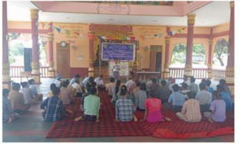
(VDP) စီမံကိန်း မိတ်ဆက်လှမ်းလင်းခြင်းနှင့် ကော်မတီဖွဲ့စည်း