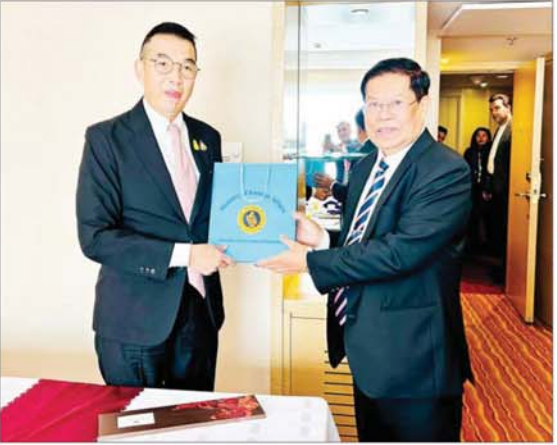
ဒုတိယဝန်ကြီးချုပ်နှင့် နိုင်ငံခြားရေးဝန်ကြီးဌာန ပြည်ထောင်စုဝန်ကြီး ဦးသန်းဆွေ ထိုင်းနိုင်ငံခြားရေးဝန်ကြီး မစ္စတာ မာရစ်ဆတ်ဇီယမ်ဖုန်နှင့် တွေ့ဆုံ ဆွေးနွေးပြီးနောက် အမှတ်တရလက်ဆောင်ပစ္စည်းပေးအပ်စဉ်။

တီဟီရန် ဇွန် ၂၅ (၁၉) ကြိမ်မြောက် အာရှပူးပေါင်းဆောင်ရွက်ရေးဆိုင်ရာ ဆွေးနွေးပွဲအဖွဲ့ (အေစီဒီ) ၏ နိုင်ငံခြားရေးဝန်ကြီးများ အစည်းအဝေးသို့ တက်ရောက်ရန် တီဟီရန် မြို့၌ ရောက်ရှိနေသည့် ဒုတိယဝန်ကြီးချုပ်နှင့် နိုင်ငံခြားရေးဝန်ကြီးဌာန ပြည်ထောင်စုဝန်ကြီး ဦးသန်းဆွေသည် ဇွန် ၂၄ ရက် ဒေသစံတော်ချိန် နံနက် ၈ နာရီတွင် ထိုင်းနိုင်ငံ နိုင်ငံခြားရေးဝန်ကြီး Mr. Maris Sangiampongsa နှင့်လည်းကောင်း၊ ဒေသစံတော်ချိန် ညနေ ၃ နာရီခွဲတွင် နီပေါနိုင်ငံ ဒုတိယဝန်ကြီးချုပ်နှင့် နိုင်ငံခြားရေးဝန်ကြီး Mr. Narayan Kaji Shrestha Prakash နှင့် လည်းကောင်း၊ ဒေသစံတော်ချိန် ညနေ ၄ နာရီခွဲတွင် ကာတာနိုင်ငံ State Minister of Foreign Affairs Mr. Soltan Saad S. K. Al-Moraihi နှင့်လည်းကောင်း တီဟီရန်မြို့ရှိ ပါရနီအစာဒီဟိုတယ်၌ သီးခြားစီ တွေ့ဆုံသည်။