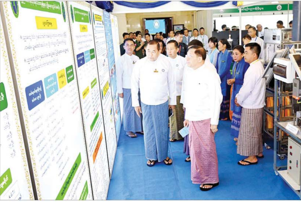
နိုင်ငံတော်စီမံအုပ်ချုပ်ရေးကောင်စီဥက္ကဋ္ဌ နိုင်ငံတော်ဝန်ကြီးချုပ် ဗိုလ်ချုပ်မှူးကြီး မင်းအောင်လှိုင် မြန်မာနိုင်ငံလုံးဆိုင်ရာပညာရေးညီလာခံ(၂၀၂၄) အထိမ်းအမှတ်ပြခန်းများကို စိတ်ပါဝင်စားစွာ လိုက်လံကြည့်ရှုစဉ်။

ဦးစွာ မြန်မာနိုင်ငံလုံးဆိုင်ရာ ပညာရေးညီလာခံ(၂၀၂၄) ကျင်းပရေးဦးစီးကော်မတီဥက္ကဋ္ဌ နိုင်ငံတော်စီမံအုပ်ချုပ်ရေးကောင်စီ ဒုတိယဥက္ကဋ္ဌ ဒုတိယဝန်ကြီးချုပ် ဒုတိယဗိုလ်ချုပ်မှူးကြီး ဖိုးဝင်း၊ ကောင်စီတွဲဖက်အတွင်းရေးမှူး စာမျက်နှာ ၃ သို့