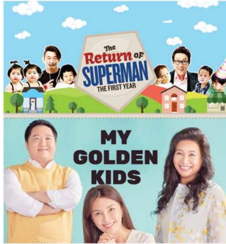
အချို့သောမိဘများမှာ စားစရိတ် အနေ မတူညီကြသူများ ဖြစ်ကြ အတွက် နာရီတိုင်း ရုန်းကန်နေရသူများပါဝင်ကာ ဘဝပေးအခြေ (SKY)

ကလေးအများစု မူမမှန်ခြင်း၏ အဓိကအကြောင်းပြချက်မှာ မိဘများကိုယ်တိုင်ကြောင့်ဖြစ်နေ၍ လူကြီးကြောင့် ရခဲ့သည့် စိတ်ဒဏ်ရာကို ကုသရန် မိဘများကို အရင်ကုသပေးခဲ့ရသည်။ My Golden Kids Program ၏