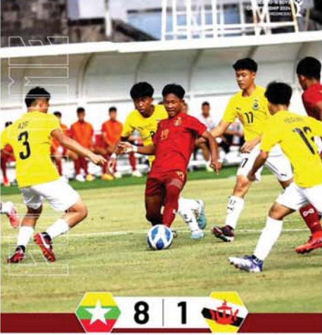
အာဆီယံ ယူ-၁၆ ပြိုင်ပွဲတွင် မြန်မာအသင်းက ဘဂ္ဂိုင်းအသင်းအား ဂိုးပြတ်အနိုင်ရရှိ

မြို့နယ် ကျည်တောက်ပေါက်ကျေးရွာမှ အပြစ်မရှိပြည်သူတစ်ဦးကို မမ်းဆီးသတ်ဖြတ်သွားခဲ့ကြောင်း သိရသည်။ တရားမဝင်ပြည်ဖျက် မီဒီယာများသည် အကြမ်းဖက်သမားများ၏အကြမ်းဖက်လုပ်ရပ်များကို ဖုံးကွယ်ရန်နှင့် လုံခြုံရေးတပ်ဖွဲ့ဝင်များအပေါ် ပြည်သူများ အထင်အမြင်လွှဲမှားစေရန်အတွက် မြေပြင်ဖြစ်စဉ်နှင့် ကွဲလွဲနေသည့် သတင်းတု၊ သတင်းအမှားများကို ရည်ရွယ်ချက်ရှိရှိ လုပ်ကြံရေးသားပြီး ဝါဒဖြန့်ဝေနေခြင်းသာဖြစ်ကြောင်း သိရသည်။ သတင်းစဉ်