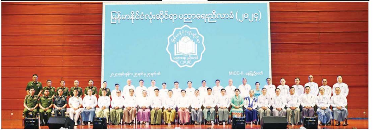
နိုင်ငံတော်စီမံအုပ်ချုပ်ရေးကောင်စီဥက္ကဋ္ဌ နိုင်ငံတော်ဝန်ကြီးချုပ် ဗိုလ်ချုပ်မှူးကြီး မင်းအောင်လှိုင် မြန်မာနိုင်ငံလုံးဆိုင်ရာ ပညာရေးညီလာခံ(၂၀၂၄) ဖွင့်ပွဲအခမ်းအနား တက်ရောက်လာကြသူများနှင့်အတူ ဖုပေါင်းမှတ်တမ်းတင်ဓာတ်ပုံရိုက်စဉ်။