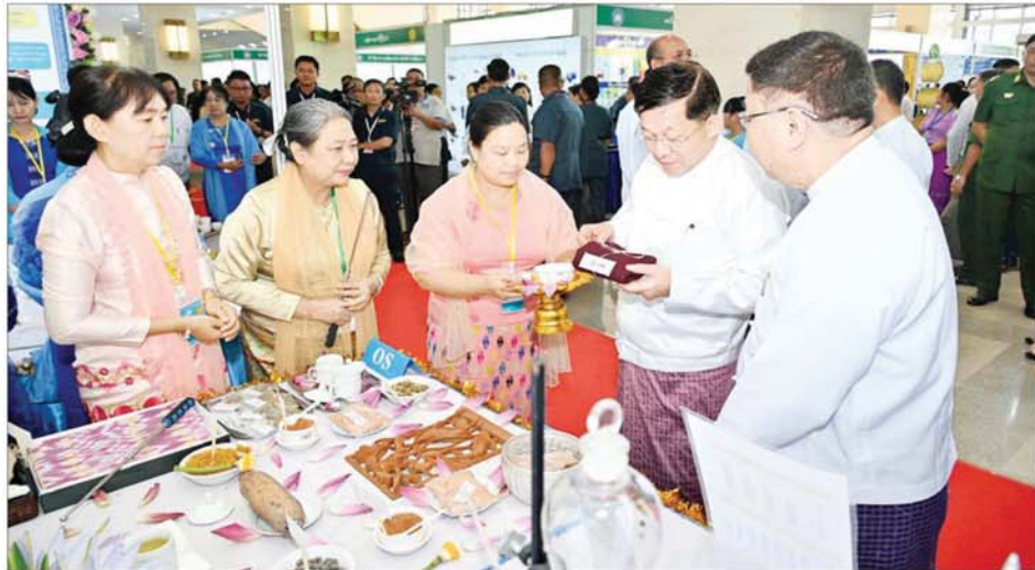
နိုင်ငံတော်စီမံအုပ်ချုပ်ရေးကောင်စီဥက္ကဋ္ဌ နိုင်ငံတော်ဝန်ကြီးချုပ် ဗိုလ်ချုပ်မှူးကြီးမင်းအောင်လှိုင် မြန်မာနိုင်ငံလုံးဆိုင်ရာပညာရေး ညီလာခံ(၂၀၂၄)အထိမ်းအမှတ်ပြခန်းများကို စိတ်ပါဝင်စားစွာ လိုက်လံကြည့်ရှုစဉ်။

နှင့် သာသနာရေးနှင့် ယဉ်ကျေးမှု ဝန်ကြီးဌာန အနုပညာဦးစီးဌာန တို့မှ အနုပညာရှင်များက "စာသင် ကျောင်းက ခေါင်းလောင်းသံ" တေးသီချင်း၊ "မိုးပွင့်စေစီ အနုကတ်ဆီ" တေးသီချင်းနှင့် "ပညာနှင့်သစ္စာ" တေးဂီတ ကဇာတ်တိုဖြင့် ဖျော်ဖြေတင်ဆက် ကြရာ နိုင်ငံတော်စီမံအုပ်ချုပ်ရေး ကောင်စီဥက္ကဋ္ဌ နိုင်ငံတော်ဝန်ကြီး ချုပ်နှင့် အခမ်းအနား တက်ရောက် လာကြသူများက ကြည့်ရှုအားပေး ကြသည်။