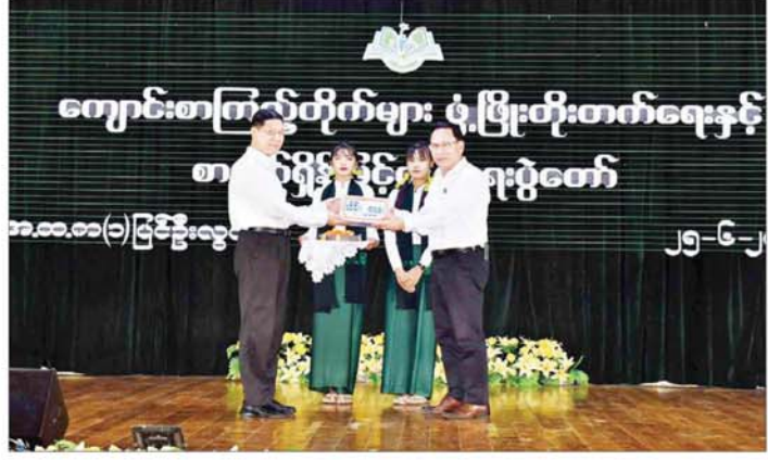
ပြည်ထောင်စုဝန်ကြီး ဦးမောင်မောင်အုန်း မန္တလေးတိုင်းဒေသကြီးအတွင်း ကျေးရွာစာကြည့်တိုက်များ ဆောက်လုပ်နိုင်ရေး အလှူငွေပေးအပ်လှူဒါန်းရာ မန္တလေးတိုင်းဒေသကြီးဝန်ကြီးချုပ် ဦးမျိုးအောင်က လက်ခံရယူစဉ်။

မျက်နှာစာတွင် ပိုမိုနီးကပ်စွာ ပူးပေါင်းဆောင်ရွက်ရေးကိစ္စရပ်များအပေါ် ရင်းနှီးပွင့်လင်းစွာ အမြင်ချင်းဖလှယ် ဆွေးနွေးခဲ့ကြသည်။ အဆိုပါတွေ့ဆုံပွဲများသို့ မြန်မာကိုယ်စားလှယ်အဖွဲ့ဝင်များ ဖြစ်ကြသည့် အီရန်နိုင်ငံဆိုင်ရာ မြန်မာသံအမတ်ကြီး ဦးမိုးကျော်အောင်နှင့် နိုင်ငံခြားရေးဝန်ကြီးဌာနမှ အဆင့်မြင့်အရာရှိကြီးများ တက်ရောက်ကြသည်။ သတင်းစဉ်