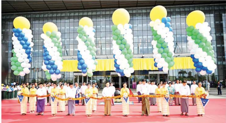
မြန်မာနိုင်ငံလုံးဆိုင်ရာ ပညာရေးညီလာခံ(၂၀၂၄) ကျင်းပရေးဦးစီးကော်မတီဥက္ကဋ္ဌ နိုင်ငံတော်စီမံအုပ်ချုပ်ရေးကောင်စီ ဒုတိယဥက္ကဋ္ဌ ဒုတိယဝန်ကြီးချုပ် ဒုတိယဗိုလ်ချုပ်မှူးကြီး ခိုးဝင်း၊ ကောင်စီတွဲဖက်အတွင်းရေးမှူး ဒုတိယဗိုလ်ချုပ်ကြီး ရဲဝင်းဦး၊ ကောင်စီဝင် ဗိုလ်ချုပ်ကြီး ဖြထွန်းဦး၊ ပြည်ထောင်စုဝန်ကြီးများဖြစ်ကြသည့် ဒေါက်တာညွန့်ဖေနှင့် ဒေါက်တာမျိုးသိန်းကျော်တို့က မြန်မာနိုင်ငံလုံးဆိုင်ရာပညာရေး ညီလာခံ(၂၀၂၄) ဖွင့်ပွဲအခမ်းအနားကို ဖဲကြီးဖြတ်ဖွင့်လှစ်ပေးကြစဉ်။

ပြည်သူလူထု အများစုသည် ဝင်ငွေ အလယ်အလတ်အဆင့်ရှိ သူများ ဖြစ်သည့်အတွက် နိုင်ငံတော်၏ ကျောင်းပညာရေး ကိုသာ အားကိုးကြကြောင်း၊ အများ ပြည်သူက ယုံကြည်အားကိုး ကြသည့်အတိုင်း ကျောင်းသား ကျောင်းသူများ ကျောင်းပညာရေး တွင် ပညာတော်၊ ပညာတတ်၊ ဘက်စုံထူးချွန်သည့် လူငယ် လူရွယ်များ ပေါ်ထွန်းလာစေရေး ကို အလေးထားဆောင်ရွက်ပေး ကြစေလိုကြောင်း၊ အနာဂတ်တွင် နိုင်ငံတော်က အားကိုးအားထား ပြုရသည့်၊ ဗလငါးတန်နှင့်ပြည့်စုံ သည့်၊ အရည်အချင်းပြည့်ဝသည့် လူငယ်များကို မွေးထုတ်ပေးနိုင် ရန်မှာ ဆရာ ဆရာမများ၏ သွန်သင်ဆုံးမမှု ကောင်းမွန်ရေး အပေါ်မှာ တည်မှီနေကြောင်း။