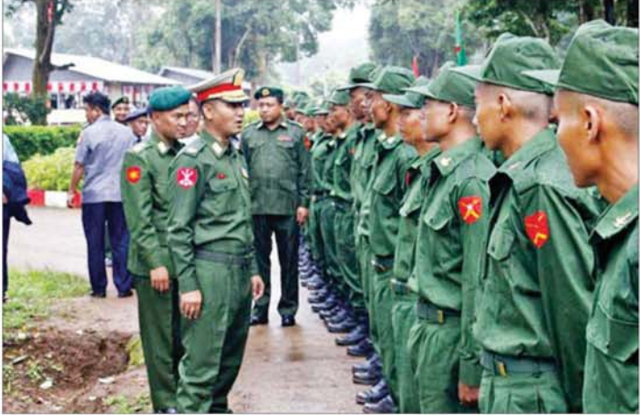
ပြည်သူ့စစ်မှုထမ်းသင်တန်း အမှတ်စဉ်(၃) သင်တန်းဖွင့်ပွဲများအား တိုင်းစစ်ဌာနချုပ်အသီးသီး၌ကျင်းပစဉ်။

ယခုအခါပြည်သူ့စစ်မှုထမ်းသင်တန်း အမှတ်စဉ်(၃) တွင် ပါဝင်တက်ရောက်ကြမည့်အချင်းကိုက်ညီသူ နိုင်ငံသားကောင်းများသည် သက်ဆိုင်ရာတိုင်း စစ်ဌာနချုပ်နယ်မြေများရှိ သင်တန်းကျောင်း အသီးသီးသို့ရောက်ရှိ၍ လိုအပ်သည့် ကြိုတင်ပြင်ဆင်မှုများကို ဆောင်ရွက်ခဲ့ကြပြီး ယနေ့နံနက်ပိုင်းတွင် အဆိုပါသင်တန်းကျောင်းအသီးသီး၌ သင်တန်းဖွင့်ပွဲများပြုလုပ်ကြရာ သင်တန်းကျောင်းများအလိုက် ကျောင်းအုပ်ကြီးများက သင်တန်းဖွင့်အမှာစကားများ ပြောကြားကြသည်။