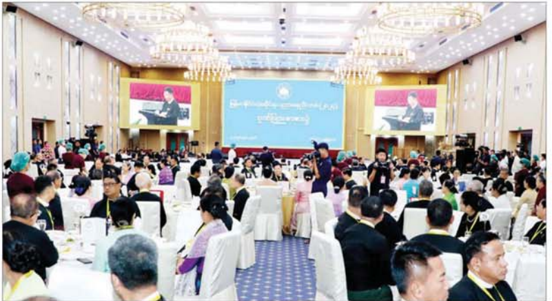
မြန်မာနိုင်ငံလုံးဆိုင်ရာ ပညာရေးညီလာခံ(၂၀၂၄)ကျင်းပရေးဦးစီးကော်မတီအတွင်းရေးမှူး ပြည်ထောင်စုဝန်ကြီး ဒေါက်တာညွန့်ဖေက ကျေးဇူးတင်စကားပြောကြားစဉ်။