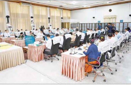
ဒီဂျစ်တယ်စီးပွားရေးဖွံ့ဖြိုးတိုးတက်မှုကော်မတီနာယက နိုင်ငံတော်စီမံအုပ်ချုပ်ရေးကောင်စီအဖွဲ့ဝင် ဒုတိယဝန်ကြီးချုပ်နှင့် ပြည်ထောင်စုဝန်ကြီး ဗိုလ်ချုပ်ကြီး မြထွန်းဦး ဒီဂျစ်တယ်စီးပွားရေးဖွံ့ဖြိုးတိုးတက်မှုကော်မတီ၏ ဒုတိယအကြိမ် လုပ်ငန်းညှိနှိုင်းအစည်းအဝေး(၁၂/၀၂၄) တွင် အမှာစကားပြောကြားစဉ်။

ပြန်လည်သုံးသပ်ပြင်ဆင်ရေးဆွဲထားသည့် မြန်မာဒီဂျစ်တယ်စီးပွားရေးလမ်းပြမြေပုံ ၂၀၃၀ (အပြီးသတ်မူကြမ်း)နှင့် စပ်လျဉ်း၍ ရှင်းလင်းတင်ပြကြသည်။ ဆက်လက်၍ အစည်းအဝေးသို့ တက်ရောက် လာကြသူများက ဒီဂျစ်တယ်စီးပွားရေး ဖွံ့ဖြိုးတိုးတက်ရန်အတွက် ဆောင်ရွက်နေမှု အခြေအနေများကို သက်ဆိုင်ရာ ကဏ္ဍအလိုက် ရှင်းလင်းတင်ပြကြ ကော်မတီနာယက က ဖြည့်စွက်ဆွေးနွေးပြီး လိုအပ်သည်များ ပေါင်းစပ်ညှိနှိုင်းဆောင်ရွက်ပေးသည်။