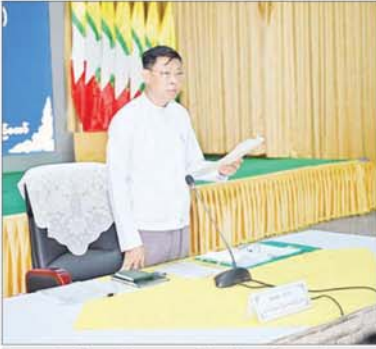
ဒီဂျစ်တယ်စီးပွားရေးဖွံ့ဖြိုးတိုးတက်မှုကော်မတီနာယက နိုင်ငံတော်စီမံအုပ်ချုပ်ရေးကောင်စီအဖွဲ့ဝင် ဒုတိယဝန်ကြီးချုပ်နှင့် ပြည်ထောင်စုဝန်ကြီး ဗိုလ်ချုပ်ကြီး မြထွန်းဦး ဒီဂျစ်တယ်စီးပွားရေးဖွံ့ဖြိုးတိုးတက်မှုကော်မတီ၏ ဒုတိယအကြိမ် လုပ်ငန်းညှိနှိုင်းအစည်းအဝေး(၁၂/၀၂၄) တွင် အမှာစကားပြောကြားစဉ်။

နေပြည်တော် ၅ ဇူလိုင် ၂၀၂၄ ဒီဂျစ်တယ် စီးပွားရေးဖွံ့ဖြိုးတိုးတက်မှုကော်မတီ၏ ဒုတိယ အကြိမ် လုပ်ငန်းညှိနှိုင်းအစည်းအဝေး(၁၂/၀၂၄)ကို ယနေ့နံနက်ပိုင်းတွင် စီးပွားရေးနှင့်ကူးသန်းရောင်းဝယ်ရေး ဝန်ကြီးဌာန ရုံးအမှတ်(၃) ညီလာခံခန်းမ၌ ကြီးကြပ်တက်မှုကော်မတီနာယက နိုင်ငံတော်စီမံအုပ်ချုပ်ရေးကောင်စီ အဖွဲ့ဝင် ဒုတိယဝန်ကြီးချုပ်နှင့် ပူးပေါင်းဆောင်ရွက်ရန် ဆက်သွယ်ရေး ဝန်ကြီးဌာန ပြည်ထောင်စုဝန်ကြီး ဗိုလ်ချုပ်ကြီးမြထွန်းဦး တက်ရောက် အမှာစကားပြောကြားသည်။