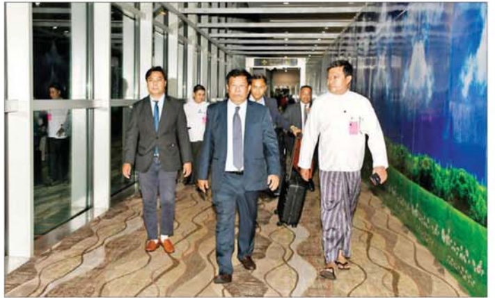
ဒုတိယဝန်ကြီးချုပ်နှင့် ပြည်ထောင်စုဝန်ကြီး ဦးသန်းဆွေ ရန်ကုန်အပြည်ပြည်ဆိုင်ရာလေဆိပ်သို့ ပြန်လည်ရောက်ရှိစဉ်။

နယူးဒေလီ ၅.၆.၂၄ အာရှပူးပေါင်းဆောင်ရွက်ရေးဆိုင်ရာ ဆွေးနွေးပွဲအဖွဲ့ (အေစီဒီ)၏ (၁၉)ကြိမ်မြောက် နိုင်ငံခြားရေးဝန်ကြီးများ အစည်းအဝေးသို့ ပါဝင်တက်ရောက်ခဲ့သည့် ဒုတိယဝန်ကြီးချုပ်နှင့် နိုင်ငံခြားရေးဝန်ကြီးဌာန ပြည်ထောင်စုဝန်ကြီး ဦးသန်းဆွေသည် ခရီးစဉ်ဒုတိယပိုင်းအဖြစ် ၅ ရက်က အီရန်နိုင်ငံ တီဟီရန်မြို့မှ အိန္ဒိယနိုင်ငံ နယူးဒေလီမြို့သို့ ဆက်လက်ထွက်ခွာလာရာ ၅.၆.၂၄ ရက် နံနက်ပိုင်းတွင် နယူးဒေလီမြို့သို့ ရောက်ရှိသည်။