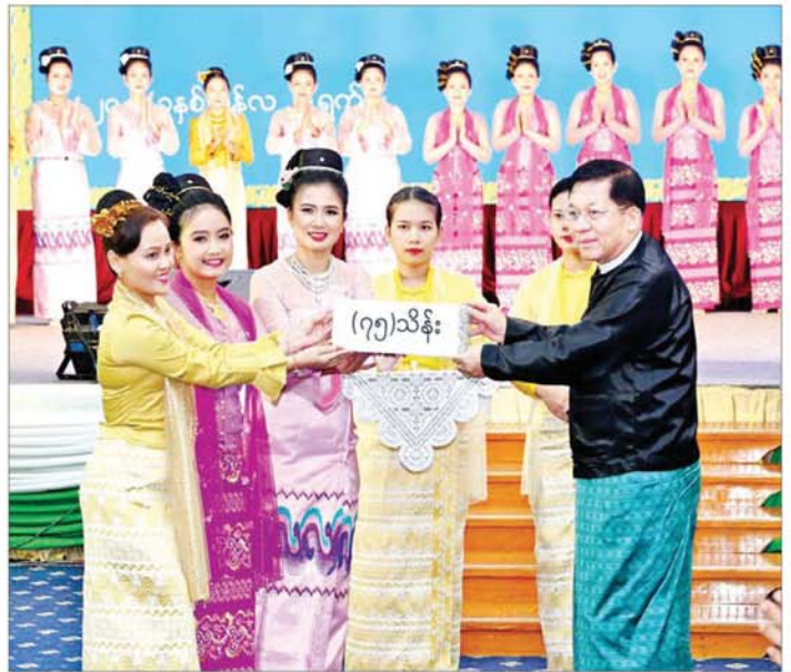
နိုင်ငံတော်စီမံအုပ်ချုပ်ရေးကောင်စီဥက္ကဋ္ဌ နိုင်ငံတော်ဝန်ကြီးချုပ် ဗိုလ်ချုပ်မှူးကြီးမင်းအောင်လှိုင် သီဆိုကပြပျော်ဖြေတင်ဆက်ခဲ့ကြသည့် အနုပညာရှင်များအား ဂုဏ်ပြုပန်းခြင်းနှင့် ဂုဏ်ပြုဆုငွေများ ပေးအပ်ချီးမြှင့်စဉ်။