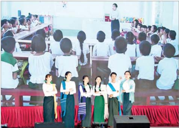
မြန်မာနိုင်ငံလုံးဆိုင်ရာပညာရေးညီလာခံ(၂၀၂၄) ဂုဏ်ပြုညစာစားပွဲအခမ်းအနားတွင် အနုပညာရှင်များက သီဆိုကပြပျော်ဖြေတင်ဆက်ကြစဉ်။

မြန်မာ့အသံနှင့် ရုပ်မြင်သံကြား၊ သာသနာရေးနှင့် ယဉ်ကျေးမှုဝန်ကြီးဌာန အနုပညာဦးစီးဌာနနှင့် ပြည်သူ့ဆက်ဆံရေးနှင့် စိတ်ဓာတ်စစ်ဆင်ရေးညွှန်ကြားရေးမှူးရုံးကွပ်ကဲမှုအောက်ရှိ မြဝတီရုပ်မြင်သံကြားတို့မှ အနုပညာရှင်များအား ဂုဏ်ပြုပန်းခြင်းနှင့် ဂုဏ်ပြုဆုငွေများ ပေးအပ်ချီးမြှင့်ပြီး ရင်းရင်းနှီးနှီး နှုတ်ဆက်ခဲ့ကြောင်း သိရသည်။ သတင်းစဉ်