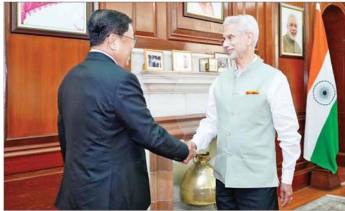
ဒုတိယဝန်ကြီးချုပ်နှင့် ပြည်ထောင်စုဝန်ကြီး ဦးသန်းဆွေ အိန္ဒိယပြည်ပရေးရာဝန်ကြီး ဒေါက်တာအက်စ်ဂျိုင်ရှင်ကုကာအား ရင်းရင်းနှီးနှီးနှုတ်ဆက်စဉ်။