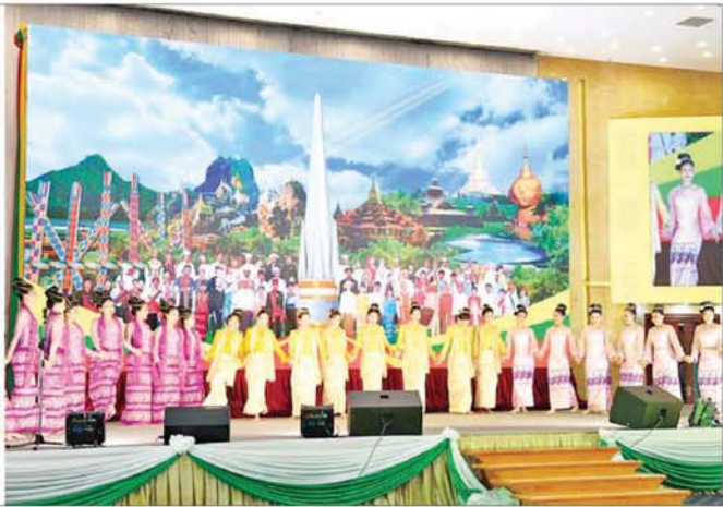
နိုင်ငံတော်စီမံအုပ်ချုပ်ရေးကောင်စီဥက္ကဋ္ဌ နိုင်ငံတော်ဝန်ကြီးချုပ် ဗိုလ်ချုပ်မှူးကြီးမင်းအောင်လှိုင်နှင့် အခမ်းအနားတက်ရောက်လာကြသူများ အနုပညာရှင်များ၏ သီဆိုကပြဖျော်ဖြေတင်ဆက်မှုကို ကြည့်ရှုအားပေးစဉ်။