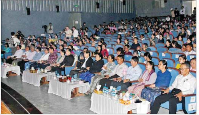
ပြည်ထောင်စုဝန်ကြီး ဦးမောင်မောင်အုန်းနှင့် တက်ရောက်လာကြသူများ မြန်မာနိုင်ငံ ဂီတနေ့အထိမ်းအမှတ် တေးဂီတဖျော်ဖြေပွဲတွင် သီဆိုဖျော်ဖြေမှုအား ကြည့်ရှုအားပေးစဉ်။

တက်ရောက် အခမ်းအနားသို့ ပြန်ကြားရေး ဝန်ကြီးဌာန ပြည်ထောင်စုဝန်ကြီး ဦးမောင်မောင်အုန်း၊ ရန်ကုန်တိုင်း ဒေသကြီးဝန်ကြီးချုပ် ဦးစိုးသိန်း၊ တိုင်းဒေသကြီး ဝန်ကြီးများ၊ မြန်မာနိုင်ငံရပ်ရှင်၊ ဂီတ၊ သဘာဝအစည်းအရုံးများမှ နာယကများနှင့် ဥက္ကဋ္ဌများ၊ ဖိတ်ကြားထားသော စည်ညည်းတော်များနှင့် တေးသီချင်းချစ်သူ ပရိသတ်များ တက်ရောက်ကြသည်။ ဦးစွာ ပြည်ထောင်စုဝန်ကြီး ဦးမောင်မောင်အုန်းနှင့် ရန်ကုန်တိုင်းဒေသကြီး ဝန်ကြီးချုပ် ဦးစိုးသိန်းတို့သည် အခမ်းအနားသို့ တက်ရောက်လာကြသည့် တေးသီချင်းရှင်အတူ စုပေါင်း မှတ်တမ်းတင်ပုံရိပ်ကိုင်ကြသည်။ ထို့နောက်ပြည်ထောင်စုဝန်ကြီးက မြန်မာနိုင်ငံဂီတနေ့ အထိမ်းအမှတ် တေးဂီတဖျော်ဖြေပွဲသို့ တက်ရောက် အားပေးကြသည့် တေးသီချင်းချစ်သူပရိသတ်များ လက်ကိုင်ဝေယမ်း အားပေးနိုင်ရန်အတွက် ငွေကျပ် သိန်း ၃၀