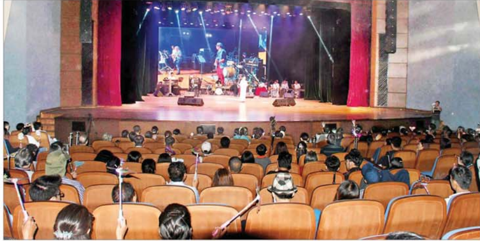
မြန်မာနိုင်ငံဂီတနေ့ အထိမ်းအမှတ် တေးဂီတဖျော်ဖြေပွဲ ကျင်းပစဉ်။

အတည်ပြုခဲ့ခြင်းဖြစ်သည်။ သမိုင်းဝင်ဂီတနေ့ မြန်မာနိုင်ငံဂီတ အစည်းအရုံး (ဗဟို)က သမိုင်းဝင်ဂီတနေ့ဖြစ်သော ၅ နဂ ရက်ကို ကြိုဆိုဂုဏ်ပြုသောအားဖြင့် နှစ်စဉ်ဂီတပြိုင်ပွဲများ၊ ပြပွဲများ၊ ဂီတဆုမျိုးမြိုင်ပွဲများနှင့် ဂီတနှင့် ပတ်သက်သော လှုပ်ရှားမှုများကို အကောင်အထည်ဖော်နိုင်ရန် ဆောင်ရွက်လျက်ရှိသည်။ ယနေ့ ၅ နဂ ရက်တွင် ကျရောက်သည့် မြန်မာနိုင်ငံ ဂီတနေ့ ဂီတဖျော်ဖြေပွဲသို့ ဂီတအလွှာအသီးသီးမှ အနုပညာရှင်များ၊ တေးသီချင်းချစ်သူပရိသတ်များ စုံညီစွာ တက်ရောက်ကြပြီး ပျော်ရွှင်စွာ ပါဝင်ဆင်နွှဲလျက်ရှိကြသည်။ သတင်းစဉ်