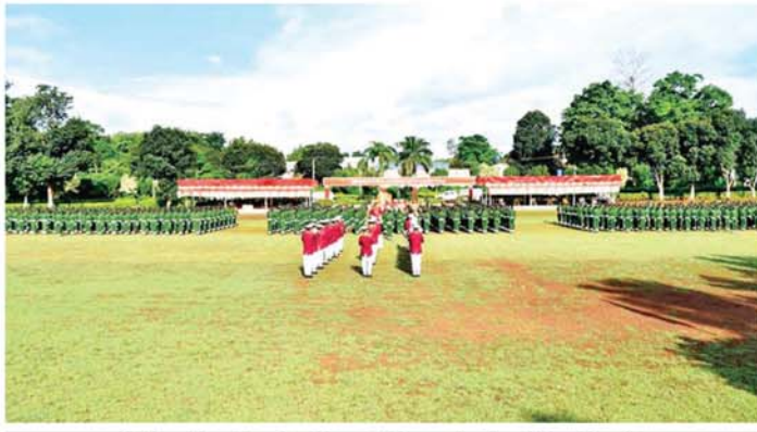
ပြည်သူ့စစ်မှုထမ်း သင်တန်းအမှတ်စဉ်(၁) သင်တန်းဆင်းပွဲ ကျင်းပစဉ်။

ထို့နောက် သက်ဆိုင်ရာ သင်တန်းကျောင်း အလိုက် ကျောင်းအုပ်ကြီးများက သင်တန်း ဆင်း ထူးချွန်ဆုများပြစ်သည့် ဖြစ်တတ်သော ဆု၊ စစ်ရေးပြ ထူးချွန် ဆု၊ လက်ဖြောင့်တပ်သားဆု၊ စစ်သည်တော် ကျင့်ဝတ်ဆု၊ ဝိုင်းကျွမ်းကျင်ဆု၊ တပ်စိတ် တိုက်ခတ် ပထမဆု၊ ချေမှုန်းရေး ပထမဆု၊ အိမ်ဆောင်အကောင်း ဆုံးဆု ရရှိသူများအား ဆုများ အသီးသီး ပေးအပ်ချီးမြှင့်ပြီး သင်တန်းဆင်း အမှာစကားများ ပြောကြားကြသည်။