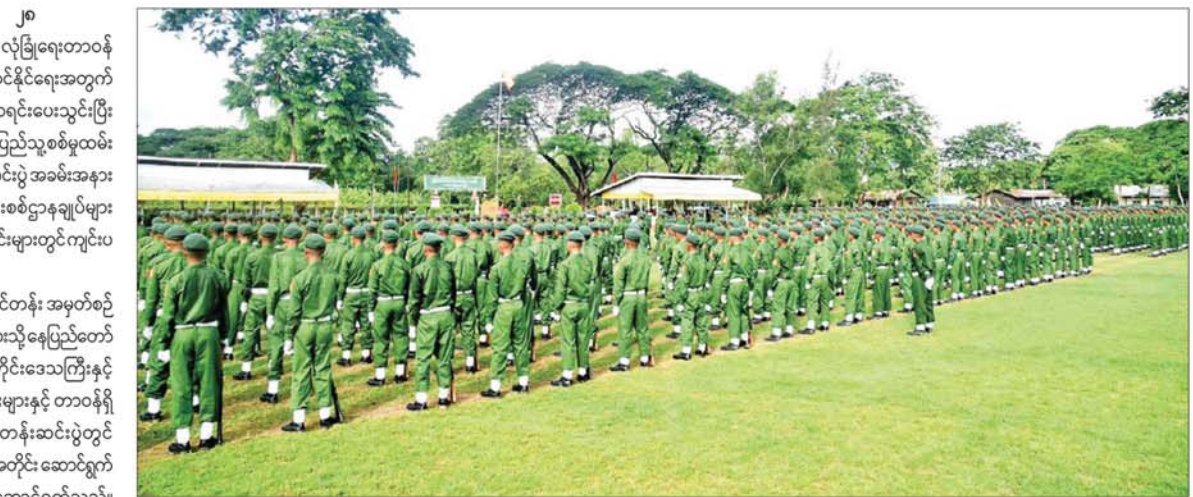
ပြည်သူ့စစ်မှုထမ်းသင်တန်း အမှတ်စဉ်(၁)သင်တန်းဆင်းပွဲ ကျင်းပစဉ်။

နေပြည်တော် ဇွန် ၂၈ နိုင်ငံတော်ကာကွယ်ရေးနှင့် လုံခြုံရေးတာဝန် များကို ကိုယ်တိုင်ပါဝင် ထမ်းဆောင်နိုင်ရေးအတွက် မိမိသဘောဆန္ဒအလျောက် စာရင်းပေးသွင်းပြီး သင်တန်းတက်ရောက်ခဲ့ကြသည့် ပြည်သူ့စစ်မှုထမ်း သင်တန်းအမှတ်စဉ်(၁)သင်တန်းဆင်းပွဲ အခမ်းအနား များကို ယနေ့နံနက်ပိုင်းတွင် တိုင်းစစ်ဌာနချုပ်များ အလိုက် နယ်မြေခံ သင်တန်းကျောင်းများတွင် ကျင်းပ ပြုလုပ်သည်။ အဆိုပါ ပြည်သူ့စစ်မှုထမ်းသင်တန်း အမှတ်စဉ် (၁)သင်တန်းဆင်းပွဲ အခမ်းအနားများသို့ နေပြည်တော် ကောင်စီဥက္ကဋ္ဌ၊ သက်ဆိုင်ရာ တိုင်းဒေသကြီးနှင့် ပြည်နယ်ဝန်ကြီးချုပ်များ၊ တိုင်းမှူးများနှင့် တာဝန်ရှိ သူများတက်ရောက်ကြပြီး သင်တန်းဆင်းပွဲတွင် သင်တန်းဆင်းစစ်ရေးပြ အစီအစဉ်အတိုင်း ဆောင်ရွက် ကြကာ ကတိသစ္စာခံယူခြင်းကို ဆောင်ရွက်သည်။ စာမျက်နှာ ၅ သို့ ၀