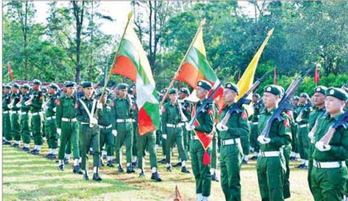
အခမ်းအနားတွင် သင်တန်း သင်တန်းထူးချွန်ဆုရရှိခဲ့ကြသူ ဆုများ ပေးအပ်ချီးမြှင့်ခဲ့ကြောင်း ဆင်းတပ်ခွဲက ကတိသစ္စာခံယူ၍ များအား တစ်ဦးချင်းဂုဏ်ပြု သိရသည်။ မြို့နယ်(ပြန်/ဆက်)

ရပ်စောက် ဧနိ ၂၈ ရပ်စောက်မြို့၌ ပြည်သူ့စစ်မှု ထမ်း သင်တန်းအမှတ်စဉ် (၁/၂၀၂၄) ကတိသစ္စာခံယူပွဲနှင့် ကျောင်းဆင်းပွဲ စစ်ရေးပြအခမ်း အနားကို ယနေ့နံနက် ၇ နာရီက နယ်မြေခံ သင်တန်းကျောင်း၌ ကျင်းပသည်။