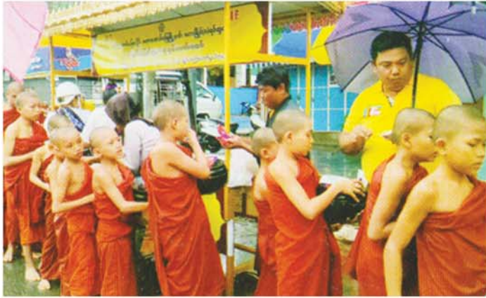
မန္တလေးချစ်စိတ်

ကျောင်းသား၊ ကျောင်းသူအားလုံးမှာ ကျောင်းသုံးပစ္စည်းတစ်ခုစီရကြပြီး ရေခဲမုန့်လည်းစားရသည်ဖြစ်၍ ဗလာမဲကျသူကလည်း ပြုံးရွှင်လျက်တွေ့ရသည်။ ကျောင်းအုပ်ကြီးနှင့် ဆရာ၊ ဆရာမများကိုလည်း ထောက်ပံ့မှုပြုခဲ့သည်။ ထိုအခမ်းအနားသို့ တက်ရောက်ကြသော ရပ်မိရပ်ဖွဲ့များ၊ အလှူရှင်များ၊ သက်ဆိုင်ရာ မိတ်ကြားထားသူများက ကျောင်းသား၊ ကျောင်းသူများနှင့်အတူ ရေခဲမုန့်စားကာ သူတို့၏ ပရဟိတစိတ်ဖြင့် ထောက်ပံ့လှူဒါန်းသော ကောင်းမှုကုသိုလ်အပေါ် ကြည်နူးပီတိဖြစ်နေကြလေသည်။