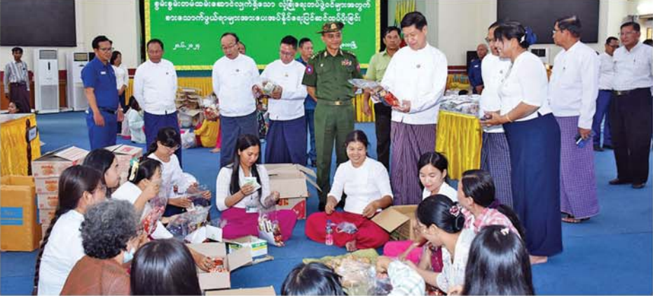
လက်ညီပိုင်းဝန်းဆောင်ရွက်နေကြောင်း၊ စားသောက်ဖွယ်ရာ ပြည့်စေသည့် စာတိုစာပေများ ရှိကြောင်း သိရသည်။ သူများအား လိုက်လံအားပေးခဲ့ များနှင့်အတူ စိတ်ဓာတ်ခွန်အား လည်း ရေးသားထည့်သွင်းပါ (မန္တလေးနေ့စဉ်)

ထိုသို့ တိုင်းဒေသကြီး ဝန်ကြီးချုပ်နှင့်အဖွဲ့က လိုက်လံ ကြည့်ရှုစဉ် တာဝန်ရှိသူများက စေတနာ့ရုံပြည်သူများမှ လှူဒါန်းသည့် စားသောက်ဖွယ်ရာများကို နိုင်ငံတော်လုံခြုံရေးနှင့်ကာကွယ်ရေးတာဝန်များကို စွမ်းစွမ်းတမ်းတမ်းဆောင်ရွက်ရုံသော လုံခြုံရေးတပ်ဖွဲ့ဝင်များထံ ထောက်ပံ့ပေးပို့ရန်အတွက် ဌာနဆိုင်ရာ ဝန်ထမ်းများက စနစ်တကျ သေသပ်စွာ ထုပ်ပိုးနေမှုအဆင့်ဆင့်ကို လိုက်ပါရှင်းလင်းပြသရာ တိုင်းဒေသကြီးဝန်ကြီးချုပ်က လိုအပ်သည်များကို ဖြည့်ဆည်းဆောင်ရွက်ပေးခဲ့ပြီး တက်ညီ