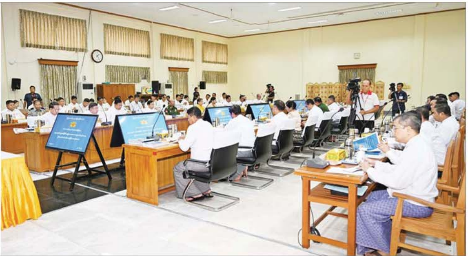
နိုင်ငံတော်စီမံအုပ်ချုပ်ရေးကောင်စီဒုတိယဥက္ကဋ္ဌ ဒုတိယဝန်ကြီးချုပ် ဒုတိယဗိုလ်ချုပ်မှူးကြီးစိုးဝင်း ၂၀၂၄ ခုနှစ် ပဉ္စမအကြိမ် အမျိုးသားအားကစားပွဲတော် ကျင်းပရေးဦးစီးကော်မတီ ဒုတိယအကြိမ် အစည်းအဝေးတွင် အမှာစကားပြောကြားစဉ်။