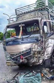
(ပုံပုံ) (၀၅၇)

တိုက်မိမှု ဇွန် ၂၆ ရက် ဖြစ်ပွားခဲ့သည်။ ခြောက်ဘီး မော်တော်ယာဉ်နှစ်စီးသည် လမ်းဆုံအနီးတွင် မော်တော်ဆစ်ဖြစ်ကာ တိုက်မိပြီး ယာဉ်နှစ်စီးရှေ့ခြမ်းများ ကြော့ပျက်စီးကာ အမျိုးသား တစ်ဦး ထိခိုက်ဒဏ်ရာများ ရရှိခဲ့သည်။ အဆိုပါ ယာဉ်တိုက်မှုဖြစ်ပွားသည့်နေရာသို့ အုပ်ချုပ်ရေးအဖွဲ့ နှင့် မြန်မာနိုင်ငံ လူမှုကယ်ဆယ်ရေးအဖွဲ့ (မန္တလေးတိုင်းရုံး)နှင့် မဏိစလ လူမှုကူညီရေးအသင်း တို့သည် သွားရောက် ကူညီဆောင်ရွက်ပေးခဲ့ကြပြီး ထိခိုက်ဒဏ်ရာများရရှိသူ အမျိုးသားအား မန္တလေးအထွေထွေရောဂါကုဆေးရုံသို့ပို့ဆောင်ကာ ဖြစ်စဉ်နှင့်ပတ်သက်၍ စစ်ဆေးလျက်ရှိကြောင်း သိရသည်။