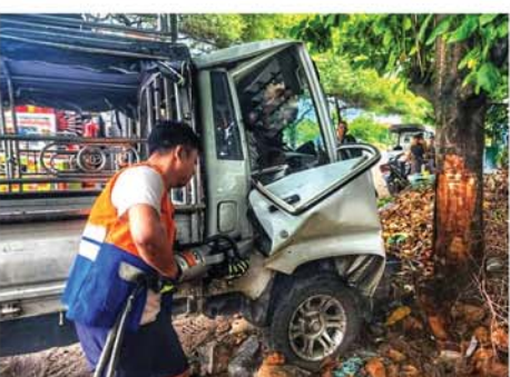
ရေးလုပ်ငန်းများ ဆောင်ရွက်ခဲ့ကြပြီး ယာဉ်မောင်းအမျိုးသား ထိခိုက်ဒဏ်ရာများရရှိခဲ့ကြောင်း သိရသည်။ (အပေါ်ပုံ)(၀၅၇)

မန္တလေး ဇွန် ၂၀ မန္တလေးမြို့အစုရှာမြို့နယ်၊ မြစ်ငယ်မြို့၊ ကမ္ဘော့ကျေးရွာအနီး၊ စစ်ကိုင်း-မြစ်ငယ်သွားကားလမ်းတွင် လိုက်ထရပ်မော်တော်ယာဉ်သည် အရှိန်မထိန်းနိုင်ဘဲဖြစ်ကာ လမ်းဘေးသစ်ပင်ဝင်တိုက်မှု ဇွန် ၂၆ ရက် နံနက် ၉ နာရီဝန်းကျင်က ဖြစ်ပွားခဲ့သည်။ အဆိုပါ ယာဉ်တိုက်မှုဖြစ်သည့်နေရာသို့ ကျေးရွာအုပ်ချုပ်ရေးအဖွဲ့နှင့် မြန်မာနိုင်ငံလူမှုကယ်ဆယ်ရေးအဖွဲ့(မန္တလေးတိုင်းရုံး)တို့သည် ကူညီကယ်ဆယ်