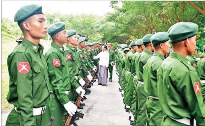
ဥက္ကဋ္ဌ နေပြည်တော်တိုင်းစစ်ဌာနချုပ် တိုင်းမှူး၊ နေပြည်တော်ကောင်စီဝင်များနှင့် တာဝန်ရှိသူများသည် သင်တန်းခန်းမ၌ ပြည်သူ့စစ်မှုထမ်းသင်တန်း အမှတ်စဉ် (၁/၂၀၂၄)မှ သင်တန်းသားများအား တွေ့ဆုံသည်။

ပြည်ထောင်စုနယ်မြေ နေပြည်တော်ရှိ ပြည်သူ့စစ်မှုထမ်းသင်တန်း အမှတ်စဉ် (၁/၂၀၂၄) သင်တန်းဆင်းပွဲအခမ်းအနားကို ယနေ့နံနက်ပိုင်းတွင် နေပြည်တော်ရှိ နယ်မြေခံလေ့ကျင့်ရေးသင်တန်းကျောင်း၌ ကျင်းပရာ နေပြည်တော်ကောင်စီ ဥက္ကဋ္ဌ ဦးသန်းထွန်းဦး၊ နေပြည်တော်တိုင်းစစ်ဌာနချုပ် တိုင်းမှူး ဗိုလ်ချုပ်မှူးမင်း၊ နေပြည်တော်ကောင်စီဝင်များ၊ ခေတ္တကျောင်းအုပ်ကြီးနှင့် တပ်မတော်အရာရှိကြီးများ၊ ခရိုင်/မြို့နယ် စီမံအုပ်ချုပ်ရေးအဖွဲ့ဥက္ကဋ္ဌများနှင့် အဖွဲ့ဝင်များ၊ သင်တန်းသားများ၊ သင်တန်းသားများ၏ မိဘများနှင့်ဆွေမျိုးများ တက်ရောက်ကြသည်။ ဦးစွာ သင်တန်းဆင်းပွဲ အစီအစဉ်အတိုင်း ဆောင်ရွက်ပြီး နေပြည်တော်ကောင်စီဥက္ကဋ္ဌ၊ နေပြည်တော်တိုင်းစစ်ဌာနချုပ် တိုင်းမှူး၊ နေပြည်တော်ကောင်စီဝင်များနှင့် တာဝန်ရှိသူများက သင်တန်းသားများအား တစ်ဦးချင်းရင်းရင်းနှီးနှီး လိုက်လံနှုတ်ဆက်ကြသည်။ သင်တန်းဆင်းပွဲအပြီးတွင် နေပြည်တော်ကောင်စီ