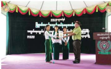
နှင့်ပညာရေးကဏ္ဍ ဖွံ့ဖြိုးတိုးတက် ပြောကြားသည်။ (အပေါ်ပုံ) ရေးကိစ္စရပ်များအား ရှင်းလင်း (၄၇၂)