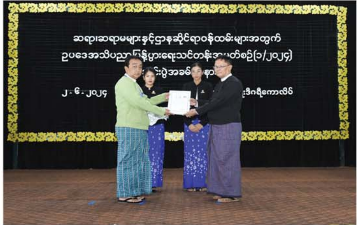
သော ဆရာ၊ ဆရာမများနှင့် ဝန်ထမ်းများ စုစုပေါင်း ၁၁၉ ဦး တက်ရောက်ခဲ့ကြောင်း အထွေထွေအုပ်ချုပ်ရေးဦးစီးဌာန မှ ဝန်ထမ်းများ စုစုပေါင်း သိရသည်။ (မန္တလေးနေ့စဉ်)