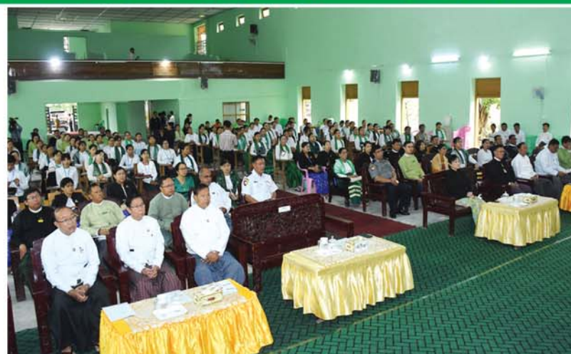
သင်တန်းနည်းပြများ၊ သင်တန်းအထွေထွေအုပ်ချုပ်ရေးဦးစီးဌာနသား၊ သင်တန်းသူများဖြစ်ကြ မှဝန်ထမ်းများ၊ ဖိတ်ကြားထားသော ဆရာ၊ ဆရာမများနှင့် စာမျက်နှာ ၄ သို့

မန္တလေး ဇွန် ၂ ဥပဒေရေးရာဝန်ကြီးဌာန၏လမ်းညွှန်ချက်နှင့်အညီ မန္တလေးတိုင်းဒေသကြီးဥပဒေချုပ်ရုံးက ကြီးမှူး၍ ဥပဒေအသိပညာပြန့်ပွားရေးသင်တန်းအမှတ်စဉ်(၁/၂၀၂၄)သင်တန်းဆင်းပွဲအခမ်းအနားကို ယနေ့နံနက်ပိုင်းက ချမ်းအေးသာစံမြို့နယ်ရှိ ပညာရေးဒီဂရီကောလိပ်၊ ပညာတန်ဆောင်ခန်းမတွင် ကျင်းပရာ မန္တလေးတိုင်းဒေသကြီးအစိုးရအဖွဲ့ဝန်ကြီးချုပ် ဦးမျိုးအောင်၊ မန္တလေးတိုင်းဒေသကြီး တရားလွှတ်တော်တရားသူကြီးချုပ် ဒေါ်ခင်သင်းဝေ၊ တိုင်းဒေသကြီးအစိုးရအဖွဲ့ဝန်ကြီးများ၊ တိုင်းဒေသကြီးဥပဒေချုပ် ဦးမြင့်အောင်နှင့်တာဝန်ရှိသူများ၊ တိုင်းဒေသကြီးအဆင့်ဌာနဆိုင်ရာများ၊