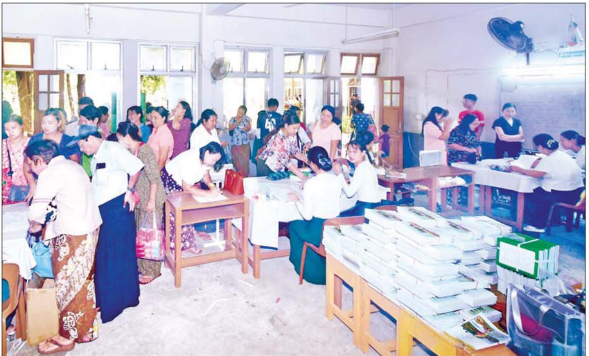
၂၀၂၄-၂၀၂၅ ပညာသင်နှစ် ကျောင်းအပ်နှံရေး သီတင်းပတ်ကာလအတွင်း ကျောင်းအပ်လက်ခံခြင်းများ ဆောင်ရွက်နေမှုကို တွေ့ရစဉ်။

ကျောင်းအပ်နှံရေး သီတင်း ပတ်ကာလအတွင်း နိုင်ငံတစ်ဝန်း ရှိ အခြေခံပညာကျောင်းများတွင် မိဘအုပ်ထိန်းသူများနှင့် ကျောင်း သား၊ ကျောင်းသူများ ကျောင်း အပ်နှံလျက်ရှိရာ တိုင်း ဒေသကြီးနှင့် ပြည်နယ်အသီးသီး ရှိ အခြေခံပညာကျောင်းများ အလိုက် ကျောင်းအပ်ကြီးများ၊ ကျောင်းအပ်ချုပ်မှတစ်ဆင့်အပ်နှံမှုနှင့် ဆရာ၊ ဆရာမများက လာရောက်