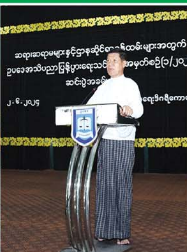
ဆရာ၊ဆရာမများနှင့်ဌာနဆိုင်ရာဝန်ထမ်းများအတွက် ဥပဒေအသိပညာပြန့်ပွားရေးသင်တန်းအမှတ်စဉ်(၁/၂၀၂၄) ဆင်းပွဲအခမ်းအနားပွဲအခမ်းအနားတွင် ဦးမျိုးအောင်က ဝန်ကြီးချုပ်အဖြစ် ပြောကြားနေကြောင်း