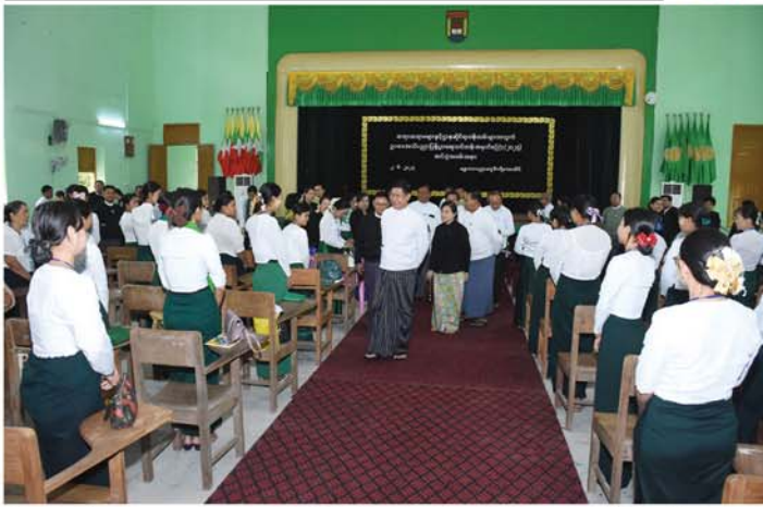
စာမျက်နှာ ၂၄ မှ

သုများ တက်ရောက်ကြသည်။ အခမ်းအနား၌ တိုင်းဒေသကြီးအစိုးရအဖွဲ့ ဝန်ကြီးချုပ်က သင်တန်းဆင်းအမှာစကားပြောကြားရာတွင် ဥပဒေအသိပညာပြန့်ပွားရေးသင်တန်းတွင် ဖွဲ့စည်းပုံ အခြေခံဥပဒေ၊ ပြည်သူ့စစ်မှုထမ်းဥပဒေ၊ နိုင်ငံ့ဝန်ထမ်းဥပဒေနှင့် နိုင်ငံ့ဝန်ထမ်းနည်းဥပဒေအပါအဝင် စုစုပေါင်းဘာသာရပ် ၁၇ မျိုးကို သင်ကြားပို့ချပေးခဲ့သည်ဟုသိရှိရပါကြောင်း၊ ဥပဒေကို နားလည်တတ်ကျွမ်းပြီး လေးစားလိုက်နာမှသာ နိုင်ငံနှင့်ပြည်သူ့အတွက် ကောင်းကျိုးရလဒ်များကို ဖော်ဆောင်နိုင်