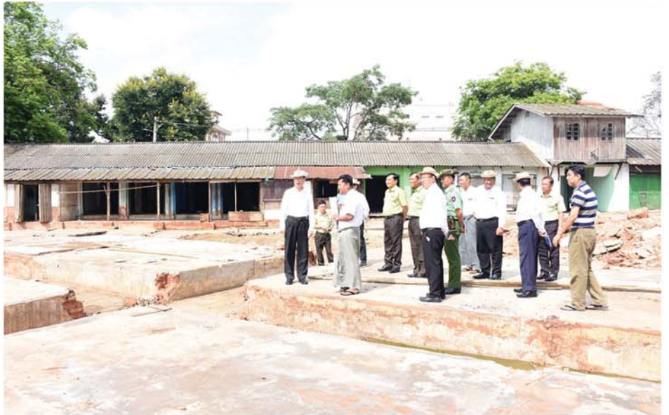
ပေးခဲ့သည်။

ဆက်လက်၍ တိုင်းဒေသကြီး ဝန်ကြီးချုပ်နှင့်အဖွဲ့သည် ပြင်ဦး လွင်မြို့ရှိ သမိုင်းဝင် မဟာရွှေမြင်တင်စေတီမြတ်ကြီးသို့ ရောက် ရှိပြီး ရွှေမြင်တင်မြတ်စွာဘုရား လေးဆူအား ဖူးမြော်ကြည့်ညှိကာ စေတီတော်မြတ်ကြီး လုံးတော်ပြည့်ရွှေသင်္ကန်းကပ်လှူပြီးစီးမှုအခြေ အနေ၊ ဘုရားလေးဆူကို ရွှေသင်္ကန်းဆက်ကပ်လှူဒါန်းသွားမည့် အခြေအနေ၊ စေတီတော်မြတ်ကြီး ပရိဝုဏ်အပြင်ဘက် စေတီတော် မြတ်ကြီးသို့ အဝင်လမ်း နိုင်လွန်ကတ္တရာခင်းမည့်အခြေအနေတို့အား လိုက်လံကြည့်ရှုပြီး လိုအပ်သည်များကို ပေါင်းစပ်ညှိနှိုင်းဆောင်ရွက်