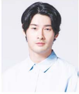
Tian Shu Li Ming တွင် Li Hong Yi ပါဝင်၍ ပြသခွင့် လိုင်စင်ကျပြီဖြစ်

သမားတော်လေးအဖြစ် လီဟွန်ရီ ပါဝင်ထားသည့် Tian Shuli Ming ဇာတ်ကားပြသခွင့် လိုင်စင်ကျပြီဖြစ်၍ ယူကျူတွင် ပြသတော့မည်ဖြစ်သည်ဟု ဝိနီဘိုတွင် ဖော်ပြသည်။