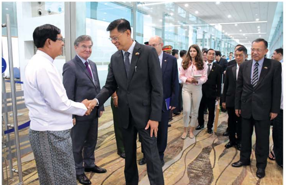
ဆိုင်ရာ ရုရှားဖက်ဒရေးရှင်းနိုင်ငံသို့ရုံးမှ တာဝန်ရှိသူများနှင့် ဌာနဆိုင်ရာ တာဝန်ရှိသူများက ရန်ကင်းအပြည်ပြည်ဆိုင်ရာလေဆိပ်၌ ပို့ဆောင်နှုတ်ဆက်ခဲ့ကြကြောင်း သိရသည်။ (အပေါ်) သတင်းစဉ်

ဒုတိယဝန်ကြီးချုပ်နှင့် ပြည်ထောင်စုဝန်ကြီး ဦးဆောင်သော ကိုယ်စားလှယ်အဖွဲ့အား ရန်ကင်းတိုင်းဒေသကြီး၊ ဝန်ကြီးချုပ် ဦးစိုးသိန်း၊ ရန်ကင်းတိုင်းစစ်ဌာနချုပ် တိုင်းမှူး ဗိုလ်ချုပ်ဇော်ဟိန်၊ မြန်မာနိုင်ငံ