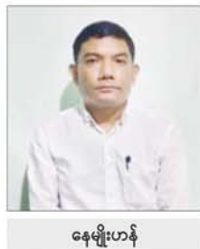
နေမျိုးဟန်