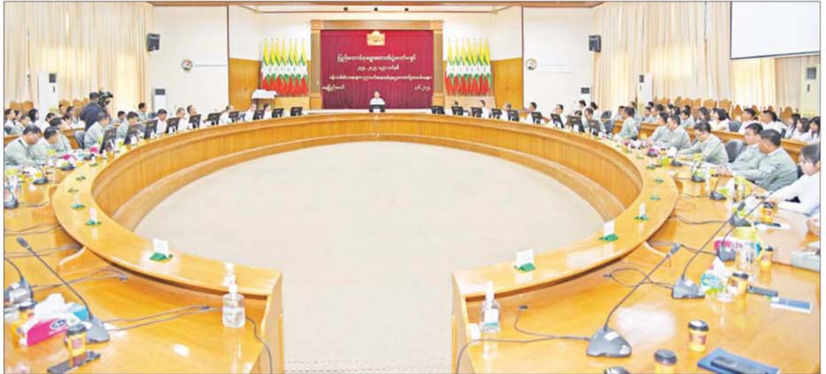
ပြည်ထောင်စုရွေးကောက်ပွဲကော်မရှင်ဥက္ကဋ္ဌ ဦးကိုကို ပြည်ထောင်စုရွေးကောက်ပွဲကော်မရှင်ရုံးနှင့် ကော်မရှင်အဖွဲ့ခွဲရုံးအဆင့်ဆင့်တို့မှ ဝန်ထမ်း သားသမီး ကျောင်းသား ကျောင်းသူများအား ပညာသင်ထောက်ပံ့ငွေပေးအပ်ပွဲ အခမ်းအနားတွင် အမှာစကားပြောကြားစဉ်။

နေပြည်တော် ၇ ဇူလိုင် ၂၀၂၄ - ပြည်ထောင်စု ရွေးကောက်ပွဲ ကော်မရှင်အနေဖြင့် ၂၀၂၄-၂၀၂၅ ပညာသင်နှစ်တွင် တက်ရောက် ပညာ သင်ကြားကြမည့် ပြည်ထောင်စု ရွေးကောက်ပွဲ ကော်မရှင်ရုံးနှင့် ကော်မရှင်အဖွဲ့ ခွဲရုံးအဆင့်ဆင့်တို့မှ ဝန်ထမ်း သားသမီးကျောင်းသား ကျောင်းသူ များအား ပညာသင်ထောက်ပံ့ငွေ ပေးအပ်ပွဲ အခမ်းအနားကို ယနေ့ နံနက် ၉ နာရီခွဲတွင် နေပြည်တော်ရှိ ပြည်ထောင်စု ရွေးကောက်ပွဲ ကော်မရှင်ရုံး အစည်းအဝေးခန်းမ ၌ ကျင်းပရာ ပြည်ထောင်စု ရွေးကောက်ပွဲကော်မရှင် ဥက္ကဋ္ဌ ဦးကိုကို၊ ကော်မရှင်အဖွဲ့ဝင်များ၊ ကော်မရှင်ရုံးနှင့် ကော်မရှင်အဖွဲ့ ခွဲရုံးအဆင့်ဆင့်တို့မှ အရာထမ်း၊ အမှုထမ်းများ တက်ရောက်ကြ သည်။