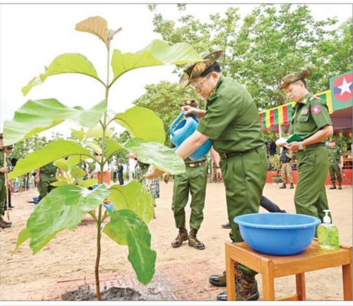
နိုင်ငံတော်စီမံအုပ်ချုပ်ရေးကောင်စီဥက္ကဋ္ဌ တပ်မတော်ကာကွယ်ရေးဦးစီးချုပ် ဗိုလ်ချုပ်မှူးကြီး မင်းအောင်လှိုင် ရတနာတန်းဝင်ကျွန်းပင်ကို ဦးဆောင်စိုက်ပျိုးစေပေးစဉ်။

အဆိုပါ အခမ်းအနားသို့ နိုင်ငံတော်စီမံအုပ်ချုပ်ရေးကောင်စီ ဥက္ကဋ္ဌ တပ်မတော်ကာကွယ်ရေး ဦးစီးချုပ်၏ ဇနီး ဒေါ်ကြူကြူလှ၊ နိုင်ငံတော်စီမံအုပ်ချုပ်ရေးကောင်စီ ဒုတိယဥက္ကဋ္ဌ ဒုတိယတပ်မတော် ကာကွယ်ရေး ဦးစီးချုပ် ကာကွယ်ရေးဦးစီးချုပ်(ကြည်း) ဒုတိယဗိုလ်ချုပ်မှူးကြီး စိုးဝင်းနှင့် ဇနီး ဒေါ်သန်းသန်းနွယ်၊ ညှိနှိုင်း ကွပ်ကဲရေးမှူး(ကြည်း၊ ရေ၊ လေ) ဗိုလ်ချုပ်ကြီး မောင်မောင်အေးနှင့် ဇနီး၊ ကာကွယ်ရေးဦးစီးချုပ်(ရေ) နှင့်ဇနီး၊ ကာကွယ်ရေးဦးစီးချုပ် (လေ) ကာကွယ်ရေးဦးစီးချုပ်ရုံးမှ တပ်မတော် အရာရှိကြီးများနှင့် ဇနီးများ၊ ပြည်ထောင်စုအဆင့် ပုဂ္ဂိုလ်များနှင့် ဇနီးများ၊ နိုင်ငံတော် ကာကွယ်ရေး တက္ကသိုလ်မှ သင်တန်းသား အရာရှိကြီးများ၊ ကာကွယ်ရေးဦးစီးချုပ်ရုံး(ကြည်း) ရှိ ရုံးဌာနအသီးသီးမှ အရာရှိ၊ စစ်သည်များနှင့် မိသားစုဝင်များ တက်ရောက်ကြသည်။