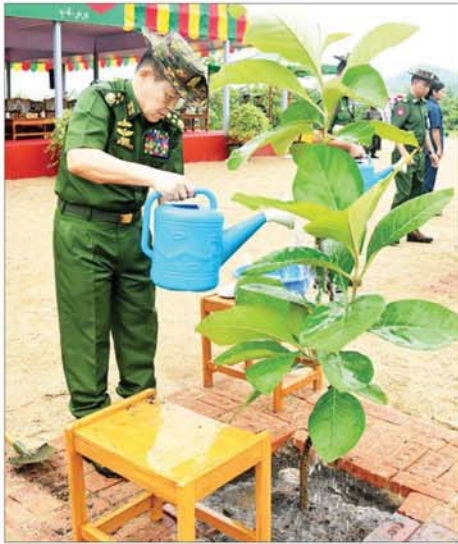
နိုင်ငံတော်စီမံအုပ်ချုပ်ရေးကောင်စီ ဒုတိယဥက္ကဋ္ဌ ဒုတိယ တပ်မတော်ကာကွယ်ရေးဦးစီးချုပ် ကာကွယ်ရေးဦးစီးချုပ်(ကြည်း) ဒုတိယဗိုလ်ချုပ်မှူးကြီး စိုးဝင်း ရတနာတန်းဝင် ကျွန်းပင်ကို စိုက်ပျိုး ပေးစဉ်။

ထို့ကြောင့် သစ်ပင်သစ်တော များကို ချစ်မြတ်နိုးကြရန် တစ်ပင် စိုက် တစ်ပင်ရှင်ရမည်ဟူသည့် စိတ်ဓမ္မာ၍ ဆောင်ရွက်ကြရန် မှာကြားလိုကြောင်း၊ အစကောင်း မှ အနောင်းသေချာမည်ဖြစ်ပြီး စနစ်တကျစိုက်ပျိုးထိန်းသိမ်းသွား မည်ဆိုပါက နောင်လာ နောက်သား များအတွက် စိမ်းလန်းစိုပြည်သည့် သဘာဝပတ်ဝန်းကျင်ကို ရရှိခံစား စေနိုင်မည်ဖြစ်ကြောင်း၊ ၂၀၁၁ ခုနှစ်ကတည်းက စိုက်ပျိုးခဲ့သည့် အကျိုးဆက်ကို ယခုမိမိတို့ မျက်မြင် ခံစားနေရသည်ကို တွေ့မြင်နိုင်မည် ဖြစ်ကြောင်း၊ ထို့ကြောင့် အနာဂတ် တွင် စိမ်းလန်းစိုပြည်သည့် ပတ်ဝန်း ကျင်ကောင်းနှင့် ကောင်းမွန်သည့် ရာသီဥတုကို လက်ဆင့်ကမ်းနိုင် ရေး သစ်ပင်များကို စနစ်တကျဖြင့် ရှင်သန်ဖြစ်ထွန်းအောင် စိုက်ပျိုး ကြရမည်ဖြစ်ကြောင်း ပြောကြား သည်။