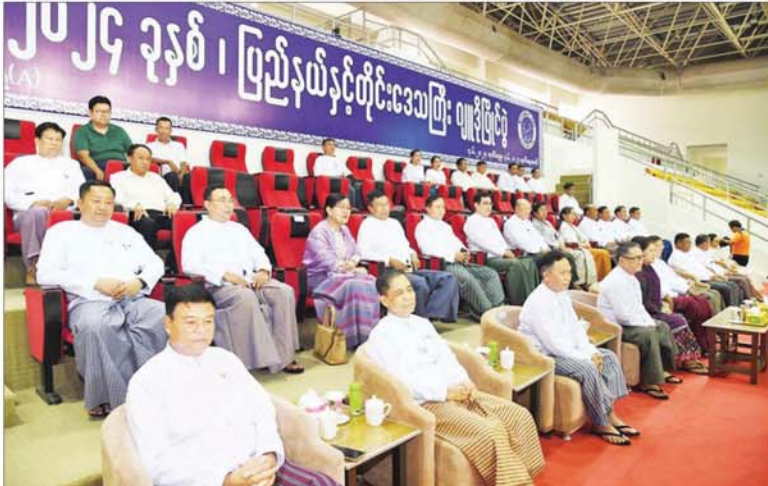
နိုင်ငံတော်စီမံအုပ်ချုပ်ရေးကောင်စီအဖွဲ့ဝင်များနှင့် တာဝန်ရှိသူများ ဂျူဒိုပြိုင်ပွဲအသင်းလိုက် ဗိုလ်လုပွဲစဉ်အဖြစ် ကချင်ပြည်နယ်အသင်းနှင့် ဧရာဝတီတိုင်းဒေသကြီးအသင်းတို့ ယှဉ်ပြိုင်နေမှုကို ကြည့်ရှုအားပေးစဉ်။

ဦးစွာ ၂၀၂၄ ခုနှစ် ပြည်နယ်နှင့် တိုင်းဒေသကြီး ဂျူဒိုပြိုင်ပွဲအသင်းလိုက် ဗိုလ်လုပွဲစဉ်အဖြစ် ကချင်