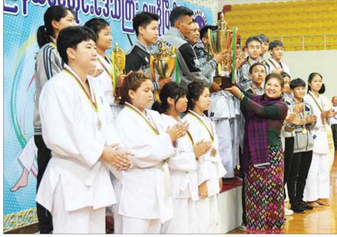
နိုင်ငံတော်စီမံအုပ်ချုပ်ရေးကောင်စီအဖွဲ့ဝင် ဒေါ်ဒွဲဘူ စုပေါင်းတံခွန်စိုက်ဆုပေးလားရရှိသည့် ကချင်ပြည်နယ်အသင်းအား တံခွန်စိုက်ဆုပေးလားပေးအပ်ချီးမြှင့်စဉ်။

နိဂုံးအဖြစ် နိုင်ငံတော်စီမံအုပ်ချုပ်ရေးကောင်စီ အဖွဲ့ဝင် ဒေါ်ဒွဲဘူက စုပေါင်းတံခွန်စိုက်ဆုပေးလားရရှိသည့် ကချင်ပြည်နယ်အသင်းအား တံခွန်စိုက်ဆုပေးလားပေးအပ်ချီးမြှင့်စဉ်။