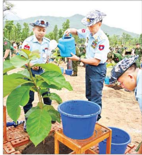
ကာကွယ်ရေးဦးစီးချုပ်(လေ) ဗိုလ်ချုပ်ကြီးထွန်းအောင် ရတနာတန်းဝင် ကျွန်းပင်ကို စိုက်ပျိုးစဉ်။