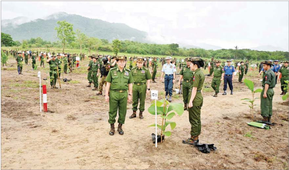
နိုင်ငံတော်စီမံအုပ်ချုပ်ရေးကောင်စီဥက္ကဋ္ဌ တပ်မတော်ကာကွယ်ရေးဦးစီးချုပ် ဗိုလ်ချုပ်မှူးကြီးမင်းအောင်လှိုင် အရာရှိစစ်သည်မိသားစုများ၏ စုပေါင်းသစ်ပင်စိုက်ပျိုးနေမှုအား လှည့်လည်ကြည့်ရှုအားပေးစဉ်။