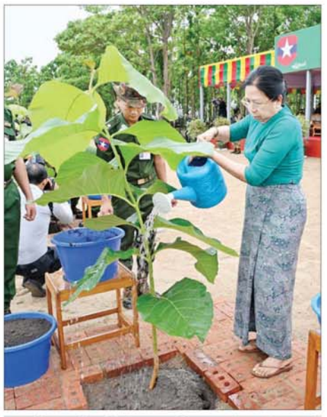
နိုင်ငံတော်စီမံအုပ်ချုပ်ရေးကောင်စီဥက္ကဋ္ဌ တပ်မတော်ကာကွယ် ရေးဦးစီးချုပ် ဗိုလ်ချုပ်မှူးကြီးမင်းအောင်လှိုင်၏ဇနီး ဒေါ်ကြူကြူလှ ရတနာတန်းဝင်ကျွန်းပင်ကို ဦးဆောင်စိုက်ပျိုးစေပေးစဉ်။

သဘာဝပတ်ဝန်းကျင်နှင့် ဂေဟစနစ်ထိန်းသိမ်းရေးအတွက် သစ်ပင်စိုက်ပျိုးပွဲတော်များကို နှစ်စဉ်ကျင်းပပြုလုပ်၍ စိုက်ပျိုးပေးလျက်ရှိ ဦးစွာ နိုင်ငံတော်စီမံအုပ်ချုပ်ရေး ကောင်စီဥက္ကဋ္ဌ တပ်မတော် ကာကွယ်ရေးဦးစီးချုပ် ဗိုလ်ချုပ် မှူးကြီး မင်းအောင်လှိုင်က အမှာ စကား ပြောကြားရာတွင် တပ်မတော်အနေဖြင့် မိုးရာသီ