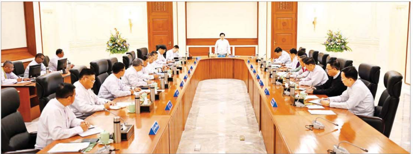
နိုင်ငံတော်စီမံအုပ်ချုပ်ရေးကောင်စီဥက္ကဋ္ဌ နိုင်ငံတော်ဝန်ကြီးချုပ် ဗိုလ်ချုပ်မှူးကြီး မင်းအောင်လှိုင် နိုင်ငံတော်စီမံအုပ်ချုပ်ရေးကောင်စီ အစည်းအဝေး(၃/၂၀၂၄) တွင် အမှာစကားပြောကြားစဉ်။