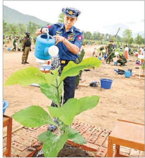
ကာကွယ်ရေးဦးစီးချုပ်(ရေ)ဒုတိယဗိုလ်ချုပ်ကြီး စွဲဝင်းမြင့် ရတနာတန်းဝင် ကျွန်းပင်ကို စိုက်ပျိုးစဉ်။