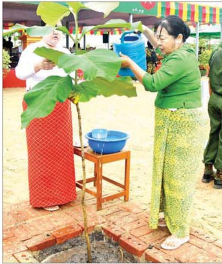
နိုင်ငံတော်စီမံအုပ်ချုပ်ရေးကောင်စီ ဒုတိယဥက္ကဋ္ဌ ဒုတိယ တပ်မတော်ကာကွယ်ရေးဦးစီးချုပ် ကာကွယ်ရေးဦးစီးချုပ်(ကြည်း) ဒုတိယဗိုလ်ချုပ်မှူးကြီး စိုးဝင်း၏ဇနီး ဒေါ်သန်းသန်းနွယ် ရတနာ တန်းဝင်ကျွန်းပင်ကို စိုက်ပျိုးပေးစဉ်။

ရေးမှူး (ကြည်း၊ ရေ၊ လေ)နှင့် ဇနီး၊ ကာကွယ်ရေးဦးစီးချုပ် (ရေ)နှင့် ဇနီး၊ ကာကွယ်ရေးဦးစီးချုပ်(လေ)၊ ကာကွယ်ရေး ဦးစီးချုပ်ရုံးမှ တပ်မတော် အရာရှိကြီးများနှင့် ဇနီးများ၊ အခမ်းအနားတက်ရောက် လာကြသည့် အရာရှိ၊ စစ်သည် မိသားစုများက သတ်မှတ်နေရာ အသီးသီးတွင် သစ်ပင်များကို စိုက်ပျိုးကြသည်။ ယင်းနောက် နိုင်ငံတော်စီမံအုပ်ချုပ်ရေးကောင်စီ ဥက္ကဋ္ဌ တပ်မတော်ကာကွယ်ရေး ဦးစီးချုပ်နှင့် ဇနီး၊ အဖွဲ့ဝင်များ သည့် အရာရှိ၊ စစ်သည် မိသားစု များ၏ စုပေါင်းသစ်ပင်စိုက်ပျိုး