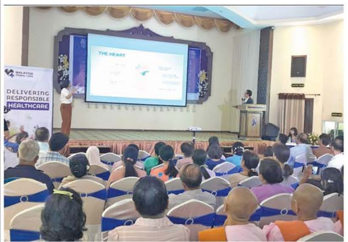
နလုံးကျွန်းမာရေးဟောပြော၊ လူနာများအား အခမဲ့ ကျန်းမာရေးဆွေးနွေး

မန္တလေး၊ ဇွန် ၃၀ မန္တလေး၊ အောင်မြေသာစံ ဦးစီးဌာန လက်ထောက်ညွှန်ကြား မြို့နယ်၊ သပဝါယမဦးစီးဌာနနှင့် မြို့နယ်သပဝါယမအသင်းစုလီမိ တက်တို့ပူးပေါင်း၍ ဇူလိုင် ၆ ရက်တွင် ကျရောက်မည့် (၁၀) နှစ်မြောက် အပြည်ပြည်ဆိုင်ရာ သပဝါယမနေ့ကို ကြိုဆိုဂုဏ်ပြု သောအားဖြင့် ချမ်းမြသာစည် သောအားဖြင့် ချမ်းမြသာစည် အလှူငွေကျပ် နှစ်သိန်း ကပ်လှူ ကြပြီး ကျောင်းအတွင်း စုပေါင်း သန့်ရှင်းရေးကို တပျော်တပါး ဆောင်ရွက်ကြကြောင်း သိရ သည်။ (အပေါ်ပုံ) (၀၉၃)