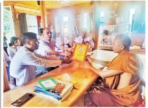
(၁၀)နှစ်ပြောက် အပြည်ပြည်ဆိုင်ရာ သပဝါယမနေ့ကြိုဆို ယွဂျာ သို့ အလှူငွေလှူဒါန်း ဝုပေါင်းသန့်ရှင်းရေးပြုလုပ်

စဉ်သည် ၇၀ ဝန်းကျင်အတွက် ဝင်ကြေး ကောက်ခံရရှိသဖြင့် ခရီးသွားဝင်ရောက်မှုဦးရေကို သိရှိနိုင်သည်ဟု ဆိုသည်။ “တစ်ရက်ကို ၆၀ ကျော် ၇၀ အတွက် ဘဏ်ကို တစ်ပတ် တစ်ခါ ငွေအပ်နှံနေရပါတယ်။ ဒါက ဝင်ကြေးတိုးမြှင့်ကောက်ခံ ပေမယ့်လည်း ဒီစာရင်းအရ မနှစ် ကထက် ခရီးသွားဝင်ရောက်မှု များလာတယ်လို့ ပြောရမယ်။ ဝင်ကြေး ငွေကျပ် ၁၅၀၀၀ က အင်းဝဒေသကို တစ်ရက်တာ ဝင်ရောက်လေ့လာခွင့်ရရှိပါတယ်” ဟု ဆက်လက်ပြောကြားသည်။ ပြည်တွင်း၊ ပြည်ပခရီးသွား စဉ်သည်များသည် အင်းဝဒေသ ရှိ ရှေးဟောင်းအမွေအနှစ်များ ဖြစ်သော ဗားကရာကျောင်း၊ မယ် နုအုတ်ကျောင်း၊ လေးထပ်ကြီး ကျောင်း၊ ရွှေစည်းခုံ၊ လောက သရဖူဆင်ကွန်းခံတံနှင့် ညောင် ရမ်းဘုရားစုများဖြစ်သော ကြောင် လိမ်၊ ဝက်ဘာ၊ လောကသုတ္တ မာန်အောင် စသည့်နေရာများသို့ အသွားအလာ များပြားကြောင်း သိရသည်။ (အပေါ်ပုံ) (မန္တလေးနေ့စဉ်-၉)