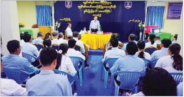
အင်ဂျင်နီယာရုံးတို့၌ ဝန်ထမ်းများ ရုံးလုပ်ငန်းဆောင် စတုန်နှင့် ဝန်ထမ်းအိမ်ရာတို့ကို လိုက်လံကြည့်ရှုစစ်ဆေး ရွက်နေမှု၊ ပြည်နယ်လျှပ်စစ် အင်ဂျင်နီယာရုံးဝင်း ကာ လိုအပ်သည်များ ဖြည့်ဆည်းဆောင်ရွက်ပေးခဲ့ အတွင်းရှိပစ္စည်းများ သိုလှောင်ထိန်းသိမ်းထားရှိသည့် ကြောင်း သတင်းရရှိသည်။ သတင်းစဉ်

ထို့နောက် ဒုတိယဝန်ကြီးသည် ပြည်နယ်လျှပ် စစ်အင်ဂျင်နီယာရုံးနှင့် တောင်ကြီးမြို့နယ် လျှပ်စစ်