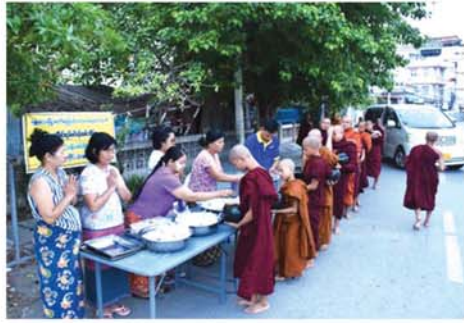
လောင်းလှူကြမည်ဖြစ်၍ လေးပြင်လေးရပ်မှ ဆရာတော်၊ သံဃာတော်များအား ကြွရောက်အလှူခံနိုင်ပါရန် ပင့်ဖိတ်ထားကြောင်း သိရသည်။ (အပေါ်ပုံ) (မန္တလေးနေ့စဉ်-၃)

ဝန်ထမ်းမိသားစုဝင်များက လေးပြင်လေးရပ်မှ ကြွရောက်တော်မူကြသော ဆရာတော်၊ သံဃာတော်များအား ယနေ့ နံနက်ပိုင်းက (၈၅)ကြိမ်မြောက်အဖြစ် ဆွမ်း၊ ငါးဖယ်ဆုပ်ချက်၊ ပဲတီချဉ်သုပ်တို့ကို ၃၆လမ်းနှင့် ၆၉လမ်းထောင့်တွင် ပြင်ဆင်၍ ကြွရောက်လာကြသော ဆရာတော်၊ သံဃာတော် ၂၅၀ ကျော်တို့အား နံနက် ၅ နာရီခွဲမှ စတင်လောင်းလှူကြသည်။ ခြံကြံပြီး အပတ်စဉ် တနင်္ဂနွေနေ့တိုင်း ဆက်လက်