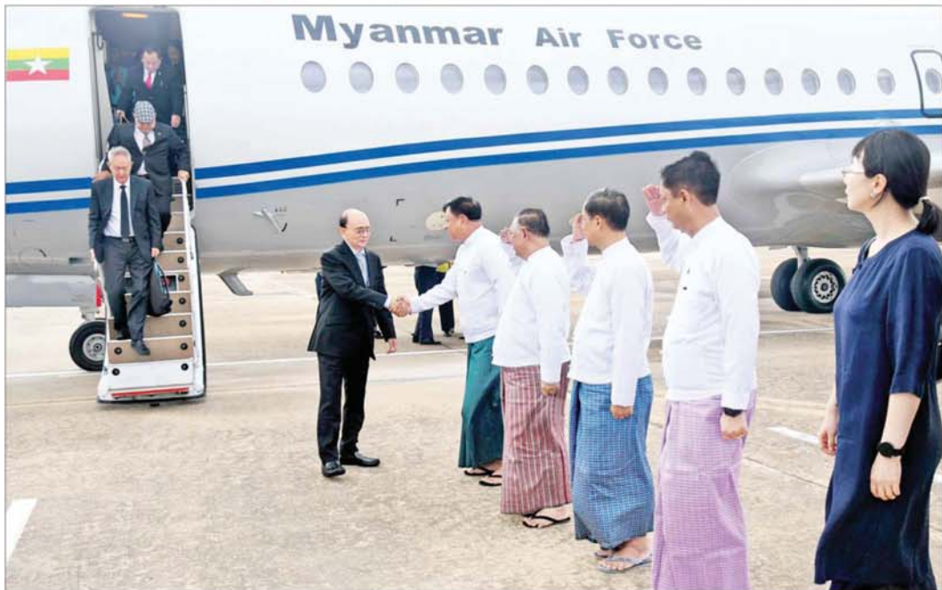
နိုင်ငံတော်သမ္မတ(ငြိမ်း) ဦးသိန်းစိန်အား နိုင်ငံတော်စီမံအုပ်ချုပ်ရေးကောင်စီအဖွဲ့ဝင် ဒုတိယဝန်ကြီးချုပ်နှင့် ပြည်ထောင်စုဝန်ကြီး ဗိုလ်ချုပ်ကြီး တင်အောင်စန်းနှင့် တာဝန်ရှိသူများ နေပြည်တော်လေဆိပ်၌ ကြိုဆိုနှုတ်ဆက်ကြစဉ်။