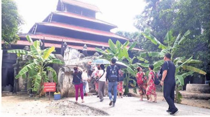
ပန်းမောက်မြို့နယ်၌ မိုးစပါးများ စိုက်ပျိုးရန် လယ်ယာမြေများကို ထွန်ယက်

ဗန်းမောက် ဇွန် ၃၀ စစ်ကိုင်းတိုင်းဒေသကြီး၊ ကသာခရိုင်၊ ဗန်းမောက်မြို့နယ် တွင် မြို့အနီးအနားပတ်ဝန်းကျင် ရှိ လယ်ယာမြေများနှင့် ကျေးလက် ဒေသအချို့ရှိ လယ်ယာမြေများ ကို ယခုအခါ မိုးစပါးများ စိုက် ပျိုးရန် ထွန်ယက်နေကြပြီ ဖြစ် သည်။ ယခုနှစ် မေလအတွင်းနှင့် ဇွန်လပထမပတ်အတွင်းမှစ၍ ရွာသွန်းခဲ့သောမိုးကြောင့် လယ် ယာမြေများတွင် ရေများ အလုံ အလောက်ရှိလာခဲ့သဖြင့် မိုး စပါးပျိုးများကို ကဆုန်လပြည့် ကျော်တွင် ကြပ်ကဲပြီး ယခုအခါ ပျိုးသက်ရှိလာပြီဖြစ်၍ စိုက်ပျိုး ရန်အတွက် လယ်ယာမြေများကို ထွန်စက်များ၊ နွားများနှင့် ကျွဲ များကို အသုံးပြုထွန်ယက်ကာ တစ်ရက်လျှင် ထွန်စက်ဖြင့် ထွန်