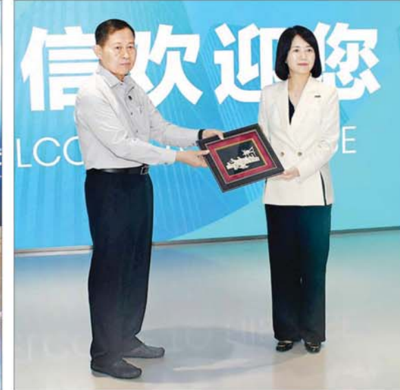
နိုင်ငံတော်စီမံအုပ်ချုပ်ရေးကောင်စီ ဒုတိယဥက္ကဋ္ဌ ဒုတိယဝန်ကြီးချုပ် ဒုတိယဗိုလ်ချုပ်မှူးကြီးစိုးဝင်းနှင့် Hisense ချင်းတောင် သုတေသနနှင့် ဖွံ့ဖြိုးတိုးတက်မှုစင်တာမှ တာဝန်ရှိသူတစ်ဦးတို့ လက်ဆောင်ပစ္စည်းများ အပြန်အလှန်ပေးအပ်စဉ်။