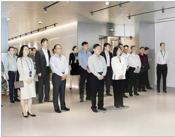
နိုင်ငံတော်စီမံအုပ်ချုပ်ရေးကောင်စီ ဒုတိယဥက္ကဋ္ဌ ဒုတိယဝန်ကြီးချုပ် ဒုတိယဗိုလ်ချုပ်မှူးကြီးစိုးဝင်း၊ Hisense ချင်းတောင် သုတေသနနှင့် ဖွံ့ဖြိုးတိုးတက်မှု စင်တာအတွင်း ကြည့်ရှုလေ့လာစဉ်။

၁၉၈၄ ခုနှစ်တွင် စတင်တည်ထောင်ချင်းတောင် ဟိုင်အယ်အဖွဲ့ (Qingdao Haier Group)ကို ၁၉၈၄ ခုနှစ်တွင် စတင်တည်ထောင်ခဲ့ပြီး ပိုမိုကောင်းမွန်သည့် လူနေမှုဘဝ