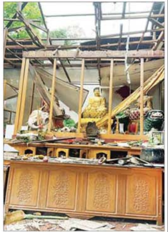
MNDAA အကြမ်းဖက်သောင်းကျန်းသူများက လားရှိုးမြို့အတွင်းသို့ ရှေ့တိုက်ခိုက်မှုများ၊ Drop Bomb များဖြင့် ပစ်ခတ်တိုက်ခိုက်မှုကြောင့် တရုတ်ဖာရွှန်ဘုံကျောင်း ထိခိုက်ပျက်စီးမှုကို တွေ့ရစဉ်။

နိဂုံးချုပ်အနေနဲ့ ပြောကြားလိုတာကတော့ MNDAA နဲ့ TNLA တို့ရဲ့ အကြမ်းဖက်တိုက်ခိုက်မှုကြောင့် မြို့ရွာများ၊ အရပ်သားပြည်သူများ ဘေးကင်းလုံခြုံရေးအတွက် အထူးအလေးထားပြီး နိုင်ငံတော်အစိုးရအနေနဲ့ ဆောင်ရွက်သွားမှာ