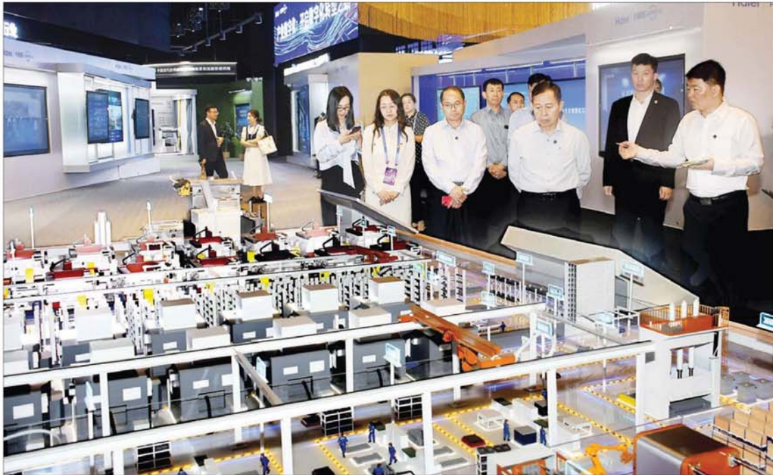
နိုင်ငံတော်စီမံအုပ်ချုပ်ရေးကောင်စီ ဒုတိယဥက္ကဋ္ဌ ဒုတိယဝန်ကြီးချုပ် ဒုတိယဗိုလ်ချုပ်မှူးကြီးစိုးဝင်း ချင်းတောင်မြို့ရှိ ချင်းတောင် ဟိုင်အလ်အဖွဲ့အတွင်း ကြည့်ရှုလေ့လာစဉ်။

နေပြည်တော် ဇူလိုင် ၉ တရုတ်ပြည်သူ့သမ္မတ နိုင်ငံ ချင်းတောင်မြို့ရှိ ရောက်ရှိနေသည့် နိုင်ငံတော်စီမံအုပ်ချုပ်ရေးကောင်စီ ဒုတိယဥက္ကဋ္ဌ ဒုတိယဝန်ကြီးချုပ် ဒုတိယဗိုလ်ချုပ်မှူးကြီးစိုးဝင်း ဦးဆောင်သော မြန်မာ့ကိုယ်စားလှယ်အဖွဲ့သည် ယနေ့ နံနက်ပိုင်းတွင် ချင်းတောင်မြို့အတွင်းရှိ ချင်းတောင် ဟိုင်အလ်အဖွဲ့ (Qingdao Haier Group)နှင့် ချင်းတောင်သုတေသနနှင့် ဖွံ့ဖြိုးတိုးတက်မှုစင်တာ (Qingdao Hisense Research and Development Center)များသို့ လှည့်လည်ကြည့်ရှုလေ့လာကြသည်။