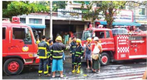
မီးသတ်ရေသယ်ယာဉ်များဖြင့် မီးသတ်ဆောင်ရွက်နေကြောင်း သိရသည်။ မီးလောင်သည့်အကြောင်းအရင်း၊

မန္တလေး ဇူလိုင် ၉ မန္တလေး၊ ချမ်းအေးသာစံ မြို့နယ်၊ ချမ်းအေးသာစံအလယ် ရပ်ကွက်၊ အကွက်အမှတ်(၆၀၃) ၂၇လမ်း၊ ၈၂လမ်းနှင့်အလယ်ကြားရှိ လယ်ယာသုံးနှင့်စက်အပိုပစ္စည်း အရောင်းဆိုင်တွင် မီးလောင်ကျွမ်း