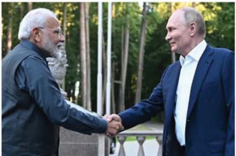
လျှောက်ရင်း လိုက်လံပြသခဲ့သည်။ ခင်ရင်းနှီးစွာ အလွတ်သဘော ပြောဆိုခဲ့ကြသည်။ နာရင်ဒရာမိုဒီနှင့် တွေ့ပြီး

မော်စကို ဇူလိုင် ၉ အိန္ဒိယဝန်ကြီးချုပ် နာရင်ဒရာမိုဒီ ဇူလိုင် ၈ ရက်က ရုရှားနိုင်ငံသို့ ချစ်ကြည်ရေးအလည်အပတ်ရောက်ရှိလာရာ ရုရှားသမ္မတ ဗလာဒီမာပူတင်က မော်စကိုမြို့ပြင် နှိမ့်အိုဂါယိုဗိုဒေသရှိ ငှင်း၏အိမ်၌ ကြိုဆိုစဉ်ဝတ်ပြု နှုတ်ဆက်ခဲ့ကြောင်း အယ်လ်ဂျာဇီရာသတင်းဌာနက ဖော်ပြသည်။ ထို့နောက် အိမ်ရှင်သမ္မတ ဗလာဒီမာပူတင်က နေအိမ်ဝင်းထဲအနှံ့ နာရင်ဒရာမိုဒီကို လမ်းထိုသို့ လမ်းလျှောက်ရင်းနှင့် ချစ်