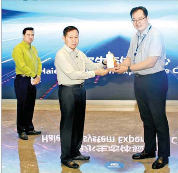
နိုင်ငံတော်စီမံအုပ်ချုပ်ရေးကောင်စီ ဒုတိယဥက္ကဋ္ဌ ဒုတိယဝန်ကြီးချုပ် ဒုတိယဗိုလ်ချုပ်မှူးကြီးစိုးဝင်းနှင့် ချင်းတောင်မြို့ရှိ ချင်းတောင် ဟိုင်အယ်အဖွဲ့မှ တာဝန်ရှိသူ တစ်ဦးတို့ လက်ဆောင်ပစ္စည်းများ အပြန်အလှန်ပေးအပ်စဉ်။

နေ့လယ်စာစားပွဲသို့ တက်ရောက် ချင်းတောင် နိုင်ငံတော်စီမံအုပ်ချုပ်ရေးကောင်စီ ဒုတိယဥက္ကဋ္ဌ ဒုတိယဝန်ကြီးချုပ် ဦးဆောင်သော မြန်မာကိုယ်စားလှယ်အဖွဲ့သည် ချင်းတောင်မြို့ မြို့တော်ဝန် Mr. Zhao Haozhi က Qingdao Sea View Garden Hotel ၌ တည်ခင်းစဉ်ခံသည့် နေ့လယ်စာစားပွဲသို့ တက်ရောက်ခဲ့ကြောင်း သိရသည်။