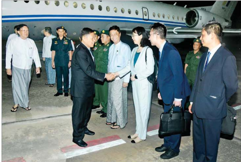
နိုင်ငံတော်စီမံအုပ်ချုပ်ရေးကောင်စီ ဒုတိယဥက္ကဋ္ဌ ဒုတိယဝန်ကြီးချုပ် ဒုတိယဗိုလ်ချုပ်မှူးကြီး စိုးဝင်းအား နိုင်ငံတော်စီမံအုပ်ချုပ်ရေးကောင်စီအတွင်းရေးမှူး ဒုတိယဗိုလ်ချုပ်ကြီး အောင်လင်းခွေ၊ ကောင်စီအဖွဲ့ဝင်များ၊ မြန်မာနိုင်ငံဆိုင်ရာ တရုတ်နိုင်ငံသံရုံးနှင့် စစ်သံရုံးတို့မှ တာဝန်ရှိသူများက နေပြည်တော်လေဆိပ်၌ ကြိုဆိုနှုတ်ဆက်ကြစဉ်။

နိုင်ငံတော်စီမံအုပ်ချုပ်ရေးကောင်စီ ဒုတိယဥက္ကဋ္ဌ ဒုတိယဝန်ကြီးချုပ် ဦးဆောင်သော ကိုယ်စားလှယ်အဖွဲ့အား နိုင်ငံတော်စီမံအုပ်ချုပ်ရေးကောင်စီအတွင်းရေးမှူး ဒုတိယဗိုလ်ချုပ်ကြီး အောင်လင်းခွေ၊ ကောင်စီအဖွဲ့ဝင်များ၊ ပြည်ထောင်စုဝန်ကြီးများ၊ ကာကွယ်ရေးဦးစီးချုပ်ရုံး (ကြည်း)မှ အဆင့်မြင့် တပ်မတော်အရာရှိကြီးများ၊ နေပြည်တော်တိုင်းစစ်ဌာနချုပ်တိုင်းမှူး၊ ဒုတိယဝန်ကြီးများနှင့် မြန်မာနိုင်ငံဆိုင်ရာ တရုတ်နိုင်ငံသံရုံးနှင့် စစ်သံရုံးတို့မှ တာဝန်ရှိသူများက နေပြည်တော်