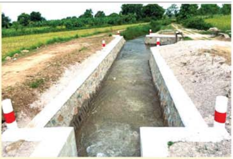
လုံ့လအသုံးပြုနိုင်သောကြောင့် ဤမြင့်အောင်က ပြောပြသည်။ လူမှုစီးပွားများဘဝ ပိုမိုဖွံ့ဖြိုးတိုးတက်လာကြောင်း တောင်သူ

ကျောက်ဆည် ဇူလိုင် ၁၀ မန္တလေးတိုင်းဒေသကြီး၊ အဆိုပါ ရေကျအဆောက်အအုံသည် ကျောက်ဆည်မြို့နယ် ပန်းညက်ကျေးရွာအနီးတွင် တည်ရှိပြီး နှစ်ကာလကြာမြင့်သောကြောင့် ရေအဝင်ပိုင်းနှင့် ရေအထွက် မြေကာနံရံများ ပျက်စီးကာ မြောင်းပေါ်ရေတိုက်စားပျက်မည့် အခြေအနေများ ဖြစ်ပေါ်လျက်ရှိသဖြင့် မန္တလေးတိုင်းဒေသကြီး ခွင့်ပြုရန်ပုံငွေကျပ်(၂၉)သန်းဖြင့် ရေကျအဆောက်အအုံ၏ အထက် မြောင်းကြမ်းပြင်များနှင့် မြောင်းပေါ်ခွက်ခမ်းများ ပြန်လည်ပြုပြင်ပေးရခြင်းဖြစ်ကြောင်း သိရသည်။ ရေကျအဆောက်အအုံ ပြန်လည်ပြုပြင်ပေးခြင်းများနှင့် ပတ်သက်၍ ယခင်က အောက်လင်းစင်း ဆည်မြောင်းရေသောက်