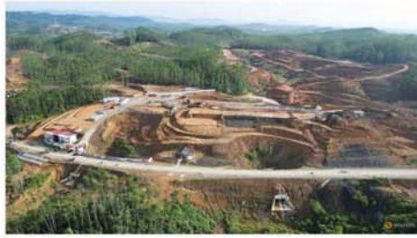
ဂျာတာ ဇူလိုင် ၁၀ အောက်သို့ တဖြည်းဖြည်းနိမ့်ဝင် ဂျာတာမြို့တော်သည် မြေလားသည့်အပြင် တိုးပွားလာ

သော မြို့နေလူထုအတွက် မြို့ကွက်သစ်တိုးချဲ့ရန်လည်း မဖြစ်နိုင်တော့သဖြင့် အင်ဒိုနီးရှား အစိုးရက မြို့တော်နေရာရွှေ့ပြောင်းရန် စီစဉ်ခဲ့သည်။ အရှေ့ကာလီမန်တန်ပြည်နယ် ဆေပါကဒေသတွင် နွနုတ်တရုဟု အမည်ပေးထားသော မြို့တော်သစ်တည်ဆောက်ရေး စီမံကိန်းကို သမ္မတဂျီကိုဝီဒီဒီ လက်ထက်တွင် အကောင်အထည်ဖော်ခဲ့သည်။ တောင်ကုန်းများပေါ်တွင် တည်ဆောက်ထားသော ထိုမြို့