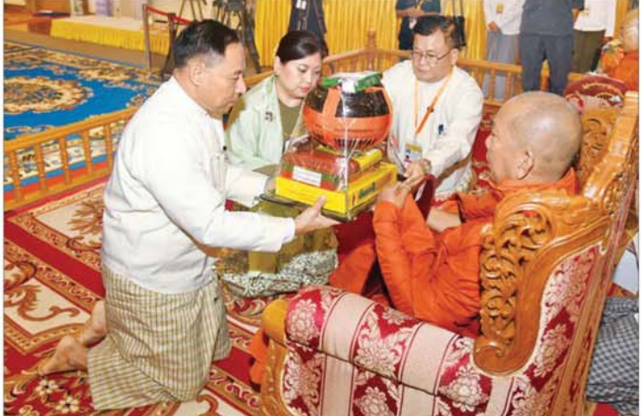
နိုင်ငံတော်စီမံအုပ်ချုပ်ရေးကောင်စီ အဖွဲ့ဝင် ဗိုလ်ချုပ်ကြီး ရာပြည့်နှင့်ဇနီးတို့က အောင်စည်သာကျောင်း ဆရာတော်ကြီးထံ ဝါဆိုသင်္ကန်းနှင့် လှူဖွယ်ပစ္စည်းများ ဆက်ကပ်လှူဒါန်းစဉ်။