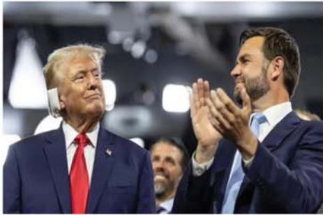
ဝါရှင်တန် ဇူလိုင် ၁၆ သမ္မတအဖြစ် ပါဝင်ရွေးကောက် ၂၀၂၄ ခုနှစ် အမေရိကန် ခံရန် ရိပ်တတ်လီကန်ပါတီ ကိုယ် သမ္မတ ရွေးကောက်ပွဲ၌ ဒုတိယ စားပြု သမ္မတလောင်း ဒေါ်နယ်လ်

ထရမ်က ဂျေဒီဗန်ကို အတည် ပြုရွေးချယ်ထားကြောင်း ဘီဘီစီ သတင်းဌာနက ဖော်ပြသည်။ ၂၀၁၆ သမ္မတရွေးကောက်ပွဲ တွင် ထရမ်အနေဖြင့် အင်ဒီယာ နှစ်ပတ်လည်အုပ်ချုပ်ရေးမှူး ဖြစ်ခဲ့ ပုံစံကို ဒုတိယသမ္မတနေရာတွင် ယှဉ်ပြိုင်အရွေးခံရန် ရွေးချယ်ခဲ့ သော်လည်း ယခုနှစ်တွင် အသက် ၃၉ နှစ်အရွယ် အိုဟိုင်းယိုးနယ် သား ဗန်စ်ကို တစ်မူထူးခြားစွာ ရွေးချယ်ခဲ့သည်။ ဗန်စ်သည် နိုင်ငံရေးသဘော ၀-၀-၀-၀