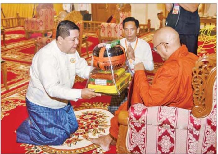
ပြည်ထောင်စုတရားသူကြီးချုပ် ဦးသာဌေး ဆရာတော်ကြီးထံ ဝါဆိုသင်္ကန်းနှင့် လှူဖွယ်ပစ္စည်းများ ဆက်ကပ်လှူဒါန်းစဉ်။