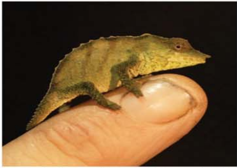
အာဖရိကတိုက်တောင်ပိုင်း မာဘူးအဖြစ်မီးတောက်တွင်း တစ်နေရာမှ အသစ်တွေ့ရှိမှုတစ်ခုရသော မာဘူးတောင် ပုတ်သင်ညို တစ်ကောင်ကို တွေ့ရစဉ်။

ဝါရှင်တန် ဇူလိုင် ၁၆ တစ်စည်လျှင် ၂၅ ဆင့်အထိ ယခုနှစ် ဒုတိယသုံးလ ရွေးကူးခဲ့သည်။ အတွင်း တရုတ်နိုင်ငံ၏ ဝယ်လို အထူးသဖြင့် အမေရိကန် အားလျော့နည်းလာမှုကြောင့် ရေနံ ဈေးနှုန်းများ အကျဘက်သို့ ဦး ပြန်လည်ခိုင်မာလျက်ရှိရာ ရေနံ နှင့် အခြားကုန်စည်ဈေးနှုန်းများ သတင်းဌာနက ဖော်ပြသည်။ ဇူလိုင် ၁၆ ရက်က ကမ္ဘာ့ ရေနံဈေးသည် ဘရုန်းဇလီးတွင် မည်ဟု မျှော်မှန်းထားကြောင်း မြို့ ၂၁ ဆင့်အထိ၊ အနောက် တက္ကဆက်ဈေးကွက်၌ ရေနံစိမ်း ၀-၀-၀-၀