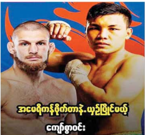
အပစ်ရိုက်နဂိုက်တာနဲ့ ယှဉ်ပြိုင်ပွဲဖယ် ကျော်စွာဝင်း

ရန်ကုန် ၇ ဇူလိုင် ၁၆ The Great Lethwei က ကျင်းပမည့် နိုင်ငံတကာစိန်ခေါ်ပွဲ နှစ်ပွဲပါဝင်သည့် TGL# 7 မြန်မာ့ရိုးရာလက်တွေ့ပြိုင်ပွဲကို ၇ ဇူလိုင် ၂၁ ရက်တွင် ကျင်းပမည် ဖြစ်ကြောင်း သိရသည်။