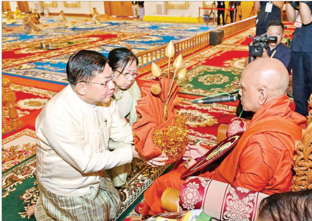
နိုင်ငံတော်စီမံအုပ်ချုပ်ရေးကောင်စီဥက္ကဋ္ဌ နိုင်ငံတော်ဝန်ကြီးချုပ် ဗိုလ်ချုပ်မှူးကြီး မင်းအောင်လှိုင်နှင့် ဇနီး ဒေါ်ကြူကြူလှ နိုင်ငံတော်သံဃမဟာနာယက အဖွဲ့ဥက္ကဋ္ဌ သန့်လျှင်မင်းကျောင်းဆရာတော်ကြီးထံ ဝါဆိုသင်္ကန်းနှင့် လှူဖွယ်ပစ္စည်းများ ဆက်ကပ်လှူဒါန်းစဉ်။

နေပြည်တော် ဇူလိုင် ၁၆ ပြည်ထောင်စုသမ္မတ မြန်မာနိုင်ငံတော် နိုင်ငံတော်စီမံအုပ်ချုပ်ရေးကောင်စီ၏ ၂၀၂၄ ခုနှစ် ဝါဆိုသင်္ကန်းဆက်ကပ်လှူဒါန်းပွဲ မဟာမင်္ဂလာအခမ်းအနားကို ယနေ့နံနက်ပိုင်းတွင် နေပြည်တော်ကောင်စီ နယ်မြေ ဥပဒေဌာနတော်တော်မြတ်ကြီး ပရိဝုဏ်တော်အတွင်းရှိ သာသနာ့မဟာဓိမာန်တော်ကြီး၌ ကျင်းပပြုလုပ်ရာ နိုင်ငံတော်စီမံအုပ်ချုပ်ရေးကောင်စီ ဥက္ကဋ္ဌ နိုင်ငံတော်ဝန်ကြီးချုပ် ဗိုလ်ချုပ်မှူးကြီး မင်းအောင်လှိုင်နှင့် ဇနီး ဒေါ်ကြူကြူလှတို့ တက်ရောက်ကြည့်ညှိပြီး ဝါဆိုသင်္ကန်းနှင့် လှူဖွယ်ပစ္စည်းများ ဆက်ကပ်လှူဒါန်းကြသည်။ ကြွရောက်ချီးမြှင့်တော်မူ အဆိုပါ အခမ်းအနားသို့ နိုင်ငံတော်သံဃမဟာနာယကအဖွဲ့ဥက္ကဋ္ဌ ရန်ကုန်တိုင်းဒေသကြီး သန့်လျှင်မြို့ မင်းကျောင်းပထမပြန်စာသင်တိုက် ပဓာနနာယကအဂ္ဂမဟာပဏ္ဍိတအဂ္ဂမဟာသဒ္ဓမ္မဇောတိက ဓမ္မဒေါက်တာဘဒ္ဒန္တ စန္ဒိမာဘိဝံသနှင့် နိုင်ငံတော်သံဃမဟာနာယကအဖွဲ့အကျိုးတော်ဆောင်မန္တလေးမြို့ မစိုးရိမ်တိုက်သစ် မဟာနာယက ဓမ္မသမိဒ္ဓိကျောင်းဆရာတော် အဂ္ဂမဟာပဏ္ဍိတ အဂ္ဂမဟာသဒ္ဓမ္မဇောတိက ဓမ္မာဓမ္မကထိက ဗဟုဇနဟိတ ရေဘဒ္ဒန္တ ဝါသေဋ္ဌဘိဝံသတို့ အမှူးပြုသော ဥပုသ်တော်သင်္ဂြိုဟ်တော်ဂေါပကအဖွဲ့၏ ဩဝါဒါစရိယဆရာတော်ကြီးများအပါအဝင် ပင့်ဖိတ်ထားသည့် ဆရာတော်ကြီး ၂၇ ဦး၊ ကြွရောက်ချီးမြှင့်တော်မူကြပြီး နိုင်ငံတော်စီမံအုပ်ချုပ်ရေးကောင်စီဥက္ကဋ္ဌ နိုင်ငံတော်ဝန်ကြီးချုပ်နှင့် ဇနီး၊ စာမျက်နှာ ၃ သို့ ။