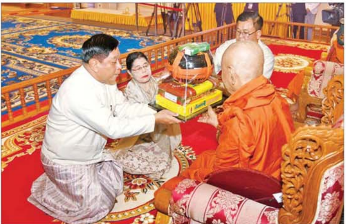
နိုင်ငံတော်စီမံအုပ်ချုပ်ရေးကောင်စီ အဖွဲ့ဝင် ဗိုလ်ချုပ်ကြီး တင်အောင်စန်းနှင့်ဇနီးတို့က ဝါကြီးကျောင်း ဆရာတော်ကြီးထံ ဝါဆိုသင်္ကန်းနှင့် လှူဖွယ်ပစ္စည်းများ ဆက်ကပ်လှူဒါန်းစဉ်။