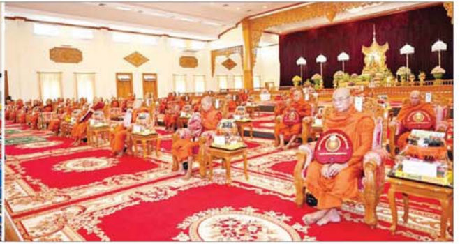
နိုင်ငံတော်စီမံအုပ်ချုပ်ရေးကောင်စီဥက္ကဋ္ဌ နိုင်ငံတော်ဝန်ကြီးချုပ် ဗိုလ်ချုပ်မှူးကြီး မင်းအောင်လှိုင်နှင့် ဇနီး ဒေါ်ကြူကြူလှနှင့် အခမ်းအနား တက်ရောက်လာကြသူများ ဆရာတော်ကြီးများ ရွတ်ပွားချီးမြှင့်တော်မူသည့် မေတ္တာသုတ်ပရိတ်တရားတော်များကို နာယူကြည့်ညိကြစဉ်။