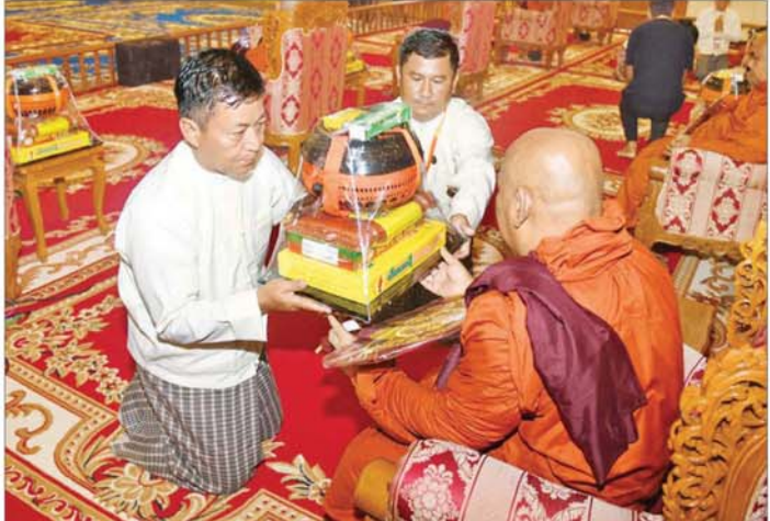
နိုင်ငံတော်စီမံအုပ်ချုပ်ရေးကောင်စီအဖွဲ့ဝင် ခွန်စံလှိုင် ဆရာတော်ကြီးထံ ဝါဆိုသင်္ကန်းနှင့် လှူဖွယ်ပစ္စည်းများ ဆက်ကပ်လှူဒါန်းစဉ်။