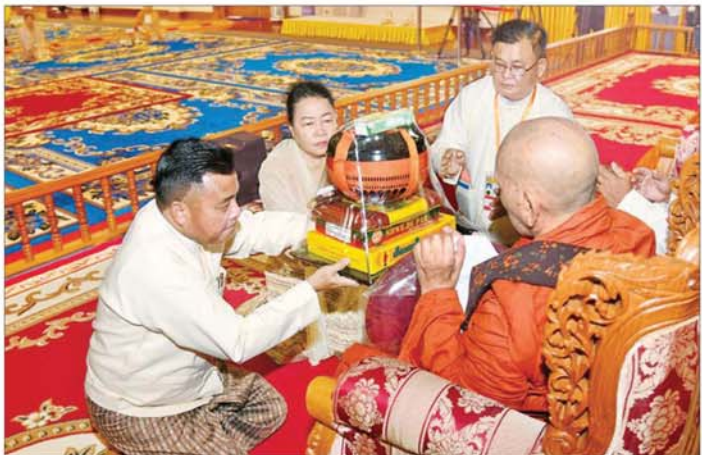
နိုင်ငံတော်စီမံအုပ်ချုပ်ရေးကောင်စီ တွဲဖက်အတွင်းရေးမှူး ဒုတိယဗိုလ်ချုပ်ကြီး ရဲဝင်းဦးနှင့်ဇနီးတို့က မဟာသီဟနာဒကျောင်း ဆရာတော်ကြီးထံ ဝါဆိုသင်္ကန်းနှင့် လှူဖွယ်ပစ္စည်းများ ဆက်ကပ်လှူဒါန်းစဉ်။