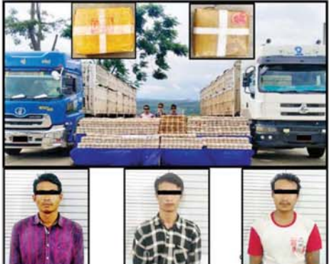
သိမ်းဆည်းရမိသည့် စိတ်ကြွေးသွပ်ဆေးပြားများနှင့်အတူ တွေ့ရစဉ်၊ ပြား ၁ ဒသမ ၉၅ သန်း သိမ်းဆည်းရမိခဲ့ပြီး စစ်ဆေးဖော်ထုတ်ချက်အရ ယင်းနေ့နံနက် ၁၀ နာရီခွဲတွင် ပြင်ဦးလွင်မြို့ ရပ်ကွက်ကြီး(၁၄) မြို့ရောင်လမ်း၌ မောင်ငယ်(ခ) ကျော်ကြီးကို ၁၈ ဘီးတွဲယာဉ် သတင်းစဉ်

တစ်စီး၊ စိတ်ကြွေးသွပ်ဆေးပြား ၇ ဒသမ ၂၅ သန်းနှင့် အတူဆက်လက်ဖော်ထုတ်ဖမ်းဆီးရမိခဲ့သဖြင့် စုစုပေါင်း တန်ဖိုးငွေကျပ် ၁၆ ဒသမ ၈ ဘီလီယံတန်ဖိုးရှိ စိတ်ကြွေးသွပ်ဆေးပြား ၁၁ ဒသမ ၂ သန်း သိမ်းဆည်းရမိခဲ့ကြောင်း၊ စစ်ဆေး ဖော်ထုတ်ချက်များအရ သိမ်းဆည်းရမိ စိတ်ကြွေးသွပ်ဆေးပြားများကို ရှမ်းပြည်နယ် (မြောက်ပိုင်း) မန္တလေးတိုင်းဒေသကြီးသို့ သယ်ဆောင်ခြင်းဖြစ်ကြောင်း သိရှိရသဖြင့် ၎င်းတို့ကို ဥပဒေအရ အရေးယူထားရှိပြီး ကွင်းဆက်ဖြစ်မှု ကျူးလွန်သူများကို ဆက်လက်စစ်ဆေးဖော်ထုတ်လျက်ရှိကြောင်း သိရသည်။