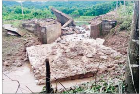
KNLA အဖွဲ့မှ အကြမ်းဖက်မှုကို လိုလားသူများနှင့် PDF အမည်ခံ အကြမ်းဖက်ပူးပေါင်းအဖွဲ့တို့မှ မိုင်းထောင်ဖောက်ခွဲဖျက်ဆီး မှုကြောင့် ပျက်စီးခဲ့သည့် တံတားအား တွေ့မြင်ရစဉ်။