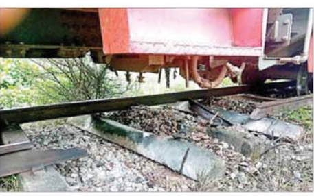
ပဲခူး-မော်လမြိုင်လမ်းပိုင်း သိမ်ဆိပ်ဘူတာနှင့် ဒုံဝန်းဘူတာအကြား အမှတ်(၈၂)အစုန် လူစီးအမြန်ရထား လမ်းချော့ကျမှုအခြေအနေ။

နေပြည်တော် ၇ ဇူလိုင် ၁၇ ယနေ့ မော်လမြိုင်မှထွက်ခွာ လာသည့် အမှတ်(၈၂)အစုန် မော်လမြိုင်-ရန်ကုန် လူစီးအမြန် ရထားသည် မွန်ပြည်နယ် သထုံ မြို့နယ် သိမ်ဆိပ်ဘူတာနှင့် ဒုံဝန်း ဘူတာအကြား မိုင်တိုင်အမှတ် ၁၂၃/၁၇-၁၅ သို့ နံနက် ၁၁ နာရီ ၁၀ မိနစ်အချိန် ရထားရောက်ရှိ ဖြတ်သန်းစဉ် အဆိုပါနေရာ၌ ရထားလမ်း မိုင်းပေါက်ကွဲထား ခြင်းကြောင့် သံလမ်းတစ်ပေခွဲခန့် ပြတ်တောက်နေသဖြင့် စက်ခေါင်း နှင့်အတူ ရထားတွဲဆိုင်းတွင် ပါရှိ သော လူစီးတွဲနှစ်တွဲ လမ်းချော့ကျမှု ဖြစ်ပွားခဲ့သည်။ ရထားလမ်းချော့ ကျမှုကြောင့် ခရီးသည်နှင့် ဝန်ထမ်း ထိခိုက်မှုမရှိဘဲ သိမ်ဆိပ်-ဒုံဝန်း လမ်းပိုင်းအား နံနက် ၁၁ နာရီ ၁၃ မိနစ်တွင် ယာယီတံတားခဲ့ရသည်။ လမ်းပိုင်း ပိတ်ဆို့မှုကြောင့် ယနေ့နံနက်ပိုင်းတွင် ရန်ကုန်မှ ပုံမှန်ထွက်ခွာလာသော အမှတ် (၈၁)အဆန် လူစီးရထားသည် နံနက် ၁၁ နာရီ ၄၄ မိနစ် အချိန် တွင် ကျိုက်ထိုသို့ ရောက်ရှိနေပြီး အဆိုပါရထားတွင် ရိုးရိုးတန်းခရီး သည် ၂၄၀ နှင့် အထက်တန်း ခရီး သည် ၂၃၇ ဦး စုစုပေါင်း ၆၇၇ ဦး ပါရှိကြောင်း သိရသည်။ လမ်းချော့ကျသည့် မော်လမြိုင်