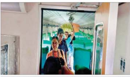
ပဲခူး-မော်လမြိုင်လမ်းပိုင်း သိမ်ဆိပ်ဘူတာနှင့် ဒုံဝန်းဘူတာအကြား ရထားလမ်းချော့ကျသည့် အမှတ်(၈၂)အစုန် ရထားပေါ်မှ ခရီးသည်များ ရထားကူးပြောင်းနေစဉ်။

မှထွက်ခွာလာသော အမှတ်(၈၂) အစုန် လူစီးအမြန်ရထားပေါ်တွင် လိုက်ပါလာသည့် ရိုးရိုးတန်းခရီး သည် ၃၃၃ ဦးနှင့် အထက်တန်းခရီး သည် ၁၄၆ ဦး စုစုပေါင်း ၄၇၉ ဦး အား ဆက်လက်ထွက်ခွာနိုင်ရေး အတွက် ကျိုက်ထိုတွင် ရောက်ရှိ နေသော အမှတ်(၈၁)အဆန် လူစီး အမြန်ရထားသည် ရထားလမ်း ချော့ကျသည့် နေရာသို့ ရောက်ရှိ ပြီး ညနေ ၄ နာရီခွဲတွင် ခရီးသည် များအား ရထားကူးပြောင်းပြီးစီး၍ ညနေ ၅ နာရီခွဲတွင် အမှတ်(၈၂) အစုန် လူစီးအမြန်ရထားအဖြစ် ပေးနိုင်ခဲ့သည်။ အမှတ်(၈၁)အဆန် လူစီးအမြန် ရထားမှ ခရီးသည်များ ဆက်လက် ထွက်ခွာနိုင်ရေးအတွက် လမ်းချော့