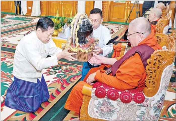
နိုင်ငံတော်စီမံအုပ်ချုပ်ရေးကောင်စီဥက္ကဋ္ဌ တပ်မတော်ကာကွယ်ရေးဦးစီးချုပ် ဗိုလ်ချုပ်မှူးကြီး မင်းအောင်လှိုင်နှင့် ဇနီး ဒေါ်ကြူကြူလှ နိုင်ငံတော်သံဃမဟာနာယကအဖွဲ့ဥက္ကဋ္ဌ သန့်လျင်မင်းကျောင်း ဆရာတော်ကြီး ဒေါက်တာဘဒ္ဒန္တ စန္ဒိမာဘိဝံသ အမှူးပြုသည့် ဆရာတော်၊ သံဃာတော်များအား နေ့ဆွမ်း ဆက်ကပ်လှူဒါန်းစဉ်။