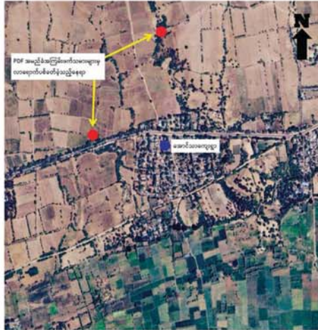
PDF အမည်ခံအကြမ်းဖက်သမားများက ပခုက္ကူမြို့ အောင်သာကျေးရွာအတွင်းသို့ လက်နက်ကြီး၊ လက်နက်ငယ်များ၊ Drop Bomb များဖြင့် ပစ်ခတ်တိုက်ခိုက်ခဲ့သည့် ဖြစ်စဉ်ပြပုံ။

ထိုသို့ ဒေသခံပြည်သူများ အေးချမ်းစွာနေထိုင်လျက်ရှိသော မြို့၊ ရွာများအတွင်းသို့ လက်နက်ကြီး၊ လက်နက်ငယ်များ၊ Drop Bomb များ ကြဲချတိုက်ခိုက်ခြင်းကြောင့် ပြည်သူလူထု၏ အသက်အိုးအိမ်၊ စည်းစိမ်များ ပျက်စီးဆုံးရှုံးခဲ့ရပြီး ထိုသို့ အကြမ်းဖက်သမားများ၏ လုပ်ရပ်များကို ဒေသခံပြည်သူလူထုမှ လုံးဝလက်ခံနိုင်ခြင်းမရှိဘဲ