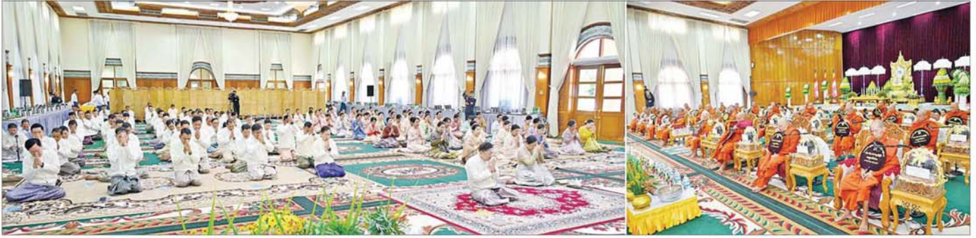
နိုင်ငံတော်စီမံအုပ်ချုပ်ရေးကောင်စီဥက္ကဋ္ဌ တပ်မတော်ကာကွယ်ရေးဦးစီးချုပ် ဗိုလ်ချုပ်မှူးကြီးမင်းအောင်လှိုင်နှင့် ဇနီး ဒေါ်ကြူကြူလှ၊ အခမ်းအနား တက်ရောက်လာကြသူများ နိုင်ငံတော်သံဃမဟာနာယက အဖွဲ့ဥက္ကဋ္ဌ သန့်လျင်မင်းကျောင်းဆရာတော်ကြီး ဒေါက်တာဘဒ္ဒန္တ စန္ဒိမာဘိဝံသထံမှ ကိုးပါးသီလ ခံယူဆောက်တည်ကြစဉ်။