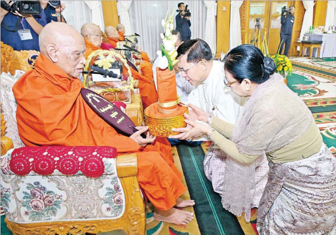
နိုင်ငံတော်စီမံအုပ်ချုပ်ရေးကောင်စီဥက္ကဋ္ဌ တပ်မတော်ကာကွယ်ရေးဦးစီးချုပ် ဗိုလ်ချုပ်မှူးကြီးမင်းအောင်လှိုင်နှင့်ဇနီး ဒေါ်ကြူကြူလှတို့ နိုင်ငံတော်သံဃမဟာနာယက အဖွဲ့ဥက္ကဋ္ဌ သန့်လျင်မင်းကျောင်း ဆရာတော်ကြီး ဒေါက်တာဘဒ္ဒန္တ စန္ဒီမာဘိဝံသတို့ ဝါဆိုသင်္ကြန် ဆက်ကပ်လှူဒါန်းစဉ်။

နေပြည်တော် ဇူလိုင် ၁၇ ၂၀၂၄ ခုနှစ် ကာကွယ်ရေးဦးစီးချုပ်ရုံး(ကြည်း၊ ရေ၊ လေ) မိသားစုများ ဝါဆိုသင်္ကြန်ဆက်ကပ်လှူဒါန်းပွဲ မဟာမင်္ဂလာအခမ်းအနားကို ယနေ့နံနက်ပိုင်းတွင် ကာကွယ်ရေးဦးစီးချုပ်ရုံး(ကြည်း) အနော်ရထာခန်းမ၌ ကျင်းပပြုလုပ်ရာ နိုင်ငံတော်စီမံအုပ်ချုပ်ရေးကောင်စီဥက္ကဋ္ဌ တပ်မတော် ကာကွယ်ရေးဦးစီးချုပ် ဗိုလ်ချုပ်မှူးကြီး မင်းအောင်လှိုင်နှင့်ဇနီး ဒေါ်ကြူကြူလှတို့ တက်ရောက်ကြည့်ရှု၍ ဝါဆိုသင်္ကြန်၊ လှူဖွယ်ပစ္စည်းများနှင့် နေ့ဆွမ်းတို့ကို ဆက်ကပ်လှူဒါန်းသည်။