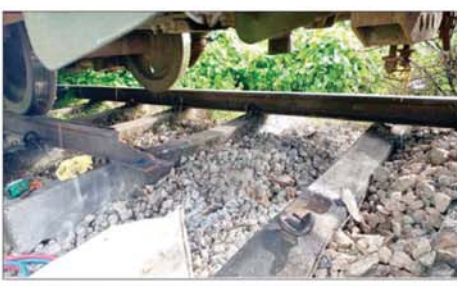
ပဲခူး-မော်လမြိုင်လမ်းပိုင်း သိမ်ဆိပ်ဘူတာနှင့် ဒုံဝန်းဘူတာအကြား ရထားလမ်းချော့ကျသည့် အမှတ်(၈၂)အစုန် ရထားပေါ်မှ ခရီးသည်များ ရထားကူးပြောင်းနေစဉ်။

မှထွက်ခွာလာသော အမှတ်(၈၂) အစုန် လူစီးအမြန်ရထားပေါ်တွင် လိုက်ပါလာသည့် ရိုးရိုးတန်းခရီး သည် ၃၃၃ ဦးနှင့် အထက်တန်းခရီး သည် ၁၄၆ ဦး စုစုပေါင်း ၄၇၉ ဦး အား ဆက်လက်ထွက်ခွာနိုင်ရေး အတွက် ကျိုက်ထိုတွင် ရောက်ရှိ နေသော အမှတ်(၈၁)အဆန် လူစီး အမြန်ရထားသည် ရထားလမ်း ချော့ကျသည့် နေရာသို့ ရောက်ရှိ ပြီး ညနေ ၄ နာရီခွဲတွင် ခရီးသည် များအား ရထားကူးပြောင်းပြီးစီး၍ ညနေ ၅ နာရီခွဲတွင် အမှတ်(၈၂) အစုန် လူစီးအမြန်ရထားအဖြစ် ပေးနိုင်ခဲ့သည်။ အမှတ်(၈၁)အဆန် လူစီးအမြန် ရထားမှ ခရီးသည်များ ဆက်လက် ထွက်ခွာနိုင်ရေးအတွက် လမ်းချော့