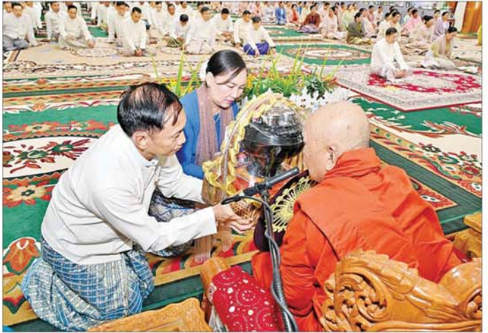
ကာကွယ်ရေးဦးစီးချုပ်(ရေ)နှင့်ဇနီးတို့က ဆရာတော်ထံ ဝါဆိုသင်္ကန်းနှင့် လှူဖွယ်ပစ္စည်းများ ဆက်ကပ်လှူဒါန်းစဉ်။