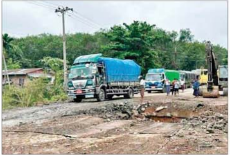
မွန်ပြည်နယ် သထုံမြို့နယ် ကရင်လေးဆိပ်ကျေးရွာအနီးရှိ တံတားအား မော်တော်ယာဉ်များ ဖြတ်သန်းသွားလာနိုင်ရေး ယာယီ တံတား ဆောင်ရွက်ပေးထားမှုအား တွေ့မြင်ရစဉ်။