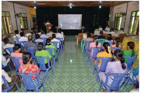
စက်ချုပ်သင်တန်းဖွင့်ပွဲအခမ်းအနား ကျင်းပ

ဖြင့် ရှမ်းပြည်နယ်တောင်ပိုင်း ၁၂ ခု၊ ပအိုဝ်းကိုယ်ပိုင်အုပ်ချုပ်ခွင့်ရ ဒေသ ခြောက်ခု၊ ဓနုကိုယ်ပိုင် အုပ်ချုပ်ခွင့်ရဒေသ တစ်ခု၊ တာချီ လိတ်ခရိုင် ငါးခု၊ ရှမ်းပြည်နယ် မြောက်ပိုင်း ရှစ်ခု၊ စုစုပေါင်း ၃၂ ခုအား အကောင်အထည်ဖော် ဆောင်ရွက်ခဲ့ပါတယ်။ ဒီလို ဆောင်ရွက်ရာမှာ ရှမ်းပြည်နယ် အစိုးရအဖွဲ့ ခွင့်ပြုရန်ပုံငွေကျပ် သန်း ၃၂၀ အနက်မှ ငွေကျပ် သန်း ၁၆၀ အား စီမံကိန်းဒေသ များမှ တောင်းဆိုသည့် အသက်