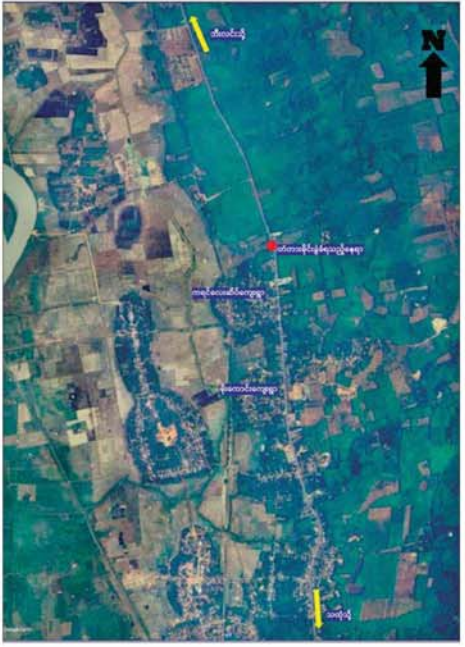
မွန်ပြည်နယ် သထုံမြို့နယ် ကရင်လေးဆိပ်ကျေးရွာအနီးရှိ တံတားအား KNLA အဖွဲ့မှ အကြမ်းဖက်မှုကို လိုလားသူများနှင့် PDF အကြမ်းဖက်ပူးပေါင်းအဖွဲ့မှ မိုင်းထောင်ဖောက်ခွဲ ဖျက်ဆီးခဲ့သည့် ဖြစ်စဉ်ပြပုံ။

သွားသည့် တံတားအား အမြန်ဆုံးပြန်လည်ပြုပြင်နိုင်ရေး ဆက်လက် ဆောင်ရွက်လျက်ရှိကြောင်း သိရသည်။ သတင်းစဉ်