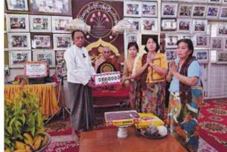
က လက်ခံရယူသည်။ တော်တို့အား နေ့ဆွမ်းဆက်ကပ်အဆိုပါ အလှူရှင်မိသားစုများ ခဲ့ကြောင်း သိရသည်။ က ကျောင်းအုပ်ဆရာတော်အဖူး (အပေါ်ပုံ) ပြုသော ဆရာတော်၊ သံဃာ (ကဆ)