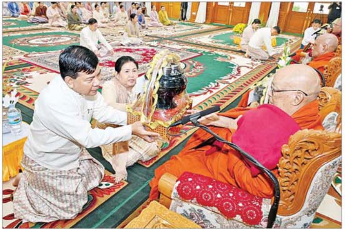
ညှိနှိုင်းကွပ်ကဲရေးမှူး (ကြည်း) ရှေ့ လေ) ဗိုလ်ချုပ်ကြီးမောင်မောင်အေးနှင့် ဇနီးတို့က ဆရာတော်ထံ ဝါဆိုသင်္ကန်းနှင့် လှူဖွယ်ပစ္စည်းများ ဆက်ကပ်လှူဒါန်းစဉ်။

တပ်မတော် ကာကွယ်ရေးဦးစီး ချုပ်နှင့် ဇနီးတို့က နိုင်ငံတော် သံဃမဟာနာယကအဖွဲ့ ဥက္ကဋ္ဌ သန့်လျင်မင်းကျောင်း ဆရာတော် ကြီးထံ ဝါဆိုသင်္ကန်းနှင့် လှူဖွယ် ပစ္စည်းများကို ဆက်ကပ်လှူဒါန်း သည်။ ဆက်လက်၍ နိုင်ငံတော်စီမံ အုပ်ချုပ်ရေးကောင်စီ ဒုတိယ ဥက္ကဋ္ဌ ဒုတိယတပ်မတော် ကာကွယ်ရေးဦးစီးချုပ် ကာကွယ် ရေးဦးစီးချုပ်(ကြည်း)က နိုင်ငံတော် စာမျက်နှာ ၄ သို့