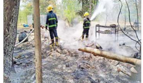
PDF အမည်ခံအကြမ်းဖက်သမားများက ပခုက္ကူမြို့ အောင်သာကျေးရွာအတွင်းရှိ နေအိမ်များအား မီးရှို့ဖျက်ဆီးခဲ့မှုကြောင့် မီးလောင်ပျက်စီးခဲ့ရသည့် နေအိမ်များအား တွေ့မြင်ရစဉ်။