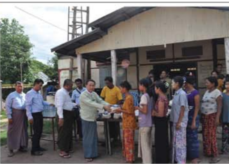
ဝင်များ၊ မြို့နယ်ဦးစီးဌာနမှ တာဝန်ရှိသူများ၊ သက်ဆိုင်ရာရပ်ကွက်အုပ်ချုပ်ရေးမှူး ပူးပေါင်း၍ စုစုပေါင်းငွေကျပ် ၈၃၄၀၀ (ရှစ်သိန်းသုံးသောင်းလေးထောင်

မန္တလေး ဇူလိုင် ၁၇ သင်ကြားရေးကျောင်းရှိ ရှင်ရှင်များအသင်း၏ 'ဝါဆိုသင်္ကန်းကပ်လှူပွဲနှင့် ကျောင်းသုံးပစ္စည်းများ၊ ထောက်ပံ့ပေးအပ်ပွဲ' ကို ဇူလိုင် ၁၆ ရက် နံနက်ပိုင်းက မန္တလေးမြို့၊ ချမ်းမြသာစည်မြို့နယ်၊ အောင်ပင်လယ် စောမွန်လှ သစ္စာအိမ်ခြံမြေအောင် ဆုတောင်းပြည့် မြတ်ဘာန်ဂါးကိုးကောင်ဘုရား စောမွန်လှပေါ်တော်မူဘုန်းတော်ကြီးပညာသင်ကြားရေးကျောင်းတွင် စည်ကားသိုက်မြိုက်စွာ ကျင်းပခဲ့သည်။ အဆိုပါ လှူဒါန်းပွဲတွင် ပဓာနနာယကတို့က အုပ်ဆရာတော်၊ နဂါးကိုးကောင် ဆရာတော် သဒ္ဓမ္မဇောတိကဓဇဘဒ္ဒန္တရာဇိန္ဒာ အမှူးရှိသော သံဃာတော်တို့အား ဝါဆိုသင်္ကန်းနှင့် အခြေခံပစ္စည်းများကို အဆိုပါ ကျောင်းတွင် ဝါဆိုလပြည့်နေ့၌ နဂါးကိုးကောင် ဆရာတော်အဖူးရှိသော ဆရာတော်၊ သံဃာတော်များအား ဝါဆိုသင်္ကန်းနှင့် အခြေခံပစ္စည်းများအား ဆက်ကပ်လှူဒါန်း၍ ကျောင်းသား၊ ကျောင်းသူ ၁၀၀၀ ကျော်တို့အတွက် ပညာရေးငွေပဒေသာပင် စိုက်ထူလှူဒါန်းပွဲကို ကျင်းပမည်ဖြစ်ရာ စောမွန်လှဆွေတော်မျိုးတော်များ ပဌာန်းဆက် အလှူငွေအနေဖြင့် ထံမှ သီလတရားများကို ခံယူဆောက်တည်၍ ရေစက်ချအနုမောဒနာတရားများကို နာယူလှူဒါန်းခဲ့ကြသည်။ ထို့နောက် စောမွန်လှ ပေါ်တော်မူဘုန်းတော်ကြီး ပညာ