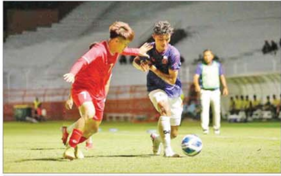
မြန်မာအသင်းနှင့် ဗီယက်နမ်အသင်းတို့ ယှဉ်ပြိုင်ကစားကြစဉ်။