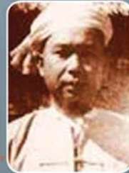
စဝ်စံထွန်း