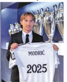
မိုဒရစ်က ကွန်တော် အသင်းနဲ့ ချုပ်ဆိုခဲ့သည်။ (အောက်ပုံ) (NGB)

မက်ဒရစ် ဇူလိုင် ၁၈ ရိုးရဲလ်မက်ဒရစ်အသင်းသည် ဘောလုံးရာသီမှာလည်း အောင်မြင်မှုတွေ ရယူသွားလိမ့်မဟုတ်ပါ။ အထိ သက်တမ်းတိုးစာချုပ် ချုပ်ဆိုခဲ့သည်။ အဆိုပါ ဝါရင့်ကွင်းလယ်ကစားသမားသည် ရိုးရဲလ်မက်ဒရစ်အသင်းနှင့်အတူ ၂၀၂၁-၂၀၂၃ နှစ်ရာသီအထိ ပြိုင်ပွဲစုံ ၅၃ ပွဲ ကစားကာ ၃၉ ဂိုး သွင်းယူပြီး ခြေစွမ်းပြနိုင်ခဲ့ခြင်းကြောင့် အသင်းက သက်တမ်းတိုးစာချုပ် ချုပ်ဆိုခဲ့ခြင်း ဖြစ်သည်။ အသက် ၃၈ နှစ်အရွယ်ရှိ မိုဒရစ်က ကွန်တော် အသင်းနဲ့