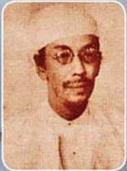
ဒီးဒုတ်ဦးဘချို