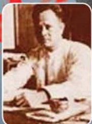
မန်းဘခိုင်