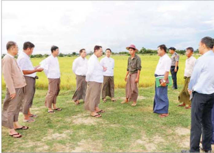
ရှိသူများအနေဖြင့်လည်း ဈေးနှုန်းသက်သာပြီး ပိုးသတ်ဆေး၊ ပေါင်းသတ်ဆေးများကို တောင်းသူများ အရည်အသွေးမှန်ကန်သောမျိုးနှင့် သွင်းအားစု လက်ဝယ်စိုက်ပျိုးချိန်အစီရရှိရေး ပေါင်းစပ်ဆောင်

တင်ပြမှုများအပေါ် ပြည်ထောင်စုဝန်ကြီးက သီးနှံစိုက်ပျိုးရာတွင် လိုက်နာရမည့် မျိုး၊ မြေ၊ ရေ၊ နည်း ဆိုသည့် စိုက်နည်းစနစ်လေးမျိုးကို မှန်ကန်စွာ အသုံးပြုဆောင်ရွက်ကြရန်နှင့် သက်ဆိုင်ရာတာဝန်