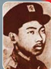
ရဲဘော်ကိုထွေး