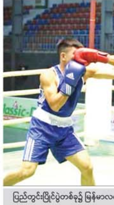
ပြည်တွင်းပြိုင်ပွဲတစ်ခု၌ မြန်မာလက်ဝှေ့သမားများ ယှဉ်ပြိုင်နေကြစဉ်။

များအနေဖြင့် ဇူလိုင် ၂၅ ရက် နောက်ဆုံးထား၍ စာရင်းပေးသွင်းနိုင်ကြောင်း သိရသည်။ အဆိုပါ လက်ဝှေ့စစ်ပွဲကို မြန်မာနိုင်ငံလက်ဝှေ့အဖွဲ့ချုပ်နှင့် ဂျပန်လက်ဝှေ့ကော်မရှင်တို့က ကြီးကြပ်မည်ဖြစ်ပြီး အမျိုးသားများ သုံးမိနစ်လေးချိန်နှင့် အမျိုးသမီးများ နှစ်မိနစ်လေးချိန်ယှဉ်ပြိုင်ရမည်ဖြစ်သည်။ လက်ဝှေ့စစ်ပွဲအောင်မြင်သူများကို စခန်းသွင်းလေ့ကျင့်ပေးပြီး ဂျပန်နိုင်ငံရှိ ပြိုင်ပွဲများသို့ စေလွှတ်မည်ဖြစ်ကြောင်း ဆုကြေးစား(ပရော်ဖက်ရှင်နယ်)လက်ဝှေ့သမားများသည် ပြိုင်ပွဲအနိုင်ရရှိမှုအပေါ် မူတည်၍ ထိုးသတ်ကြေးရရှိမည်ဖြစ်ကြောင်း သိရသည်။ ကိုထက်