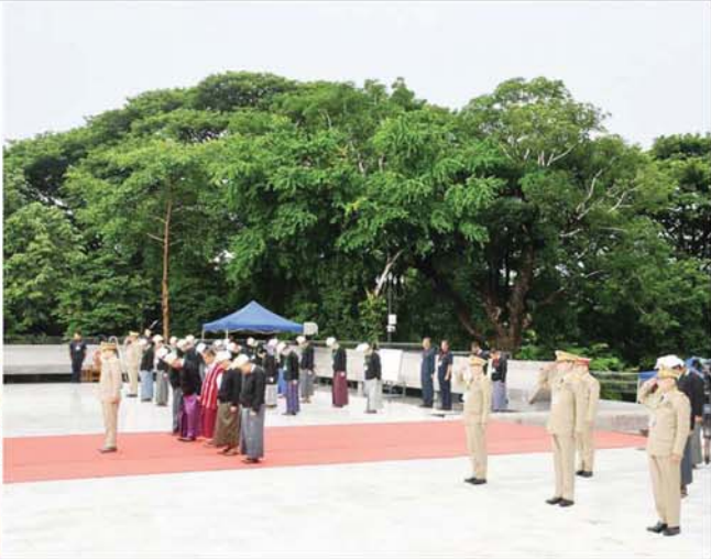
နိုင်ငံတော်စီမံအုပ်ချုပ်ရေးကောင်စီအဖွဲ့ဝင် ညှိနှိုင်းကွပ်ကဲရေးမှူး(ကြည်း၊ ရေ၊ လေ) ဗိုလ်ချုပ်ကြီးမောင်မောင်အေး (၇၇)နှစ်မြောက် အာဇာနည်နေ့အခမ်းအနားသို့ တက်ရောက်လာကြသူများနှင့်အတူ ဗိုလ်ချုပ်အောင်ဆန်းနှင့်တကွ အာဇာနည်ခေါင်းဆောင်ကြီးများ၏ ဂူစီမံခန့်ခွဲ ပြည်ထောင်စုသမ္မတ မြန်မာနိုင်ငံတော်၏ လွမ်းသင်္သယံဇာတအဖြစ် အလေးပြုကြစဉ်။

နေပြည်တော် ၇ လိုဏ် ၁၉ ၂၀၂၄ ခုနှစ် (၇၇)နှစ်မြောက် အာဇာနည်နေ့အခမ်းအနားကို ယနေ့ နံနက် ၈ နာရီတွင် ရန်ကုန်မြို့၊ ဗဟန်းမြို့နယ်ရှိ အာဇာနည်မိမာန်၌ ကျင်းပရာ နိုင်ငံတော်စီမံအုပ်ချုပ်ရေးကောင်စီအဖွဲ့ဝင် ညှိနှိုင်းကွပ်ကဲရေးမှူး(ကြည်း၊ ရေ၊ လေ)ဗိုလ်ချုပ်ကြီး မောင်မောင်အေး တက်ရောက် ဂါရဝပြုသည်။ အခမ်းအနားသို့ နိုင်ငံတော်စီမံအုပ်ချုပ်ရေးကောင်စီအဖွဲ့ဝင် မန်းငြိမ်းမောင်နှင့် ဒေါက်တာမူထန်၊ ပြည်ထောင်စုတရားသူကြီးချုပ် ဦးသာဌေး၊ (၇၇)နှစ်မြောက် အာဇာနည်နေ့ အခမ်းအနားကျင်းပရေး ဗဟိုကော်မတီဥက္ကဋ္ဌ သာသနာရေးနှင့် ယဉ်ကျေးမှုဝန်ကြီးဌာန ပြည်ထောင်စုဝန်ကြီး ဦးတင်ဦးလွင်၊ ပြည်ထောင်စုဝန်ကြီးများဖြစ်ကြသည့် ဦးမောင်မောင်အုန်း၊ ဦးမြင့်နောင်၊ စာမျက်နှာ ၃ သို့ ။