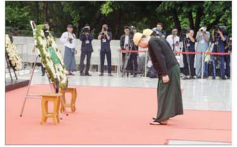
ပြည်ထောင်စုကြံ့ခိုင်ရေးနှင့် ဖွံ့ဖြိုးရေးပါတီမှ ကိုယ်စားလှယ်များက လွှမ်းသူ့ပန်းခွေချ အလေးပြုစဉ်။