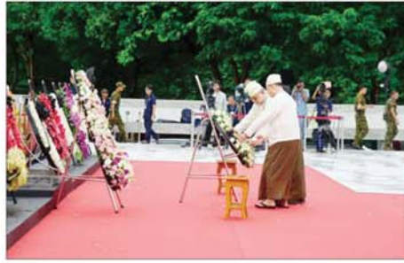
မြန်မာနိုင်ငံ စစ်မှုထမ်းဟောင်းအဖွဲ့မှ တာဝန်ရှိသူများက လွှမ်းသူ့ပန်းခွေချ အလေးပြုစဉ်။