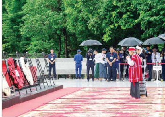
မန်းဘခိုင်၏ မိသားစုဝင်များက လွမ်းသူ့ပန်းခွေချ ဂါရဝပြုပြီး ဆုတောင်းမေတ္တာပို့သစဉ်။

ဦးစွာ နိုင်ငံတော်စီမံအုပ်ချုပ်ရေးကောင်စီအဖွဲ့ဝင် ညိုနှိုင်းကွပ်ကဲရေးမှူး (ကြည်း၊ ရေ၊ လေ) ဗိုလ်ချုပ်ကြီး မောင်မောင်အေးသည် အဖွဲ့ဝင်များနှင့် အတူ အာဇာနည် ခေါင်းဆောင်ကြီးများ၏ မိသားစုဝင်များအား ရင်းရင်းနှီးနှီး တွေ့ဆုံနှုတ်ဆက်ကြသည်။ ထို့နောက် နိုင်ငံတော်စီမံအုပ်ချုပ်ရေးကောင်စီအဖွဲ့ဝင် ညိုနှိုင်းကွပ်ကဲရေးမှူး (ကြည်း၊ ရေ၊ လေ) ဗိုလ်ချုပ်ကြီး မောင်မောင်အေးသည် ကောင်စီအဖွဲ့ဝင်များဖြစ်ကြသည့် စာမျက်နှာ ၄ သို့ »