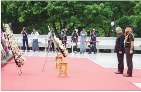
မြန်မာနိုင်ငံဆိုင်ရာ အိန္ဒိယသံရုံးမှ တာဝန်ရှိသူများက လွှမ်းသူ့ ပန်းခွေချ အလေးပြုစဉ်။