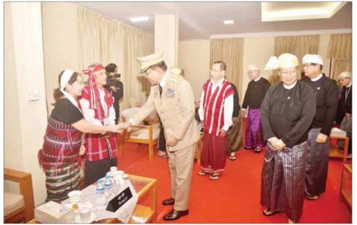
နိုင်ငံတော်စီမံအုပ်ချုပ်ရေးကောင်စီအဖွဲ့ဝင် ညိုနှိုင်းကွပ်ကဲရေးမှူး (ကြည်း၊ ရေ၊ လေ) ဗိုလ်ချုပ်ကြီးမောင်မောင်အေးက အာဇာနည်ခေါင်းဆောင်ကြီးများ၏ မိသားစုဝင်များနှင့် ဖိတ်ကြားထားသူများအား ရင်းရင်းနှီးနှီး တွေ့ဆုံနှုတ်ဆက်စဉ်။