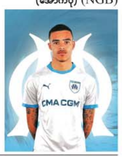
(အောက်ပုံ) (NGB)

ဆေးလ် အသင်းက ခေါ်ယူခဲ့ခြင်းဖြစ်သည်။ အသက်(၂၂)နှစ်အရွယ်ရှိ ဂရင်းဝုဒ်က 'ကျွန်တော်အာဆေးလ်အသင်းမှာ ကျောနှံပါတ် ၁၀ ဂျာစီအား ဝတ်ဆင်ကစားသွားမှာပါ။ ကျွန်တော်ကို နွေးထွေးစွာကြိုဆိုခဲ့တဲ့ အသင်းတာဝန်ရှိသူအား လုံးကိုလည်း အထူးကျေးဇူးတင်ပါတယ်' ဟု ပြောသည်။