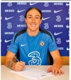
မစောင့်နိုင်လောက်အောင်ပါ။ ဒီအသင်းနဲ့အတူ ဆုပေးလာတွေလည်း ရယူသိမ်းပိုက်သွားမှာပါ ဟု ပြောသည်။