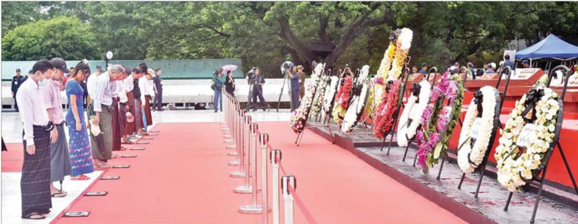
အာဇာနည်ဗိမာန်တွင် လာရောက် ဂီရဝပြုကြသည့် ရဟန်းရှင်လူများ၊ ကျောင်းသား ကျောင်းသူများနှင့် ပြည်သူများကို တွေ့ရစဉ်။