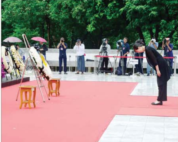
မြန်မာနိုင်ငံဆိုင်ရာ တရုတ်သံရုံးမှ တာဝန်ရှိသူတစ်ဦးက လွမ်းသ့ပန်းခွေချ အလေးပြုစဉ်။