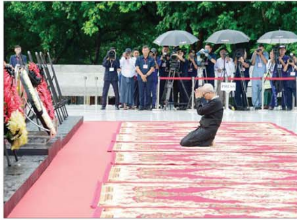
ဒီးဒုတ်ဦးဘချို၏ မိသားစုဝင်တစ်ဦးက လွမ်းသူ့ပန်းခွေချ ဂါရဝပြုပြီး မေတ္တာပို့သ အမျှပေးဝေစဉ်။

ဒေါက်တာသက်ခိုင်ဝင်း၊ (၇၇)နှစ် မြောက် အာဇာနည်နေ့ အခမ်းအနားကျင်းပရေး လုပ်ငန်းကော်မတီဥက္ကဋ္ဌ ရန်ကုန်တိုင်းဒေသကြီးဝန်ကြီးချုပ် ဦးစိုးသိန်း၊ ကာကွယ်ရေး ဦးစီးချုပ်ရှုံးမှ တပ်မတော်အရာရှိကြီးများ၊ ရန်ကုန်တိုင်းစစ်ဌာနချုပ် တိုင်းမှူး၊ ဒုတိယဝန်ကြီးများ၊ တိုင်းဒေသကြီးဝန်ကြီးများ၊ အခမ်းအနားကျင်းပရေး လုပ်ငန်းကော်မတီဝင်များ၊ ဌာနဆိုင်ရာ တာဝန်ရှိသူများ၊ အာဇာနည်ခေါင်းဆောင်ကြီးများ၏ မိသားစုဝင်များ၊ ဖိတ်ကြားထားသူများ တက်ရောက်ကြသည်။