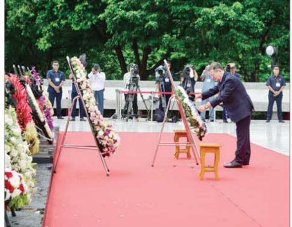
မြန်မာနိုင်ငံဆိုင်ရာ ရုရှားသံရုံးမှ တာဝန်ရှိသူတစ်ဦးက လွမ်းသ့ပန်းခွေချ အလေးပြုစဉ်။

အသင်း၊ မြန်မာ-အိန္ဒိယ ချစ်ကြည် ရေးနှင့်ဖွံ့ဖြိုးတိုးတက်ရေးအသင်း၊ မြန်မာနိုင်ငံ မိခင်နှင့်ကလေး စောင့်ရှောက်ရေးအသင်း၊ မြန်မာ နိုင်ငံ ကင်းထောက်အဖွဲ့ချုပ်၊ မြန်မာ မွတ်စလင်အမျိုးသား ရေးရာအဖွဲ့ချုပ်၊ မြန်မာနိုင်ငံစစ်မှု ထမ်းဟောင်းအဖွဲ့၊ မြန်မာနိုင်ငံ