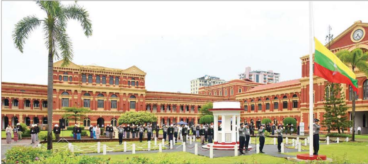
ဝန်ကြီးများရုံး(ယခင်အတွင်းဝန်ရုံး)၌ (၇၇)နှစ်မြောက် အာဇာနည်နေ့ဝမ်းနည်းခြင်းအထိမ်းအမှတ် နိုင်ငံတော်အလံအား တိုင်ဝက်လျှော့ချလွှင့်ထူ၍ အလေးပြုခြင်းအခမ်းအနား ကျင်းပစဉ်။

ရန်ကုန် ဇူလိုင် ၁၉ (၇၇)နှစ်မြောက် အာဇာနည်နေ့တွင် ဝမ်းနည်းခြင်းအထိမ်းအမှတ် နိုင်ငံတော်အလံအား တိုင်ဝက်လျှော့ချလွှင့်ထူ၍ အလေးပြုခြင်းအခမ်းအနားကို ယနေ့နံနက် ၇ နာရီခွဲက ဗိုလ်ချုပ်အောင်ဆန်းနှင့် တကွ အာဇာနည်ခေါင်းဆောင်ကြီးများ ကျဆုံးခဲ့ရာ ရန်ကုန်မြို့ ဗိုလ်တထောင်မြို့နယ် သိမ်ဖြူလမ်းရှိ ဝန်ကြီးများရုံး (ယခင်အတွင်းဝန်ရုံး)၌ ကျင်းပသည်။