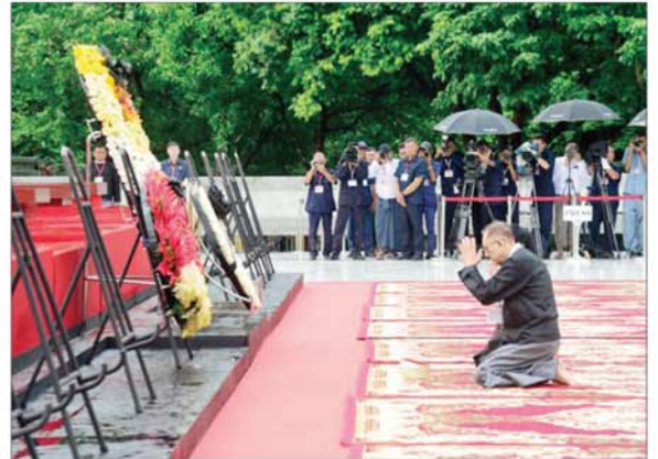
အာဇာနည်ခေါင်းဆောင်ကြီး ဗိုလ်ချုပ်အောင်ဆန်း၏ သားအကြီးဖြစ်သူ ဦးအောင်ဆန်းဦးက လွမ်းသူ့ပန်းခွေချ ဂါရဝပြုပြီး မေတ္တာပို့သ အမျှပေးဝေစဉ်။