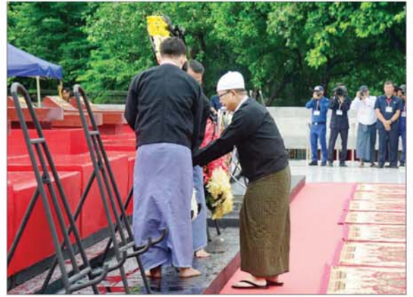
ဦးဘဝင်း၏ မိသားစုဝင်များကိုယ်စား ကိုယ်စားလှယ်တစ်ဦးက လွမ်းသူ့ပန်းခွေချ ဂါရဝပြုစဉ်။

ဦးစွာ နိုင်ငံတော်စီမံအုပ်ချုပ်ရေးကောင်စီအဖွဲ့ဝင် ညိုနှိုင်းကွပ်ကဲရေးမှူး (ကြည်း၊ ရေ၊ လေ) ဗိုလ်ချုပ်ကြီး မောင်မောင်အေးသည် အဖွဲ့ဝင်များနှင့် အတူ အာဇာနည် ခေါင်းဆောင်ကြီးများ၏ မိသားစုဝင်များအား ရင်းရင်းနှီးနှီး တွေ့ဆုံနှုတ်ဆက်ကြသည်။ ထို့နောက် နိုင်ငံတော်စီမံအုပ်ချုပ်ရေးကောင်စီအဖွဲ့ဝင် ညိုနှိုင်းကွပ်ကဲရေးမှူး (ကြည်း၊ ရေ၊ လေ) ဗိုလ်ချုပ်ကြီး မောင်မောင်အေးသည် ကောင်စီအဖွဲ့ဝင်များဖြစ်ကြသည့် စာမျက်နှာ ၄ သို့ »