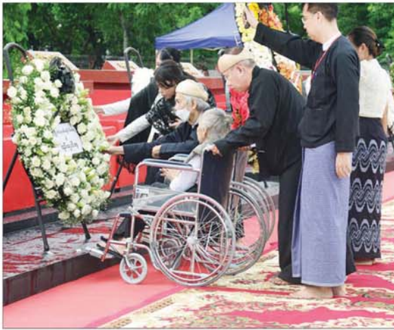
မိုင်းပွန်းစော်ဘွားကြီး စစ်ထွန်း၏ မိသားစုဝင်များက လွမ်းသ့ပန်းခွေချ ဂါရဝပြု စဉ်။

ထို့နောက် မြန်မာနိုင်ငံအမျိုး သမီးရေးရာအဖွဲ့ချုပ်၊ မြန်မာနိုင်ငံ ဂီတအစည်းအရုံး (ဗဟို)၊ မြန်မာ နိုင်ငံ ကြက်ခြေနီအသင်း၊ မြန်မာနိုင်ငံ သတင်းမီဒီယာ ကောင်စီ၊ မြန်မာနိုင်ငံ ဗိသုကာ ကောင်စီ၊ ပြည်ထောင်စုမြန်မာ နိုင်ငံတော် ဘာသာပေါင်းစုံ ချစ်ကြည် ညီညွတ်ရေးအသင်း၊ မြန်မာနိုင်ငံ ကက်သလစ်ဆရာ တော်ကြီးများ အဖွဲ့ချုပ်၊ ခရစ်ယာန် ကလျာဏယုအသင်း (YMCA)၊ ရှင်သန်ရေးကူညီမှု အသင်း၊ မြန်မာနိုင်ငံဆရာဝန်များ