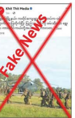
နိုင်ငံပြင်ကြောင်း အသိပေးကြေညာထားသည်။ သတင်းစဉ်

လုံခြုံရေးတပ်ဖွဲ့ဝင်များကို လက်နက်ကြီး၊ လက်နက်ငယ်များဖြင့် လာရောက်ပစ်ခတ်တိုက်ခိုက်ခဲ့ရာ အပြန်အလှန် ပစ်ခတ်မှုများဖြစ်ပွားခဲ့ပြီး အကြမ်းဖက်သမားများ အရှေ့မြောက်ဘက်သို့ ဆုတ်ခွာထွက်ပြေးသွားခဲ့ပါသည်။ ထို့ကြောင့် ပြည်သူများအနေဖြင့် အကြမ်းဖက်မှုဖြစ်စဉ်များ လျော့နည်းပပျောက်ရေးအတွက် အကြမ်းဖက်သမားများ၏ သတင်းများရရှိပါက နှိုးစပ်ရာလုံခြုံရေး တပ်စခန်းများနှင့် လုံခြုံရေးတပ်ဖွဲ့ဝင်များထံ လျှို့ဝှက်စွာ သတင်းပေးတိုင်ကြား