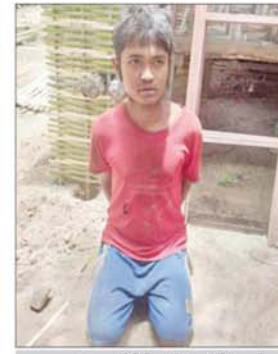
တရားခံ သက်ခိုင်ထွန်း(ခ)ကိုသက်