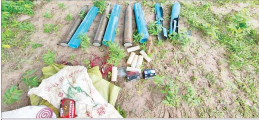
အကြမ်းဖက်သမားများက ပစ်ခတ်ရန်ပြင်ဆင်ထားသည့် ခုံးပစ်စင် သုံးခုအား သက်မဲ့ပြုလုပ်ပြီးစီးမှု။