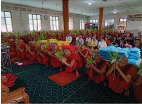
မန္တလေး၊ ဇူလိုင် ၂၁ မန္တလေး၊ အောင်မြေသာစံ မြို့နယ်၊ မဟာအေယုဘုံရပ်ကွက် ၆၂လမ်း၊ ၂၄လမ်းနှင့် ၂၅လမ်းကြား၊ စလင်းပိဘဠုဝါဒီစာသင်တိုက် စာချ၊ စာသင်သံဃာတော်အပါ(၁၇၅)ပါးတို့အား ဝါဘဠုဝါဒီပထမကျွန်းဆောင်သည့် ဒါယကာ၊ ဒါယိကာမအပေါင်းတို့က စကောဒသမ

အကြိမ်အဖြစ် ဝါဆိုသင်တန်း ဆက်က်လှူဒါန်းပွဲကို ယနေ့ ညနေ ၃ နာရီခွဲ က အဆို ပါကျောင်းတိုက်တွင် ကျင်းပသည်။ ရှေးဦးစွာ အခမ်းအနားကို “နမောတဿ သုံးကြိမ်” ဘုရားကန်တော်၌ ဖွင့်လှစ်ပြီး နာယက ဆရာတော် ဘဒ္ဒန္တနန္ဒာသာရ ထံမှ ဧည့်ပရိသတ်အပေါင်းက ငါးပါးသီလခံယူဆောင်တည်ကြပြီး ဆရာတော် သံဃာတော်များ ရွတ်ပွားချီးမြှင့်သောပရိတ်တရားတော်များ နာယုကြည်ညိုကြပြီး လှူဒါန်းမှုအစုအဝေး ဆရာတော်က ရေစက်ချတရားဟောကြားချိမ့်၍ ဆရာတော် အမှုပြုသော ရဟန်း(၄၄)ပါး၊ သာမဏေ(၁၃၅)ပါးတို့က ဝါဆိုဝါကပ်တော်မူကြပြီး အခမ်းအနားကို “စီရံတိဋ္ဌတူ” သုံးကြိမ်ရွတ်ဆိုဆုတောင်း၍ ရုပ်သိမ်းပြီး အလှူရှင်များက ဆရာတော် သံဃာတော်များအား ဝါဆိုသင်တန်းနှင့် လှူဒါန်းကြပြီး ဧည့်သည်တော်များအား မှန်ဟင်းခါးနှင့် အချိုပြုများဖြင့် ဧည့်ခံကျွေးမွေး၍ ကုသိုလ်ကောင်းမှုပြုလုပ်ကြကြောင်း သိရသည်။ (အပေါ်ပုံ) (မန္တလေးနေ့စဉ်-၃) ၀-၀-၀-၀-၀