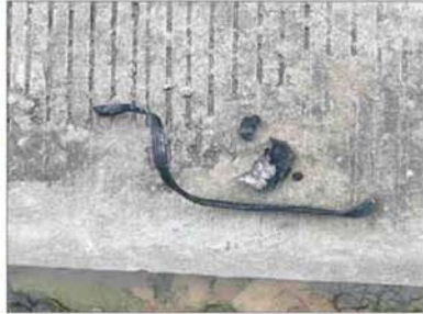
အကြမ်းဖက်သမားများ ပစ်ခတ်လိုက်သည့် ရှေ့တိုက်ခုံး အပိုင်းအစများ