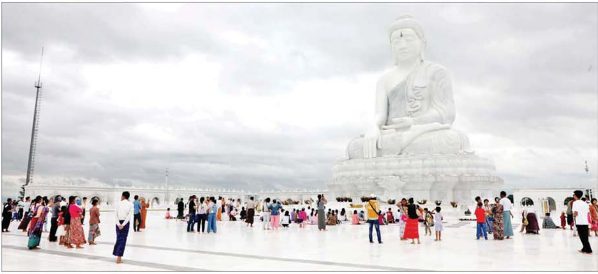
မာရဝိဇယဗုဒ္ဓရုပ်ပွားတော်မြတ်ကြီး၌ ဝါဆိုလပြည့်ကျော် ၁ ရက်တွင် ဘုရားဖူးလာပြည်သူများဖြင့် စည်ကားလျက်ရှိသည်ကို တွေ့ရစဉ်။

နေပြည်တော် ဇူလိုင် ၂၀ ဝါဆိုလပြည့်နေ့တွင် ဗုဒ္ဓဘာသာဝင်များအနေဖြင့် မြတ်စွာဘုရားရှင်အား ရည်မှန်း၍ ဥပုသ်သီလဆောက်တည်ခြင်း၊ ပဋ္ဌာန်းဒေသနာတော်နှင့် ပရိတ်တရားတော်များ ရွတ်ပွားပူဇော်ခြင်း၊ ဘုန်းတော်ကြီးကျောင်းများ၌ ဝါဆိုသင်္ကန်းကပ်လှူခြင်း၊ ကုသိုလ်ဒါနသီလပွားများခြင်း စသည့် သူတော်ကောင်းတရားများကို ကြိုးစားအားထုတ် ဆောင်ရွက်ကြရာ ပြည်ထောင်စုနယ်မြေ နေပြည်တော်ရှိ မာရဝိဇယဗုဒ္ဓရုပ်ပွားတော်မြတ်ကြီး၊ ဥပ္ပုတသန္တီစေတီတော်မြတ်ကြီး၊ ရန်ကုန်မြို့ရှိ ရွှေတိဂုံစေတီတော်မြတ်ကြီးနှင့် မန္တလေးမြို့ရှိ ဗဟာမြတ်မုနိဘုရားကြီးအပါအဝင် တိုင်းဒေသကြီးနှင့် ပြည်နယ်အသီးသီးရှိ ဘုရား၊ စေတီပုထိုးများ၌ သံဃာတော်များ၊ သာသနာ့ဇွယ်ဝင်သီလရှင်များ၊ မိဘပြည်သူများ စိတ်အေးချမ်းသာစွာဖြင့် လာရောက် ဖူးမြော်ကြည်ညို