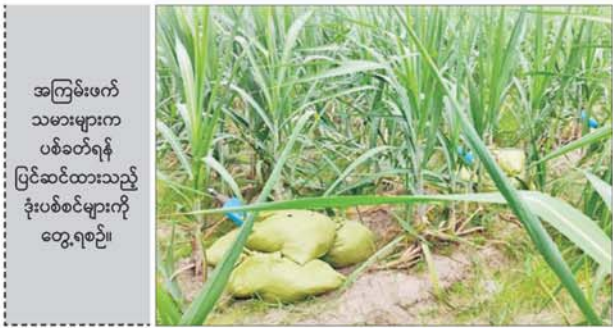
အကြမ်းဖက်သမားများက ပစ်ခတ်ရန် ပြင်ဆင်ထားသည့် ခုံးပစ်စင်များကို တွေ့ရစဉ်။