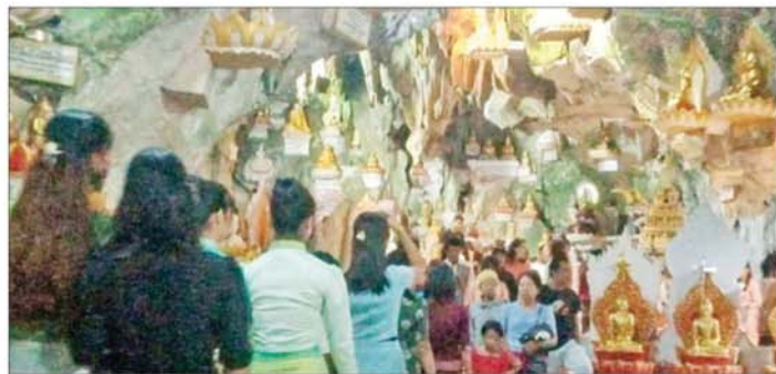
ဝါဆိုလပြည့်ကျော် ၁ ရက်တွင် ဘုရားဖူးလာပြည်သူများဖြင့် စည်ကားလျက်ရှိသည်ကို တွေ့ရစဉ်။