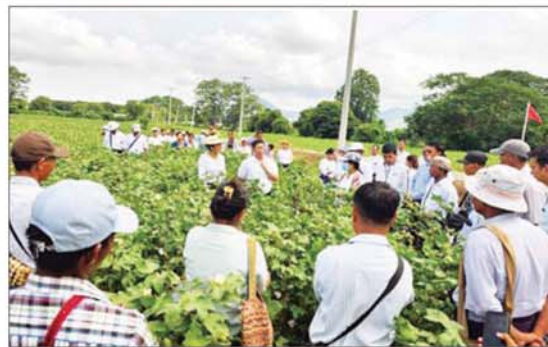
စမ်းသပ်ကွက်များ၊ ဒေသဝါမျိုးနှင့် မျိုးကူးစစ်ထားရှိမှုများကို ကွင်းဆင်း ဥပဇာတိကစွာတန် ဝါမျိုးသစ်များကို လေ့လာခဲ့ကြောင်း သိရသည်။ သက်ထက်

မန္တလေး၊ ဇူလိုင် ၂၁ မန္တလေးတိုင်းဒေသကြီး ကျောက်ဆည်ခရိုင်အတွင်းရှိ ကျောက်ဆည် မြစ်သား၊ စဉ့်ကိုင်မြို့နယ်တို့တွင် စိုက်ပျိုးထားသော ဝါသီးနှံစိုက်ခင်းများ ပန်းတိုင်အထွက်နှုန်းရရှိရေး တောင်သူပညာပေး ကွင်းသရုပ်ပြပွဲကို ယနေ့နေ့က ကျောက်ဆည်မြို့နယ် ဝါသီးနှံသုတေသနနှင့် နည်းပညာဖွံ့ဖြိုးရေးခြံ (လွန်ကျော်)၌ ကျင်းပခဲ့ရာ ကျောက်ဆည် မြစ်သား၊ စဉ့်ကိုင်မြို့နယ် မြဲစိုက်ကွင်းများမှဝန်ထမ်းများနှင့်တောင်သူများ လာရောက်လေ့လာခဲ့ကြသည်။ သရုပ်ပြပွဲတွင် မန္တလေးတိုင်းဒေသကြီး ဦးစီးမှူး ဦးဝင်းထိန်က ပန်းတိုင်အထွက်နှုန်း ဝါတစ်ဧက ဝိသာ ၇၀၀ ရရှိရန် မျိုးကောင်း မျိုးသန့်ရွေးချယ်စိုက်ပျိုးသွားရေး ဝါသီးနှံသုတေသနနှင့် နည်းပညာဖွံ့ဖြိုးရေးခြံ (လွန်ကျော်)မှ ဒေသနှင့် ကိုက်ညီသည့် ဝါမျိုးများကို အပြည့်အဝဖြန့်ဖြူးပေးလျက်ရှိကြောင်း၊ ဝါမစိုက်မီ ပိုက်ဆံလျှော်ကဲ့သို့ သစ်စိမ်းမြေဩဇာကို စိုက်ပျိုး၍ သဘာဝမြေဩဇာရရှိရေး ဆောင်ရွက်သွားရန် လိုအပ်ကြောင်း ပြောကြားပြီး လွန်ကျော်ခြံတာဝန်ခံ ဒေါက်တာ အေးအေးမြတ်က ဝါသီးနှံပန်းတိုင်အထွက်နှုန်း ရရှိရေးအတွက် လိုက်နာရမည့်အချက်များကို ရှင်းလင်းပြောကြားသည်။ ထို့နောက် လေ့လာရေးအဖွဲ့သည် ဝါပိသာ ၇၀၀ ပန်းတိုင်အထွက်နှုန်း ရရှိရေး တန်းကြား/ပင်ကြား (၂.၅ပေ x ၁ပေ) ဖြင့် တစ်ဧက အပင်ရေ ၃၄၈၃၀ ဝင်ဆန်အောင် စိုက်ပျိုးထားသည့် စံပြစိုက်ခင်းနှင့် ၂၀၂၄-၂၀၂၅ ခုနှစ် မိုးကြိုဝါမျိုးစေ့ထုတ်စိုက်ခင်းများ၊ စိုက်နည်းစနစ်နှင့် အိန္ဒိယ ဝါမျိုးသစ်များ မျိုးယူညီညွတ်စေရန်