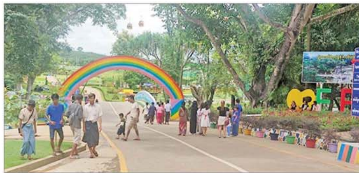
ပန်းခြံများတွင် အပန်းဖြေသူများဖြင့် စည်ကားလျက်ရှိသည်ကို တွေ့ရစဉ်။

ကုသိုလ်ယူကြသူများနှင့်စည်ကား လျက်ရှိသည်။ ထို့ပြင် ယနေ့ ဝါဆိုလပြည့်ကျော် ၁ ရက်တွင် အသီးသီးတို့ရှိ ဘုရား၊ စေတီပုထိုးများ၌ ဘုရားဖူးလာ သံဃာတော်များ၊ သာသနာ့ဇွယ်ဝင်သီလရှင်များ၊ မိဘပြည်သူများဖြင့် အထူး စည်ကားများပြားလျက်ရှိသည်။ စာမျက်နှာ ၃ သို့ ၀