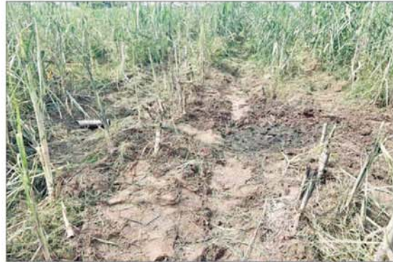
ရှေ့တိုက်ခုံး ကျရောက်ပေါက်ကွဲသည့်နေရာ