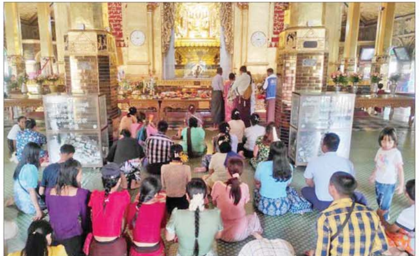
ဝါဆိုလပြည့်ကျော် ၁ ရက်နေ့တွင် ဘုရားဖူးလာပြည်သူများဖြင့် စည်ကားလျက်ရှိသည်ကို တွေ့ရစဉ်။