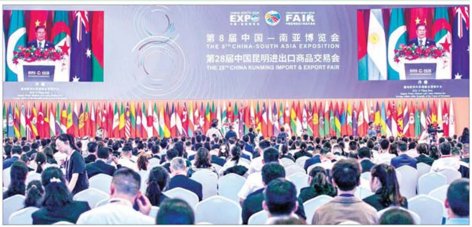
ဒုတိယဝန်ကြီးချုပ်နှင့် ပြည်ထောင်စုဝန်ကြီး ဦးသန်းဆွေ တရုတ်-တောင်အာရှကုန်စည်ပြပွဲ ဖွင့်ပွဲအခမ်းအနားတွင် မိန့်ခွန်းပြောကြားစဉ်။

နေပြည်တော် ဇူလိုင် ၂၄ (၈)ကြိမ်မြောက် တရုတ်-တောင်အာရှ ကုန်စည်ပြပွဲနှင့် (၂၈)ကြိမ်မြောက် တရုတ်(ကုမင်း) ဝိုက်ကုန်/သွင်းကုန်ပြပွဲ ဖွင့်ပွဲအခမ်းအနားကို ယမန်နေ့ ဒေသစံတော်ချိန် နံနက် ၉ နာရီခွဲတွင် တရုတ်ပြည်သူ့သမ္မတနိုင်ငံ ယူနန်ပြည်နယ် ကုမင်းမြို့၌ ကျင်းပရာ ဒုတိယဝန်ကြီးချုပ်နှင့် နိုင်ငံခြားရေးဝန်ကြီးဌာန ပြည်ထောင်စုဝန်ကြီး ဦးသန်းဆွေ၊ တရုတ်ပြည်သူ့သမ္မတနိုင်ငံ ပြည်သူ့ကွန်ဂရက် အမြဲတမ်းကော်မတီ ဒုတိယဥက္ကဋ္ဌ မစ္စတာ တင်ကျော်လီ၊ သီရိလင်္ကာနိုင်ငံ လွှတ်တော်ဥက္ကဋ္ဌ လာအိုနိုင်ငံ ဒုတိယဝန်ကြီးချုပ်၊ မော်လဒိုက်နိုင်ငံ ဒုတိယလွှတ်တော်ဥက္ကဋ္ဌနှင့် နီပေါနိုင်ငံ ဒုတိယလွှတ်တော်ဥက္ကဋ္ဌတို့ တက်ရောက်