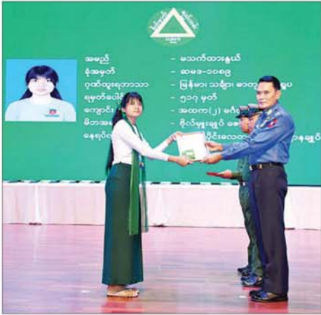
ကာကွယ်ရေးဦးစီးချုပ်(ရေ) ဗိုလ်ချုပ်ထိန်ဝင်း ထူးချွန်ဂုဏ်ထူး ရရှိသူ မသက်ထားနွယ်အား ဂုဏ်ပြုတံဆိပ်၊ ဂုဏ်ပြုဆုနှင့် ဂုဏ်ပြု မှတ်တမ်းလွှာ ပေးအပ်ချီးမြှင့်စဉ်။