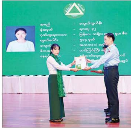
ကာကွယ်ရေးဦးစီးချုပ်(လေ) ဗိုလ်ချုပ်ကြီး ထွန်းအောင် ထူးချွန် ဂုဏ်ထူးရရှိသူ မသွယ်သွယ်မိုးအား ဂုဏ်ပြုတံဆိပ်၊ ဂုဏ်ပြုဆုနှင့် ဂုဏ်ပြုမှတ်တမ်းလွှာ ပေးအပ်ချီးမြှင့်စဉ်။

သို့ တပ်မတော်အခြေခံပညာ အထက်တန်းကျောင်းများအနက် အမှတ်(၆)အခြေခံပညာ အထက် တန်းကျောင်း (စစ်တွေ)နှင့် အမှတ် (၂)အခြေခံပညာ အထက်တန်း ကျောင်း(မင်္ဂလာဒုံ)တို့သည်လည်း အောင်မြင်မှုပျမ်းမျှ ၉၅ ရာခိုင်နှုန်း ဖြစ်ခဲ့သည်ကို တွေ့ရှိရကြောင်း။ ထိုကဲ့သို့ အောင်မြင်မှုများနှင့် ဂုဏ်ထူးရသူ များစွာကို ဓွေးထုတ်ပေးနိုင်ခဲ့သည်