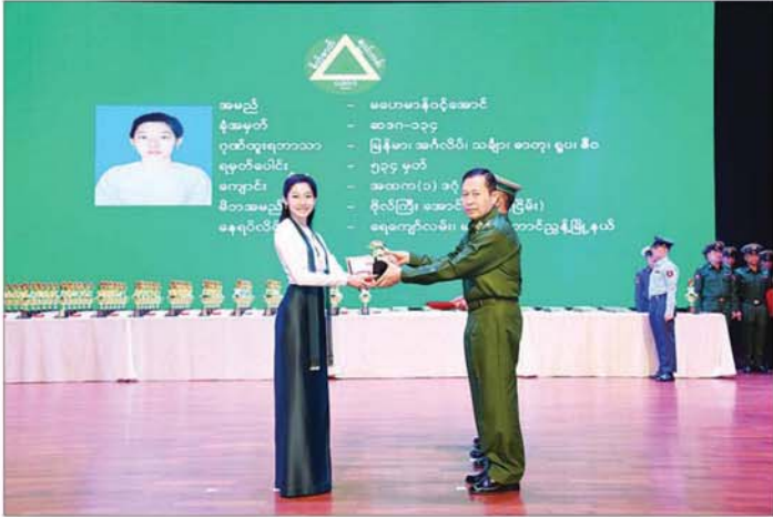
နိုင်ငံတော်စီမံအုပ်ချုပ်ရေးကောင်စီဒုတိယဥက္ကဋ္ဌ ဒုတိယတပ်မတော်ကာကွယ်ရေးဦးစီးချုပ် ကာကွယ် ရေးဦးစီးချုပ်ကြည်(ဒုတိယဗိုလ်ချုပ်မှူးကြီး စိုးဝင်း၊ ခြောက်ဘာသာဂုဏ်ထူးဖြင့် ထူးချွန်စွာအောင်မြင်ခဲ့သူ မဟောမာန်ဝင့်အောင်အား ဂုဏ်ပြုတံဆိပ်၊ ဂုဏ်ပြုဆုနှင့် ဂုဏ်ပြုမှတ်တမ်းလွှာ ပေးအပ်ချီးမြှင့်စဉ်။

နိုင်ငံတော် စီမံအုပ်ချုပ်ရေး ကောင်စီဥက္ကဋ္ဌ တပ်မတော် ကာကွယ်ရေးဦးစီးချုပ် ဗိုလ်ချုပ် များကြီး မင်းအောင်လှိုင်နှင့်ဇနီး ဒေါ်ကြူကြူလှ ဆုရစစ်သည် များ၊ ကျောင်းသား ကျောင်းသူ များနှင့် မိဘများအား ရင်းရင်း နီးနီး လိုက်လံနှုတ်ဆက်ကြစဉ်။