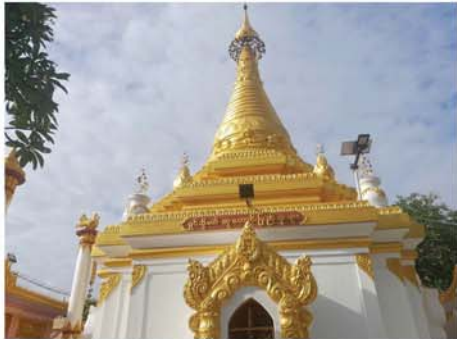
ဆောင်ရွက်ပြီးစီး၍ ရေစက်ချ မင်္ဂလာအခမ်းအနားကို ဇူလိုင် ၂၄

မန္တလေး ဇူလိုင် ၂၄ မန္တလေး၊ ချမ်းအေးသာစံမြို့ နယ်၊ ချမ်းအေးသာစံအလယ် ရပ်ကွက်၊ ၂၉လမ်းနှင့်လမ်း၃၀ ကြား စတုရန်းနှင့်စတုရန်းကြား ရှိ ရှင်ဘို့မယ်မိဖုရားကြီးတည် ထား ကိုးကွယ်ခဲ့သော ရှင်ဘို့မယ် ဆုတောင်းပြည့်ဘုရား ထီးတော် ရွှေအစစ်ချခြင်း၊ တံခွန်တိုင်အသစ် ပြုလုပ်ခြင်း၊ အာရုံခံတန်ဆောင်း ဆောက်လုပ်ခြင်း၊ မုခ်ဦးနှင့် သံ တံခါးတိုးချဲ့ပြင်ဆင်ခြင်း၊ အုတ် တံတိုင်းအသစ်ပြုလုပ်ခြင်းများ