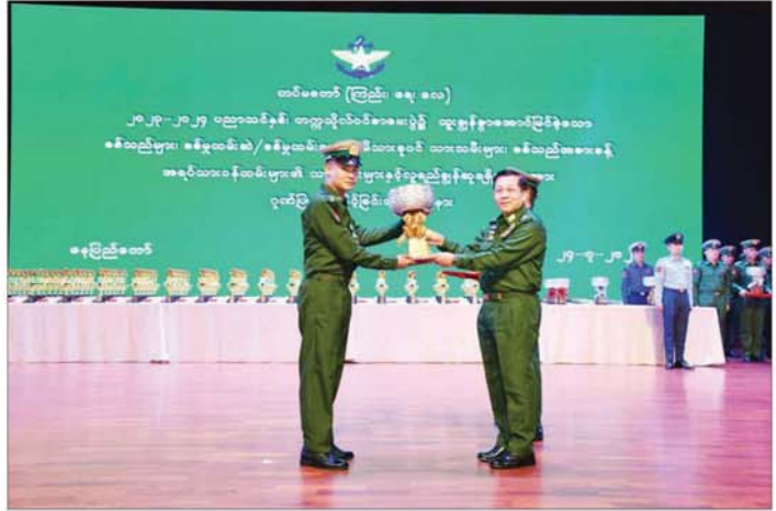
နိုင်ငံတော်စီမံအုပ်ချုပ်ရေးကောင်စီဥက္ကဋ္ဌ တပ်မတော်ကာကွယ်ရေးဦးစီးချုပ် ဗိုလ်ချုပ်မှူးကြီးမင်းအောင်လှိုင် ပြည်သူ့ဆက်ဆံရေးနှင့်စိတ်ဓာတ်စစ်ဆင်ရေးညွှန်ကြားရေးမှူးရုံးကွပ်ကဲမှုအောက် တပ်မတော် အခြေခံပညာအထက်တန်းကျောင်းများမှ ၂၀၂၃-၂၀၂၄ ပညာသင်နှစ် တက္ကသိုလ်ဝင်စာမေးပွဲများတွင် အောင်ချက်အကောင်းဆုံး ပထမဆုရရှိသည့် အခြေခံပညာအထက်တန်းကျောင်းမှ ကျောင်းအုပ်ချုပ်မှုတာဝန်ခံအရာရှိတစ်ဦးအား ဂုဏ်ပြုဆုနှင့် ဂုဏ်ပြုမှတ်တမ်းလွှာများ ပေးအပ်ချီးမြှင့်စဉ်။

နိုင်ငံရေး၊ စီးပွားရေး၊ လူမှုရေး စသည့် နယ်ပယ်အသီးသီး၌ အားနည်းချက်များ ဖြစ်ပေါ်စေမည်ဖြစ်ပြီး တိုင်းပြည်စည်းလုံးညီညွတ်ရေး အပေါ်ကိုလည်း