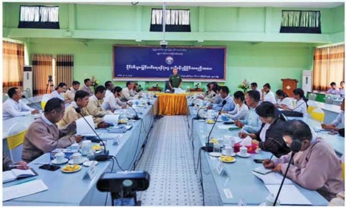
မန္တလေး၊ ဇူလိုင် ၂၄

မန္တလေးတိုင်းဒေသကြီးအတွင်း စိုက်ပျိုးရေးကဏ္ဍတွင် နိုင်ငံစီးပွားမြှင့်တင်ရေး ရန်ပုံငွေဖြင့် ဆောင်ရွက်မည့် စီမံကိန်းနှင့် စပ်လျဉ်း၍ လုပ်ငန်းညှိနှိုင်းအစည်းအဝေးကို ဇူလိုင် ၂၃ ရက် မွန်းလွဲပိုင်းက စိုက်ပျိုးရေးဦးစီးဌာန၊ မန္တလေးတိုင်းဒေသကြီး ဦးစီးမှူးရုံး အစည်းအဝေးခန်းမတွင် ကျင်းပခဲ့