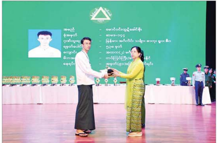
နိုင်ငံတော်စီမံအုပ်ချုပ်ရေးကောင်စီဥက္ကဋ္ဌ တပ်မတော်ကာကွယ်ရေးဦးစီးချုပ် ဗိုလ်ချုပ်မှူးကြီးမင်းအောင်လှိုင်၏စနီး ဒေါ်ကြူကြူလှ ခြောက်ဘာသာဂုဏ်ထူးဖြင့် ထူးချွန်စွာအောင်မြင်ခဲ့သူ မောင်ဝင်းထွဋ်ခေါင်စိုးအား ဂုဏ်ပြုတံဆိပ်၊ ဂုဏ်ပြုဆုနှင့် ဂုဏ်ပြုမှတ်တမ်းလွှာ ပေးအပ်ချီးမြှင့်စဉ်။

မည်ဖြစ်ကြောင်း၊ အတတ်ပညာ၊ အသိပညာနှင့် အတွေးအခေါ်ထက်မြက် မြင့်မားသည့် လူ့စွမ်းအား အရင်းအမြစ်များ ပေါ်ကြွယ်မမှသာ နိုင်ငံတစ်ခု ဖွံ့ဖြိုးတိုးတက်လာမည် ဖြစ်ကြောင်း။