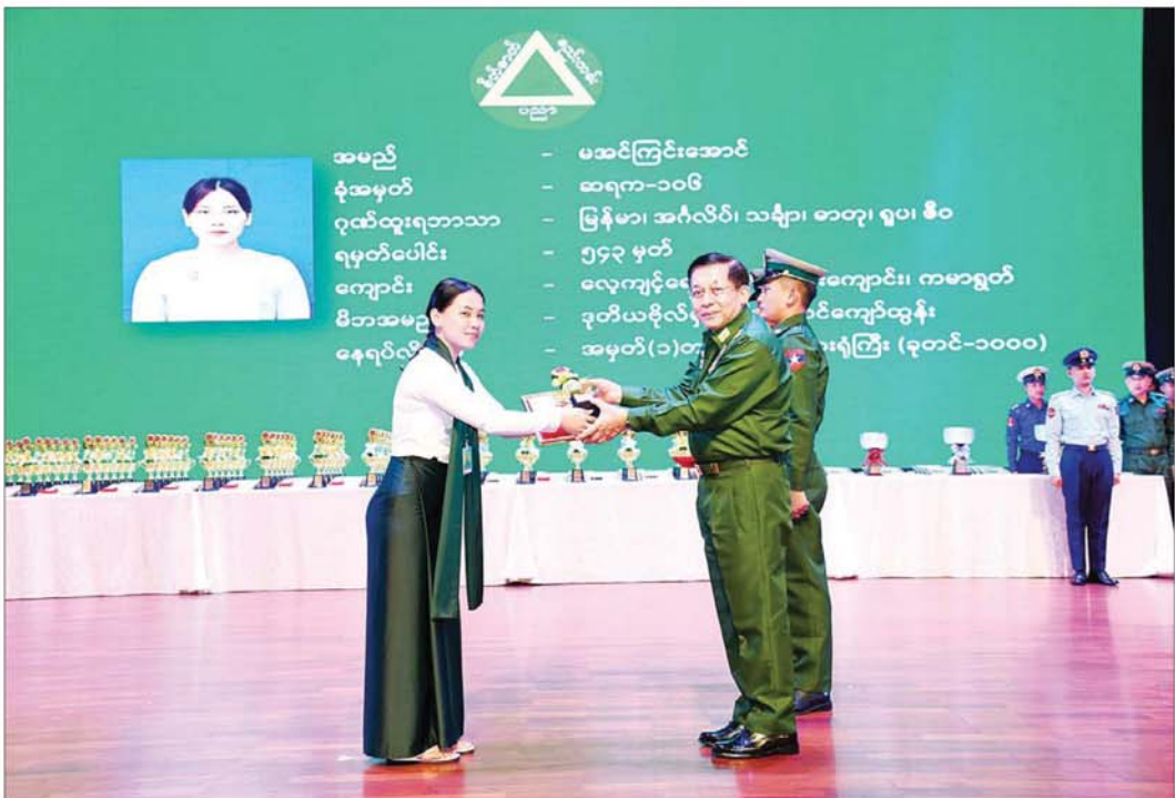
နိုင်ငံတော်စီမံအုပ်ချုပ်ရေးကောင်စီဥက္ကဋ္ဌ တပ်မတော်ကာကွယ်ရေးဦးစီးချုပ် ဗိုလ်ချုပ်မှူးကြီးမင်းအောင်လှိုင် ခြောက်ဘာသာဂုဏ်ထူးဖြင့် ထူးချွန်စွာအောင်မြင်ခဲ့သူ မအင်ကြင်းအောင်အား ဂုဏ်ပြုတံဆိပ်၊ ဂုဏ်ပြုဆုနှင့် ဂုဏ်ပြုမှတ်တမ်းလွှာများ ပေးအပ်ချီးမြှင့်စဉ်။

နေပြည်တော် ဇူလိုင် ၂၄ ၂၀၂၃-၂၀၂၄ ပညာသင်နှစ် တက္ကသိုလ်ဝင်စာမေးပွဲ၌ ထူးချွန်စွာအောင်မြင်ခဲ့သည့် တပ်မတော် (ကြည်း၊ ရေ၊ လေ)မှ စစ်သည်များ၊ စစ်မှုထမ်းဆုံး၊ စစ်မှုထမ်းဟောင်း၊ မိသားစုဝင်သားသမီးများ၊ စစ်သည်အစားခန့်အရပ်သားဝန်ထမ်းများ၏ သားသမီးများနှင့် လူရည်ချွန်ဆုရရှိသော ကျောင်းသား ကျောင်းသူများအား ဂုဏ်ပြုဆုချီးမြှင့်ခြင်း အခမ်းအနားကို ယနေ့မွန်းလွဲပိုင်းတွင် နေပြည်တော်ရှိ ဓေယျာသီရိဗိမာန်၌ ကျင်းပပြုလုပ်ရာ နိုင်ငံတော်စီမံအုပ်ချုပ်ရေးကောင်စီဥက္ကဋ္ဌ တပ်မတော်ကာကွယ်ရေးဦးစီးချုပ် ဗိုလ်ချုပ်မှူးကြီးမင်းအောင်လှိုင် တက်ရောက်ဂုဏ်ပြုအမှာစကား ပြောကြားပြီး ဂုဏ်ပြုဆုများ ပေးအပ်ချီးမြှင့်သည်။