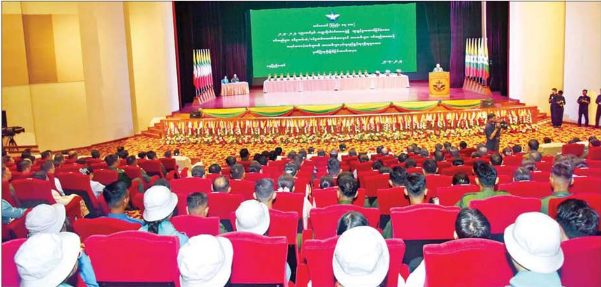
နိုင်ငံတော်စီမံအုပ်ချုပ်ရေးကောင်စီဥက္ကဋ္ဌ တပ်မတော်ကာကွယ်ရေးဦးစီးချုပ် ဗိုလ်ချုပ်မှူးကြီးမင်းအောင်လှိုင် ၂၀၂၃-၂၀၂၄ ပညာသင်နှစ် တက္ကသိုလ်ဝင်စာမေးပွဲ၌ ထူးချွန်စွာ အောင်မြင်ခဲ့သည့် တပ်မတော်(ကြည်း)၊ ရေ (လေ)မှ စစ်သည်များ၊ စစ်မှုထမ်းဆဲ၊ စစ်မှုထမ်းဟောင်း၊ မိသားစုဝင်သားသမီးများ၊ စစ်သည်အစားခန့်အရပ်သားဝန်ထမ်းများ၏ သားသမီးများနှင့် လူရည်ချွန်ဆုရရှိသော ကျောင်းသား ကျောင်းသူများအား ဂုဏ်ပြုဆုချီးမြှင့်ခြင်း အခမ်းအနားတွင် ဂုဏ်ပြုအမှာစကား ပြောကြားစဉ်။

ဂုဏ်ပြုအမှာစကား ပြောကြားဦးစွာ နိုင်ငံတော်စီမံအုပ်ချုပ်ရေးကောင်စီဥက္ကဋ္ဌ တပ်မတော်ကာကွယ်ရေးဦးစီးချုပ်က ဂုဏ်ပြုအမှာစကား ပြောကြားရာတွင် ပညာရေးသည် တိုင်းပြည်ဖွံ့ဖြိုးတိုးတက်ခြင်း၏ အဓိကအခြေခံအုတ်မြစ်ဖြစ်သည့်အပြင် နိုင်ငံသားကောင်း တစ်ယောက်တွင် ရှိသင့်သည့် ကျင့်ဝတ်၊ စည်းကမ်းလိုက်နာမှု၊ စုပေါင်းဆောင်ရွက်