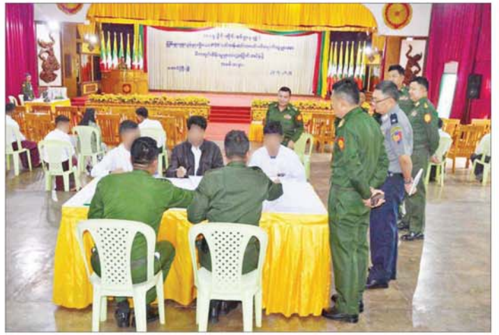
တိုင်းဒေသကြီးနှင့် ပြည်နယ်အသီးသီး၌ ဥပဒေ ဘောင်အတွင်း ပြန်လည်ဝင်ရောက်လျက်ရှိကြသဖြင့် သက်ဆိုင်ရာတာဝန်ရှိသူများက ၎င်းတို့၏ မိဘ အုပ်ထိန်းသူများထံသို့ လွှဲပြောင်းအပ်နှံပေးလျက်ရှိ ကြောင်း သိရသည်။ သတင်းစဉ်

ကယားပြည်နယ် လွိုင်ကော်မြို့နယ်နှင့် ဒီးမော့ဆို မြို့နယ်တို့မှ PDF အဖွဲ့ဝင် အမျိုးသား လေးဦးနှင့် အမျိုးသမီးတစ်ဦးတို့အား တာဝန်ရှိသူများက ဝန်ခံကတိလက်မှတ် ရေးထိုးစေကာ ၎င်းတို့၏ မိဘ အုပ်ထိန်းသူများထံသို့ လွှဲပြောင်းအပ်နှံပြီး စားသောက်ဖွယ်ရာများ ပေးအပ်သည်။ PDF အပါအဝင် အဖွဲ့အစည်းအမျိုးမျိုးတို့ အနေဖြင့် နိုင်ငံတော်၏ ရှေ့လုပ်ငန်းစဉ်များတွင် ပါဝင် ပူးပေါင်းဆောင်ရွက်နိုင်ရေး သတ်မှတ်စည်းကမ်းချက် များနှင့်အညီ ဥပဒေဘောင်အတွင်းသို့ လက်နက် အပ်နှံပြီး ပြည်သူ့ဘဝသို့ ပြန်လည်ဝင်ရောက်ခြင်း ပြုမည်ဆိုပါက ကြိုဆိုလက်ခံသွားမည်ဖြစ်ကြောင်း နိုင်ငံတော်အစိုးရက ထုတ်ပြန်ထားပြီးဖြစ်ရာ ပြစ်မှုကျူးလွန်ခဲ့ခြင်းမရှိသော PDF အဖွဲ့ဝင်များက