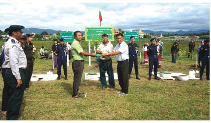
မိုးရာသီ လူထုစုပေါင်းသစ်ပင်စိုက်ပျိုးပွဲတော် ကျင်းပ

ဟင်းသီးဟင်းရွက်စိုက်ဧက ၄၇၈၁ ဧကပြီးနေပါပြီဟု ၎င်းက ရှင်းပြသည်။ အဆိုပါ မြို့နယ်တွင် ယခုနှစ် မိုးရာသီ၌ စားဖိုဆောင်သီးနှံအဖြစ် စိုက်ပျိုးရာ မရှိမဖြစ်အသုံးဝင်သည့် သီးနှံများဖြစ်သော နံနံပင်၊ ခရမ်းချဉ်သီး၊ ခရမ်းသီး၊ ချဉ်ပေါင်၊ ဘူးသီး၊ ရုံးပတီသီး၊ ဂေါ်ဖီ၊ မုန့်လှ၊ တိုင်ထောင်ပဲတောင့်ရှည်၊ သင်္ဘောသီး၊ ကန်စွန်း၊ သခွား၊ ကြက်ဟင်းခါးသီး စသည်ဖြင့် အစိုစိုက်ပျိုးကြောင်း၊ ယင်းသီးနှံများ အောင်မြင်ဖြစ်ထွန်းစေရန်၊ ပိုးမွှားအန္တရာယ်ကင်းရှင်းစေရန်နှင့် လေလွင့်ဆုံးရှုံးမှုမရှိစေရေး၊ စားသုံးသူများဘေးအန္တရာယ်ကင်းရှင်းစွာ ဝယ်ယူစားသုံးနိုင်စေရေးအတွက် ဌာနမှလည်း ကွင်းဆင်းပြီး တောင်သူများကို အသိပညာပေးဆွေးနွေးခြင်းများ ပြုလုပ်ပေးကြောင်း သိရသည်။ (၀၃၄)