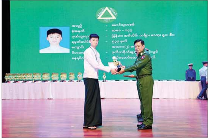
နိုင်ငံတော်စီမံအုပ်ချုပ်ရေးကောင်စီအဖွဲ့ဝင် ညှိနှိုင်းကွပ်ကဲရေးမှူး (ကြည်၊ ရေ) ဗိုလ်ချုပ်ကြီး မောင်မောင်အေး ခြောက်ဘာသာဂုဏ်ထူးဖြင့် ထူးချွန်စွာအောင်မြင်ခဲ့သူ မောင်သုတစစ်အား ဂုဏ်ပြု တံဆိပ်၊ ဂုဏ်ပြုဆုနှင့် ဂုဏ်ပြုမှတ်တမ်းလွှာ ပေးအပ်ချီးမြှင့်စဉ်။