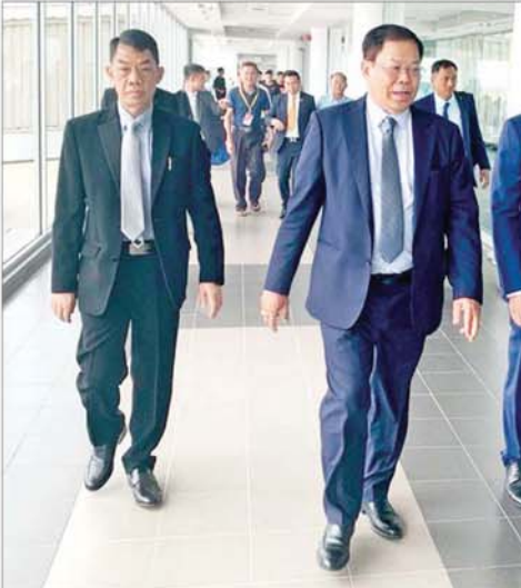
ဒုတိယဝန်ကြီးချုပ်နှင့် ပြည်ထောင်စုဝန်ကြီး ဦးသန်းဆွေနှင့်အဖွဲ့အား တာဝန်ရှိသူများက မန္တလေးအပြည်ပြည်ဆိုင်ရာလေဆိပ်၌ ကြိုဆိုနှုတ်ဆက်ကြစဉ်။