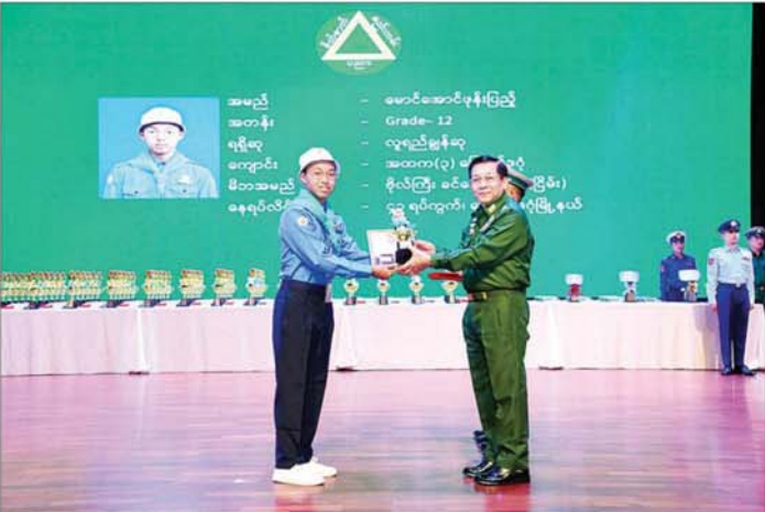
နိုင်ငံတော်စီမံအုပ်ချုပ်ရေးကောင်စီဥက္ကဋ္ဌ တပ်မတော်ကာကွယ်ရေးဦးစီးချုပ် ဗိုလ်ချုပ်မှူးကြီးမင်းအောင်လှိုင် လူရည်ချွန်ဆုရရှိသူ မောင်အောင်ဖုန်းပြည့်အား ဂုဏ်ပြုတံဆိပ်၊ ဂုဏ်ပြုဆုနှင့် ဂုဏ်ပြုမှတ်တမ်းလွှာ ပေးအပ်ချီးမြှင့်စဉ်။