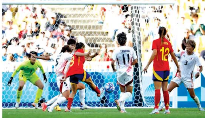
စပိန်အသင်းနှင့် ဂျပန်အသင်း ယှဉ်ပြိုင်ကစားစဉ်။