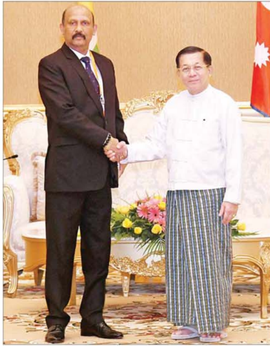
နိုင်ငံတော်စီမံအုပ်ချုပ်ရေးကောင်စီ ဥက္ကဋ္ဌ နိုင်ငံတော်ဝန်ကြီးချုပ် ဗိုလ်ချုပ်မှူးကြီး မင်းအောင်လှိုင် သိရိလင်္ကာနိုင်ငံမှ General Kamal Gunaratne(Retd) WWV RWP RSP USP Ndc psc MPhil အား ရင်းရင်းနှီးနှီး နှုတ်ဆက်စဉ်။