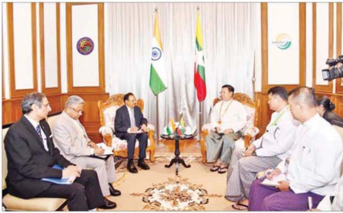
ပြည်ထောင်စုဝန်ကြီး ဗိုလ်ချုပ်ကြီး မိုးအောင် အိန္ဒိယနိုင်ငံမှ အမျိုးသားလုံခြုံရေးဆိုင်ရာအကြီးအကဲ H.E. Shri Ajit Doval အား လက်ခံတွေ့ဆုံစဉ်။