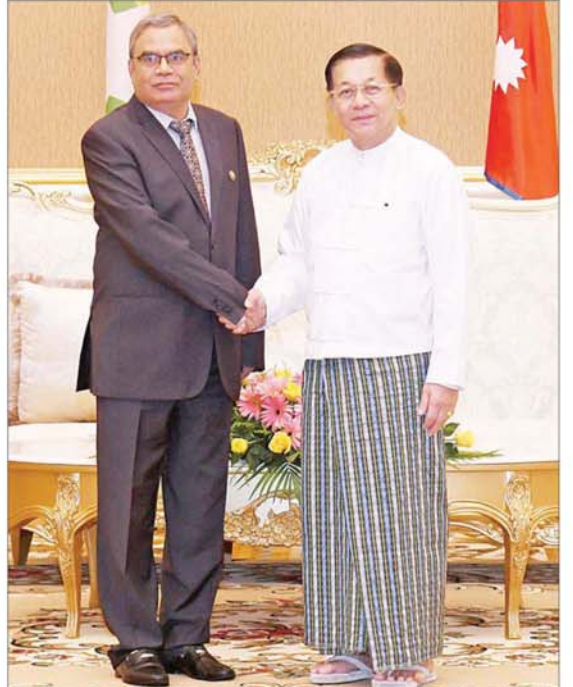
နိုင်ငံတော်စီမံအုပ်ချုပ်ရေးကောင်စီဥက္ကဋ္ဌ နိုင်ငံတော်ဝန်ကြီးချုပ် ဗိုလ်ချုပ်မှူးကြီး မင်းအောင်လှိုင် ဘင်းမိစတက်အတွင်းရေးမှူးချုပ် H.E. Mr. Indra Mani Pandey အား ရင်းရင်းနှီးနှီး နှုတ်ဆက်စဉ်။

ရွေးကောက်ပွဲ အောင်မြင်စွာကျင်းပနိုင်ရေး ကြိုတင်ပြင်ဆင်ဆောင်ရွက်လျက်ရှိမှုအခြေအနေများနှင့် စပ်လျဉ်း၍ ရင်းရင်းနှီးနှီး ဆွေးနွေးခဲ့ကြသည်။ တွေ့ဆုံပွဲအပြီးတွင် နိုင်ငံတော်စီမံအုပ်ချုပ်ရေးကောင်စီဥက္ကဋ္ဌ နိုင်ငံတော်ဝန်ကြီးချုပ်နှင့် အဖွဲ့ဝင်များသည် ဘင်းမိစတက် အဖွဲ့ဝင်နိုင်ငံများမှ အမျိုးသားလုံခြုံရေးဆိုင်ရာအကြီးအကဲများ၊ ကိုယ်စားလှယ်များ၊ ဘင်းမိစတက်အတွင်းရေးမှူးချုပ်တို့နှင့်အတူ စုပေါင်းမှတ်တမ်းတင် ဓာတ်ပုံရိုက်ခဲ့ကြကြောင်း သိရသည်။