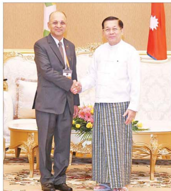
နိုင်ငံတော်စီမံအုပ်ချုပ်ရေးကောင်စီဥက္ကဋ္ဌ နိုင်ငံတော်ဝန်ကြီးချုပ် ဗိုလ်ချုပ်မျိုးကြီး မင်းအောင်လှိုင် နီပေါနိုင်ငံမှ H.E. Mr. Harishchandra Ghimire အား ရင်းရင်းနှီးနှီး နှုတ်ဆက်စဉ်။