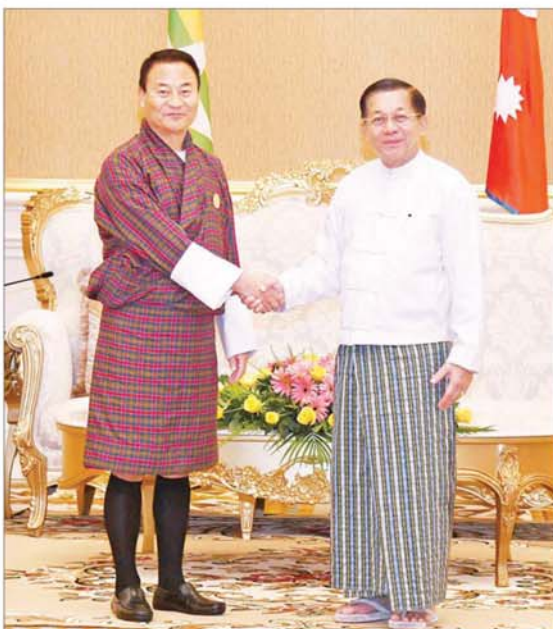
နိုင်ငံတော်စီမံအုပ်ချုပ်ရေးကောင်စီဥက္ကဋ္ဌ နိုင်ငံတော်ဝန်ကြီးချုပ် ဗိုလ်ချုပ်မျိုးကြီး မင်းအောင်လှိုင် ဘူတန်နိုင်ငံမှ Mr. Sonam Wangyel အား ရင်းရင်းနှီးနှီးနှုတ်ဆက်စဉ်။