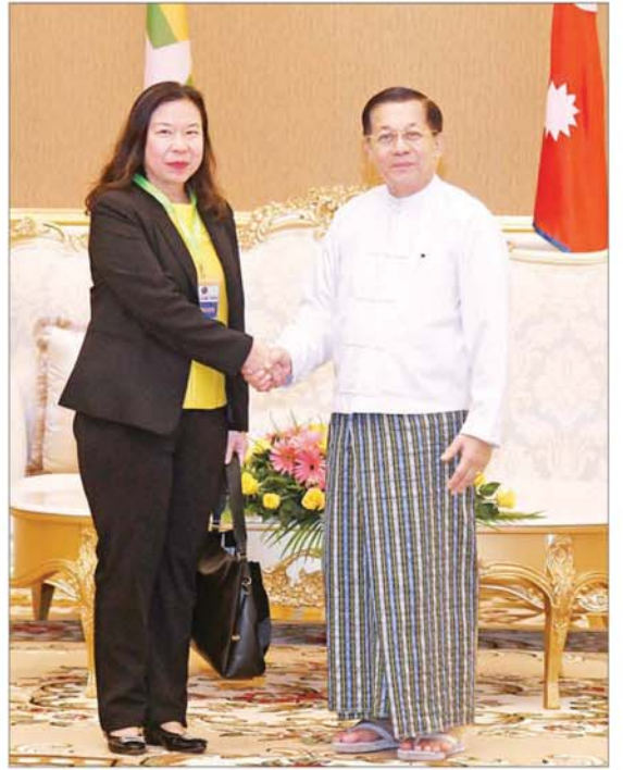
နိုင်ငံတော်စီမံအုပ်ချုပ်ရေးကောင်စီ ဥက္ကဋ္ဌ နိုင်ငံတော်ဝန်ကြီးချုပ် ဗိုလ်ချုပ်မှူးကြီး မင်းအောင်လှိုင် ထိုင်းနိုင်ငံမှ Ms. Kanyarat Angkanavisalya အား ရင်းရင်းနှီးနှီး နှုတ်ဆက်စဉ်။

* စာမျက်နှာ ၃ မှ ဘင်းမိစတက် အဖွဲ့ဝင်နိုင်ငံများအချင်းချင်း စီးပွားရေးဖွံ့ဖြိုးတိုးတက်ရေး၊ တည်ငြိမ်အေးချမ်းရေး၊ လူမှုရေးဆိုင်ရာလိုအပ်ချက်များနှင့် ဆက်သွယ်ရေးဆိုင်ရာကဏ္ဍများတွင် ပူးပေါင်းဆောင်ရွက်လျက်ရှိမှု၊ အဖွဲ့ဝင်နိုင်ငံများအကြား မူးယစ်ဆေးဝါးတိုက်ဖျက်ရေး၊ အကြမ်းဖက်မှုနှိမ်နင်းရေး၊ လူကုန်ကူးမှုနှင့် ဆိုက်ဘာလုံခြုံရေးဆိုင်ရာကိစ္စရပ်များ၌ ပူးပေါင်းဆောင်ရွက်လျက်ရှိမှု အခြေအနေများနှင့် အဖွဲ့ဝင်နိုင်ငံများ ဖွံ့ဖြိုးတိုးတက်ရေးဆိုင်ရာကိစ္စရပ်များ၊ သေသတွင်းနိုင်ငံများအချင်းချင်း ပူးပေါင်းဆောင်ရွက်မှုများမှ တစ်ဆင့်