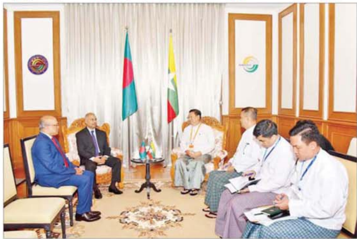
ပြည်ထောင်စုဝန်ကြီး ဗိုလ်ချုပ်ကြီး မိုးအောင် ဘင်္ဂလားဒေ့ရှ်နိုင်ငံမှ အမျိုးသားလုံခြုံရေးဆိုင်ရာ အကြီးအကဲ Ambassador Abdul Motaleb Sarker အား လက်ခံတွေ့ဆုံစဉ်။

တော့ဆုံစဉ် နှစ်နိုင်ငံအချင်း ချင်း ပူးပေါင်းဆောင်ရွက်မှုများမှ တစ်ဆင့် တွေ့ကြုံနေရသည့် စိန်ခေါ်မှုများကို ဖြေရှင်းဆောင် ရွက်နိုင်မည့်အခြေအနေ၊ မြန်မာ နိုင်ငံ၏ နိုင်ငံရေးဖြစ်ပေါ်တိုးတက် ပြောင်းလဲလာမှု အခြေအနေနှင့် လွတ်လပ်ပြီး တရားမျှတသည့် ပါတီနုဒီမိုကရေစီ အထွေထွေ ရွေးကောက်ပွဲ အောင်မြင်စွာ ကျင်းပနိုင်ရေး ကြိုတင်ပြင်ဆင် ဆောင်ရွက်လျက်ရှိသည့် အခြေ အနေများနှင့်လည်း၍ ရင်းနှီး ပွင့်လင်းစွာ အမြင်ချင်းဖလှယ် ဆွေးနွေးကြသည်။ တော့ဆုံပွဲသို့ နိုင်ငံတော်စီမံ အုပ်ချုပ်ရေး ကောင်စီဥက္ကဋ္ဌရှုံး ဝန်ကြီးဌာန(၁) ဒုတိယဝန်ကြီး ဗိုလ်ချုပ် ခွန်သန့်ဇော်ထူး၊ ညွှန်ကြားရေးမှူးချုပ်နှင့် တာဝန် ရှိသူများ တက်ရောက်ကြသည်။ သတင်းစဉ်