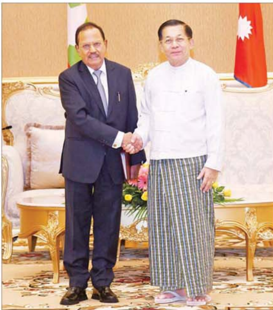
နိုင်ငံတော်စီမံအုပ်ချုပ်ရေးကောင်စီဥက္ကဋ္ဌ နိုင်ငံတော်ဝန်ကြီးချုပ် ဗိုလ်ချုပ်မျိုးကြီး မင်းအောင်လှိုင် အိန္ဒိယနိုင်ငံမှ H.E. Shri Ajit Doval အား ရင်းရင်းနှီးနှီးနှုတ်ဆက်စဉ်။

ဆွေးနွေး ထို့နောက် နိုင်ငံတော်စီမံအုပ်ချုပ်ရေး ကောင်စီဥက္ကဋ္ဌ နိုင်ငံတော်ဝန်ကြီးချုပ်နှင့် အမျိုးသားလုံခြုံရေးဆိုင်ရာ အကြီးအကဲ များ၊ ကိုယ်စားလှယ်များ၊ ဘင်းမိမိတက် အတွင်းရေးမှူးချုပ်တို့သည် ဘင်းမိမိတက် အဖွဲ့အစည်း ပေါ်ပေါက်လာမှုအခြေအနေ နှင့် ရည်ရွယ်ချက်များ၊ စာမျက်နှာ ၄ သို့*