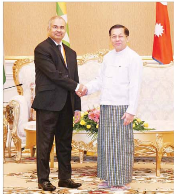
နိုင်ငံတော်စီမံအုပ်ချုပ်ရေးကောင်စီဥက္ကဋ္ဌ နိုင်ငံတော်ဝန်ကြီးချုပ် ဗိုလ်ချုပ်မျိုးကြီး မင်းအောင်လှိုင် ဘင်္ဂလားဒေ့ရှ်နိုင်ငံမှ Ambassador Abdul Motaleb Sarker အား ရင်းရင်းနှီးနှီးနှုတ်ဆက်စဉ်။