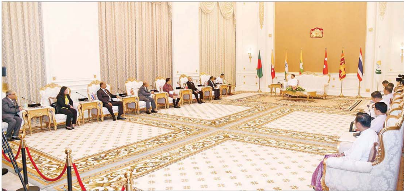
နိုင်ငံတော်စီမံအုပ်ချုပ်ရေးကောင်စီဥက္ကဋ္ဌ နိုင်ငံတော်ဝန်ကြီးချုပ် ဗိုလ်ချုပ်မှူးကြီး မင်းအောင်လှိုင် ဘင်းမိစတက်အဖွဲ့ဝင်နိုင်ငံများမှ အမျိုးသားလုံခြုံရေးဆိုင်ရာ အကြီးအကဲများနှင့် ဘင်းမိစတက်အတွင်းရေးမှူးချုပ်တို့အား လက်ခံတွေ့ဆုံစဉ်။