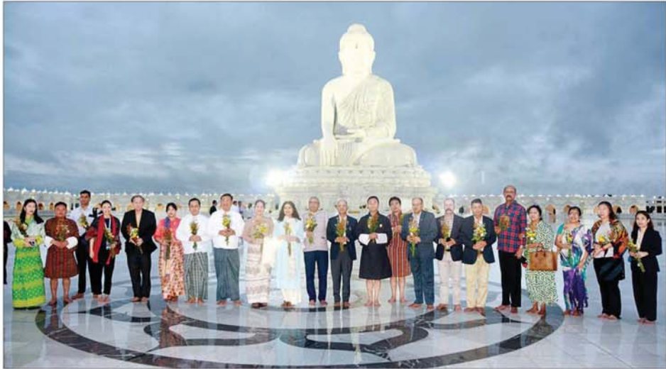
ပြည်ထောင်စုဝန်ကြီး ဗိုလ်ချုပ်ကြီးမိုးအောင်၊ ဘင်းမိစတက် အမျိုးသားလုံခြုံရေးဆိုင်ရာ အကြီးအကဲများ၊ ဇနီးများနှင့် တာဝန်ရှိသူများ မာရဝိဇယ ဗုဒ္ဓရုပ်ပွားတော်မြတ်ကြီးတွင် ဖူးမြော်ကြည်ညိုကြစဉ်။

နေပြည်တော် ဇူလိုင် ၂၆ အမျိုးသား လုံခြုံရေးဆိုင်ရာ အကြံပေးပုဂ္ဂိုလ် နိုင်ငံတော်စီမံ အုပ်ချုပ်ရေးကောင်စီ ဥက္ကဋ္ဌရုံး ဝန်ကြီးဌာန (၁) ပြည်ထောင်စု ဝန်ကြီး ဗိုလ်ချုပ်ကြီးမိုးအောင်နှင့် ဇနီးတို့သည် ဘင်းမိစတက် အမျိုးသား လုံခြုံရေးဆိုင်ရာ အကြီးအကဲများ၊ ဇနီးများ၊ အဖွဲ့ဝင်များ၊ ဘင်းမိစတက် အတွင်းရေးမှူးချုပ်တို့နှင့် အတူ ယနေ့တွင် နေပြည်တော်ရှိ မာရဝိဇယ ဗုဒ္ဓရုပ်ပွားတော်မြတ်ကြီး နှင့် ဥပ္ပိတသန္တိစေတီတော်မြတ် ကြီးတို့ကို သွားရောက်ဖူးမြော် ကြည်ညိုကြသည်။