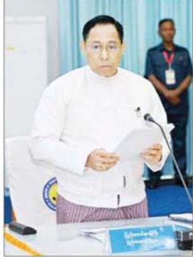
နိုင်ငံတော်စီမံအုပ်ချုပ်ရေးကောင်စီအဖွဲ့ဝင် ပြည်ထောင်စုဝန်ကြီး ဒုတိယဗိုလ်ချုပ်ကြီး ရာပြည့် ရှင်းလင်းတင်ပြစဉ်။