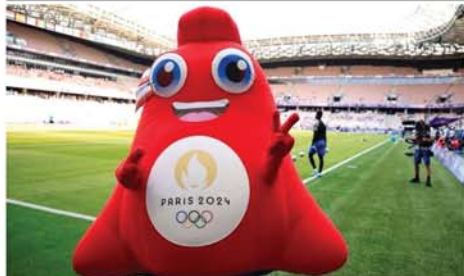
ပဲရစ်အိုလံပစ်အားကစားပွဲတော်အထိမ်းအမှတ် အရုပ်ကြီးကို ဇူလိုင် ၂၅ ရက်က ဘောလုံးပွဲတစ်ပွဲ၌ တွေ့ရစဉ်။ Mon

ဒေလီ ဇူလိုင် ၂၆ ၁၉ ဒဿ ၂၂ ကာရင် အလေးချိန်ရှိသော စိန်တုံးကြီးကို အိန္ဒိယနိုင်ငံအလယ်ပိုင်း မဇာပရာဒက်ရှိပြည်နယ်မှ ရာဂျူးဂို အွန်းဆိုသူ မကြာသေးမီက တူးဖော်ရရှိခဲ့ကြောင်း ဘီဘီစီသတင်းဌာနက ဖော်ပြသည်။ လာမည့် အစိုးရလေလံပွဲတွင် ထိုစိန်အရိုင်းတုံးကြီးကို ရောင်းချလျှင် အမေရိကန်ဒေါ်လာ ၉၅၅၅၀ နှင့် ညီမျှသည် ဖြစ်ပြီး ၈ သန်းခန့်ရရှိလိမ့်မည်ဟု ငှင်း တွက်ချက်ဖော်ပြထားသည်။ နှစ်ပေါင်း ၂၀ ကြာအောင် စိန်တူးဖော်ရေးလုပ်ငန်းကို စောက်ချလုပ်ကိုင်ခဲ့ရာ အစိုးရထံမှ ငှား