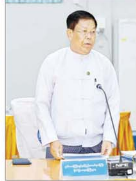
ဒုတိယဝန်ကြီးချုပ်နှင့် ပြည်ထောင်စုဝန်ကြီး ဦးသန်းဆွေ ရှင်းလင်းတင်ပြစဉ်။

ကြောင်း၊ နိုင်ငံတော်၏ ဒစ်ဂျစ်တယ် အသွင်ကူးပြောင်းရေးစဉ်ကို လျင်မြန်လွယ်ကူချောမွေ့စေရန် အထောက်အပံ့ကောင်းများ ပေးစွမ်းနိုင်မည်ဖြစ်သည့် အတွက် အောင်မြင်အောင် မဖြစ်မနေ အကောင်အထည်ဖော်ဆောင်ရွက်သွားကြရမည် လုပ်ငန်းစဉ်တစ်ခုဖြစ်သည်ကို ပြောကြားလိုကြောင်း။