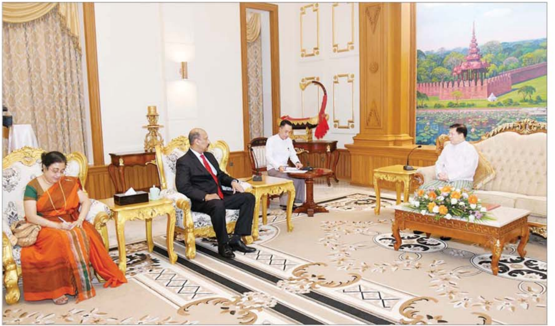
နိုင်ငံတော်စီမံအုပ်ချုပ်ရေးကောင်စီဥက္ကဋ္ဌ နိုင်ငံတော်ဝန်ကြီးချုပ် ဗိုလ်ချုပ်မှူးကြီး မင်းအောင်လှိုင် သီရိလင်္ကာနိုင်ငံ ကာကွယ်ရေးဝန်ကြီးဌာန၏ အတွင်းဝန် General Kamal Gunaratne (Retd) အား လက်ခံတွေ့ဆုံစဉ်။

နေပြည်တော် ၈ ဇူလိုင် ၂၆ နိုင်ငံတော်စီမံအုပ်ချုပ်ရေးကောင်စီ ဥက္ကဋ္ဌ နိုင်ငံတော်ဝန်ကြီးချုပ် ဗိုလ်ချုပ်မှူးကြီး မင်းအောင်လှိုင်ထံသို့ သီရိလင်္ကာနိုင်ငံ ကာကွယ်ရေးဝန်ကြီးဌာန၏ အတွင်းဝန် General Kamal Gunaratne (Retd) က ယနေ့မွန်းလွဲပိုင်းတွင် နေပြည်တော်ရှိ နိုင်ငံတော်စီမံအုပ်ချုပ်ရေးကောင်စီ ဥက္ကဋ္ဌရုံး၊ ဧည့်ခန်းမ၌ လာရောက်ဂါရဝပြုတွေ့ဆုံသည်။ အဆိုပါတွေ့ဆုံပွဲသို့ နိုင်ငံတော်စီမံအုပ်ချုပ်ရေးကောင်စီဥက္ကဋ္ဌ နိုင်ငံတော်ဝန်ကြီးချုပ်နှင့်အတူ ကောင်စီတွဲဖက်အတွင်းရေးမှူး ဒုတိယဗိုလ်ချုပ်ကြီး ရဲဝင်းဦး၊ နိုင်ငံတော်စီမံအုပ်ချုပ်ရေးကောင်စီဥက္ကဋ္ဌရုံး ဝန်ကြီးဌာန(၁)ပြည်ထောင်စုဝန်ကြီး ဗိုလ်ချုပ်ကြီး မိုးအောင်နှင့် နိုင်ငံခြားရေးဝန်ကြီးဌာနမှ တာဝန်ရှိသူများ၊ သီရိလင်္ကာနိုင်ငံ ကာကွယ်ရေးဝန်ကြီးဌာန၏ အတွင်းဝန်နှင့်အတူ မြန်မာနိုင်ငံဆိုင်ရာ သီရိလင်္ကာနိုင်ငံသံအမတ်ကြီး H.E. Mrs. Ponnampereuma Arachchige Prabashini Ponnampereuma နှင့် တာဝန်ရှိသူများ တက်ရောက်ကြသည်။