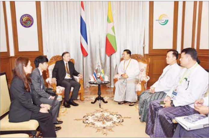
ပြည်ထောင်စုဝန်ကြီး ဗိုလ်ချုပ်ကြီး မိုးအောင် ထိုင်းနိုင်ငံမှ H.E. Mr. Ruchakorn NAPAPORNPIPAT ကို လက်ခံတွေ့ဆုံစဉ်။

ဘင်းမိစတက်လုံခြုံရေးဆိုင်ရာ နိုင်ငံများအချင်းချင်း ပူးပေါင်းဆောင်ရွက်မှုများမှတစ်ဆင့် တွေ့ကြုံနေရသည့် စိန်ခေါ်မှုများကို ဖြေရှင်းဆောင်ရွက်နိုင်မည့် အခြေအနေ မြန်မာနိုင်ငံ၏ နိုင်ငံရေးဖြစ်ပေါ်တိုးတက်ပြောင်းလဲလာမှုအခြေအနေနှင့် လွတ်လပ်ပြီး တရားမျှတသည့် ပါတီစုံဒီမိုကရေစီအထွေထွေရွေးကောက်ပွဲ အောင်မြင်စွာကျင်းပနိုင်ရေး ကြိုတင်ပြင်ဆင်ဆောင်ရွက်လျက်ရှိသည့် အခြေအနေများနှင့် စပ်လျဉ်း၍ ရင်းနှီးပွင့်လင်းစွာ အမြင်ချင်းဖလှယ် ဆွေးနွေးကြသည်။ တွေ့ဆုံပွဲသို့ နိုင်ငံတော်စီမံအုပ်ချုပ်ရေးကောင်စီဥက္ကဋ္ဌရုံးဝန်ကြီးဌာန(၁) ဒုတိယဝန်ကြီး ဗိုလ်ချုပ် ခွန်သန့်ဇော်ထူးနှင့် တာဝန်ရှိသူများ တက်ရောက်ကြသည်။ သတင်းစဉ်