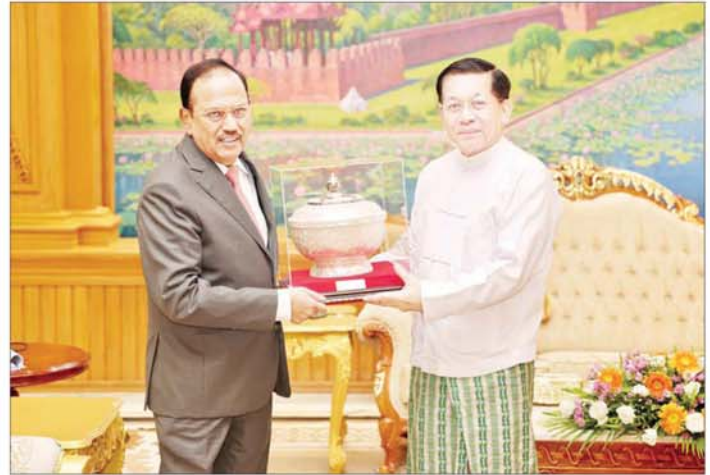
နိုင်ငံတော်စီမံအုပ်ချုပ်ရေးကောင်စီဥက္ကဋ္ဌ နိုင်ငံတော်ဝန်ကြီးချုပ် ဗိုလ်ချုပ်မှူးကြီးမင်းအောင်လှိုင်နှင့် အိန္ဒိယနိုင်ငံ အမျိုးသားလုံခြုံရေးဆိုင်ရာ အကြံပေးပုဂ္ဂိုလ် H.E. Shri Ajit Doval တို့ အမှတ်တရလက်ဆောင်ပစ္စည်းများ အပြန်အလှန်ပေးအပ်စဉ်။

၂၇ စာမျက်နှာ ၃ မှ ယနေ့ကမ္ဘာတွင် ဒစ်ဂျစ်တယ်အသွင်ကို အောင်မြင်စွာကူးပြောင်းနိုင်သည့် နိုင်ငံများသည် လျင်မြန်စွာဖွံ့ဖြိုးတိုးတက်လာနေသည်ကို အထင်အရှားတွေ့မြင်ရကြောင်း၊ နိုင်ငံတစ်ခု၏ စီးပွားရေးဖွံ့ဖြိုးတိုးတက်မှုသည် နိုင်ငံ၏ပိုမိုကျယ်ပြန့်ပြီး ပိုမိုလုံခြုံစိတ်ချရသည့် ဒစ်ဂျစ်တယ် ဝန်ဆောင်မှုများ ပေးနိုင်ခြင်းဆိုသည့် အချက်ပေါ်တွင် မှီတည်နေကြောင်း၊ ဒစ်ဂျစ်တယ်အစိုးရဆိုသည်မှာ ဒစ်ဂျစ်တယ်တယ်စွမ်းရည်နှင့် ဒစ်ဂျစ်တယ် ရင့်ကျက်ပြည့်စုံမှုများဆီကို ဦးတည်ရမည်ဖြစ်ခြင်းကြောင့် ယခင်ဆယ်စုနှစ်များက ကြိုးပမ်းအကောင်အထည်ဖော်ခဲ့သည့် e-Government ၏ ပုံရိပ်ကို တိုးမြှင့်ပြီး နိုင်ငံတကာနှင့် ရင်းနှီးပွင့်လင်းအောင်ဆောင်ရွက်သွားကြရန် လိုအပ်ကြောင်း၊ ထို့ကြောင့်မိမိတို့မျှော်မှန်းသည့်ဒစ်ဂျစ်တယ်အသွင်အလမ်းများကို အစီအစဉ်ဆောင်ရွက်နိုင်ရန်အတွက် လူတစ်ဦးချင်းစီနှင့်