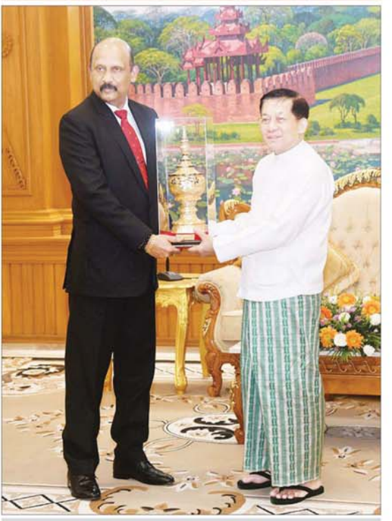
နိုင်ငံတော်စီမံအုပ်ချုပ်ရေးကောင်စီဥက္ကဋ္ဌ နိုင်ငံတော်ဝန်ကြီးချုပ် ဗိုလ်ချုပ်မှူးကြီး မင်းအောင်လှိုင်နှင့် သီရိလင်္ကာနိုင်ငံ ကာကွယ်ရေးဝန်ကြီးဌာန၏ အတွင်းဝန် General Kamal Gunaratne (Retd) တို့ အမှတ်တရလက်ဆောင်ပစ္စည်းများ အပြန်အလှန်ပေးအပ်စဉ်။

နှစ်နိုင်ငံအကြား စီးပွားရေးဖွံ့ဖြိုးတိုးတက်မှုအတွက် ပူးပေါင်းဆောင်ရွက်မှုများ မြှင့်တင်ရေးဆိုင်ရာကိစ္စရပ်များ၊ ဘင်းမိစတက်အမျိုးသားလုံခြုံရေးဆိုင်ရာ အကြီးအကဲများ အစည်းအဝေးကျင်းပခဲ့မှုအခြေအနေများ အမြင်ချင်းဖလှယ်ဆွေးနွေး