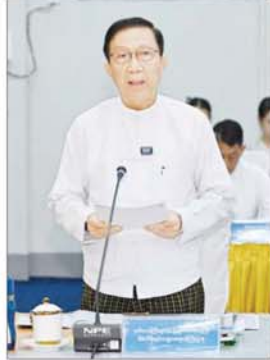
ဒုတိယဝန်ကြီးချုပ်နှင့် ပြည်ထောင်စုဝန်ကြီး ဦးဝင်းရှိန် ရှင်းလင်းတင်ပြစဉ်။