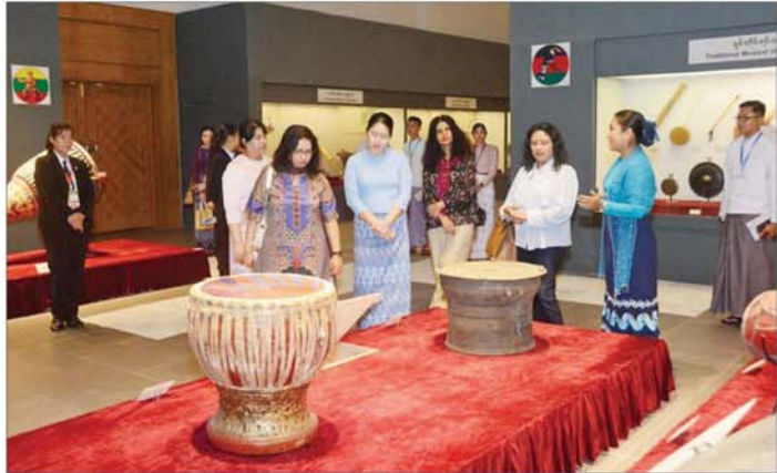
ဘင်းမိစတက် အမျိုးသားလုံခြုံရေးဆိုင်ရာ အကြီးအကဲများ၏ ဇနီးများနှင့် တာဝန်ရှိသူများ အမျိုးသားပြတိုက်တွင် ခင်းကျင်းပြသထားသည့် ပြကွင်းပြကွက်များကို လိုက်လံကြည့်ရှုကြစဉ်။

ဝန်ကြီးနှင့်အဖွဲ့သည် မာရဝိဇယ ဗုဒ္ဓ ရုပ်ပွားတော်မြတ်ကြီးအား ပန်၊ ဆီမီး၊ ရေချမ်းတို့ကို ကပ်လှူ ပူဇော်၍ ဖူးမြော်ကြည်ညိုကာ စုပေါင်း မှတ်တမ်းတင်ဓာတ်ပုံ ရိုက်ကြသည်။