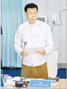
e-Government ဦးဆောင်ကော်မတီဥက္ကဋ္ဌ နိုင်ငံတော်စီမံအုပ်ချုပ်ရေးကောင်စီဥက္ကဋ္ဌ နိုင်ငံတော်ဝန်ကြီးချုပ်နှင့် ပြည်ထောင်စုဝန်ကြီး ဗိုလ်ချုပ်ကြီး မြထွန်းဦး ရှင်းလင်းတင်ပြစဉ်။

e-Government စနစ်များကို တည်ဆောက်ရာတွင် လူ့စွမ်းအားအရင်းအမြစ်၊ ငွေကြေးအရင်းအမြစ်၊ သဘာဝအရင်းအမြစ် စသည့်အရင်းအမြစ်များ လိုအပ်ကြောင်း၊ ယခုကဲ့သို့ လိုအပ်သည့် အရင်းအမြစ်များကို မျှတအသုံးပြုသွားနိုင်ရန်နှင့် အစိုးရဌာနများက အကောင်အထည်ဖော်နေသည့် စီမံကိန်းများကို အောင်မြင်နိုင်ခြေမြှင့်မားရန် ဦးဆောင်ကော်မတီက စနစ်တကျလမ်းညွှန်မှုပြုပြီး ကြီးကြပ်ကွပ်ကဲသွားရမည်ဖြစ်ကြောင်း၊ ဦးဆောင်ကော်မတီအနေဖြင့် ပိုမိုပိုင်လင်းခြင်းသာမူ၊ သတင်းအချက်အလက်များ မျှဝေမှု၊ ကျွမ်းကျင်သည့် လူ့စွမ်းအား အရင်းအမြစ်များ ရရှိနိုင်မှုနှင့် ပူးပေါင်းဆောင်ရွက်မှုများကို စိတ်အားထက်သန်စွာ ထောက်ခံအားပေးရန်လည်း လိုအပ်ကြောင်း။