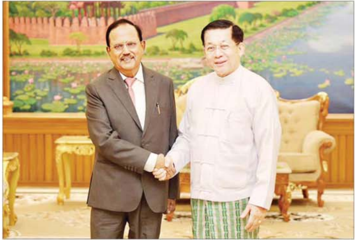
နိုင်ငံတော်စီမံအုပ်ချုပ်ရေးကောင်စီဥက္ကဋ္ဌ နိုင်ငံတော်ဝန်ကြီးချုပ် ဗိုလ်ချုပ်မှူးကြီးမင်းအောင်လှိုင်နှင့် အိန္ဒိယနိုင်ငံ အမျိုးသားလုံခြုံရေးဆိုင်ရာ အကြံပေးပုဂ္ဂိုလ် H.E. Shri Ajit Doval တို့ ရင်းနှီးနှီးနှီးနှီးဆက်ဆံစဉ်။