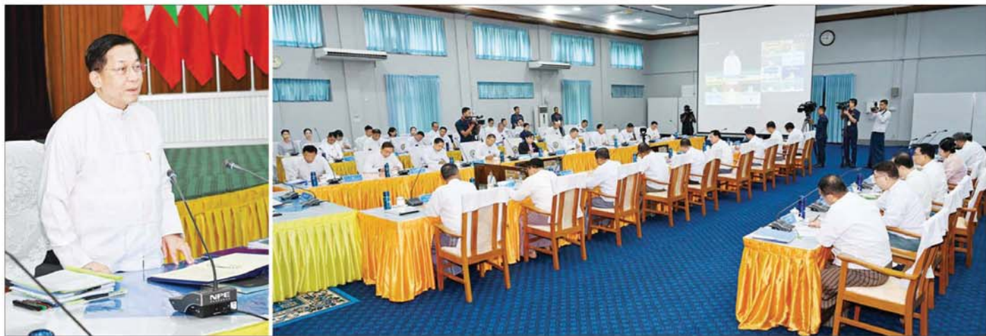
e-Government ဦးဆောင်ကော်မတီနာယက နိုင်ငံတော်စီမံအုပ်ချုပ်ရေးကောင်စီဥက္ကဋ္ဌ နိုင်ငံတော်ဝန်ကြီးချုပ် ဗိုလ်ချုပ်မှူးကြီး မင်းအောင်လှိုင် e-Government ဦးဆောင်ကော်မတီ၏ (၁/၂၀၂၄) လုပ်ငန်းညှိနှိုင်းအစည်းအဝေးတွင် အမှာစကားပြောကြားစဉ်။

နိုင်ငံတစ်ခု၏ စီးပွားရေးဖွံ့ဖြိုးတိုးတက်မှုသည် ပိုမိုကျယ်ပြန့်ပြီး လုံခြုံစိတ်ချရသော ဒစ်ဂျစ်တယ်ဝန်ဆောင်မှုပေးနိုင်သည့် အချက်ပေါ်တွင် မှီတည်နေမိမိတို့ မျှော်မှန်းသည့် ဒစ်ဂျစ်တယ်အခွင့်အလမ်းများကို အမိအရဆုပ်ကိုင်နိုင်ရန် ဒစ်ဂျစ်တယ်နည်းပညာများ၏ ခြိမ်းခြောက်မှုနှင့် အန္တရာယ်များလျော့ပါးလာစေရေးနှင့် ပြည်သူ့ပဟိုပြုသည့် e-Government ဝန်ဆောင်မှုများ ဖွံ့ဖြိုးတိုးတက်လာစေရေး ကြိုးပမ်း