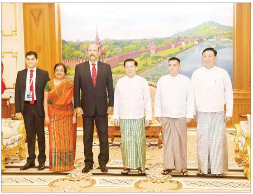
နိုင်ငံတော်စီမံအုပ်ချုပ်ရေးကောင်စီဥက္ကဋ္ဌ နိုင်ငံတော်ဝန်ကြီးချုပ် ဗိုလ်ချုပ်မှူးကြီး မင်းအောင်လှိုင်နှင့် အဖွဲ့ဝင်များ သီရိလင်္ကာနိုင်ငံ ကာကွယ်ရေးဝန်ကြီးဌာန၏ အတွင်းဝန် General Kamal Gunaratne (Retd) ဦးဆောင်သော အဖွဲ့ဝင်များနှင့်အတူ စုပေါင်းမှတ်တမ်းတင် စာတိုက်ခဲ့ကြသည်။