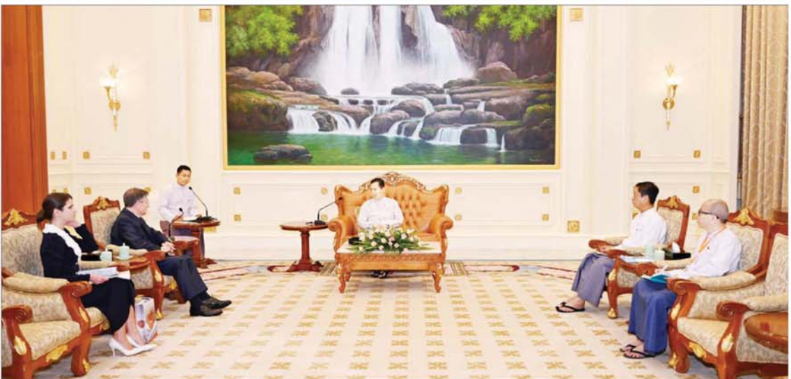
နိုင်ငံတော်စီမံအုပ်ချုပ်ရေးကောင်စီ ဒုတိယဥက္ကဋ္ဌ ဒုတိယဝန်ကြီးချုပ် ဒုတိယဗိုလ်ချုပ်မှူးကြီး စိုးဝင်း မြန်မာနိုင်ငံဆိုင်ရာ ရုရှားဖက်ဒရေးရှင်းနိုင်ငံ သံအမတ်ကြီး H.E.Mr. Is-kander Azizov အား လက်ခံတွေ့ဆုံစဉ်။

အမြင်ချင်းဖလှယ်ဆွေးနွေး ထိုသို့တွေ့ဆုံစဉ် အထူးစီးပွားရေးစုန် ဖြင့် ဆောင်ရွက်ရမည့် လုပ်ငန်းစဉ်များ၊ လျှပ်စစ်ဓာတ်အားထုတ်လုပ်နိုင်ရေး ကိစ္စ ရပ်များနှင့် မြန်မာနိုင်ငံအတွင်း ဖြစ်ထွန်း တိုးတက်မှုများအပေါ် ရုရှားနိုင်ငံသတင်း မီဒီယာများမှ ပိုမိုဖော်ပြပေးလိုမှု အပါ အဝင် နိုင်ငံရေး၊ စီးပွားရေး၊ ကာကွယ်ရေး ဆိုင်ရာ ကိစ္စရပ်များအား အမြင်ချင်း ဖလှယ် ဆွေးနွေးခြင်းနှင့် သံအမတ်ကြီး၏ စာမျက်နှာ ၆ သို့ ❖