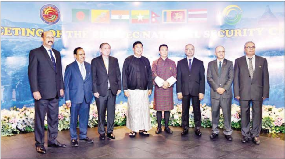
အမျိုးသားလုံခြုံရေးဆိုင်ရာအကြံပေးပုဂ္ဂိုလ် ပြည်ထောင်စုဝန်ကြီး ဗိုလ်ချုပ်ကြီး မိုးအောင် ဘင်းမိစတက် အမျိုးသားလုံခြုံရေးဆိုင်ရာ အကြီးအကဲများနှင့်အတူ မှတ်တမ်းတင်ဓာတ်ပုံရိုက်စဉ်။

ဦးစွာ ပြည်ထောင်စုဝန်ကြီး ဗိုလ်ချုပ်ကြီး မိုးအောင်နှင့် ဘင်းမိစတက် အမျိုးသားလုံခြုံရေးဆိုင်ရာ အကြီးအကဲများနှင့် ဇနီးများသည် M Gallery ဟိုတယ်၌ ခင်းကျင်းပြသထားသည့် မြန်မာ့ရိုးရာလက်မှုပစ္စည်းများ၊ ရိုးရာအထိမ်းအမှတ် ပစ္စည်းများနှင့် အမှတ်တရလက်ဆောင်ပစ္စည်းအရောင်းဆိုင်များကို လှည့်လည်ကြည့်ရှုအေးပေးကြသည်။