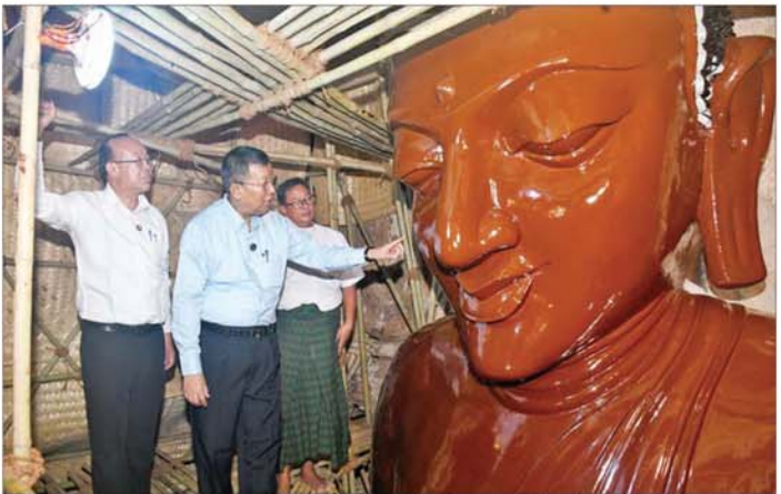
ဆင်းတုတော် ၉ ဆူတို့အား ရွှေသင်္ကန်း ပြန်လည်ကပ်လှူပူဇော်ခြင်းလုပ်ငန်း ဆောင်ရွက်သွားမည့် အခြေအနေ၊ သစ်စေးသုတ်ခြင်း၊ အခြောက်ခံခြင်း လုပ်ငန်းများပြီးစီးပြီဖြစ်၍ ရွှေသင်္ကန်း ကပ်လှူခြင်းများ ဆက်လက်ဆောင်ရွက်သွားမည့် အခြေအနေတို့ကို ရှင်းလင်းတင်ပြသည်။ ထို့နောက် ပြည်ထောင်စုဝန်ကြီးက ထီးလိုမင်းလို ဘုရားတိုင်းနှင့် ရင်ပြင်ခုံတို့အကြား ပတ်လည် သဲကျောက်ပြား လျှောက်လမ်းခင်းခြင်းနှင့်ပတ်သက်၍ လျှောက်လမ်းအရည် ၁၀၅၈ ပေ အကျယ် ခြောက်ပေ

နေပြည်တော် ဇူလိုင် ၂၈ သာသနာရေးနှင့် ယဉ်ကျေးမှုဝန်ကြီးဌာန ပြည်ထောင်စုဝန်ကြီး ဦးတင်ဦးလွင်သည် တာဝန်ရှိသူများနှင့်အတူ ယနေ့နံနက်ပိုင်းတွင် မန္တလေးတိုင်းဒေသကြီး ပုဂံယဉ်ကျေးမှု အမွေအနှစ်ဒေသ၌ နိုင်ငံတော်အကြီးအကဲ၏ ခရီးစဉ်လမ်းညွှန်ချက်ပါ ဆောင်ရွက်ထားရှိမှုများနှင့် ရှေးဟောင်းရေကန်များ တူးဖော်ပြုပြင်ထိန်းသိမ်းခြင်း အခြေအနေတို့ကို သွားရောက် ကြည့်ရှုစစ်ဆေးသည်။ ဦးစွာ ပြည်ထောင်စုဝန်ကြီးသည် ထီးလိုမင်းလို ဘုရားတွင် နိုင်ငံတော်အကြီးအကဲ လမ်းညွှန်ချက်အရ အာရုံခံ အရပ်လေးမျက်နှာနှင့် အပေါ်ထပ်ရှိ ဆင်းတုတော်ကိုးဆူရွာကန်ပြန်လည်ကယ်လှူခြင်းဆောင်ရွက်နေမှု၊ ဘုရားပရဝဏ်အတွင်း ရင်ပြင်တော်အုတ်ခုံနှင့် စေတီပတ်လျှောက်လမ်းအကြား သဲကျောက်ပြားလျှောက်လမ်းခင်းခြင်းတို့ကို ကြည့်ရှုစစ်ဆေးရာ တာဝန်ရှိသူများက ဘုရားအပေါ်ထပ် လိုက်ပတ်လမ်းရှိ ဆင်းတုတော်လေးဆူတွင် ရွှေဆိုင်း ၃၂၅ ဆိုင်းနှင့် အောက်လိုက်ပတ်လမ်းရှိ ဆင်းတုတော်ငါးဆူတွင် ရွှေဆိုင်း ၄၄၀ ကပ်လှူမည်ဖြစ်ပြီး စုစုပေါင်း