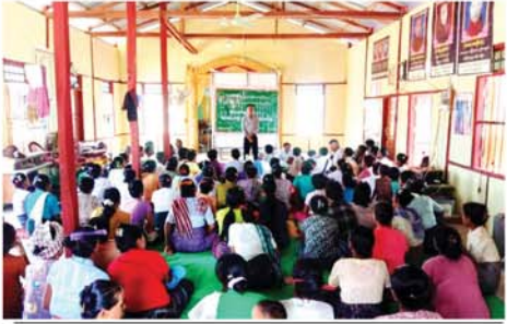
သင့်သွေးဖြင့် အသက်ကယ်ပါ။