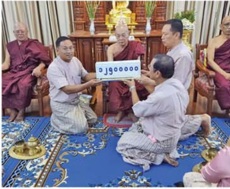
မန္တလေး၊ ဇူလိုင် ၂၈ - သဒ္ဓါဓိက ဆွမ်းကပ်အဖွဲ့ တက္ကသိုလ်(မန္တလေး)ရှိ သံဃာ ( ကုန်စည်ဒိုင်၊ မန္တလေးမြို့)မှ တော်အရှင်သူမြတ်တို့အား (၁၀)

ကြိမ်မြောက် ဆွမ်းဆက်ကပ် လှူဒါန်းခြင်း၊ ဝါဆိုသင်္ကန်းကပ် လှူဒါန်းနှင့် ဆွမ်းပဒေသာပင် ထပ်မံ စိုက်ထူခြင်း အလှူတော်မင်္ဂလာ အခမ်းအနားကို ယနေ့ နံနက် ၁၀ နာရီက ကျင်းပသည်။ အဆိုပါ အခမ်းအနားတွင် နိုင်ငံတော်ပရိယတ္တိသာသနာ့ တက္ကသိုလ်(မန္တလေး) ပါမောက္ခ ချုပ်ဆရာတော် ဒေါက်တာ ဘဒ္ဒန္တ ကေသရ(အဂ္ဂမဟာပဏ္ဍိတ)နှင့် ဆရာတော်ကြီးများထံသို့ ဝါဆို သင်္ကန်းနှင့် လှူဒါန်းပစ္စည်းများ ဆက်ကပ်လှူဒါန်းခြင်း၊ ဆွမ်းပဒေသာပင် ငွေကျပ် ၂၅