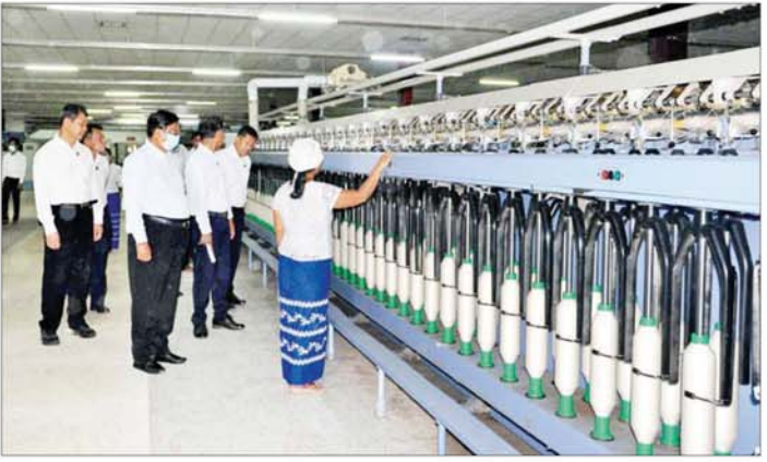
မှုလုပ်ငန်းများ တိုးမြှင့်ဆောင်ရွက်နိုင်ရေး စီမံဆောင်ရွက်ရန်မှာကြားသည်။ ယင်းနောက် ပြည်ထောင်စုဝန်ကြီးသည် မန္တလေးတိုင်းဒေသကြီး စဉ့်ကိုင်မြို့နယ်ရှိ အမှတ်(၂) အထည်စက်ရုံ (ပလိပ်)သို့ ရောက်ရှိပြီး ချည်မျှင်ထုတ်လုပ်နေမှု ဆေးဆိုးနေမှု အထည်ဖြတ်စည်းစများမှ ချည်မျှင်ပြန်လည်ထုတ်လုပ်နေမှု (Textile Circular Economy) အခြေအနေတို့ကို လှည့်လည်ကြည့်ရှု စစ်ဆေးပြီး အရည်အသွေးကောင်းမွန်သည့် ထုတ်

နေပြည်တော် ဇူလိုင် ၂၈ စက်မှုဝန်ကြီးဌာန ပြည်ထောင်စုဝန်ကြီး ဒေါက်တာချာလီသန်းနှင့် အဖွဲ့သည် ယမန်နေ့နံနက်ပိုင်းက မန္တလေးတိုင်းဒေသကြီး ကျောက်ဆည်ခရိုင် မြစ်သားမြို့နယ်ရှိ အမှတ်(၇)အထည်စက်ရုံ (မြစ်သား)သို့ ရောက်ရှိပြီး ဈေးကွက်ဝင်ချည်မျှင် ထုတ်လုပ်နေမှုလုပ်ငန်းစဉ်ဆောင်ဆင့်တို့ကို လှည့်လည် ကြည့်ရှုစစ်ဆေးသည်။ ထို့နောက် ပြည်ထောင်စုဝန်ကြီးနှင့် အဖွဲ့သည် စက်ရုံရှင်းလင်းဆောင်၍ အရာထမ်းများနှင့်တွေ့ဆုံပြီး ပြည်တွင်းမှ ထွက်ရှိသည့် ၁/၄၀ ချည်မျှင်ဖြင့် အထည်များရက်လုပ်ရာတွင် တိုင်ချည်အဖြစ် အသုံးပြုနိုင်သည်အထိ ဆောင်ရွက်နိုင်ရေးအတွက် ကြိုးပမ်းဆောင်ရွက်ရန်၊ ချည်တစ်ပင်ချင်းစီ၏ ဆွဲဆန်ခံနိုင်မှုကို ပိုမိုမြင့်မားစေရေးအတွက် ထုတ်လုပ်မှုနှုန်းစဉ်တစ်လျှောက် စစ်ဆေးရမည့်နေရာများ သတ်မှတ်၍ စစ်ဆေးဆောင်ရွက်ရန်၊ ထိုပြင် ချည်လုံးများ၏ အရွယ်အစား ညီညွတ်မှုရှိစေရေး၊ ချောမွေ့မှု ရှိစေရေးအတွက် စက်ပစ္စည်းကိရိယာများကို လိုအပ်သည့် ချိန်ညှိခြင်းလုပ်ငန်းများ ဆောင်ရွက်ရန်၊ ဝါမှ အထည်အလိပ်ဖြစ်သည်အထိ ဆောင်ရွက်ရသည့် ထုတ်လုပ်မှုကွင်းဆက်တစ်လျှောက် ဖွံ့ဖြိုးတိုးတက်လာသည့်နှင့်အမျှ ပြည်သူများ အလုပ်အကိုင်အခွင့်အလမ်းများကို ပိုမိုရရှိလာမည်ဖြစ်၍ ထုတ်လုပ်