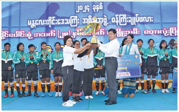
(မန္တလေးနေ့စဉ်)

အား ငွေသားဆုများနှင့် အားကစားသမားတစ်ဦးချင်းစီအား ဆုတံဆိပ်များ၊ ပွဲစဉ်တစ်လျှောက် အကောင်းဆုံးဆု၊ ရှေ့တန်း၊ အလယ်တန်းနှင့် နောက်တန်း အကောင်းဆုံးဆုနှင့် ဂိုးသမား အကောင်းဆုံးဆု ရရှိကြသည့်အား ဆုတံဆိပ်များနှင့် ငွေသားဆုများကိုလည်းကောင်း၊ ဝေးအပ်ချီးမြှင့်ခဲ့ကြပြီး စုပေါင်းမှတ်တမ်းတင်ဓာတ်ပုံများ ရိုက်ခဲ့ကြောင်း သိရသည်။