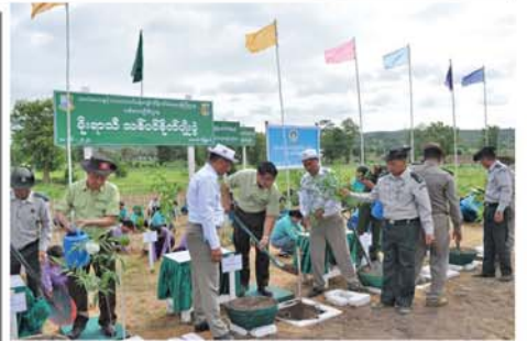
အောင်လံမြို့၌ မိုးရာသီသစ်ပင်စိုက်ပျိုးပွဲ ကျင်းပ