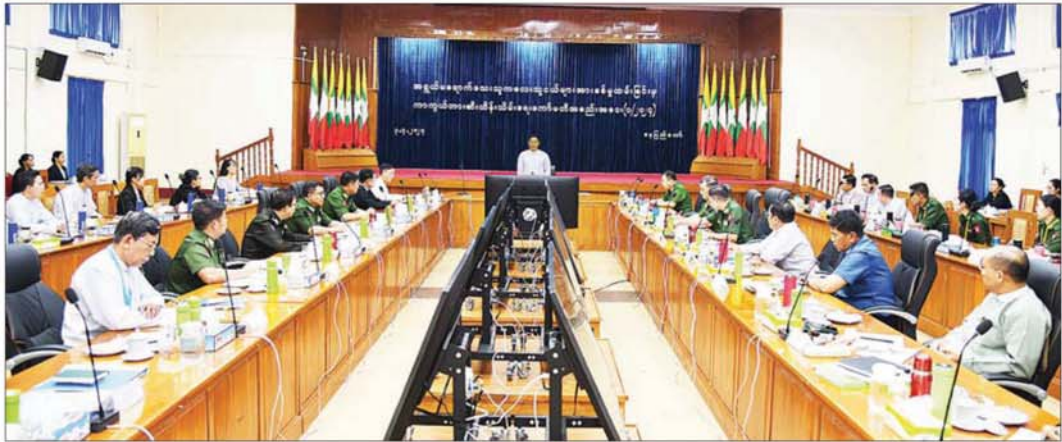
ပေးခဲ့ပြီးဖြစ်ကြောင်း။

ကုလသမဂ္ဂ အထွေထွေအတွင်းရေးမှူးချုပ်၏ အစီရင်ခံစာတွင် တပ်မတော် (ကြည်း) ပါဝင်နေခြင်းကို စာရင်းမှ ပယ်ဖျက်နိုင်ရန်အတွက် ပြည်ထောင်စု သမ္မတမြန်မာနိုင်ငံတော်အစိုးရနှင့် Country Task Force on Monitoring and Reporting (CTFMR) တို့အကြား အရွယ်မရောက်သေးသူ ကလေးသူငယ်များအား စစ်မှုထမ်းခြင်းမှ ကာကွယ်တားဆီးထိန်းသိမ်းရေးဆိုင်ရာ လုပ်ငန်းစီမံချက် Plan of Action ကို ၂၀၁၂ ခုနှစ် ဇွန် ၂၇ ရက်တွင် လက်မှတ်ရေးထိုးပြီး ပူးပေါင်းဆောင်ရွက်ခဲ့ပါကြောင်း၊ စီမံချက်အရ CTFMR နှင့် ပူးပေါင်းပြီး အရွယ်မရောက်သေးမီ မှားယွင်းစုဆောင်းခဲ့သည့် အသက်မပြည့်စစ်သည် ၁၀၅၇ ဦးကို တပ်မတော်မှ နုတ်ထွက်ခွင့်ပြုကာ တပ်မတော်နှင့် UNCTFMR ပူးပေါင်းအဖွဲ့ဖြင့် မိဘအုပ်ထိန်းသူများထံ စနစ်တကျ ပြန်လည်လွှဲပြောင်း