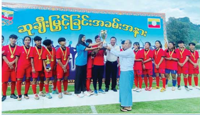
၂၀၂၄ ခုနှစ် ရှမ်းပြည်နယ်အစိုးရအဖွဲ့ ပြည်နယ်ဝန်ကြီးချုပ်ဖလား၊ မြို့နယ်ပေါင်းစုံ အသက်(၂၅)နှစ်အောက် အမျိုးသမီးဘောလုံးပြိုင်ပွဲ ဆုချီးမြှင့်

တောင်ကြီး ဇူလိုင် ၃ ရှမ်းပြည်နယ်(တောင်ပိုင်း)၊ တောင်ကြီးမြို့၊ သစ်တောရပ်ကွက်ရှိ ပြည်နယ်အားကစားကွင်း၌ ဇူလိုင် ၂ ရက် ညနေ ၃ နာရီက ၂၀၂၄ ခုနှစ်၊ ရှမ်းပြည်နယ်အစိုးရအဖွဲ့ ပြည်နယ်ဝန်ကြီးချုပ်ဖလား၊ မြို့နယ်ပေါင်းစုံ အသက်(၂၅)နှစ်အောက် အမျိုးသမီးဘောလုံးပြိုင်ပွဲ ဆုချီးမြှင့်ပွဲ ကျင်းပသည်။