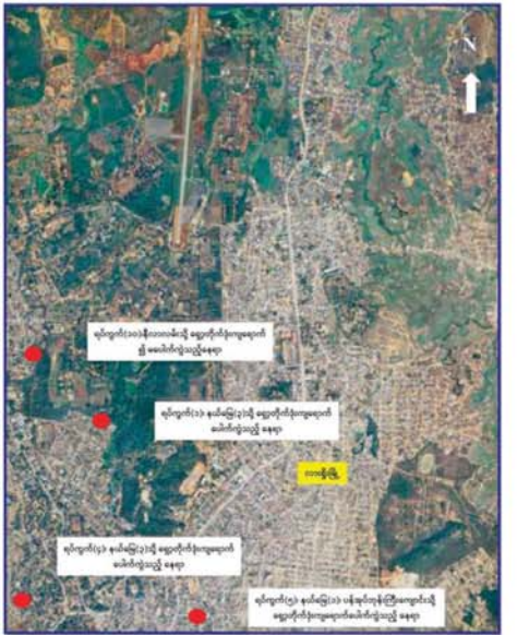
အကြမ်းဖက်သောင်းကျန်းသူများက လားရှိုးမြို့အတွင်းသို့ ရှေ့တိုက်ခံများဖြင့် ပစ်ခတ်တိုက်ခိုက်ခဲ့သည့် ဖြစ်စဉ်မြေပုံ။

သိရှိရသဖြင့် လုံခြုံရေးတပ်ဖွဲ့ဝင် များနှင့် ပရဟိတအသင်းအဖွဲ့များ က ဆေးဝါးကုသမှုများခံယူရန် အတွက် လားရှိုးမြို့ ပြည်သူ့ဆေးရုံ သို့ ပို့ဆောင်ပေးခဲ့ကြောင်း သိရ သည်။ အကြမ်းဖက် သောင်းကျန်းသူ များ၏ ယခုကဲ့သို့ စစ်ရေးနှင့် မသက်ဆိုင်ဘဲ အေးချမ်းစွာ နေထိုင်လျက်ရှိသည့် ဒေသခံ ပြည်သူများ၏ မြို့ရွာများအတွင်း သို့ အသက်အန္တရာယ် ထိခိုက် သေကျေသည်အထိ စက်ဆုပ်ရွံရှာ ဖွယ် ပစ်ခတ်တိုက်ခိုက်ခဲ့မှုသည် စစ်ရာဇဝတ်မှု (War Crime) ကို ကျူးလွန်ခြင်းဖြစ်ပြီး အဆိုပါ အကြမ်းဖက် သောင်းကျန်းသူများ အား ချေမှုန်းနိုင်ရေး လုံခြုံရေး တပ်ဖွဲ့ဝင်များက အကြမ်းဖက် ချေမှုန်းရေးစစ်ဆင်ရေး (Counter