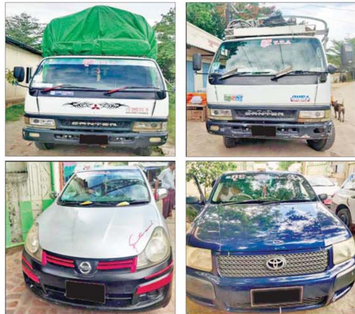
တောင်သာ-နွားထိုးကြီး ကားလမ်းတွင် PDF အမည်ခံ အကြမ်းဖက်သမားများက လုယက် ယူဆောင်သွားသည့် ပိုင် TTA ခရီးသည်နှင့် ကုန်စည်ပို့ဆောင်ရေးယာဉ်လိုင်စင်မှ ယာဉ်များ မှတ်တမ်းဓာတ်ပုံ။

နေပြည်တော် ဇူလိုင် ၃ မန္တလေး တိုင်းဒေသကြီး တောင်သာမြို့နယ် ရန်ကင်း သာစည်ကျေးရွာနှင့် နွားထိုးကြီး မြို့နယ် ရွှေကြာအင်းကျေးရွာ အကြား၌ ဇူလိုင် ၂ ရက်တွင် PDF အမည်ခံ အကြမ်းဖက်သမားများ က ယာဉ်သုံးစီးဖြင့် ရောက်ရှိလာ ပြီး တောင်သာ-နွားထိုးကြီးသွား ကားလမ်းအတိုင်း သွားလာနေ သည့် ခရီးသွားယာဉ်များအား တားဆီးစစ်ဆေးပြီး ယာဉ် ၁၁ စီး အား လုယက်မောင်းနှင်သွား ကြောင်း သိရသည်။