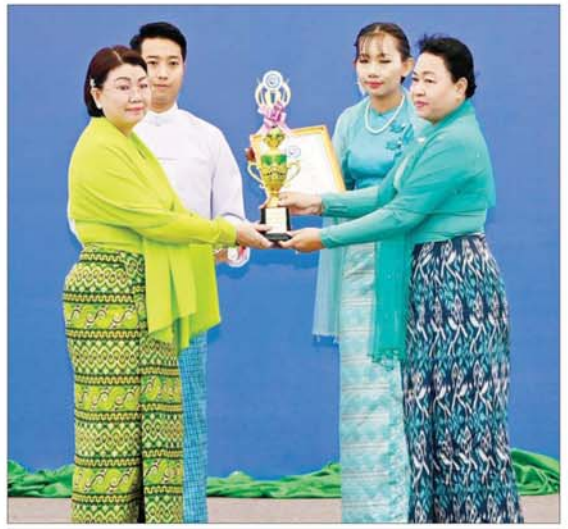
နိုင်ငံတော်စီမံအုပ်ချုပ်ရေးကောင်စီ တွဲဖက်အတွင်းရေးမှူး၏ ဇနီးက အမျိုးသမီး စီးပွားရေးစွမ်းဆောင်ရည်ဆုရရှိသူအား ဂုဏ်ပြုဆုတံဆိပ်၊ ဂုဏ်ပြုမှတ်တမ်းလွှာနှင့် ဂုဏ်ပြုဆုငွေများ ပေးအပ်ချီးမြှင့်စဉ်။

ဖျော်ဖြေတင်ဆက်ကြသည်။ နိုင်ငံတော်စီမံအုပ်ချုပ်ရေးကောင်စီဥက္ကဋ္ဌ ယင်းနောက် မြန်မာနိုင်ငံ အမျိုးသမီး နိုင်ငံတော်ဝန်ကြီးချုပ်၏ ဇနီးသည် ရေးရာအဖွဲ့ချုပ် ဂုဏ်ထူးဆောင်နာယက အခမ်းအနားသို့ တက်ရောက်လာကြသူ များနှင့်အတူ စုပေါင်းမှတ်တမ်းတင် ပြသထားသည့် ထုတ်ကုန်ပစ္စည်းများကို ဓာတ်ပုံရိုက်ပြီး ၂၀၂၄ ခုနှစ် မြန်မာအမျိုး ကြည့်ရှုလေ့လာအားပေးခဲ့ကြောင်း သိရ သမီးများနေ့အထိမ်းအမှတ် ခင်းကျင်း သည်။ သတင်းစဉ်