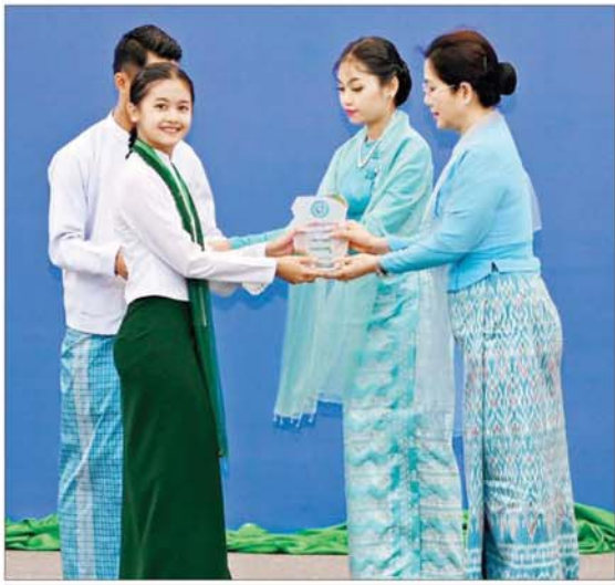
နိုင်ငံတော်စီမံအုပ်ချုပ်ရေးကောင်စီအတွင်းရေးမှူး၏ ဇနီးက ၂၀၂၄ ခုနှစ် မြန်မာ အမျိုးသမီးများနေ့ အထိမ်းအမှတ် အခြေခံပညာအထက်တန်းအဆင့် စာစီစာကုံး ပြိုင်ပွဲတွင် ပထမဆုရရှိသူအား ဂုဏ်ပြုဆုတံဆိပ်၊ ဂုဏ်ပြုမှတ်တမ်းလွှာနှင့် ဂုဏ်ပြု ဆုငွေများ ပေးအပ်ချီးမြှင့်စဉ်။