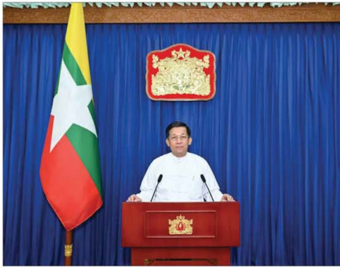
နိုင်ငံတော်စီမံအုပ်ချုပ်ရေးကောင်စီဥက္ကဋ္ဌ နိုင်ငံတော်ဝန်ကြီးချုပ် ဗိုလ်ချုပ်မှူးကြီး မင်းအောင်လှိုင် မြန်မာအမျိုးသမီးများနေ့အခမ်းအနားတွင် Video Message ဖြင့် မိန့်ခွန်းပြောကြားစဉ်။

အားလုံးမင်္ဂလာပါ ဒီနေ့ကျင်းပပြုလုပ်တဲ့ ၂၀၂၄ ခုနှစ်၊ မြန်မာ အမျိုးသမီးများနေ့ အခမ်းအနားကို တက်ရောက် လာကြတဲ့ ဧည့်သည်တော်များအားလုံး စိတ်၏ ချမ်းသာခြင်း၊ ကိုယ်၏ကျန်းမာခြင်းနဲ့ ပြည့်စုံကြ ပါစေ၊ ကျက်သရေမင်္ဂလာပေါင်းနဲ့လည်း ပြည့်စုံ ကြပါစေလို့ ပထမဦးစွာ နှုတ်ခွန်းဆက်သအပ်ပါ တယ်။