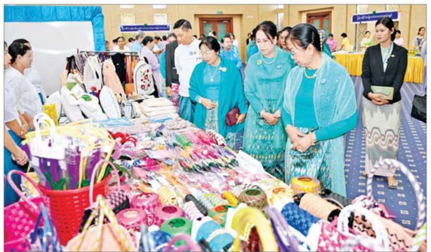
မြန်မာနိုင်ငံအမျိုးသမီးရေးရာအဖွဲ့ချုပ် ဂုဏ်ထူးဆောင်နာယက နိုင်ငံတော်စီမံအုပ်ချုပ်ရေးကောင်စီဥက္ကဋ္ဌ နိုင်ငံတော်ဝန်ကြီးချုပ်၏ဇနီး ဒေါ်ကြူကြူလှနှင့် အခမ်းအနားတက်ရောက်လာကြသူများ မြန်မာအမျိုးသမီးများနေ့အထိမ်းအမှတ် ခင်းကျင်းပြသထားသည့် ထုတ်ကုန်ပစ္စည်းများကို ကြည့်ရှုလေ့လာအားပေးစဉ်။

(နိုင်ငံတော်စီမံအုပ်ချုပ်ရေးကောင်စီ ဥက္ကဋ္ဌ နိုင်ငံတော်ဝန်ကြီးချုပ် ဒိုလ်ချုပ် မျိုးကြီး မင်းအောင်လှိုင်၏ အဖွင့်မိန့်ခွန်းကို စာမျက်နှာ ၃ တွင် ဖော်ပြထားပါသည်။) ရှင်းလင်းတင်ပြ ထိုနောက် မြန်မာနိုင်ငံလုံးဆိုင်ရာ အမျိုးသမီးကော်မတီဥက္ကဋ္ဌ လူမှုဝန်ထမ်း၊ ကယ်ဆယ်ရေးနှင့် ပြန်လည်နေရာချထားရေးဝန်ကြီးဌာန ပြည်ထောင်စုဝန်ကြီး ဒေါက်တာစိုးဝင်းက အမျိုးသမီးများ ဖွံ့ဖြိုးတိုးတက်ရေး၊ အမျိုးသမီးအခွင့်အရေး မြှင့်တင်ဖော်ဆောင်ရေးနှင့် အမျိုးသမီးများအပေါ် အကြမ်းဖက်မှု တုံ့ပြန်တားဆီးကာကွယ်ရေးဆိုင်ရာ ဆောင်ရွက်ချက်များကို ရှင်းလင်းတင်ပြသည်။