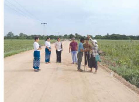
ဗလင်းတန်ဖွံ့ဖြိုးဖို့ စာအုပ် စာပေ လေ့လာစို့။

၂၀၂၄-၂၀၂၅ ဘဏ္ဍာနှစ်တွင် ပြည်ထောင်စုခွင့်ပြုငွေနှင့် တိုင်း ဒေသကြီးခွင့်ပြုငွေ(ငွေလုံးငွေရင်း) ငွေကျပ် ၁၅၄၃၁၀၀ ၂၂၅၁၁၁၀ ဖြင့် ကျေးလက်လမ်း(၉)လမ်း၊ Box Culvert နှင့်ရေကျော် အပါ အဝင် စုစုပေါင်းလုပ်ငန်း၁၃ခုအား ဆောင်ရွက်သွားမည်ဖြစ်ကြောင်း သိရသည်။ ခရိုင်ပြန်ဆက်(ကျောက်ဆည်) * * * * *