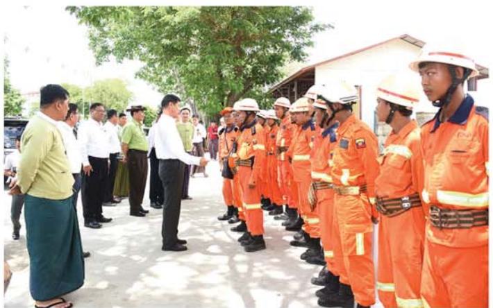
တွင် ရပ်ကွက်များအတွင်း ရေဝပ်ရေလုံခြုံပေါ်မှုများ လျော့နည်းရေးအတွက် ရေဆိုးစုပ်ထုတ်စက်ရုံ ၉ ခုမှ စုပ်ထုတ်ပေးမှုအခြေအနေနှင့် စက်များကြွေခိုင့်မှုရှိစေရန် ကြိုတင်ပြင်ဆင်ဆောင်ရွက်ထားမှု အခြေအနေများကို လိုက်ပါရှင်းလင်းပြသရာ တိုင်းဒေသကြီးဝန်ကြီးချုပ်က လိုအပ်သည်များကို ဖြည့်ဆည်းဆောင်ရွက်ပေးခဲ့ကြောင်း သိရသည်။ (မန္တလေးနေ့စဉ်)

၎င်းနောက် တိုင်းဒေသကြီးဝန်ကြီးချုပ်နှင့်အဖွဲ့သည် အမရပူရခရိုင်အတွင်းရှိ မန္တလေးမြို့တော်စည်ပင်သာယာရေးကော်မတီ၊ ရေဆိုးစုပ်ထုတ်စက်ရုံ အမှတ်(၂)(ရွှေခဲ)သို့ ရောက်ရှိပြီး ဧရာဝတီမြစ်အတွင်း သို့ စုပ်ထုတ်နေမှုများကိုကြည့်ရှုရာ စည်ပင်သာယာရေးဝန်ကြီးနှင့် တာဝန်ရှိသူများက တိုးတင်းကာလ