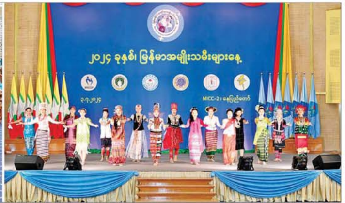
မြန်မာနိုင်ငံအမျိုးသမီးရေးရာအဖွဲ့ချုပ် ဂုဏ်ထူးဆောင်နာယက နိုင်ငံတော်စီမံအုပ်ချုပ်ရေးကောင်စီဥက္ကဋ္ဌ နိုင်ငံတော်ဝန်ကြီးချုပ်၏ဇနီး ဒေါ်ကြူကြူလှနှင့် အခမ်းအနားတက်ရောက်လာကြသူများ တိုင်းရင်းသားအကဖြင့် ဖျော်ဖြေတင်ဆက်မှုကို ကြည့်ရှုအားပေးစဉ်။