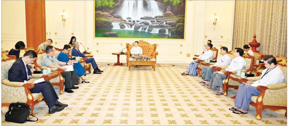
နိုင်ငံတော်စီမံအုပ်ချုပ်ရေးကောင်စီဒုတိယဥက္ကဋ္ဌ ဒုတိယဝန်ကြီးချုပ် ဒုတိယဗိုလ်ချုပ်မှူးကြီးစိုးဝင်း မြန်မာနိုင်ငံဆိုင်ရာ တရုတ်ပြည်သူ့သမ္မတနိုင်ငံ သံအမတ်ကြီး H.E. Mr. Chen Hai အား လက်ခံတွေ့ဆုံစဉ်။

နေပြည်တော် ဇူလိုင် ၅ နိုင်ငံတော် စီမံအုပ်ချုပ်ရေး ကောင်စီဒုတိယဥက္ကဋ္ဌ ဒုတိယ ဝန်ကြီးချုပ် ဒုတိယဗိုလ်ချုပ်မှူးကြီး စိုးဝင်းသည် တာဝန်ပြီးဆုံး၍ မြန်မာနိုင်ငံဆိုင်ရာ တရုတ်ပြည်သူ့သမ္မတ နိုင်ငံ သံအမတ်ကြီး H.E. Mr. Chen Hai အား ယနေ့မွန်းလွဲပိုင်း တွင် နေပြည်တော်ရှိ နိုင်ငံတော် စီမံအုပ်ချုပ်ရေးကောင်စီဥက္ကဋ္ဌရုံး သံတမန်ဆောင် ဧည့်ခန်းမ၌ လက်ခံတွေ့ဆုံသည်။ အမြင်ချင်းဖလှယ်ဆွေးနွေး ထိုသို့တွေ့ဆုံရာတွင် မြန်မာ- တရုတ် နှစ်နိုင်ငံအကြား ချစ်ကြည် ရင်းနှီးမှု တိုးတက်ကောင်းမွန် လျက်ရှိမှုနှင့် အေးအတူပုအမျှ ပူးပေါင်းဆောင်ရွက်မှုကဏ္ဍ အပါ အဝင် ဘက်စုံပဟာဗျူဟာမြောက် စာမျက်နှာ ၇ သို့ □