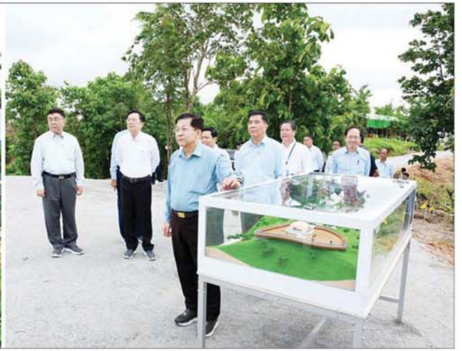
နိုင်ငံတော်စီမံအုပ်ချုပ်ရေးကောင်စီဥက္ကဋ္ဌ နိုင်ငံတော်ဝန်ကြီးချုပ် ဗိုလ်ချုပ်မှူးကြီးမင်းအောင်လှိုင် Naypyitaw State Polytechnic University ပရိဝုဏ်အတွင်းရှိ ရှုခင်းသာရင်ပြင်နေရာ ဆောင်ရွက်ထားရှိမှုကို ကြည့်ရှုစစ်ဆေးစဉ်။