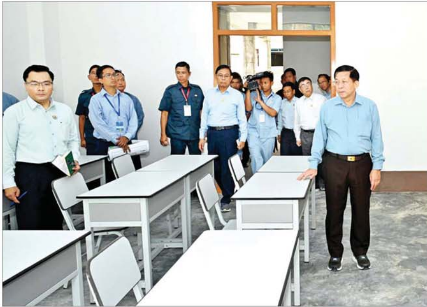
နိုင်ငံတော်စီမံအုပ်ချုပ်ရေးကောင်စီဥက္ကဋ္ဌ နိုင်ငံတော်ဝန်ကြီးချုပ် ဗိုလ်ချုပ်မှူးကြီးမင်းအောင်လှိုင် Naypyitaw State Polytechnic University အတွင်း ကြည့်ရှုစစ်ဆေးစဉ်။

အင်ဂျင်နီယာပညာရပ်ကို စီမံပေး၊ ဓာတုဗေဒ၊ ဂေဟဗေဒ၊ ဘူမိဗေဒ၊ အဏုစီမံပေး၊ ဇလဗေဒ စသည့်ဘာသာရပ်များနှင့်ပေါင်းစပ်ပြီး လေ့လာသင်ယူရသည့် Environmental Engineering ဘာသာရပ်သည် ပတ်ဝန်းကျင်အရည်အသွေးများမြှင့်တင်ပေးရန်အတွက် အထူးအရေးပါသည့် ပညာရပ်အဖြစ် ကျယ်ပြန့်စွာ လေ့လာသင်ယူလာကြပြီဖြစ်ကြောင်း၊ သစ်တောကဏ္ဍတွင် မျိုးကောင်းမျိုးသန့်ပျိုးပင်များ ထုတ်လုပ်ရေး၊ ရေဝေရေလဲဒေသစီမံအုပ်ချုပ်ရေး၊ သစ်ပင်သစ်တောများနှင့် စီမံချိုးကွဲမှုထိန်းသိမ်းရေး၊ ရေနှင့် မြေဆီလွှာထိန်းသိမ်းရေး စသည့် လုပ်ငန်းနယ်ပယ်များတွင် Environmental Engineering ပညာသည် အရေးပါသည့်အခန်းကဏ္ဍမှ ပါဝင်လျက်ရှိကြောင်း။