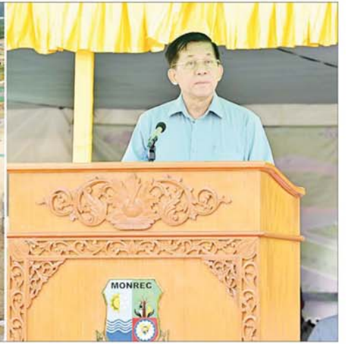
နိုင်ငံတော်စီမံအုပ်ချုပ်ရေးကောင်စီဥက္ကဋ္ဌ နိုင်ငံတော်ဝန်ကြီးချုပ် ဗိုလ်ချုပ်မှူးကြီး မင်းအောင်လှိုင် ပြည်ထောင်စုနယ်မြေ နေပြည်တော် ၂၀၂၄ ခုနှစ် ဒုတိယအကြိမ် မိုးရာသီသစ်ပင်စိုက်ပျိုးပွဲတွင် အမှာစကား ပြောကြားစဉ်။