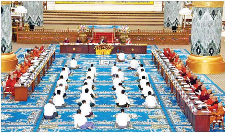
အဋ္ဌမအကြိမ် နိုင်ငံတော်သံဃမဟာနာယကအဖွဲ့ ၄၇ ပါးစုံညီ သတ္တရသမအစည်းအဝေး ပထမနေ့ ကျင်းပစဉ်။