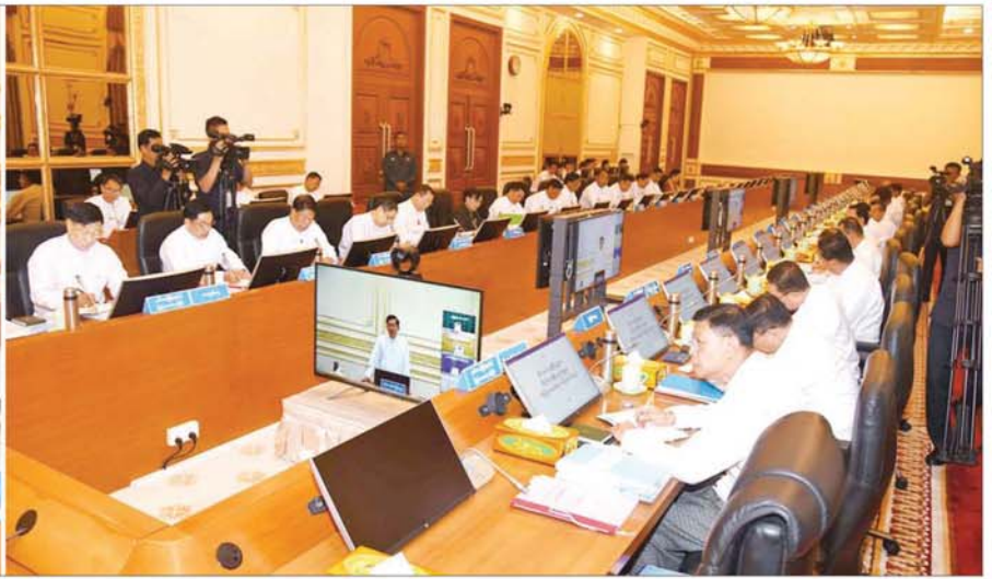
နိုင်ငံတော်စီမံအုပ်ချုပ်ရေးကောင်စီဥက္ကဋ္ဌ နိုင်ငံတော်ဝန်ကြီးချုပ် ဗိုလ်ချုပ်မှူးကြီး မင်းအောင်လှိုင် ပြည်ထောင်စုအစိုးရအဖွဲ့အစည်းအဝေးအမှတ်စဉ်(၅/၂၀၂၄) တွင် အမှာစကားပြောကြားစဉ်။