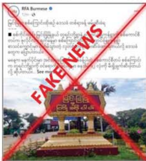
ရည်ရွယ်ချက်ရှိရှိ လုပ်ကြံရေးသားထားခြင်းသာဖြစ်ပြီး ကျောင်းဖြူကန်ကျေးရွာမှ ဒေသခံ

ပြည်သူများကို ဖမ်းဆီးခြင်းမရှိကြောင်းနှင့် တူရင်းတို့ကျေးရွာတွင်လည်း မည်သည့် မီးလောင်လျက်စီးမှု ဖြစ်ပွားခြင်းမရှိကြောင်း လုံခြုံရေးတာဝန်ရှိသူတစ်ဦး၏ အပြောကြားချက်အရ သိရှိရသည်။ တရားမဝင် ပြည်ဖျက်မီဒီယာများသည် နယ်မြေလုံခြုံရေး ဆောင်ရွက်လျက်ရှိသည့် လုံခြုံရေးတပ်ဖွဲ့ဝင်များအပေါ် ပြည်သူများအထင်အမြင်လွှဲမှားစေရန်အတွက် ဖြစ်စဉ်ဖြစ်ရပ်များအပေါ် အခြေခံရေးသားထားသည့် သတင်းတု၊ သတင်းအမှားများကို လူမှုကွန်ရက်စာမျက်နှာများမှတစ်ဆင့် လှုံ့ဆော်ရေးသားဝါဒဖြန့်ဝေနေခြင်းသာဖြစ်ကြောင်း သိရသည်။ သတင်းစဉ်