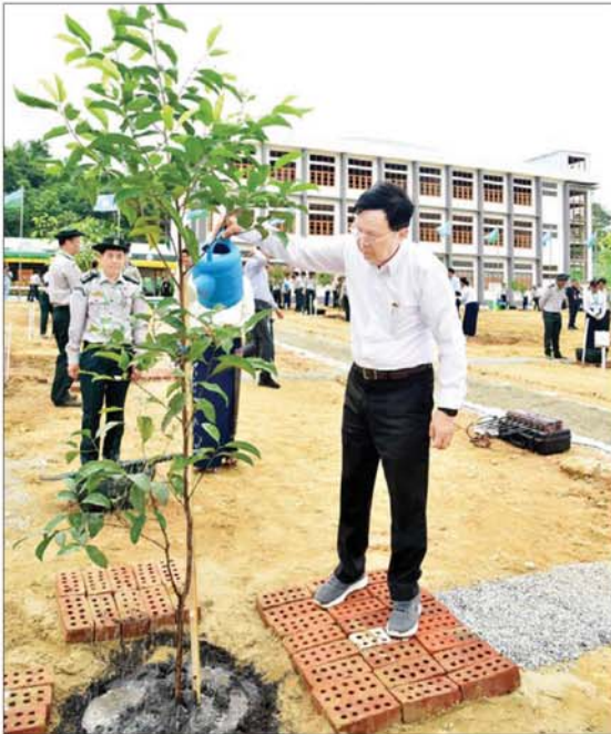
နိုင်ငံတော်စီမံအုပ်ချုပ်ရေးကောင်စီအတွင်းရေးမှူး ဒုတိယဗိုလ်ချုပ်ကြီး အောင်လင်းဌေး ပျိုးပင်ကိုစိုက်ပျိုးပေးစဉ်။

နေပြည်တော်နည်းပညာတက္ကသိုလ် တစ်ခုတည်းဖြင့် ပြည့်စုံလုံလောက်မှု မရှိဟု ယူဆသည့်အတွက် Naypyitaw State Polytechnic University အသစ် တည်ဆောက်ဖွင့်လှစ်ရန် စီမံဆောင်ရွက် ခဲ့ခြင်းဖြစ်ကြောင်း၊ မြင်တွေ့ရသည့်အတိုင်း လာမည့်ပညာသင်နှစ်တွင် Naypyitaw State Polytechnic University အဖြစ် အင်ဂျင်နီယာ ဘာသာရပ်များအပြင် ကွန်ပျူတာသိပ္ပံနှင့် ကွန်ပျူတာနည်းပညာ ဘာသာရပ်များကိုပါ တိုးချဲ့သင်ကြားနိုင် ရေး လိုအပ်သည်များကို ကြိုတင်ပြင်ဆင်