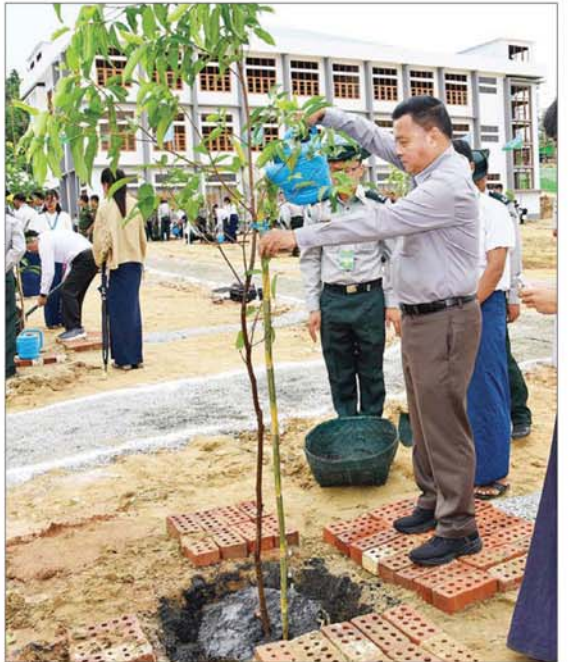
နိုင်ငံတော်စီမံအုပ်ချုပ်ရေးကောင်စီတွဲဖက်အတွင်းရေးမှူး ဒုတိယဗိုလ်ချုပ်ကြီး ရဲဝင်းဦး ပျိုးပင်ကိုစိုက်ပျိုးပေးစဉ်။

ဆောင်ရွက်လျက်ရှိကြောင်း။ စိတ်လက်ကြည်လင်ပြီး အေးချမ်း ထုံကြောင့်လည်း ယခုကဲ့သို့ဂုဏ်ယူ ပျော်ရွှင်စွာ အနားယူအပန်းဖြေနိုင်စေရေး၊ ရာသီဥတုသာယာမျှတစေရေး၊ သစ်ပင် တက္ကသိုလ်များ၏ အင်အားစိုက်ပျိုး ပြုစုထိန်းသိမ်းရေး စီမံလမ်းစဉ်ဖြင့် သာယာလှပသည့် ပရဝဏ်ဖြစ်စေရေး၊ ကျောင်းသား ကျောင်းသူများ ဆရာ ဆရာမများ