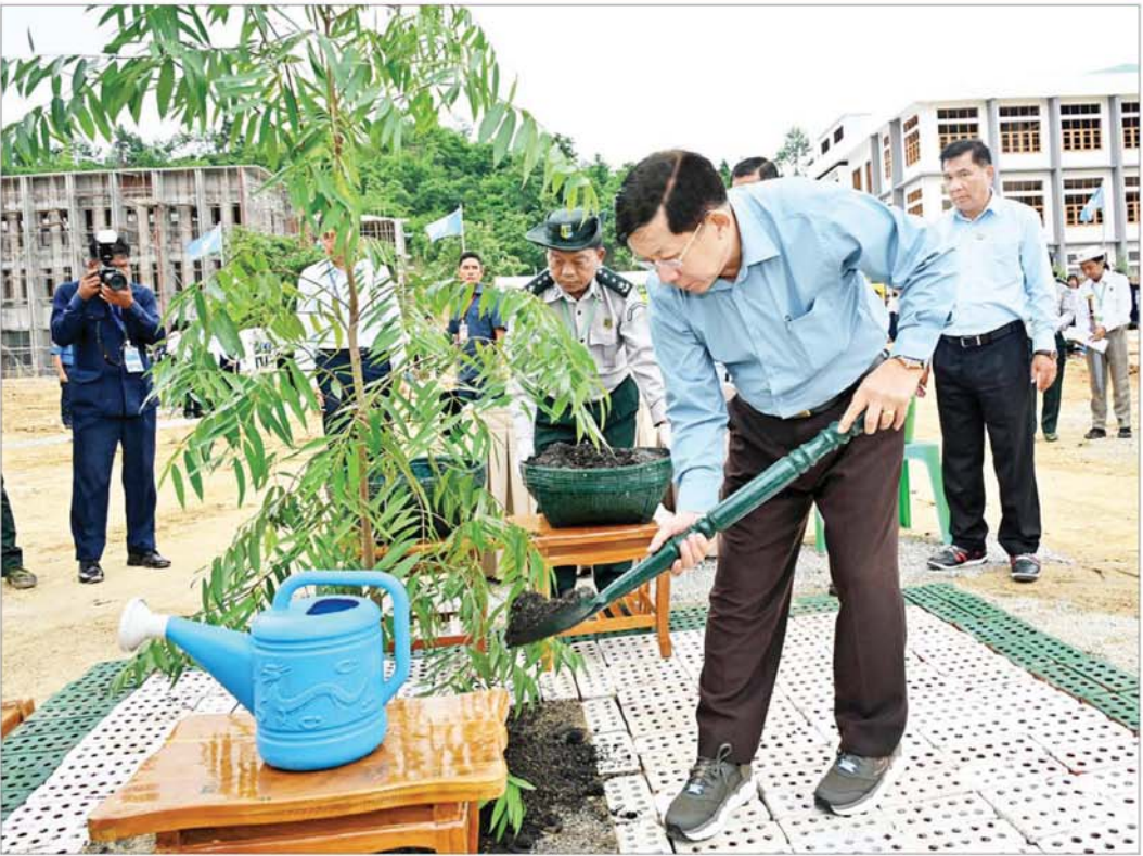
နိုင်ငံတော်စီမံအုပ်ချုပ်ရေးကောင်စီဥက္ကဋ္ဌ နိုင်ငံတော်ဝန်ကြီးချုပ် ဗိုလ်ချုပ်မှူးကြီး မင်းအောင်လှိုင် ကံကော်ပျိုးပင်ကို ဦးဆောင်စိုက်ပျိုးပေးစဉ်။

အခမ်းအနားသို့ နိုင်ငံတော်စီမံအုပ်ချုပ်ရေးကောင်စီဥက္ကဋ္ဌ နိုင်ငံတော်ဝန်ကြီးချုပ် ဗိုလ်ချုပ်မှူးကြီး မင်းအောင်လှိုင်နှင့်အတူ ကောင်စီအတွင်းရေးမှူး၊ တွဲဖက်အတွင်းရေးမှူး၊ ကောင်စီအဖွဲ့ဝင်များ၊ ပြည်ထောင်စုအဆင့်ပုဂ္ဂိုလ်များနှင့် ပြည်ထောင်စုဝန်ကြီးများ၊ နေပြည်တော်ကောင်စီဥက္ကဋ္ဌ၊ ကာကွယ်ရေးဦးစီးချုပ်ရုံးမှ အဆင့်မြင့် တပ်မတော်အရာရှိကြီးများ၊ နေပြည်တော်တိုင်းစစ်ဌာနချုပ်တိုင်းမှူး၊ ဒုတိယဝန်ကြီးများနှင့် ဝန်ကြီးဌာနများမှဌာနဆိုင်ရာအရာထမ်း၊ စာမျက်နှာ ၃ သို့ ✽