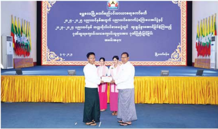
မန္တလေး ရလိုင် ၅

မန္တလေးမြို့တော်စည်ပင်သာယာရေးကော်မတီ (၂၀၂၄-၂၀၂၅) ပညာသင်နှစ် အတွက် မိသားစုဝင် ဝန်ထမ်း သား၊ သမီးများအား ပညာသင်ထောက်ပံ့ကြေးပေးအပ်ပွဲနှင့် (၂၀၂၄-၂၀၂၅) ပညာသင်နှစ် အတွက် ထူးချွန်စွာအောင်မြင်ခဲ့ကြသည့် ဂုဏ်ထူးရ ကျောင်းသား၊ ကျောင်းသူများအား ဂုဏ်ပြုချီးမြှင့်ခြင်းအခမ်းအနားကို ဇူလိုင်လ ၅ ရက်နေ့ နံနက် ၉ နာရီက မြို့တော်ခန်းမ၌ ကျင်းပသည်။