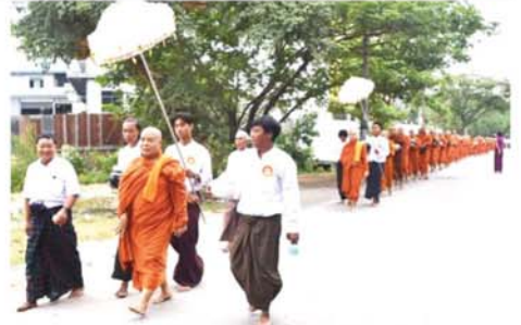
နန်းဦးလွင်ကျေးရွာသာမက ကန် ၁၀၀၊ အခြားလှူဖွယ်ဝတ္ထုများနှင့် ၀တ္ထုငွေကျပ် သိန်း ၇၀ ခန့် လှူ ဒါန်းခဲ့ကြကြောင်း သိရသည်။ (အပေါ်ပုံ) (၀၄၁)

မန္တလေး ဇူလိုင် ၇ မန္တလေးပုသိမ်ကြီးမြို့နယ်၊ နန်းဦးလွင်ကျေးရွာတွင် ဇူလိုင် ၅ ရက် နံနက်က ဆွမ်းဆန်စိမ်း လောင်းလှူပွဲ ကျင်းပခဲ့သည်။ နန်းဦးလွင်ကျေးရွာ လူမှု ကူညီရေးအသင်းမှ ဦးဆောင်၍ ရန်ကင်းတောင်ခြေဥယျာဉ်ပရိယတ္တိစာသင်တိုက်မှ သံဃာတော် များအတွက် နှစ်စဉ်ပျက် ဆွမ်း ဆန်စိမ်းလောင်းလှူခဲ့ သည်မှာ (၂၉) ကြိမ်ရှိပြီဖြစ်သည်။ နံနက် ၇ နာရီတွင် ငြိမ်းချမ်းရေးတက္ကသိုလ် ပါမောက္ခချုပ် ဆရာတော်ကြီး ဦးဆောင်ပြီး ဥယျာဉ်စာသင်တိုက် ပဓာန နာယက ဆရာတော်နှင့် စာချ၊ စာသင်သံဃာတော်အပါး ၃၀၀ ကျော် ကြွရောက်၍ အလှူ ခံတော်မူကြသည်။ ကျေးရွာသူ၊ ကျေးရွာသားများက ဆွမ်းဆန် တော်နှင့် လှူဖွယ်များလှူဒါန်းကြ ပြီး အချိန်အအေးတို့ဖြင့် သံဃာ တော်များအား ကုသိုလ်ပြုကြ သည်။ ဥယျာဉ်စာသင်တိုက် တည်ထောင်စကတည်းက နှစ်စဉ် မပျက်လောင်းလှူခဲ့ခြင်းဖြစ်သည်။