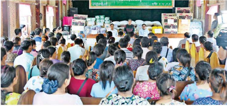
နိုင်ငံတော် စီမံအုပ်ချုပ်ရေးကောင်စီအဖွဲ့ဝင် ဒေါ်ဒွဲဘူ မြစ်ကြီးနားမြို့ နောင်နန်း(၈) မိုင် AG အသင်းတော်၌ ဖွင့်လှစ်ထားသည့် နေရပ်စွန့်ခွာစခန်းသို့ သွားရောက်အားပေးစကားပြောကြားစဉ်။

မြစ်ကြီးနား ဇူလိုင် ၇ နိုင်ငံတော် စီမံအုပ်ချုပ်ရေးကောင်စီအဖွဲ့ဝင် ဒေါ်ဒွဲဘူသည် လူမှုဝန်ထမ်း၊ ကယ်ဆယ်ရေးနှင့် ပြန်လည်နေရာချထားရေး ဝန်ကြီးဌာန ပြည်ထောင်စုဝန်ကြီး ဒေါက်တာစိုးဝင်း၊ ကချင်ပြည်နယ် ဝန်ကြီးချုပ် ဦးခက်ထိန်နန်း၊ တာဝန်ရှိသူများနှင့်အတူ ယနေ့ ဖွန်းလှိုင်တွင် မြစ်ကြီးနားမြို့ နောင်နန်း(၈)မိုင် AG အသင်းတော်၌ ဖွင့်လှစ်ထားသည့် နေရပ်စွန့်ခွာစခန်းသို့ ရောက်ရှိပြီး နိုင်ငံတော်အကြီးအကဲက လှူဒါန်းသည့် ကျား/မ ရုပ်အင်္ကျီများ၊ အမျိုးသားသဘာဝဘေးစီမံခန့်ခွဲမှုကော်မတီနှင့် ကချင်ပြည်နယ်အစိုးရအဖွဲ့ တို့က ထောက်ပံ့သည့် ငွေကျပ် ၉၄၀၀၀၀ တန်ဖိုးရှိ ဆန်အိတ် ၅၀၀ ငါးထောင့်လေးဖာ၊ ခေါက်ဆွဲခြောက် ၂၄၄ ဖာ၊ ဆီ ၁၀၀ သာယာပုံ ၂၀ နှင့် ရေသန့်ဘူးများ စသည့် အခြေခံ စားသောက်ကုန်များနှင့် လူမှုဝန်ထမ်း၊ ကယ်ဆယ်ရေးနှင့် ပြန်လည်နေရာချထားရေး ဝန်ကြီးဌာနက ထောက်ပံ့သည့် ငွေကျပ် ၂၇၆၀၀၀ တန်ဖိုးရှိ သွားတိုက်ဆေး၊ သွားတိုက်တံ၊ ဆပ်ပြာ စသည့် ထောက်ပံ့ရေးပစ္စည်းများ ပေးအပ်သည်။ ထို့နောက် နိုင်ငံတော်စီမံအုပ်ချုပ်ရေးကောင်စီ အဖွဲ့ဝင်နှင့် အဖွဲ့သည် ဘေးသင့်ပြည်သူများအား နိုင်ငံတော်အစိုးရ၏ နိုင်ငံတော် ဖွံ့ဖြိုးတိုးတက်ရေး