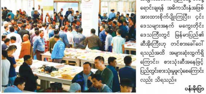
ဝန်းမိုးမြတ်