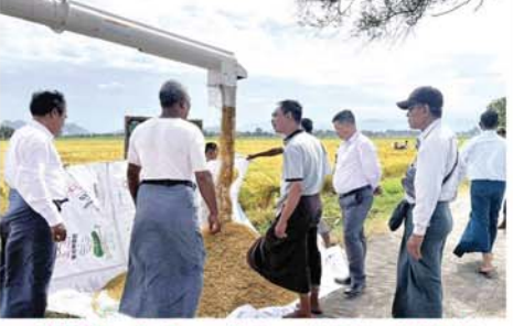
ပုသိမ်ကြီးမြို့နယ်တွင် နွေစပါး(ရွှေသွယ်ရင်)စံကွက်ရိတ်သိမ်း

ဆက်စပ်ပစ္စည်းများဝယ်ယူခြင်း၊ ဝန်ဆောင်မှုရယူခြင်းများဆောင် ရွက်သည့်အခါ အခွန်အမှတ် တံဆိပ်ကပ်နှံထားသော ပြေစာ များကို တောင်းခံခြင်းဖြင့် ဝိုင်းဝန်း ပူးပေါင်းဆောင်ရွက်ပေးရန် လိုအပ် ပြီး နိုင်ငံတော်အစိုးရအနေဖြင့် ကောက်ခံရရှိသည့် အခွန်ငွေများ ဖြင့် နိုင်ငံတော်ဖွံ့ဖြိုးတိုးတက်ရေး လုပ်ငန်းများတွင် ဆောင်ရွက်ပေး လျက်ရှိကြောင်း သိရသည်။ (မန္တလေးနေ့စဉ်-၉)