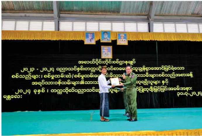
မန္တလေး၊ ဇူလိုင် ၃၁ - ထူးချွန်စွာအောင်မြင်ခဲ့သော စစ်မှုထမ်းဆဲ၊ စစ်မှုထမ်းဟောင်းနှင့် စစ်သည်(အစားခန့်)အရပ်သားဝန်ထမ်းများ၏ သား၊ သမီးများ၊ လူရည်ချွန်လူငယ်များနှင့် ၂၀၂၃-၂၀၂၄ ပညာသင်နှစ်အတွက် တက္ကသိုလ်ပညာသင်ဆုရရှိသူများအား ဂုဏ်ပြုဆုချီးမြှင့်ခြင်း အခမ်းအနား