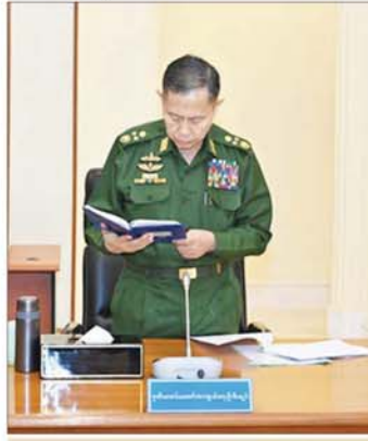
ဒုတိယတပ်မတော်ကာကွယ်ရေးဦးစီးချုပ် ကာကွယ်ရေးဦးစီးချုပ်(ကြည်း) ဒုတိယဗိုလ်ချုပ် ဖျာဖြင့် စိုးဝင်း ဆွေးနွေးတင်ပြစဉ်။

နိုင်ငံတော်စီမံအုပ်ချုပ်ရေးကောင်စီအနေဖြင့် ချမှတ်ထားသည့် ရှေ့လုပ်ငန်းစဉ်(၅)ရပ်နှင့် ဦးတည် ချက်(၉)ရပ်ကို တစ်စုံတစ်ရာ ဆက်လက်အကောင် အထည်ဖော် ဆောင်ရွက်သွားမည်ဖြစ်ကြောင်း။