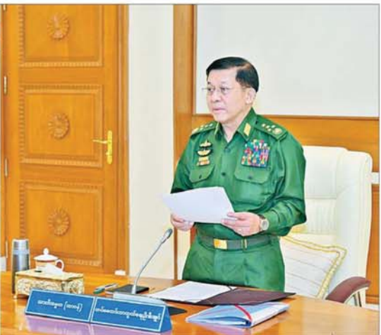
ပြည်ထောင်စုသမ္မတမြန်မာနိုင်ငံတော် အမျိုးသားကာကွယ်ရေးနှင့်လုံခြုံရေးကောင်စီအစည်းအဝေး(၂/၂၀၂၄) ကျင်းပစဉ်။