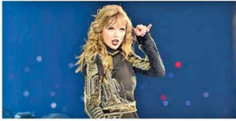
ပရိသတ်အချစ်တော် အဆိုတော် တေးလားဆွစ် အပါအဝင် ကမ္ဘာတစ်ဝန်း အနုပညာရှင်များကို ဂူဂဲလ်တွင် ရှာဖွေကြည့်ရှု

သုများပြားခဲ့သည်ဟု ဟောလိဝုဒ် အတ်ဒီတီတွင် ဖော်ပြသည်။ ၂၀၂၄ ခုနှစ် ပထမနှစ်ဝက် အတွင်း ကမ္ဘာတစ်ဝန်း ပရိသတ်များ စိတ်ဝင်စားခဲ့ရသည့် ကမ္ဘာ့ ကျော်အနုပညာရှင်များ ဂူဂဲလ်တွင် ရှာဖွေမှုအမြင့်ဆုံးစာရင်းကို ထုတ်ပြန်ကြေညာထားရာ တေးလားဆွစ်က ထိပ်ဆုံးဖြစ်ခဲ့သည်။ (SKY)