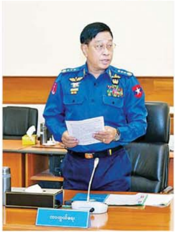
ပြည်ထောင်စုဝန်ကြီး ဦးလှိုင်အောင်စန်း တင်ပြဆွေးနွေးစဉ်။

မြန်မာနိုင်ငံတွင် မိုးပေါင်း ၁၅ သန်းနှင့် နွေပေါင်း နှစ်သန်းစိုက်ပျိုးထားကြောင်း၊ လယ်အနေဖြင့် နှစ်ရပ်ပေါင်း ၁၅ သန်းခန့် စိုက်ပျိုးထားသည့်အတွက် တစ်စက ပန်းတိုင် ရည်နှုန်းချက်တင်း ၁၀၀ ထွက်ပါက လူဦးရေ သန်း ၁၀၀ စာအတွက် ဝမ်းစာဖူလုံမှု ရှိကြောင်း၊ ယင်းသည် တစ်သီးသားဖြစ်ပြီး သီးထပ်စိုက်ပါက သန်း ၂၀၀ စာအတွက် ဖူလုံမှုရှိကြောင်း၊ ထို့ကြောင့် လယ်စိုက်ပျိုးခြင်းကပင် ဆန်ပိုလျှံမှု များစွာရှိပြီး ပြည်ပဝင်ငွေများစွာရရှိစေနိုင်မည်ဖြစ်