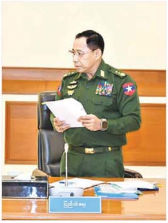
ပြည်ထောင်စုဝန်ကြီး ဒုတိယဗိုလ်ချုပ်ကြီး ရာပြည့် တင်ပြဆွေးနွေးစဉ်။

ဒီမိုကရေစီနှင့် ဖက်ဒရယ်စနစ်ကိုအခြေခံသော ပြည်ထောင်စုတည်ဆောက်ရေး ဖွဲ့စည်းပုံအခြေခံဥပဒေ (၂၀၀၈ ခုနှစ်) တွင်ပါရှိသည့် စီမံသလကဏ္ဍအများစုမှာ ပြည်ထောင်စု