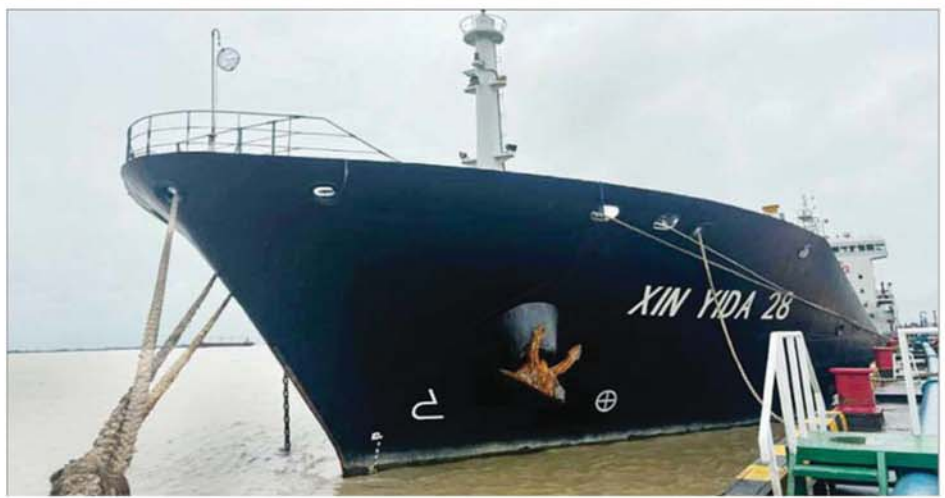
ဆောင်ရွက်ထားရှိပြီးဖြစ်သည်။ သို့ဖြစ်ပါ၍ အများပြည်သူများအနေဖြင့် မကြာမီစက်သုံးဆီပြတ်လပ်မည်ဆိုသည့် Online Media သတင်းများနှင့် ပြင်ပကလာဟာလသတင်းများကြောင့် စိုးရိမ်ကြောင့်ကြမ္မဖြင့် လိုအပ်သည်ထက် ပိုမိုဝယ်ယူခြင်း၊ သို့လှောင်ထားရှိခြင်း၊ ဈေးနှုန်းမြင့်တင်၍တစ်ဆင့် ပြန်လည်ရောင်းချခြင်းတို့ကို မပြုလုပ်ကြပါရန်၊ သုံးစွဲရန်လိုအပ်သည့် ပမာဏကိုသာ ဝယ်ယူသုံးစွဲကြပါရန်၊ အရောင်းဆိုင်များကိုလည်း စက်သုံးဆီရှိလျက် ရောင်းချပေးခြင်းမျိုး မပြုလုပ်ကြစေရေး စနစ်တကျစိစစ်ကြပ်မတ်လျက်ရှိကြောင်းနှင့် လက်ရှိအခြေအနေများအရ စက်သုံးဆီပြတ်လပ်နိုင်မှုမရှိနိုင်ကြောင်း သတင်းရရှိသည်။ သတင်းစဉ်

နေပြည်တော်၊ ဇူလိုင် ၃၁ - ဇူလိုင်လလယ်ခန့်မှစ၍ မိုးအဆက်မပြတ်ရွာသွန်းပြီး ဒေသအချို့တွင် ရေကြီးရေလျှံမှုများ ဖြစ်ပေါ်နေခြင်းကြောင့် စက်သုံးဆီတင်သွင်းသို့လှောင်ဖြန့်ဖြူးခြင်းလုပ်ငန်းများ ဆောင်ရွက်နေသည့် သီလဝါဆိပ်ကမ်းဒေသရှိ Terminal များ၏ ပုံမှန်လုပ်ငန်းဆောင်ရွက်မှုများ အနည်းငယ် နှောင့်နှေးကြန့်ကြာခြင်း၊ သယ်ယူပို့ဆောင်ရာတွင်လည်း လမ်းခရီးအခြေအနေများအရ အချို့ဒေသများသို့ ဆီတင်ယာဉ်ရောက်ရှိရန် အချိန်အနည်းငယ်ကြန့်ကြာခြင်းတို့ကြောင့် အရောင်းဆိုင်အချို့တွင် ဆီတင်ယာဉ်မရောက်မီ စက်သုံးဆီအမယ်အချို့ ယာယီပြတ်လပ်မှုဖြစ်ပေါ်စေရေး စနစ်တကျစိစစ်ထိန်းသိမ်းရောင်းချစေလျက်ရှိသည့်အပြင် လိုအပ်ပါက Urgent အစီအစဉ်ဖြင့် ဖြည့်တင်းပေးခြင်း၊ ရေကြီးရေလျှံမှုကြောင့် ယာယီပိတ်သိမ်းထားသော အရောင်းဆိုင်များသို့ ပေးပို့နေသည့် စက်သုံးဆီများအား လိုအပ်သည့် အရောင်းဆိုင်များသို့ ရွှေ့ပြောင်းချယူစေခြင်းများကိုလည်း စီစဉ်ဆောင်ရွက်လျက်ရှိသည်။ စက်သုံးဆီတင်သွင်းသို့လှောင်ဖြန့်ဖြူးခြင်းလုပ်ငန်းကြီးကြပ်ရေးကော်မတီအနေဖြင့် ပြည်တွင်းစက်သုံးဆီဖုလုံမှုရှိစေရန်နှင့် ပြတ်လပ်မှုမရှိစေရန်အတွက် သီလဝါဆိပ်ကမ်းဒေသရှိ သို့လှောင်ကန်စခန်းများ၌ ၂၀၂၄ ခုနှစ် ဩဂုတ်လ ဒုတိယပတ်ကုန်အထိ စက်သုံးဆီဖုလုံစွာသုံးစွဲနိုင်ရေး ကြိုတင်သို့လှောင်ဖြန့်ဖြူးလျက်ရှိပြီး ပြည်ပမှ စက်သုံးဆီတင်သင်္ဘောများ စဉ်ဆက်မပြတ်ဝင်ရောက်ရန် စီမံကြီးကြပ်