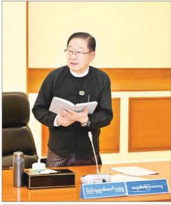
ပြည်သူ့လွှတ်တော်ဥက္ကဋ္ဌ ဦးတီခွန်မြတ် ဆွေးနွေးတင်ပြစဉ်။

ဖွဲ့စည်းပုံအခြေခံဥပဒေ ပုဒ်မ ၄၁၇ အရ အရေး ပေါ်အခြေအနေကြေညာမှု၊ ပုဒ်မ ၄၁၂ အရ အရေး ပေါ်အခြေအနေကြေညာမှု ယင်းနှစ်ခုကို ဆက်စပ် ကြည့်မည်ဆိုပါက အရေးပေါ်ကာလဖွဲ့ခြောက်သေး