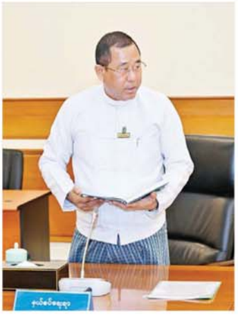
ပြည်ထောင်စုဝန်ကြီး ဒုတိယဗိုလ်ချုပ်ကြီး တွန်းထွန်းနောင် တင်ပြဆွေးနွေးစဉ်။

ပါတီနဲ့ဒီမိုကရေစီစနစ်ခိုင်မာစေရေး နိုင်ငံတော်စီမံအုပ်ချုပ်ရေးကောင်စီ၏ အန္တိမ ရည်မှန်းချက်သည် လွတ်လပ်၍ တရားမျှတသည့် ပါတီနဲ့ဒီမိုကရေစီ အထွေထွေရွေးကောက်ပွဲတစ်ရပ် ကျင်းပနိုင်ရေးပင်ဖြစ်ကြောင်း၊ မိမိတို့အနေဖြင့် ရွေးကောက်ပွဲတစ်ရပ် အောင်မြင်စွာကျင်းပနိုင်ရန် အတွက် ခိုင်လုံသည့်အခြေခံစာရင်းများ ရရှိရန်