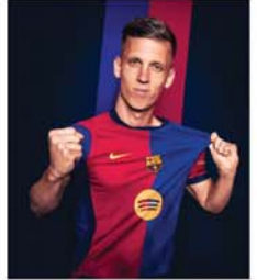
လိုနာအသင်းမှာ ကျောနံပါတ် ၂၀ ဂျာစီအား ဝတ်ဆင်ကစားသွားမှာပါ။ ကျွန်တော်ကို နွေးထွေးစွာ ကြိုဆိုတဲ့အသင်းတာဝန် ရှိသူအားလုံးကိုလည်း အထူးကျေးဇူးတင်ပါတယ်။ ဒီအသင်းကစားသမားသည် လက်ရှိဈေးကွက်အတွင်းတွင် လိုက်ပစစ်အသင်းမှ ဘာစီလိုနာအသင်းသို့ ယူရိုသန်း ၆၀ဖြင့် ဖြန့်စားချုပ်ချုပ်ဆိုကာ ပြောင်းရွှေ့ရောက်ရှိလာခြင်းဖြစ်သည်။ ဘာစီလိုနာအသင်းကလည်း အော်လီမိုအား စာချုပ်ဖျက်သိမ်းကြေး ယူရိုသန်း၅၀၀တန်စာချုပ်ပါ ထည့်သွင်းချုပ်ဆိုခဲ့သည်။ အသက် ၂၆ နှစ်အရွယ်ရှိ အော်လီမိုက 'ကျွန်တော် ဘာစီ

ဘာစီလိုနာ ဩဂုတ် ၁၀ လိုနာအသင်းမှာ ကျောနံပါတ် ၂၀ ဂျာစီအား ဝတ်ဆင်ကစားသွားမှာပါ။ ကျွန်တော်ကို နွေးထွေးစွာ ကြိုဆိုတဲ့အသင်းတာဝန် ရှိသူအားလုံးကိုလည်း အထူးကျေးဇူးတင်ပါတယ်။ ဒီအသင်းကစားသမားသည် လက်ရှိဈေးကွက်အတွင်းတွင် လိုက်ပစစ်အသင်းမှ ဘာစီလိုနာအသင်းသို့ ယူရိုသန်း ၆၀ဖြင့် ဖြန့်စားချုပ်ချုပ်ဆိုကာ ပြောင်းရွှေ့ရောက်ရှိလာခြင်းဖြစ်သည်။ ဘာစီလိုနာအသင်းကလည်း အော်လီမိုအား စာချုပ်ဖျက်သိမ်းကြေး ယူရိုသန်း၅၀၀တန်စာချုပ်ပါ ထည့်သွင်းချုပ်ဆိုခဲ့သည်။ အသက် ၂၆ နှစ်အရွယ်ရှိ အော်လီမိုက 'ကျွန်တော် ဘာစီ