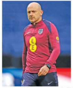
(FA)ထုတ်ပြန်ချက်တွင် 'နည်းပြကာစလေအင်္ဂလန်လက်ရွေးစင်အသင်း၏ ယာယီနည်းပြအဖြစ် ခန့်အပ်ခဲ့ပါသည်။ သူ့အနေနဲ့ လည်း လက်ရွေးစင်အသင်းကို ရလဒ်ကောင်းတွေ ရရှိအောင် စွမ်းဆောင်ပေးနိုင်လိမ့်မယ်လို့ ယုံကြည်ပါတယ်' ဟု ထုတ်ပြန်သည်။ (အပေါ်ပုံ)(NGB)

လန်ဒန် ဩဂုတ် ၁၀ အင်္ဂလန်ဘောလုံးအဖွဲ့ချုပ် (FA) သည် နည်းပြကာစလေအား အင်္ဂလန်လက်ရွေးစင်အသင်း၏ ယာယီနည်းပြအဖြစ် ခန့်အပ်ခဲ့ကြောင်း အတည်ပြုထုတ်ပြန်ကြေညာခဲ့သည်။ အဆိုပါ နည်းပြသည် အင်္ဂလန် ယူ-၂၁ အသင်းအား ၂၀၂၁ခုနှစ် ဇူလိုင်လက စတင်ကိုင်တွယ်ခဲ့ပြီး ဖြိုင်ပွဲ ၂၉၉ ပွဲတွင် ၂၃ ပွဲနိုင်၊ ၁ ပွဲ သရေ၊ ၅ ပွဲရှုံးရလဒ်ဖြင့် ရလဒ်ကောင်းများ ရရှိအောင် စွမ်းဆောင်ပေးနိုင်ခဲ့ကြောင်း အင်္ဂလန်လက်ရွေးစင်အသင်းကြီး၏ ယာယီနည်းပြအဖြစ် ခန့်အပ်ခဲ့သည်။ အင်္ဂလန်ဘောလုံးအဖွဲ့ချုပ်