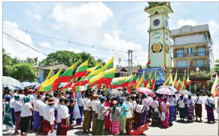
(အောင်ရမည်) ဗီဒီယိုများနှင့် CRPH၊ NUG၊ PDF၊ MNDAA၊ AA၊ TNLA တို့၏ အကြမ်းဖက်လုပ်ရပ်ဆန့်ကျင်ပွဲများကို အကြမ်းဖက်သောင်းကျန်းမှုများကို အကြမ်းဖက်သောင်းကျန်းမှုများကို ဆန့်ကျင်ရှုတ်ချဆန္ဒထုတ်ဖော်ပွဲကို ရုပ်သိမ်းခဲ့ကြောင်း သိရသည်။

ဘားအံ ဩဂုတ် ၁၀ MNDAA အကြမ်းဖက်သောင်းကျန်းသူအဖွဲ့၏ အကြမ်းဖက်လုပ်ရပ်များကို ဆန့်ကျင်ရှုတ်ချ ဆန္ဒထုတ်ဖော်ပွဲကို ယနေ့မနက်လွှဲပိုင်းက ဘားအံမြို့ အမှတ်(၃)ရပ်ကွက် ဗိုလ်ချုပ်လမ်း နာရီစင်၌ ဒေသခံပြည်သူများစုရုံး၍ ဆန္ဒထုတ်ဖော်ခဲ့ကြသည်။