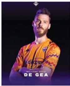
ကောင်းတွေ ရယူနိုင်ဖို့ အစွမ်းကုန်ကြိုးစားသွားမှာပါ ဟု ပြောသည်။ (အောက်ပုံ)(NGB)

တူရင် ဩဂုတ် ၁၀ ဖီအိုရင်တီးနားအသင်းသည် မန်ချက်စတာယူနိုက်တက်အသင်းနှင့်လမ်းခွဲပြီးနောက် အသင်းလက်မဲ့ဖြစ်နေသော ဂိုးသမားဒီဂီယာအား ခေါ်ယူခဲ့ကြောင်း အတည်ပြု ထုတ်ပြန်ကြေညာခဲ့သည်။ အဆိုပါ ဂိုးသမားသည် မန်ချက်စတာယူနိုက်တက်အသင်းနှင့်အတူ ၂၀၁၁-၂၀၁၂၊ ၂၀၁၂-၂၀၁၃ ဘောလုံးရာသီအထိ ကောင်းတွေ ရယူနိုင်ဖို့ အစွမ်းကုန်ကြိုးစားသွားမှာပါ ဟု ပြောသည်။ (အောက်ပုံ)(NGB)