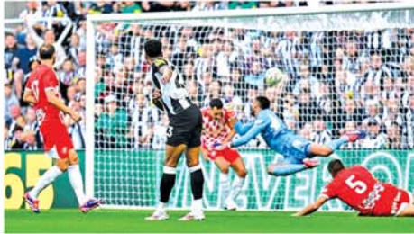
၂၀၂၄-၂၀၂၅ ဘောလုံးရာသီ ပရီးမီးယားလိဂ်အဖွင့်ပွဲစဉ်အဖြစ် လာမည့် ဩဂုတ် ၁၇ရက်တွင် ဆောက်သစ်တန်အသင်းနှင့် ယှဉ်ပြိုင်ကစားသွားရမည်ဖြစ်သည်။ (အပေါ်ပုံ)

လန်ဒန် ဩဂုတ် ၁၀ သည်။ နိုင်ငံတကာကလပ်အသင်းများ၏ ဘောလုံးခြေစမ်းပွဲစဉ်အဖြစ် ယနေ့နံနက်ပိုင်းက နယူးကာဆယ် အသင်းနှင့်ဂျိဂိုနာအသင်းတို့ ယှဉ်ပြိုင်ကစားကြရာ နယူးကာဆယ် အသင်းက ဂျိဂိုနာအသင်းအား လေးဂိုး၊ ဂိုးမရှိဖြင့် အနိုင်ရရှိခဲ့သည်။