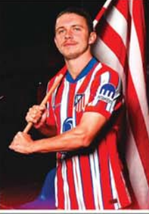
သလက်တီကိုမက်ဒရစ်အသင်းက ခေါ်ယူခဲ့ခြင်းဖြစ်သည်။ အက်သလက်တီကိုမက်ဒရစ်အသင်းသည် လက်ရှိဈေးကွက်အတွင်းတွင် ကစားသမား ဥဦးအထိ ခေါ်ယူအားဖြည့်ထားပြီး ဖြစ်သည်။ (ယာဝုံ)(NGB)

မက်ဒရစ် ဩဂုတ် ၁၀ သည်။ အက်သလက်တီကိုမက်ဒရစ် အသင်းသည် ချဲလ်ဆီးအသင်းကွင်းလယ်ကစားသမား ကော်နာဂယ်လ်ဟာအား ပြောင်းရွှေ့ကြေး ယူရို ၄၂ သန်းဖြင့် ၅ နှစ် စာချုပ် ချုပ်ဆိုကာ ခေါ်ယူခဲ့ကြောင်း အတည်ပြုထုတ်ပြန်ကြေညာခဲ့သည်။