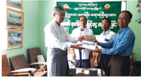
မန္တလေး ဩဂုတ် ၁၁

မန္တလေးတိုင်းဒေသကြီး၊ အမရပူရမြို့နယ် အငြိမ်းစားပညာ ရေးဝန်ထမ်းများ လူမှုကူညီရေး အသင်းမှ အမရပူရမြို့နယ်အတွင်း