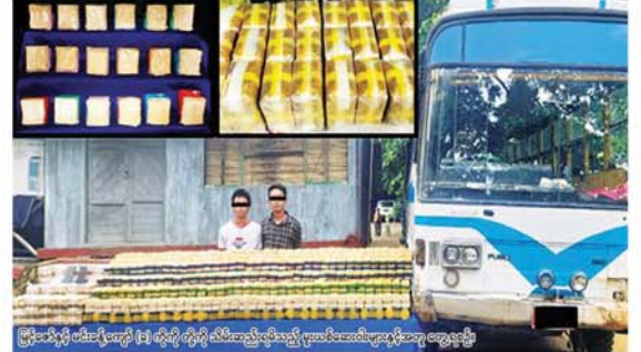
မြို့နယ်ရှိ စစ်ဆေးရေးရုံး (၁) မှ ရရှိသည့် ငွေကျပ် ပူးပေါင်းဆေးသွပ်ဆေးပြား အစုံအစည်း ဆက်ပြစ်မှုကျူးလွန်သူများကို ဆက် သတင်းရရှိသည်။ လက်စစ်ဆေးဖော်ထုတ်လျက်ရှိကြောင်း သတင်းစဉ်

ဆပ်ပြာခွက် ၁၉၈၀ ဖြင့် ထည့်လျက် ဘီနိုဖြူ ၁၉ ဒသမ ၈ ကီလိုနှင့် စိတ်ကြွ ငွေသွပ်ဆေးပြား ၆ သိန်း သိမ်းဆည်း ရမိခဲ့ပြီး စစ်ဆေးဖော်ထုတ်ချက်အရ သိမ်းဆည်းရမိ မူးယစ်ဆေးဝါးများအား ရှမ်းပြည်နယ်မှ စစ်ကိုင်းတိုင်းဒေသကြီး ကလေးမြို့သို့ သယ်ဆောင်ခြင်းဖြစ် ကြောင်း သိရှိရသဖြင့် ၎င်းတို့အား ဥပဒေအရ အရေးယူထားရှိပြီး ကွင်း