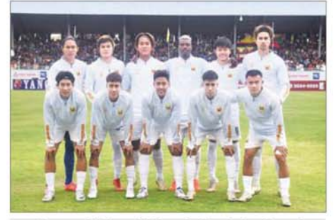
အာဆီယံကလပ်ပြိုင်ပွဲ ယှဉ်ပြိုင်ရမည့် ရှမ်းယူနိုက်တက်အသင်း။

(ထိုင်း)၊ ကွာလာလမ်ပူစီးတီး (မလေးရှား)၊ ဟန္တီန်း (ဗီယက်နမ်)၊ ဘော်နိုလီ (အင်ဒိုနီးရှား)၊ ကာယာ (ဗီလစ်ပိုင်)၊ Lion City Sailors (စင်ကာပူ)တို့ ပါဝင်နေသည်။ ပြိုင်ပွဲ ကျင်းပမည့်ပုံစံအရ ရှမ်းယူနိုက် တက်အသင်းသည် အုပ်စုငါးပွဲ အနက် နှစ်ပွဲကို အိမ်ကွင်း၊ သုံးပွဲကို အဝေးကွင်း ကစားရမည်ဖြစ် သည်။ ရှမ်းယူနိုက်တက်အသင်း သည် အုပ်စုပွဲများအဖြစ် ဩဂုတ် ၂၁ ရက်တွင် ဗီယက်နမ်ကလပ် ထန်ဟွာအသင်းနှင့် အဝေးကွင်း