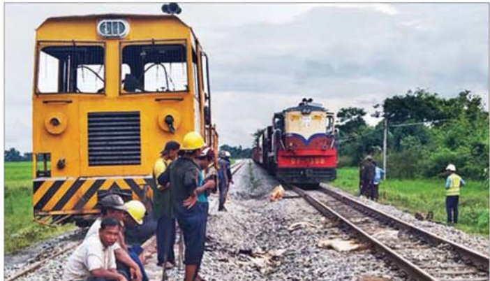
ညောင်ပင်သာနှင့်ဖြူးဘူတာကြား မိုင်းပေါက်ကွဲမှုကြောင့် ရထားလမ်းပျက်စီးဆုံးရှုံးမှုအပေါ် ပြန်လည်ပြုပြင်ပြီးစီး၍ ရထားများ ပုံမှန်အတိုင်း ပြန်လည်ဖြတ်သန်းနေစဉ်။