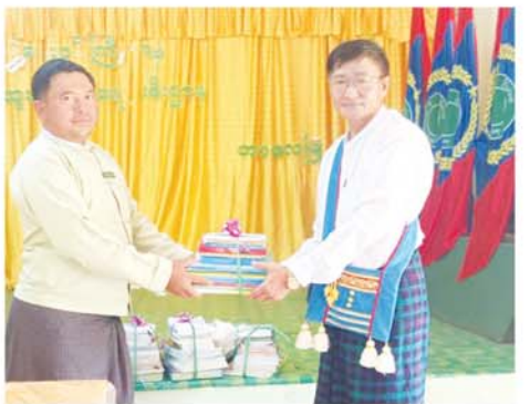
စာစောင်ပေးအပ်လှူဒါန်းပွဲမှ ဖြန့်ဝေလက်ခံရရှိသည့် သုတ၊ ရသစာအုပ် ၈၀ ကို စံညီစာကြည့်တိုက် လေးတိုက်သို့ ပေးအပ်လှူဒါန်းခဲ့ရာ တာဝန်ရှိသူများက လက်ခံရယူခဲ့ကြောင်း သိရသည်။ (အပေါ်ပုံ) (မြို့နယ်(ပြန်/ဆက်)

တာလေ ဩဂုတ် ၁၅ ရှမ်းပြည်နယ်(အရှေ့ပိုင်း)၊ တာချီလိတ်ခရိုင်၊ တာလေမြို့တွင် မြို့နယ်ခွဲအတွင်းရှိ ကျေးရွာစာကြည့်တိုက်များသို့ စာအုပ်စာစောင်များ ပေးအပ်လှူဒါန်းပွဲကို... (Community Centre) ခန်းမ၌ ပြုပြင်ပြောပြပွဲ ကျင်းပပေးခဲ့ကြောင်း သိရသည်။