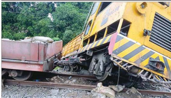
ရန်ကုန်-မန္တလေးရထားလမ်းပိုင်းအတွင်း ပြူးမြို့နယ် ညောင်ပင်သာနှင့်ဖြူးဘူတာကြား မိုင်းပေါက်ကွဲမှုကြောင့် လုံခြုံရေးကင်းလှည့် RGC 89 သံလမ်းပြေးယာဉ် လမ်းချော်ကျမှုအခြေအနေကို တွေ့ရစဉ်။

(၂၃) မအူပင်တက္ကသိုလ် သတ်မှတ်ရက်ကျော်လွန်မှ လျှောက်ထားသူများသည် အဆင့်မြင့်ပညာဦးစီးဌာန(ရန်ကုန်ရုံးခွဲ)၊ သထုံလမ်း၊ ကမာရွတ်မြို့နယ်၊ ရန်ကုန်မြို့သို့ ပေးပို့လျှောက်ထားရမည်။ အသေးစိတ်သိရှိလိုပါက အဆင့်မြင့်ပညာဦးစီးဌာန (ရန်ကုန်ရုံးခွဲ)၊ သထုံလမ်း၊ ကမာရွတ်မြို့နယ်၊ ရန်ကုန်မြို့၊ ဖုန်း- ၀၃၇-၅၀၃၄၇၃ သို့ ဆက်သွယ်စုံစမ်းနိုင်ပါသည်။ အဆင့်မြင့်ပညာဦးစီးဌာန ပညာရေးဝန်ကြီးဌာန