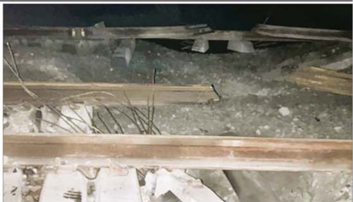
ညောင်ပင်သာနှင့်ဖြူးဘူတာကြား မိုင်းပေါက်ကွဲမှုကြောင့် ရထားလမ်းနှင့် ကွန်ကရစ်လီမားတုံးများ ပျက်စီးဆုံးရှုံးမှုအခြေအနေကို တွေ့ရစဉ်။

❖ စာမျက်နှာ ၉ မှ မိုင်းပေါက်ကွဲမှု ဖြစ်စဉ် ဖြစ်ပွားရောနေရာသို့ နယ်မြေဒေသ တာဝန်ရှိသူများ၊ နယ်မြေခံ လုံခြုံရေးတပ်ဖွဲ့ဝင်တို့က အချိန်နှင့် တစ်ပြေးညီရောက်ရှိပြီး နယ်မြေရှင်းလင်းစစ်ဆေးခြင်း၊ မြန်မာ့မီးရထား ဝန်ထမ်းများကလည်း လမ်းချော်ကျသော သံလမ်းပြေးယာဉ်အား မတင်၍ လမ်းပိုင်းအား အမြန်ဆုံး ပြန်လည်ဖွင့်လှစ်နိုင်ရေးအတွက် ရထားလမ်း ပြန်လည်ပြုပြင်ခြင်းတို့ကို ဆောင်ရွက်ခဲ့သည်။ မိုင်းပေါက်ကွဲမှုဖြစ်စဉ်ကြောင့် အဆန်ရထားလမ်း၏ အရှေ့ဘက် သံလမ်းနှင့် ရထားလမ်း အဆင့်မြင့်တင်ရေး စီမံကိန်းဆောင်ရွက်