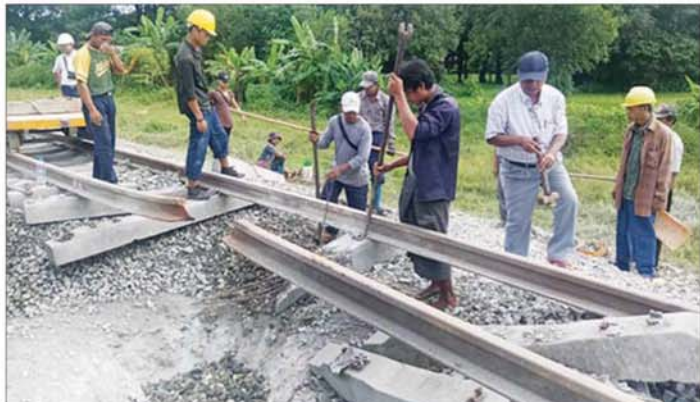
ညောင်ပင်သာနှင့်ဖြူးဘူတာကြား မိုင်းပေါက်ကွဲမှုကြောင့် ရထားလမ်း ပျက်စီးဆုံးရှုံးမှုအပေါ် ပြန်လည်ပြုပြင်နေမှု အခြေအနေကို တွေ့ရစဉ်။

မရှိစေရေးနှင့် ရန်ကုန် - မန္တလေး ရထားလမ်း အဆင့်မြင့်တင်ရေး စီမံကိန်း နှောင့်နှေးကြန်ကြာစေရန်အတွက် ရည်ရွယ်ပြီး ယခုကဲ့သို့ အကြိမ်ကြိမ် ကျူးလွန်ဖျက်ဆီးနေကြခြင်းဖြစ်သော်လည်း နိုင်ငံတော်အစိုးရအနေဖြင့် အများပြည်သူ ခရီးသွားလာမှုနှင့် ကုန်စည် ပို့ဆောင်မှု အဆင်ပြေချောမွေ့ မြန်ဆန်စေရေးအတွက် ရထားလမ်းနှင့် အခြေခံအဆောက်အအုံများ ပိုမိုတိုးတက်ကောင်းမွန်လာစေရေး၊ ရထားပို့ဆောင်ရေးစနစ် အဆင့်မြင့်တင်ရေး စီမံကိန်း လုပ်ငန်းများကို ရည်မှန်းချက် ထားရှိ၍ အစဉ်တစိုက်အလေးထား စီမံဆောင်ရွက်ပေးလျက်ရှိကြောင်း သတင်းရရှိသည်။ သတင်းစဉ်