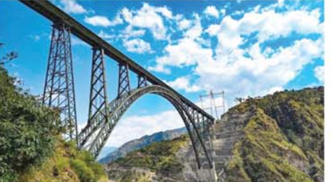
အိန္ဒိယနိုင်ငံ ကက်ရိုမီးယားပြည်နယ်အတွင်း မီးရထားများ ဖြတ်ကျားရန် တည်ဆောက်ထားသည့် ကမ္ဘာ့အမြင့်ဆုံး အမှတ်တံဆိပ် တည်ပါသော ချေချက်မြစ်ကျားတံတားကို တွေ့ရစဉ်။ Mon

ကြောင်း သဘာဝဘေးဆိုင်ရာစီမံ ခန့်ခွဲရေးဝန်ကြီး ယောရိုမိုမိတ် ဆုမုရက ထုတ်ဖော်ကြေညာခဲ့ သည်။ သို့ရာတွင် ဧရာမငလျင်ကြီး လုံးဝလှုပ်မည်မဟုတ်တော့ဟု ဆိုလိုခြင်းမဟုတ်ကြောင်း ထို ဝန်ကြီးက ထည့်သွင်းရှင်းပြသည်။ ဂျပန်နိုင်ငံတည်ရှိရာ ကျွန်း စုများသည် ပြတ်ရွေ့ကြော့ကြီး လေးခုပေါ်တွင် ရှိကြသဖြင့် တစ်နှစ်လျှင် ငလျင်အကြိမ်ရေ ၁၅၀၀ ခန့် လှုပ်နေကြောင်း သိရ သည်။