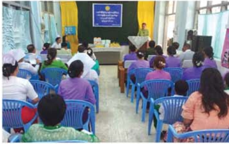
သရက် ဩဂုတ် ၁၅

မကွေးတိုင်းဒေသကြီး၊ သရက်မြို့၌ ခရိုင်ပြည်သူ့ကျန်းမာရေးဦးစီးဌာန၏ အာဟာရဖွံ့ဖြိုးရေး ရက်သတ္တပတ်များ ၂၀၂၄