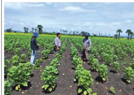
ကျောက်ဆည် ဩဂုတ် ၁၅

မန္တလေးတိုင်းဒေသကြီး၊ ကျောက်ဆည်ခရိုင်တွင် ကျောက်ဆည်၊ စဉ့်ကိုင်၊ မြစ်သားမြို့နယ်များပါဝင်ပြီး(၂၀၂၄-၂၀၂၅)ခုနှစ်တွင် ချည်မျှင်ရှည်ဝါ သုဉ်းကေ စိုက်ပျိုးနိုင်ခဲ့ကြောင်းနှင့် ချည်မျှင်ရှည်ဝါစိုက်ခင်းများ အောင်မြင်ဖြစ်ထွန်းလျက်ရှိသည်။