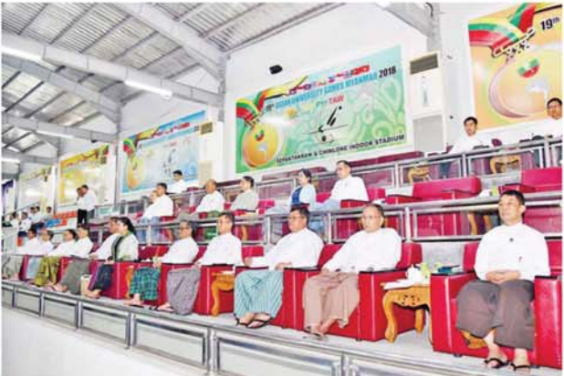
နိုင်ငံတော်စီမံအုပ်ချုပ်ရေးကောင်စီအဖွဲ့ဝင်များနှင့် အခမ်းအနားသို့ တက်ရောက်လာကြသူများ ၂၀၂၄ ခုနှစ် ပြည်နယ်နှင့် တိုင်းဒေသကြီး အမျိုးသားဖူဆယ်ပြိုင်ပွဲ ဝိုင်းလှည့် ပွဲစဉ်အဖြစ် ရန်ကုန်တိုင်းဒေသကြီးအသင်းနှင့် ကချင်ပြည်နယ်အသင်းတို့ ယှဉ်ပြိုင်ကစားနေမှုကို ကြည့်ရှုအားပေးစဉ်။

တက်ရောက် အခမ်းအနားသို့ နိုင်ငံတော်စီမံအုပ်ချုပ်ရေးကောင်စီအဖွဲ့ဝင်များ ဖြစ်ကြသည့် ဒေါ်ခွဲဘူ၊ ပိုးရယ်အောင်သိန်း၊ ဒေါက်တာမူထန်၊ ဒေါက်တာဘေ၊ ခင်စိန်လွင်၊ ဦးရွှေကြမ်းနှင့် ဦးရန်ကျော်၊ ပြည်ထောင်စုဝန်ကြီးများ၊ ပြည်ထောင်စုစာရင်းစစ်ချုပ်၊ ဒုတိယဝန်ကြီးများ၊ ဌာနဆိုင်ရာအကြီးအကဲများ၊ မြန်မာနိုင်ငံဘောလုံးအဖွဲ့ချုပ်မှ တာဝန်ရှိသူများ၊ ပြိုင်ပွဲအသင်းများမှ အုပ်ချုပ်သူ/နည်းပြများ၊ ရောက်ကြသည်။