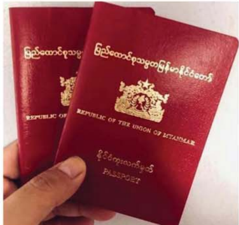
မြစ်ကြီးနားနှင့် လားရှိုးရုံးခွဲများတွင် နိုင်ငံကူးလက်မှတ်ပြုလုပ်ရန်

၎င်း PDF အမည်ခံအကြမ်း ဖက်သမားများသည် မြင်းခြံမြို့ နယ်အတွင်းရှိ ကျေးရွာများ တွင် အကြမ်းဖက်လုပ်ရပ်များ လုပ်ဆောင်နေသည့် အတွက် ဒေသခံပြည်သူများက လုံခြုံရေး တပ်ဖွဲ့ဝင်များနှင့် ပူးပေါင်း၍ နယ်မြေလုံခြုံရေး ဆောင်ရွက် လျက်ရှိသည်ကို အထင်အမြင် လွဲမှားစေရန်အတွက် သတင်းတု၊ သတင်းအမှားများဖြင့် လုပ်ကြံ ရေးသားဝါဒဖြန့်ဝေ နေခြင်းသာ ဖြစ်ကြောင်း သိရသည်။