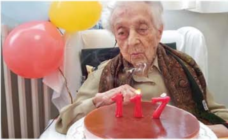
မက်ဒရစ် ဩဂုတ် ၂၀ ကမ္ဘာ့အသက်အကြီးဆုံး လူသား မာရီယာဘာရန်ယတ်စ် ၁၁၇ နှစ်အရွယ်တွင် သက်ကြီး

ဝင် အရေးကြီးသော ကမ္ဘာ့သမိုင်း ဖြစ်စဉ်များစွာကို ကြုံတွေ့ခဲ့ဖူး သည့် မာရီယာဘာရန်ယတ်စ်ကို ဂင်းနစ်ကမ္ဘာ့စံချိန်အဖွဲ့အစည်းက ၂၀၂၃ ခုနှစ် ဇန်နဝါရီလတွင် ကမ္ဘာ့အသက်အကြီးဆုံး သက်ရှိ လူသားအဖြစ် မှတ်တမ်းတင် ခဲ့သည်။ ၎င်းအနေဖြင့် အိပ်ပျော်နေ စဉ် ဝေဒနာခံစားရခြင်း အလှည့် မရှိဘဲ ငြိမ်းချမ်းစွာ ကွယ်လွန် သွားခဲ့ပြီဖြစ်ကြောင်း ၎င်း၏သမီး အသုံးပြုသော အိတ်စ်စ်လူမှုကွန် ရက်တွင် ရေးသားလွှင့်တင်ခဲ့ သည်။ “ကျွန်မအင်အားချိန့်နေပါပြီ။ သွားရမည့်ကာလ ရောက်လာပါ တော့မည်။ မငိုကြပါနှင့်။ ကျွန် မမျက်ရည်တွေကို မနှစ်သက်ပါ။ ကျွန်မ ဘယ်ကဲ့သို့သွားရသွားရ ပျော်ရွှင်ပါမည်”ဟု ၎င်းမကွယ် လွန်မီက ပြောခဲ့သောစကားကို သမီးဖြစ်သူက အဆိုပါလူမှုကွန် ရက်စာမျက်နှာပေါ်တွင် ရေးသား လွှင့်တင်ပေးခဲ့ကြောင်း သိရ သည်။ Mon