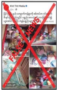
နှင့် ဖျက်ဆီးခြင်းများမရှိကြောင်း သိရသည်။

မြင်းခြံမြို့နယ်မှ လုံခြုံရေးတာဝန် ရှိသူတစ်ဦး၏ ပြောကြားချက်အရ PDF အမည်ခံအကြမ်းဖက်သမား များက မြင်းခြံမြို့နယ်မှ ကျေးရွာ အချို့ကို လက်နက်ကြီး၊ လက်နက် ငယ်များဖြင့် ပစ်ခတ်တိုက်ခိုက်မှု ကြောင့် နေအိမ်များစီးလောင်ပျက် စီးပြီး ဒေသခံပြည်သူများ ထိခိုက် ဒဏ်ရာများ ရရှိခဲ့ကြောင်း၊ ထို့ကြောင့် ဒေသခံပြည်သူများနှင့် လုံခြုံရေးတပ်ဖွဲ့ဝင်များ ပူးပေါင်း ချီ နယ်မြေလုံခြုံရေးဆောင်ရွက် လျက်ရှိရာ ၎င်းကျေးရွာမှ ပြည်သူ ဝိုင်ပစ္စည်းများကို ယူဆောင်ခြင်း သိရသည်။