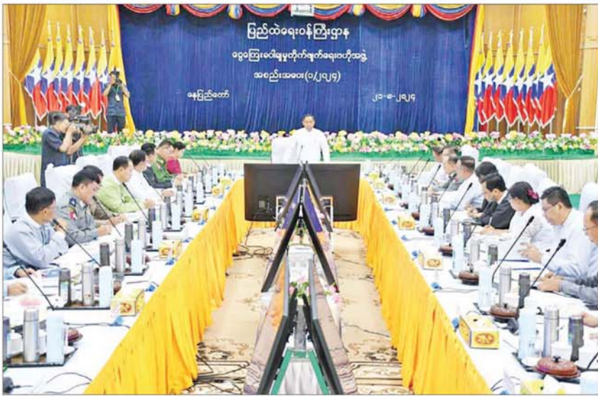
ငွေကြေးခဝါချမှုတိုက်ဖျက်ရေးဗဟိုအဖွဲ့၏ အစည်းအဝေးအမှတ်စဉ် (၁/၂၀၂၄)ကို မြန်မာနိုင်ငံရဲတပ်ဖွဲ့ဌာနချုပ် အရိန္ဒမာခန့်မဉ် ကျင်းပစဉ်။

အစည်းအဝေးသို့ နိုင်ငံတော်စီမံအုပ်ချုပ်ရေးကောင်စီအဖွဲ့ဝင် ပြည်ထဲရေးဝန်ကြီးဌာန ပြည်ထောင်စုဝန်ကြီး ငွေကြေးခဝါချမှု တိုက်ဖျက်ရေးဗဟိုအဖွဲ့ဥက္ကဋ္ဌ ဒုတိယဗိုလ်ချုပ်ကြီးရာပြည့်၊ ဒုတိယဥက္ကဋ္ဌများဖြစ်ကြသည့် မြန်မာနိုင်ငံတော်ဗဟိုဘဏ်ဥက္ကဋ္ဌနှင့် အကတ်လိုက်စားမှုတိုက်ဖျက်ရေးကော်မရှင်ဥက္ကဋ္ဌ၊ ငွေကြေးခဝါချမှုတိုက်ဖျက်ရေးဗဟိုအဖွဲ့ အဖွဲ့ဝင်များ၊ အမျိုးသားအဆင့် မဟာဗျူဟာနယ်ပယ်(၅)ရပ်မှ ဥက္ကဋ္ဌနှင့် အတွင်းရေးမှူး ငါးဦး၊ ငွေကြေးခဝါချမှုနှင့် အကြမ်းဖက်မှုကို ငွေကြေးထောက်ပံ့မှုတိုက်ဖျက်ရေးလုပ်ငန်းအဖွဲ့မှ ဒုတိယဥက္ကဋ္ဌနှင့်အဖွဲ့ဝင်ကိုးဦး၊ အထူးဖိတ်ကြားထားသူ နှစ်ဦး စုစုပေါင်း ၃၂ ဦး တက်ရောက်ခဲ့ကြသည်။