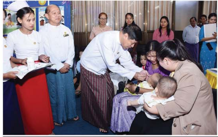
သတင်း-စာမျက်နှာ ၄