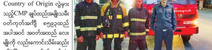
မီးဘေးအန္တရာယ်ကြိုတင်ကာကွယ်ရေး အသိပညာပေးခန်းမော်

Country of Origin လွှဲများ သည့်CMP ချုပ်ထည်အမျိုးသမီး ၀တ်ကုတ်အင်္ကျီ ၅၅၉၃ထည် အပါအဝင် အဝတ်အထည် လေး မျိုးကို လည်းကောင်းသိမ်းဆည်း လုပ်ငန်းများနှင့်အညီ အရေးယူ ဆောင်ရွက်လျက်ရှိသည်။ ထို့အတူ ဩဂုတ် ၂၀ရက် တွင် နေပြည်တော်ကောင်စီ တရားမဝင်ကုန်သွယ်မှုတိုက်ဖျက် ရေး အဖွဲ့အဖွဲ့၏ စီမံခန့်ခွဲမှုဖြင့် တာဝန်ကျပူးပေါင်းအဖွဲ့က စစ်ဆေး မှုများ ဆောင်ရွက်ခဲ့ရာ ဥက္ကဋ္ဌ ခရိုင်၊ တပ်ကုန်းမြို့နယ်၌ တရား မဝင် ကျွန်းသစ် ၂ ဒဿမ ၆၂၉ တန်ကို သိမ်းဆည်းရမိခဲ့ပြီး သစ်တောဥပဒေနှင့်အညီ အရေး ယူ ဆောင်ရွက်လျက်ရှိကြောင်း သိရသည်။ (ဝဲပုံ) (မန္တလေးနေ့စဉ်သတင်းအဖွဲ့) မီးဘေးအန္တရာယ်ကြိုတင်ကာကွယ်ရေး အသိပညာပေးခန်းမော် မန္တလေး၊ မဟာအောင်မြေ မြို့နယ် မီးသတ်ဦးစီးဌာနက မြို့နယ်အတွင်း မီးဘေးလုံခြုံစေ ရန်နှင့် မီးဘေးအန္တရာယ်ကြိုတင် ကာကွယ်နိုင်ရေးအတွက် ရပ်ကွက် များသို့ မီးဘေးကြိုတင်ကာကွယ် ရေးဆိုင်ရာ သတိပြုရမည့်အချက် များကိုအသိပေးပေးခြင်းဖြင့် လိုက်လံ နှီးဆော်ခြင်းကို ဩဂုတ် ၂၀ရက် ညနေ ၆နာရီက ဆောင်ရွက်ခဲ့ သည်။ ထိုသို့ အသိပညာပေး နှီးဆော်ရာတွင် နေအိမ်များ၌ မီးဘေးကြိုတင်ကာကွယ်ရေး ပစ္စည်းများဖြစ်သည့် မီးချိုက်၊ မီးကပ်၊ သံ၊ ရေပုံးနှင့်မီးသတ် ဆေးဘူးများ စီစဉ်ဆောင်ရွက် ထားရှိရေး၊ မီးသွေးမီးဖိုဖြင့် ထမင်း၊ ဟင်းချက်ပြုတ်ပြီးပါက မီးကြွင်းမီးကျန်များအား စနစ် တကျငြိမ်းသတ်ထားရှိရန်စသည့် မီးသတ်ဦးစီးဌာနမှ ထုတ်ပြန်ထား သည့် ကြေညာချက်များအား ပြည်သူများ ကျယ်ကျယ်ပြန့်ပြန့် သိရှိစေရန်အတွက် အသိပေးစာ ယာဉ်ဖြင့်လှည့်လည် နှီးဆော် ဆောင်ရွက်ပေးခဲ့ကြောင်း သိရ သည်။ (အပေါ်ပုံ)(၀၅၇)