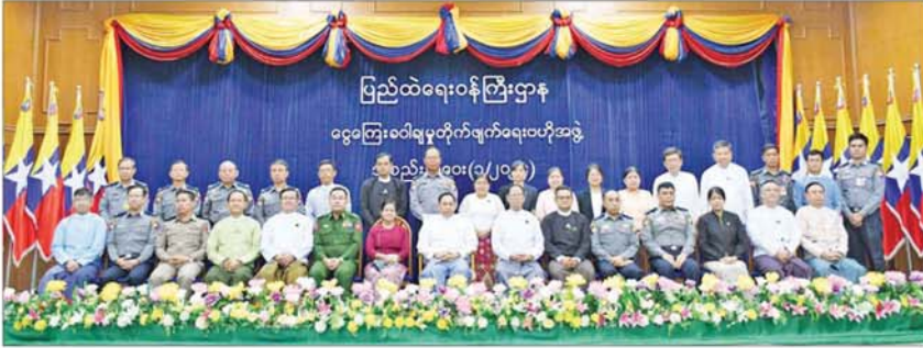
ငွေကြေးခဝါချမှုတိုက်ဖျက်ရေးဗဟိုအဖွဲ့၏ အစည်းအဝေးအမှတ်စဉ် (၁/၂၀၂၄) တက်ရောက်လာသူများ စုပေါင်းမှတ်တမ်းတင်ဓာတ်ပုံရိုက်ကြစဉ်။

ဒေသများစာရင်းမှ ပြောင်းလဲပေးခြင်းမရှိကြောင်း၊ ၂၀၂၄ ခုနှစ်အောက်တိုဘာလအတွင်း တိုးတက်ဆောင်ရွက်မှုများ ဆောင်ရွက်နိုင်ခြင်းမရှိပါက FATF မှ