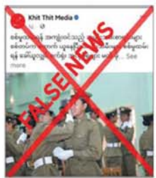
များဖြင့် ပြည်သူများ ကြောက်ရွံ့ ထိတ်လန့်စေရန် လှုံ့ဆော်ဝါဒ ဖြန့်ဝေနေခြင်းသာ ဖြစ်ကြောင်း သိရသည်။

နှင့် ပြည်သူ့စစ်မှုထမ်းဆင်ခေါ်ရေး ဗဟိုအဖွဲ့က မည်သည့်ထုတ်ပြန် ကြေညာချက်မျှထုတ်ပြန်ကြေညာ ခဲ့ခြင်းမရှိကြောင်း သိရသည်။ တရားမဝင် ပြည်ပျက်မိဒီယာ များနှင့် အကြမ်းဖက်သမားများက ပြည်သူ့စစ်မှုထမ်း ဥပဒေနှင့် ပတ်သက်၍ လုပ်ကြံရေးသားထား သည့် သတင်းတု၊ သတင်းအမှား