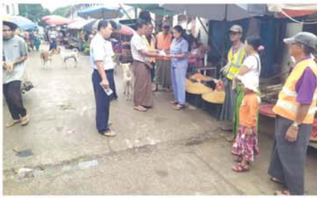
အရာရှိနှင့်ဝန်ထမ်းများ၊ ဈေးကော်မတီဝင်များ၊ စည်ပင်ကော်မတီများ၊ စုစုပေါင်း ၁၀ ဦးတို့က ပညာပေးလက်ကမ်းစာစောင်များ

ခြင်းကို ယမန် နေ့နံနက် ၈ နာရီခွဲက ဆောင်ရွက်ကြသည်။ အောင်လံမြို့နယ် စည်ပင်သာယာရေးအဖွဲ့သည် အပတ်စဉ် တနင်္လာနေ့တိုင်း ပလတ်စတစ် အိတ်၊ ကြပ်ကြပ်အိတ်မသုံးစွဲရေးနှင့် ပလတ်စတစ်သုံးစွဲမှု လျှော့ချရေး Campaign များ ဆောင်ရွက်လျက်ရှိရာ၊ ဩဂုတ် ၂၀ ရက်တွင် အဖွဲ့ဝင် မြို့မဈေးကြီး၌ အဆိုပါ Campaign အား ပြုလုပ်ခဲ့ပြီး အောင်လံမြို့နယ် စည်ပင်သာယာရေးအဖွဲ့အဖွဲ့အောင်