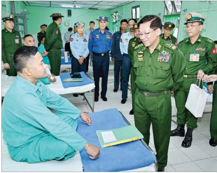
နိုင်ငံတော်စီမံအုပ်ချုပ်ရေးကောင်စီဥက္ကဋ္ဌ တပ်မတော်ကာကွယ်ရေးဦးစီးချုပ် ဗိုလ်ချုပ်မှူးကြီး မင်းအောင်လှိုင် တောင်ပိုင်းတိုင်းစစ်ဌာနချုပ် အစည်းအဝေးခန်းမ၌ တာဝန်ရှိသူများအား တွေ့ဆုံအမှာစကား ပြောကြားစဉ်။

ရှင်းလင်းတင်ပြမှုများအပေါ် နိုင်ငံတော်စီမံအုပ်ချုပ်ရေးကောင်စီဥက္ကဋ္ဌ တပ်မတော်ကာကွယ်ရေးဦးစီးချုပ်က အများပြည်သူလုံခြုံရေးနှင့် ဒေသအတွင်း တည်ငြိမ်အေးချမ်းရေးအတွက် လုံခြုံရေးလုပ်ငန်းများကို စနစ်တကျဆောင်ရွက်သွားရန်လိုကြောင်း၊ အကြမ်းဖက်မှုလုပ်ငန်းများနှင့် ဆက်စပ်လျက်ရှိသည့် အကြမ်းဖက်သောင်းကျန်းသူများ၏ သတင်းကွင်းဆက်များအားဖော်ထုတ်၍ အကြမ်းဖက်မှုလုပ်ရပ်များ လျော့နည်းပပျောက်သွားအောင် ဆောင်ရွက်သွားရန်လိုကြောင်း၊ နယ်မြေတည်ငြိမ်အေးချမ်းရေးနှင့် လမ်းပန်းဆက်သွယ်မှုများ လုံခြုံချောမွေ့ကောင်းမွန်စေရေးအတွက် ဆောင်ရွက်ရာတွင် ရေရှည်အတွက် ထည့်သွင်းစဉ်းစားဆောင်ရွက်