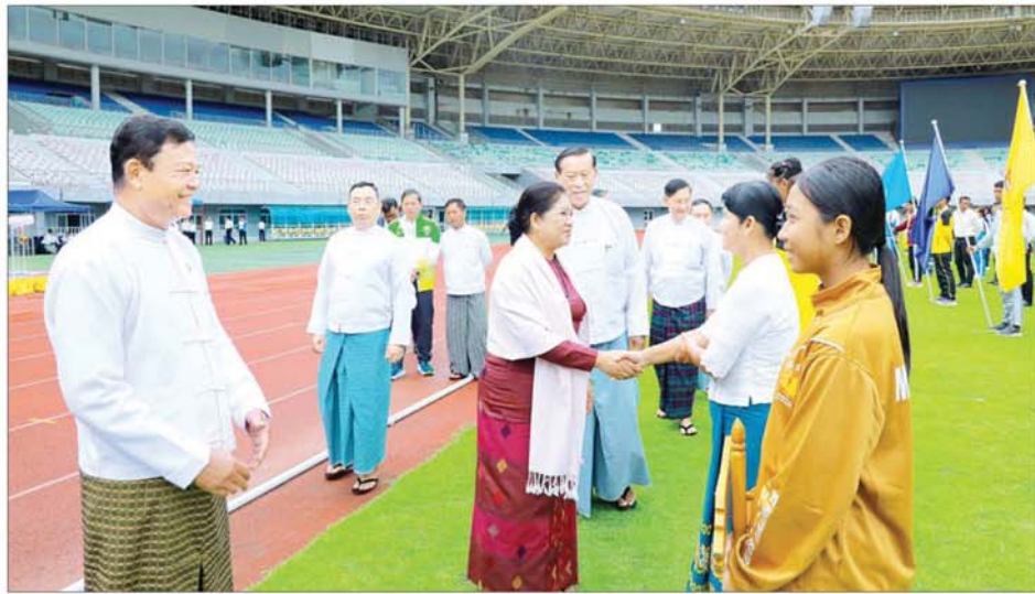
နိုင်ငံတော်စီမံအုပ်ချုပ်ရေးကောင်စီအဖွဲ့ဝင်များနှင့် တာဝန်ရှိသူများက ပြိုင်ပွဲဝင်အားကစားသမားများကို ရင်းရင်းနှီးနှီးလိုက်လံ နှုတ်ဆက်စဉ်။

နေပြည်တော် ဩဂုတ် ၂၃ ၂၀၂၄ ခုနှစ် ပြည်နယ်နှင့် တိုင်းဒေသကြီး အသက်(၁၈)နှစ် အောက် ပြေးခုန်ပစ်ပြိုင်ပွဲ ဖွင့်ပွဲ အခမ်းအနားကို ယနေ့နံနက်ပိုင်း တွင် နေပြည်တော်ရှိ ဝဏ္ဏသိဒ္ဓိ ဘောလုံးကွင်း၌ ကျင်းပရာ နိုင်ငံတော်စီမံအုပ်ချုပ်ရေးကောင်စီ အဖွဲ့ဝင်များ တက်ရောက်ကြည့်ရှု အားပေးကြသည်။ အခမ်းအနားသို့ နိုင်ငံတော် စီမံအုပ်ချုပ်ရေးကောင်စီအဖွဲ့ဝင် များဖြစ်ကြသည့် ဒေါ်ခွဲဘူ၊ ပိုးရယ် အောင်သိန်း၊ ဒေါက်တာမူထွန်း၊ ဒေါက်တာဘရွှေ၊ ခွန်စံလွင်၊ ဦးရွှေကြမ်းနှင့် ဦးရန်ကျော်၊ ပြည်ထောင်စုဝန်ကြီးများ၊ ဒုတိယ ဝန်ကြီးများ၊ ဌာနဆိုင်ရာ တာဝန် ရှိသူများ၊ မြန်မာနိုင်ငံပြေးခုန်ပစ် အဖွဲ့ချုပ်မှ တာဝန်ရှိသူများ၊ မိတ်ကြားထားသည့် စည်သူတော်များ၊ ပြိုင်ပွဲဝင်အသင်းများ မှ အုပ်ချုပ်သူ/နည်းပြများနှင့် အားကစားသမားများ တက်ရောက် ကြသည်။ ရှေးဦးလမ်းပြ အားကစားနည်း အခမ်းအနားတွင် မြန်မာနိုင်ငံ အိုလံပစ်ကော်မတီ ဥက္ကဋ္ဌ အားကစားနှင့် လူငယ်ရေးရာ ဝန်ကြီးဌာန ပြည်ထောင်စုဝန်ကြီး ဦးမင်းသိန်းဇံက ပြေးခုန်ပစ် အားကစားနည်းသည် မျက်မှောက် အခေကာလအားကစားပြိုင်ပွဲကြီး များတွင် အဓိကကျသည့် အစိတ် အပိုင်းတစ်ရပ်ဖြစ်သည့် အပြင် လူသားတို့၏ စွမ်းရည်ကို ဖော်ထုတ်