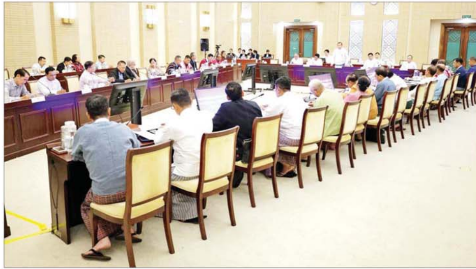
အမျိုးသားစည်းလုံးညီညွတ်ရေးနှင့် ငြိမ်းချမ်းရေးဖော်ဆောင်မှု ညှိနှိုင်းရေးကော်မတီဥက္ကဋ္ဌ ဒုတိယဗိုလ်ချုပ်ကြီး ထွန်းထွန်းနောင် အမျိုးသားစည်းလုံးညီညွတ်ရေးနှင့် ငြိမ်းချမ်းရေးဖော်ဆောင်မှုညှိနှိုင်းရေးကော်မတီ၊ NCA လက်မှတ်ရေးထိုးထားသည့် တိုင်းရင်းသားလက်နက်ကိုင်အဖွဲ့အစည်းများနှင့် နိုင်ငံရေးပါတီများအစုအဖွဲ့၏ အလုပ်အဖွဲ့တို့ ရွေးကောက်ပွဲကျင်းပရေးဆိုင်ရာ သုံးပွင့်ဆိုင် တွေ့ဆုံဆွေးနွေးပွဲ တွင် အမှာစကားပြောကြားစဉ်။

နေပြည်တော် ဩဂုတ် ၂၃ အမျိုးသား စည်းလုံးညီညွတ် ရေးနှင့် ငြိမ်းချမ်းရေးဖော်ဆောင်မှု ညှိနှိုင်းရေးကော်မတီ၊ NCA လက်မှတ် ရေးထိုးထားသော တိုင်းရင်းသား လက်နက်ကိုင်အဖွဲ့ အစည်းများမှ ကိုယ်စားလှယ်များ နှင့် နိုင်ငံရေးပါတီများအစုအဖွဲ့၏ အလုပ်အဖွဲ့တို့သည် ယနေ့နံနက် ပိုင်းတွင် နေပြည်တော်ရှိ အမျိုးသား စည်းလုံးညီညွတ်ရေးနှင့် ငြိမ်းချမ်း ရေးဖော်ဆောင်မှု ဗဟိုဌာန၌ သုံးပွင့်ဆိုင် တွေ့ဆုံဆွေးနွေး သည်။