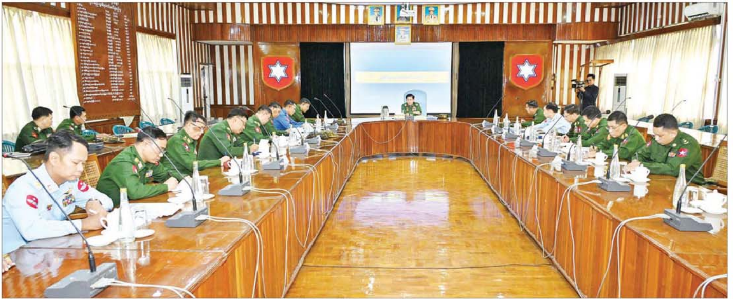
နိုင်ငံတော်စီမံအုပ်ချုပ်ရေးကောင်စီဥက္ကဋ္ဌ တပ်မတော်ကာကွယ်ရေးဦးစီးချုပ် ဗိုလ်ချုပ်မှူးကြီး မင်းအောင်လှိုင် တောင်ပိုင်းတိုင်းစစ်ဌာနချုပ် အစည်းအဝေးခန်းမ၌ တာဝန်ရှိသူများအား တွေ့ဆုံအမှာစကား ပြောကြားစဉ်။