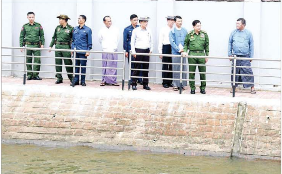
နိုင်ငံတော်စီမံအုပ်ချုပ်ရေးကောင်စီဥက္ကဋ္ဌ နိုင်ငံတော်ဝန်ကြီးချုပ် ဗိုလ်ချုပ်မှူးကြီးမင်းအောင်လှိုင် တောင်ငူမြို့ ကေတုမတီမြို့ဟောင်း အရှေ့ဘက်ကျုံးနေရာရှိ ယိုးဒယားပေါက်နေရာတွင် ကြည့်ရှုစစ်ဆေးစဉ်။

* ကေတုမတီမြို့ရိုးသည် ပြန်လည်ဖော်ထုတ်သင့်သည့် ရှေးဟောင်း အမွေအနှစ် တစ်ခုဖြစ်ကြောင်း၊ သမိုင်းကြောင်းအရ အထောက်အထားသေချာသည့်နေရာများကို ပြန်လည်ဖော်ထုတ်သွားရန်လိုကြောင်း၊ အလားတူ မြို့ကွက်သစ်များ ဖော်ထုတ်ခြင်းနှင့် ရွှေ့ပြောင်း၍ရသည့် အစိုးရရုံးဌာနဆိုင်ရာ အဆောက်အအုံများကို ဦးစွာပြောင်းရွှေ့သွားရန် လိုကြောင်း၊ ကေတုမတီ နန်းတော်ရာနှင့်ပတ်သက်ပြီး အတည်ပြု၍ ရသည့် နေရာများ၊ ဘုတ်တလုတ်ကန်နေရာများကို ပြန်လည်ဖော်ထုတ်ရာတွင် ရှေးဟောင်းဥပဒေနှင့်အညီ ဆောင်ရွက်သွားရမည်ဖြစ်ကြောင်း၊ ရှေးဟောင်းအမွေအနှစ်နေရာများကို ဥပဒေနှင့်အညီ ကာကွယ်ထိန်းသိမ်းဆောင်ရွက်သွားရန်လို