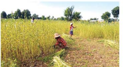
(အောက်ပုံ) ဧမုန်နန်း

၀၅ သန်း၊ စုစုပေါင်း စီမံကိန်းအသင်းဝင် ၁၁၇ ဦးအတွက် ငွေကျပ် ၄၈ သန်းကို အတိုးနှုန်းသက်သာစွာဖြင့် ထုတ်ချေးပေးထားပြီး အဆိုပါစီမံကိန်းရန်ပုံငွေများဖြင့် တစ်နိုင်တစ်ပိုင်စီးပွားရေးလုပ်ငန်းများ ဆောင်ရွက်လျက်ရှိသည့်အတွက် ကျေးလက်နေပြည်သူများ၏ လူမှုစီးပွားဘဝဖွံ့ဖြိုးတိုးတက်လာကြောင်း ချောက်မြို့နယ်ကျေးလက်ဒေသဖွံ့ဖြိုးတိုးတက်ရေးဦးစီးဌာနမှ သိရသည်။ (အောက်ပုံ) အိပိုးရိုး