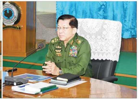
နိုင်ငံတော်စီမံအုပ်ချုပ်ရေးကောင်စီဥက္ကဋ္ဌ နိုင်ငံတော်ဝန်ကြီးချုပ် ဗိုလ်ချုပ်မှူးကြီး မင်းအောင်လှိုင် တောင်ငူမြို့ နယ်မြေခံလေတပ်စခန်းဌာနချုပ်အစည်းအဝေးခန်းမ၌ တာဝန်ရှိသူများအား တွေ့ဆုံအမှာစကား ပြောကြားစဉ်။