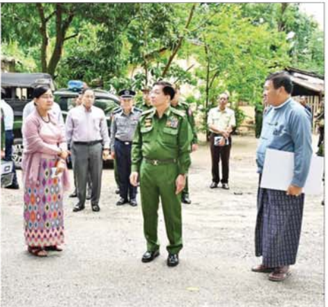
နိုင်ငံတော်စီမံအုပ်ချုပ်ရေးကောင်စီဥက္ကဋ္ဌ နိုင်ငံတော်ဝန်ကြီးချုပ် ဗိုလ်ချုပ်မှူးကြီးမင်းအောင်လှိုင် တောင်ငူမြို့ ကေတုမတီမြို့ဟောင်း မြို့လေးခံတပ်နေရာတွင် ကြည့်ရှုစစ်ဆေးစဉ်။

အဆောက်အအုံများ ဆောက်လုပ်ရေးနှင့်ပတ်သက်၍ တောင်ငူမြို့ ဖွံ့ဖြိုးတိုးတက်ရေးအတွက် ဆောင်ရွက်သွားရန်နှင့် စံချိန်စံညွှန်းများ ပြည့်မီစေရေး ဆောင်ရွက် သွားရန်လိုကြောင်း၊ မြို့ကွက်သစ်များ ဖော်ထုတ်ရာတွင်လည်း စနစ်တကျဖော်ထုတ်ရန်လိုကြောင်း၊ လူနေရပ်ကွက်များရှိ အိမ်ခြံမြေများအတွင်း သစ်ပင်များ စိုက်ပျိုးရန်နှင့် လမ်းဘေး