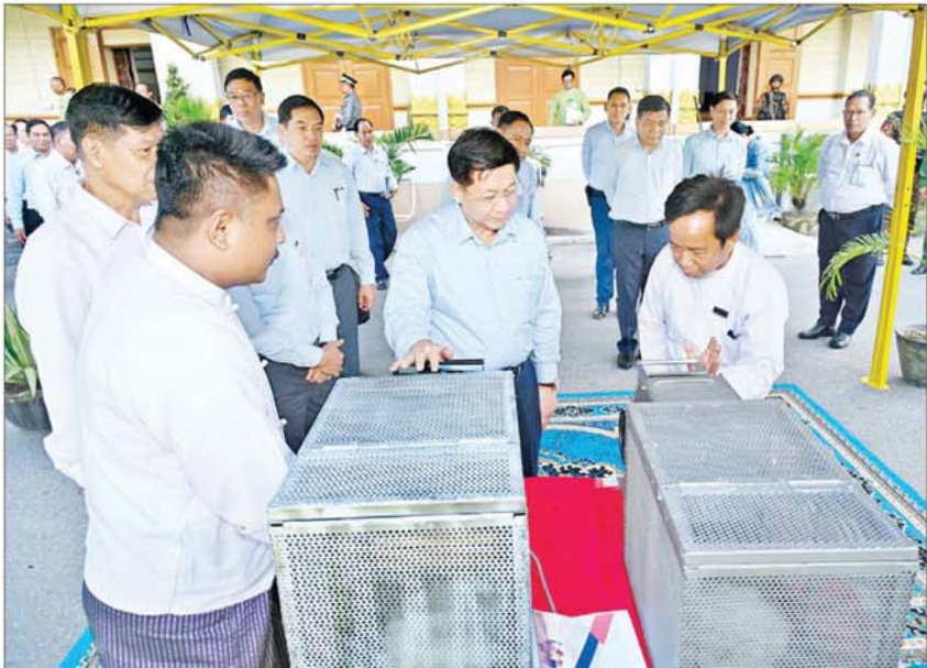
နိုင်ငံတော်စီမံအုပ်ချုပ်ရေးကောင်စီဥက္ကဋ္ဌ နိုင်ငံတော်ဝန်ကြီးချုပ် ဗိုလ်ချုပ်မှူးကြီး မင်းအောင်လှိုင် Good Brothers' Mechineries ကုမ္ပဏီလီမိတက်မှ စမ်းသပ်ထုတ်လုပ်ထားသည့် Mini Cotton Ginning Machine ကို ကြည့်ရှုစဉ်။

ကျန်းမာကြံ့ခိုင်မှုရှိစေရေးနှင့် အားကစားကဏ္ဍမြှင့်တင်ရေးအတွက် ကျန်းမာရေးနှင့်ပတ်သက်၍ ပညာ သင်ယူမှုပြီးဆုံးသည့် ကျန်းမာရေး ဝန်ထမ်းများကို နိုင်ငံတော်၏ကျန်းမာရေး နယ်ပယ်တွင် တာဝန်ထမ်းဆောင်နိုင်ရေး စီမံဆောင်ရွက်ပေးလျက်ရှိကြောင်း၊ နိုင်ငံ အတွင်း ကျန်းမာရေးစောင့်ရှောက်မှု လုပ်ငန်းများ ဆောင်ရွက်နိုင်ရန်အတွက် နိုင်ငံတော်အနေဖြင့် ကျန်းမာရေးဝန်ထမ်း များ စဉ်ဆက်မပြတ်ခန့်အပ်ပေးလျက်ရှိ ကြောင်း၊ မေးရုံရှိလျှင် ဆရာဝန်ရှိရမည် ဟူသည့် မူဝါဒနှင့်အညီ ဆရာဝန်များအား ခန့်အပ် တာဝန်ပေးထားကြောင်း၊ ကျန်းမာရေးနှင့်ဆက်စပ်၍ အားကစား ကဏ္ဍကို အနည်းငယ်ပြောကြားလို