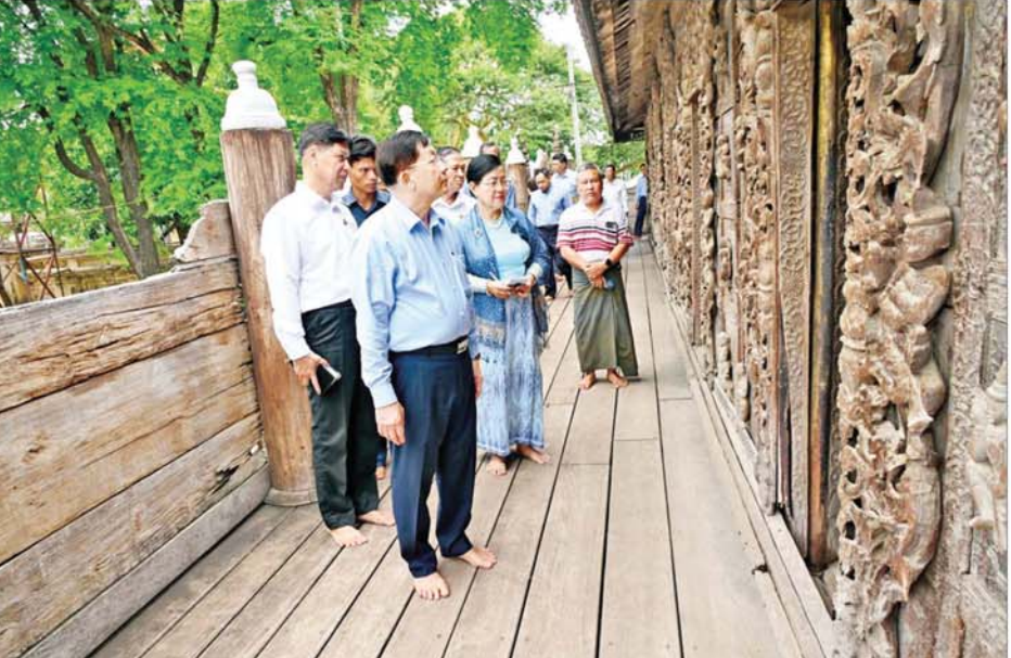
နိုင်ငံတော်စီမံအုပ်ချုပ်ရေးကောင်စီဥက္ကဋ္ဌ နိုင်ငံတော်ဝန်ကြီးချုပ် ဗိုလ်ချုပ်မှူးကြီး မင်းအောင်လှိုင် ရွှေနန်းတော်ကျောင်း (ရွှေကျောင်း) တွင် လှည့်လည်ကြည့်ရှုစဉ်။

တံတား ပြန်လည်တည်ဆောက်မည့် အခြေအနေများကိုလည်းကောင်း၊ ရှင်းလင်းတင်ပြကြသည်။ ရှင်းလင်း တင်ပြမှုများအပေါ် နိုင်ငံတော် စီမံအုပ်ချုပ်ရေးကောင်စီဥက္ကဋ္ဌ နိုင်ငံတော်ဝန်ကြီးချုပ်က တံတားပြန်လည်တည်ဆောက်ရာတွင် ရှေးမှပျက်မှုလပုံစံအတိုင်း တည်ဆောက်သွားရန်လိုကြောင်း၊ တံတားနှင့် ဆက်စပ်လျက်ရှိသည့် လမ်းများကိုလည်း စနစ်တကျဆောင်ရွက်ရန်လိုကြောင်း၊ ပြန်လည်တည်ဆောက်ရေးလုပ်ငန်းများ ဆောင်ရွက်ရာတွင်လည်း စနစ်တကျ ဆောင်ရွက်သွားရန်လိုကြောင်းနှင့် အခြားလိုအပ်သည်များကို လမ်းညွှန်မှာကြားသည်။