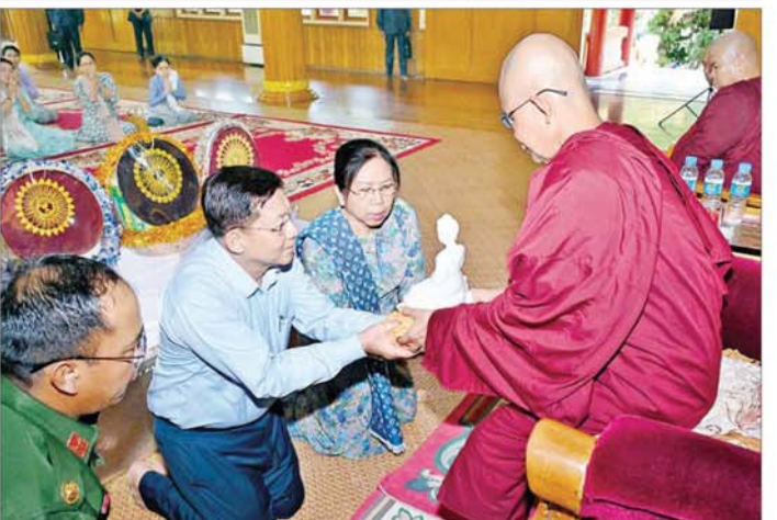
မဟာဓမ္မိကာရာမ ရွှေကျင်တိုက်မကြီး ဦးစီးပေးအပ်သော ဆရာတော်ကြီးက နိုင်ငံတော်စီမံအုပ်ချုပ်ရေးကောင်စီဥက္ကဋ္ဌ နိုင်ငံတော်ဝန်ကြီးချုပ် ဗိုလ်ချုပ်မှူးကြီးမင်းအောင်လှိုင်နှင့်ဇနီး ဒေါ်ကြူကြူလှတို့အား မွေဒါနအဖြစ် ကျောက်ဆစ်ဗုဒ္ဓရုပ်ပွားတော်မြတ် ပေးအပ်စဉ်။

ဇနီးတို့က ဘုရားကြီးဘက်စုံပြုပြင်မွမ်းမံရန်အတွက် အလှူတော်ငွေများကို ပေးအပ်လှူဒါန်းရာ ဂေါပကအဖွဲ့ ဥက္ကဋ္ဌနှင့် တာဝန်ရှိသူများက လက်ခံရယူသည်။ ယင်းနောက် ဘုရားကြီးအား လက်ယာရစ် လှည့်လည်ဖူးမြော်ကြည့်ညှိခဲ့ပြီး ဘုရားကြီးရေရှည်တည်တံ့ခိုင်မြဲရေးအတွက် လိုအပ်သည်များ လမ်းညွှန်မှာကြားသည်။ မဟာဓမ္မိကာရာမ ရွှေကျင်တိုက်မကြီး ဆက်လက်၍ နိုင်ငံတော်စီမံအုပ်ချုပ်ရေးကောင်စီ ဥက္ကဋ္ဌ နိုင်ငံတော် ဝန်ကြီးချုပ်နှင့်ဇနီး၊ အဖွဲ့ဝင်များသည် မဟာဓမ္မိကာရာမ ရွှေကျင်တိုက်မကြီးသို့ ရောက်ရှိကြပြီး ဦးစီးပေးအပ်သော ဆရာတော် အဂ္ဂမဟာပဏ္ဍိတ ဘဒ္ဒန္တ ထုတိဝရအား ဖူးမြော်ကြည့်ညှိ၍ လှူဖွယ်ပစ္စည်းများ ဆက်ကပ်လှူဒါန်းကြပြီး မဟာဓမ္မိကာရာမ ရွှေကျင်တိုက်မကြီး ဦးစီးပေးအပ်သော ဆရာတော်ကြီးက နိုင်ငံတော်စီမံအုပ်ချုပ်ရေးကောင်စီ ဥက္ကဋ္ဌ နိုင်ငံတော်ဝန်ကြီးချုပ်နှင့် ဇနီးတို့အား မွေဒါနအဖြစ် ကျောက်ဆစ်ဗုဒ္ဓရုပ်ပွားတော်မြတ်ကို ပြန်လည်ပေးအပ်သည်။ ထို့နောက် နိုင်ငံတော်စီမံအုပ်ချုပ်ရေးကောင်စီဥက္ကဋ္ဌ နိုင်ငံတော်