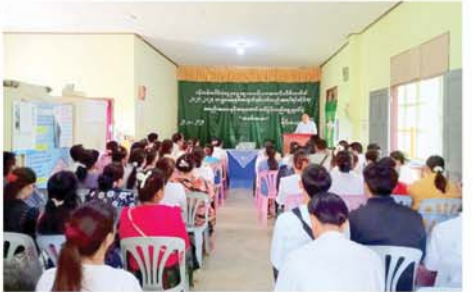
ဝန်ထမ်းပေါင်းစုံ ငွေစုငွေချေးသမဝါယမအသင်း နှစ်ပတ်လည်အရပ်ရပ်ဆိုင်ရာအစည်းအဝေးနှင့် အမှုဆောင်အဖွဲ့သစ်များ ရွေးချယ်တင်မြှောက်

မိုင်းယောင်း ၊ ဩဂုတ် ၂၅ သည်။ ရှမ်းပြည်နယ်(အရှေ့ပိုင်း)၊ မိုင်းယောင်းခရိုင်၊ မိုင်းယောင်း မြို့နယ်တွင် ဝန်ထမ်းပေါင်းစုံ ငွေစုငွေချေးသမဝါယမအသင်း၏ ၂၀၂၃-၂၀၂၄ ဘဏ္ဍာရေးနှစ် အတွက် နှစ်ပတ်လည်အရပ်ရပ် ဆိုင်ရာအစည်းအဝေးနှင့် အမှုဆောင်အဖွဲ့သစ် ရွေးချယ်တင်မြှောက်ပွဲကို ဩဂုတ် ၂၄ ရက် နံနက် ၁၀ နာရီက မြို့နယ်သမဝါယမဦးစီးဌာန အစည်းအဝေး ခန်းမ၌ ကျင်းပသည်။ အစည်းအဝေးသို့ မြို့နယ် သမဝါယမဦးစီးဌာနမှ တာဝန်ရှိသူများ၊ အသင်းအမှုဆောင် ဒါရိုက်တာအဖွဲ့များ၊ အသင်းသား အသင်းသူများ တက်ရောက်ကြ