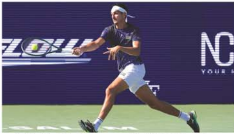
ဝါရှင်တန် မြေတိုက် ၂၅ အမေရိကန်နိုင်ငံတွင် ၂၀၂၄ Winston-Salem Open တင်းနစ်ပြိုင်ပွဲ ချန်ပီယံဆုကို ဆွတ်ခူးသော အမျိုးသား

တင်းနစ်ကစားသမား Lorenzo Sonego က ထိုက်ထိုက်တန်တန် ဆွတ်ခူးခဲ့သည်။ အဆိုပါ အီတလီတင်းနစ်ကစားသမား Lorenzo Sonego သည် 2024 Winston-Salem Open တင်းနစ်ပြိုင်ပွဲ ဗိုလ်လုပွဲ အဆင့်တွင် အမေရိကန်တင်းနစ်ကစားသမား Alex Michelsen အား ၆-၀၊ ၆-၂ဖြင့် အနိုင်ရရှိကာ ချန်ပီယံဆုအား ဆွတ်ခူးခဲ့ခြင်း ဖြစ်သည်။