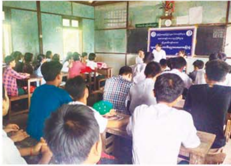
ယာဉ်စည်းကမ်းလမ်းစည်းကမ်းဆိုင်ရာ လူငယ်ရေးရာ အသိပညာပေး ဟောပြောပွဲကျင်းပ

ကလေးအလုပ်သမား ပပျောက်ရေးအကြောင်းတို့ကို ရှင်းလင်းဆွေးနွေးခဲ့သည်။ (အောက်ပုံ) ထို့နောက် စာအုပ်စာစောင်များ ခင်းကျင်းပြသရာ ဆရာ၊ ဆရာမများကျောင်းသားကျောင်းသူများက စိတ်ဝင်စားကြည့်ရှု