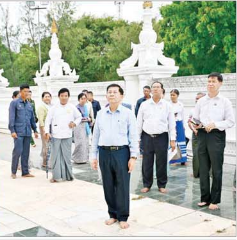
နိုင်ငံတော်စီမံအုပ်ချုပ်ရေးကောင်စီဥက္ကဋ္ဌ နိုင်ငံတော်ဝန်ကြီးချုပ် ဗိုလ်ချုပ်မှူးကြီး မင်းအောင်လှိုင် မဟာအတုလဝေယန် (အတုမရှိ)ကျောင်းတော်ကြီးအား လှည့်လည်ကြည့်ရှုစဉ်။

ဆောင်ရွက်နေမှု ကြည့်ရှုစစ်ဆေး ဦးစွာ နိုင်ငံတော်စီမံအုပ်ချုပ်ရေးကောင်စီဥက္ကဋ္ဌ နိုင်ငံတော်ဝန်ကြီးချုပ်နှင့်အဖွဲ့ဝင်များသည် မန္တလေးနန်းမြို့တွင်းသို့ ရောက်ရှိကြပြီး နန်းမြို့အနောက်ဘက်ရှိ မြို့ရိုးထိန်းသိမ်းထားရှိမှုနှင့် စည်ရည်တံတားအား ပြန်လည်တည်ဆောက်နိုင်ရေးဆောင်ရွက်လျက်ရှိမှု အခြေအနေများကို ကြည့်ရှုစစ်ဆေးရာ သာသနာရေးနှင့် ယဉ်ကျေးမှုဝန်ကြီးဌာန ဒုတိယဝန်ကြီး ဒေါ်နုမြစ်က စည်ရည်တံတား၏ သမိုင်းအကျဉ်းနှင့် ယခင်တံတားအဟောင်းအထောက်အထား အချက်အလက်များကိုလည်းကောင်း၊ ဆောက်လုပ်ရေးဝန်ကြီးဌာန ပြည်ထောင်စုဝန်ကြီး ဦးမျိုးသန့်က စည်ရည်