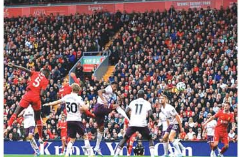
လီဗာပူးအသင်းနှင့် ဘရန့်ဖိုဒ်အသင်းတို့ ယှဉ်ပြိုင်ကစားနေစဉ်။

ချလ်ဆီးအသင်းအတွက် သွင်းဂိုးနှစ်ဂိုးကိုမူ ပွဲချိန် ၂၇မိနစ်တွင် ကန်ညာ၊ ပွဲချိန် (၄၅+၆)မိနစ်တွင် လာဆင်တို့က သွင်းယူပေးခဲ့သည်။ ဆက်လက်၍ ယနေ့ မြန်မာစံတော်ချိန် ည ၁၀နာရီက လီဗာပူးအသင်းနှင့် ဘရန့်ဖိုဒ်