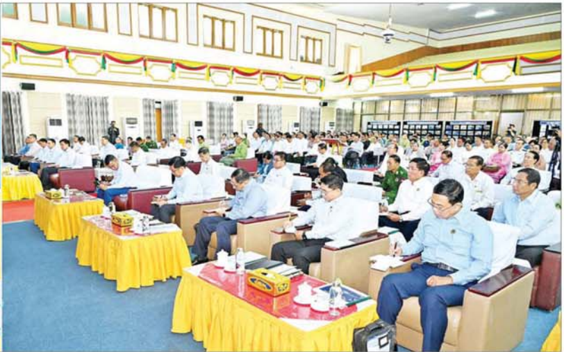
နိုင်ငံတော်စီမံအုပ်ချုပ်ရေးကောင်စီဥက္ကဋ္ဌ နိုင်ငံတော်ဝန်ကြီးချုပ် ဗိုလ်ချုပ်မှူးကြီး မင်းအောင်လှိုင် မန္တလေးတိုင်းဒေသကြီးအစိုးရအဖွဲ့ဝင်များ၊ တိုင်းဒေသကြီးနှင့် ခရိုင်အဆင့်ဌာနဆိုင်ရာတာဝန်ရှိသူများနှင့် တွေ့ဆုံ၍ ဒေသဖွံ့ဖြိုးတိုးတက်ရေးဆိုင်ရာများ ဆွေးနွေးပြောကြားစဉ်။

မန္တလေးတိုင်းဒေသကြီး၊ ကချင်ပြည်နယ်၊ စစ်ကိုင်းတိုင်းဒေသကြီးနှင့် မကွေးတိုင်းဒေသကြီးတို့အနေဖြင့် စိုက်ပျိုးရေးလုပ်ငန်းများ အောင်မြင်အောင်ဆောင်ရွက်နိုင်မည်ဆိုပါက ဒေသတွင်းစားရေးပူလုံမှုကို များစွာအထောက်အကူဖြစ်စေမည် မိမိတို့ဒေသအလိုက် ကုန်ထုတ်လုပ်မှုများတိုးတက်စေရေးနှင့် သီးထပ်စွမ်းအား အနည်းဆုံး ၂၀၀ ရာခိုင်နှုန်း တိုးတက်အောင်ဆောင်ရွက်