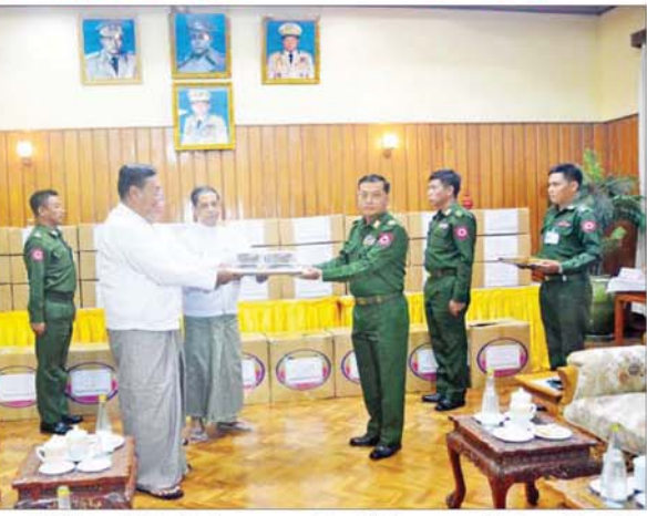
ဦးအောင်ကျော်ဟိုးနှင့် စေတနာရှင်အလှူရှင်များ၊ နေပြည်တော်တိုင်းစစ်ဌာနချုပ် တိုင်းမှူး ဗိုလ်ချုပ်

ဦးကိုကိုလှိုင်၊ နိုင်ငံတော်စီမံအုပ်ချုပ်ရေး ကော်စီဥက္ကဋ္ဌရုံး ဝန်ကြီးဌာန(၂) ပြည်ထောင်စုဝန်ကြီး ဦးကိုကိုလှိုင်၊ နိုင်ငံတော်စီမံအုပ်ချုပ်ရေးကော်စီ ဥက္ကဋ္ဌရုံး ဝန်ကြီးဌာန(၄) ပြည်ထောင်စုဝန်ကြီး ဦးအောင်ကျော်ဟိုးနှင့် စေတနာရှင်အလှူရှင်များ၊ နေပြည်တော်တိုင်းစစ်ဌာနချုပ် တိုင်းမှူး ဗိုလ်ချုပ်