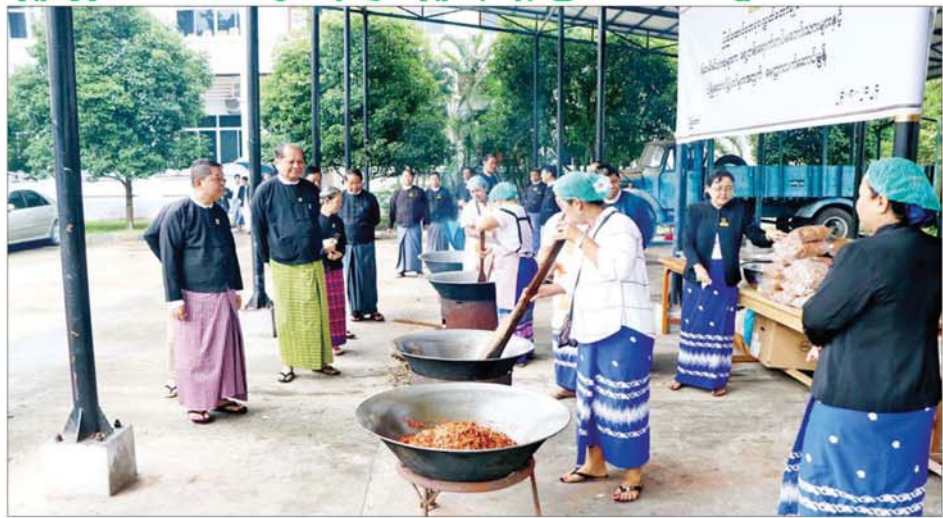
တိုင်းစစ်ဌာနချုပ်သို့ ပေးပို့လှူဒါန်း သွားမည့်ဖြစ်သည်။ ထို့ပြင် "ပြည်ချစ်သားမွန်၊ မေတ္တာစာသံဝေ" စာတမ်းဖြင့် အသားဖြင့်ပွဲကို ပြည်ထောင်စု တရားလွှတ်တော်ချုပ် စုဝေးခန်းမ ချီးမြှင့်ခဲ့ကြောင်း သိရသည်။ သတင်းစဉ်

ရေးမှူးချုပ်နှင့် တာဝန်ရှိသူများက ဩဂုတ် ၂၃ ရက် နံနက်ပိုင်းတွင် လိုက်လံ ကြည့်ရှုအားပေးခဲ့ကြ သည်။ ပြည်ထောင်စု တရားလွှတ်တော် ချုပ် ဝန်ထမ်းမိသားစုများအနေ ဖြင့် နိုင်ငံတော်လုံခြုံရေးနှင့် ကာကွယ်ရေး၊ အများပြည်သူ၏ အသက်အိုးအိမ် စည်းစိမ်ကို ကာကွယ် စောင့်ရှောက်ရေး တာဝန်ကို ထမ်းဆောင်နေသည့် ရှေ့တန်းရောက် တပ်မတော်သား များနှင့် လုံခြုံရေးတပ်ဖွဲ့ဝင်များ အတွက် ငွေကျပ်သိန်း ၃၀ တန်ဖိုး ရှိ ဗာလချောင်ကြော်၊ ငါးနီတူ ခြောက်ကြော်၊ နန်းမြိုင်ကော်ဖီမစ် ထုပ်၊ အသင့်စားခေါက်ဆွဲခြောက် ထုပ်၊ လက်ဖက်အကြော်ထုပ်၊ ငါးပိ ထောင်းဘူး၊ မြေပဲဆားလှော်၊ ပုံးရည်ကြီးစသည့် စားသောက် ဖွယ်ရာ ၁၃ မျိုးနှင့် လှူဒါန်းငွေ ကျပ်သိန်း ၅၀ အား နေပြည်တော်