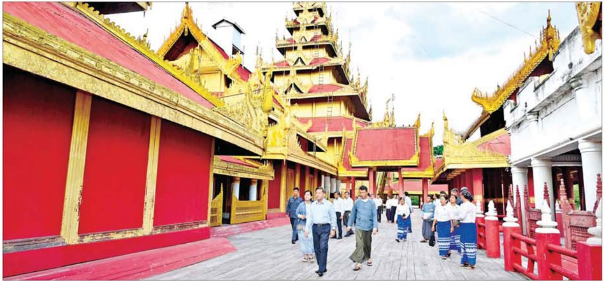
နိုင်ငံတော်စီမံအုပ်ချုပ်ရေးကောင်စီဥက္ကဋ္ဌ နိုင်ငံတော်ဝန်ကြီးချုပ် ဗိုလ်ချုပ်မှူးကြီးမင်းအောင်လှိုင် မြန်မာ့စံကျော်ရွှေနန်းတော်ကြီးအတွင်း ကြည့်ရှုစစ်ဆေးစဉ်။

အုပ်ချုပ်ရေးကောင်စီ ဥက္ကဋ္ဌ နိုင်ငံတော်ဝန်ကြီးချုပ်နှင့် အဖွဲ့ဝင်များသည် မန္တလေးနန်းမြို့တွင်းရှိ မြန်မာ့စံကျော် ရွှေနန်းတော်ကြီး ထိန်းသိမ်းထားရှိမှု အခြေအနေများကို သွားရောက်ကြည့်ရှုစစ်ဆေးရာ သာသနာရေးနှင့် ယဉ်ကျေးမှုဝန်ကြီးဌာန ဒုတိယဝန်ကြီး ဒေါ်နုမြနှင့် တာဝန်ရှိသူများက ရွှေနန်းတော်ကြီးနှင့် အဆောင်တော်များ ထိန်းသိမ်းထားရှိမှုအခြေအနေများနှင့် ၂၀၂၃ ခုနှစ် ဖေလအတွင်း နိုင်ငံတော်စီမံအုပ်ချုပ်ရေးကောင်စီ ဥက္ကဋ္ဌ နိုင်ငံတော်ဝန်ကြီးချုပ် လာရောက်စစ်ဆေးစဉ် လမ်းညွှန်မှာကြားချက်များ လိုက်နာဆောင်ရွက်ထားရှိမှု အခြေအနေများကို ထူးလင်းတင်ပြကြရာ နိုင်ငံတော်စီမံအုပ်ချုပ်ရေးကောင်စီ ဥက္ကဋ္ဌ နိုင်ငံတော်ဝန်ကြီးချုပ်က လိုအပ်သည်များ မှာကြားသည်။