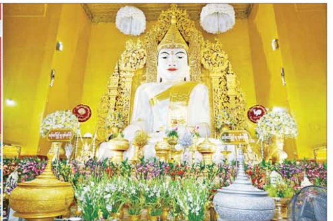
နိုင်ငံတော်စီမံအုပ်ချုပ်ရေးကောင်စီဥက္ကဋ္ဌ နိုင်ငံတော်ဝန်ကြီးချုပ် ဗိုလ်ချုပ်မှူးကြီးမင်းအောင်လှိုင်နှင့်ဇနီး ဒေါ်ကြူကြူလှ မဟာသကျမာရဇိန် ကျောက်တော်ကြီးဘုရားအား ဖူးမြော်ကြည့်ညှိစဉ်။

မွမ်းမံ ထိန်းသိမ်းဆောင်ရွက်သွားရန်လိုကြောင်း၊ အမွေအနှစ်လက်ရာများကို ရေရှည်တည်တံ့ခိုင်မြဲစေရေးအတွက် မှန်ကန်ခြင်းများ၊ ကန့်သတ်ဓရိယာထားရှိခြင်းများ ဆောင်ရွက်ထားရှိရန်လိုကြောင်း၊ ရှေးဟောင်း အမွေအနှစ်လက်ရာများဖြစ်သည့်အတွက် အထူးဂရုပြု ထိန်းသိမ်း စောင့်ရှောက်သွားရန် လိုကြောင်း၊ ရွှေကျောင်းတော်ကြီး၏ အောက်ခြေတိုင်များ ခိုင်ခံ့နေစေရေး ထိန်းသိမ်းဆောင်ရွက်သွားရန်နှင့် သန့်ရှင်းသပ်ရပ်မှုရှိအောင် ထိန်းသိမ်း ဆောင်ရွက်မည်ဆိုပါက လာရောက်လေ့လာသူများကိုလည်း ပိုမိုဆွဲဆောင်နိုင်မည်ဖြစ်ကြောင်း မှာကြားသည်။