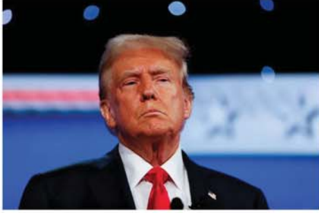
လောင်း ကာမာလာဟ်ရစ်က လက်ခံသဘောတူညီခဲ့ရာမှ ထိုစိန်ခေါ်သဖြင့် ပြိုင်ဘက်သမ္မတ စကားစစ်ထိုးပွဲကို အတည်ပြုခဲ့ပြီးဖြစ်သည်။ သို့ရာတွင် စကားစစ်ထိုးပွဲနီးကပ်လာမှ ကာမာလာဟ်ရစ်

ဝါရှင်တန် ဩဂုတ် ၂၇ ရှေ့လာမည့် စက်တင်ဘာ ၁၀ ရက်တွင် ဒီမိုကရက်တစ် သမ္မတလောင်း ကာမာလာဟ်ရစ် နှင့် ရီပတ်ဘလီကင် သမ္မတလောင်း ဒေါ်နယ်လ်ထရပ့််တို့နှစ်ဦး ၂၀၂၄ ခုနှစ် အမေရိကန်သမ္မတရွေးကောက်ပွဲအတွက် ပထမဆုံး အကြိမ် စကားစစ်ထိုးကြမည်ဖြစ်သည်။