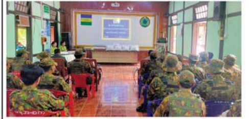
ဆည်မြောင်းရောင်းကန် ရေပြည့်လျှံ တစ်သဘော ရေထိန်းတော။ (အပေါ်ပုံ) ကျော်စွာ(ပြန်/ဆက်)

အသင်းမှ အသင်းသား ၃၇ ဦး၏ စပါးစိုက်ပျိုးရေးလုပ်ငန်းအား တစ် ဧကကို ငွေကျပ် နှစ်သိန်းနှုန်းဖြင့် ညီမျှသောသွင်းအားစုကို ဧက ၃၅၀ အတွက် မြို့နယ်သမဝါယမ အသင်းစု၏ အစီအစဉ်မှ အသင်း အချင်းချင်းပံ့ပိုးမှုဖြင့် မိုးစပါး စိုက်ပျိုးရေးစီမံကိန်းအတွက် စိုက်ပျိုး ရေးသမဝါယမတောင်သူများကို တာဝန်ရှိသူများက သွင်းအားစုပံ့ပိုး ပေးအပ်ခဲ့ကြောင်း သိရသည်။ မြို့နယ်(ပြန်/ဆက်)