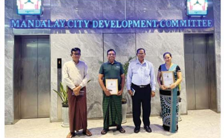
မန္တလေး၊ ဩဂုတ် ၂၇

မန္တလေးမြို့တော်စည်ပင်သာယာရေးကော်မတီနယ်နိမိတ်အတွင်းရှိ လမ်းဆုံလမ်းခွေးတွင် အများပြည်သူ ယာဉ်အန္တရာယ်ကင်းရှင်းစေရေးအတွက် အလှူရှင်များက CCTV၊ ဆိုလာ၊ မီးပျံင့်များနှင့် ဆက်စပ်ပစ္စည်းများ လှူဒါန်းခြင်းကို ယနေ့မြန်းလှိုင်တွင် မြို့တော်စည်ပင်ရစ်ထပ်ဆောင်တွင် ပြုလုပ်ရာ မန္တလေးမြို့တော်စည်ပင်သာယာရေးကော်မတီဥက္ကဋ္ဌ မြို့တော်ဝန်ဦးကျော်ဆန်းက အလှူငွေများ လက်ခံရယူပြီး ဂုဏ်ပြုမှတ်တမ်းလွှာများ ပေးအပ်ခဲ့သည်။