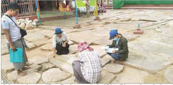
ရန်ကုန် ရှေးဟောင်းသင်္ကျောက်ပြား ကြီးများကို ညီညာပေါ်လွင်စေရေး ပြုပြင် ထိန်းသိမ်းရန်အတွက် (၈၇'x၆') အတွင်း တစ်စိတ်တစ် အစားအစာ ပြုလုပ်၍ ဖြည့်စွက်နိုင်ရေး ပုံထုတ်ရေးဆွဲ စနစ်တကျ Documentation

ရန်ကုန်၊ ဩဂုတ် ၂၇ ပုဂံရှေးဟောင်း ယဉ်ကျေးမှု နယ်မြေရှိ ရွှေစည်းခုံစေတီတော် ကြီး၏ ရင်ပြင်တော်တွင် ရေဆင်း ကောင်းစေရန်နှင့် ရှေးဟောင်း သင်္ကျောက်ပြားကြီးများကို ညီညာ ပေါ်လွင်စေရေး ပြုပြင်ထိန်းသိမ်း ရန် ရှေးဟောင်းသုတေသနနှင့် အမျိုးသားပြတိုက် ဦးစီးဌာနမှ ကြီးကြပ် ဆောင်ရွက်လျက်ရှိ ကြောင်း Bagan Arch မှ ထုတ်ပြန် ထားချက်အရ သိရသည်။