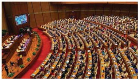
လာမည့် အောက်တိုဘာလတွင် သမ္မတသစ်တင်မြောက်ရန် ဆုံးဖြတ်ခဲ့သော စီယက်နမ်ပီလီမန်အစည်းအဝေးကို ဩဂုတ် ၂၆ ရက်က ကျင်းပစဉ်။ Mon

တိုကျို ဩဂုတ် ၂၇ ရှန်ရှန်ဟု အမည်ပေးထားသော တိုင်ဖုန်းမှန်တိုင်း ယခုအပတ်အတွင်း မိမိတို့နိုင်ငံထဲသို့ ဝင်ရောက်လာမည်ဖြစ်သည်ဟု ဂျပန်မိုးလေဝသပညာရှင်များ ကြိုတင်ခန့်မှန်းထားကြောင်း စီအင်န်အေသတင်းဌာနက ဖော်ပြသည်။ ယင်းအင်အားပြင်း တိုင်ဖုန်းမှန်တိုင်းသည် ဩဂုတ် ၂၈ ရက်တွင် ဂျပန်နိုင်ငံတောင်ပိုင်းရှိ အမိကျွန်းကို ဖြတ်သန်းတိုက်ခတ်ဖွယ် ရှိမည်ဟုလည်း ကြိုတင်ခန့်မှန်းထားသည်။ ရှန်ရှန်မှန်တိုင်းသည် တစ်နာရီ ၂၀၆ ကီလိုမီတာအထိ ပြင်းထန်သော လေတိုက်နှုန်းဖြင့် တောင်ဘက် ကျူးရှူးကျွန်းရှိရာ အရပ်သို့ ဦးတည်လျက်ရှိသည်။ ဩဂုတ် ၂၇ ရက်မှ ၂၉ ရက်အထိ တောင်ပိုင်းနှင့် အရှေ့တောင်ပိုင်းဒေသများတွင် အင်အားပြင်းမုန်တိုင်းများကျရာက ကာလွှဲနိုင်ကြီးမားမားဖြစ်ကြောင်း ဂျပန် မိုးလေဝသဌာန၏ သတင်းစာ ရှင်းလင်းပွဲ၌ သတိပေးထားပြီး ဖြစ်သည်။ အဆိုပါ ရာသီဥတုဆိုးရွားမှုများကြောင့် ပြည်တွင်းခရီးသည် တင်စီးရထားပို့ဆောင်ရေးနှင့် လေကြောင်းခရီးစဉ်များ အနည်းနှင့်အနည်း ထိခိုက်စေနိုင်မည်ဖြစ်ကြောင်း သိရသည်။ Mon