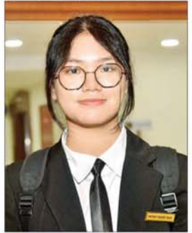
မရင်းသန့်မေ