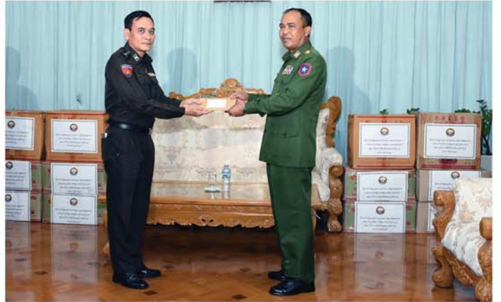
မန္တလေး၊ ဩဂုတ် ၂၇

နိုင်ငံတော်ကာကွယ်ရေးနှင့် လုံခြုံရေးတာဝန်များကို စွမ်းစွမ်းတပ်ထမ်းဆောင်လျက်ရှိသော လုံခြုံရေးတပ်ဖွဲ့ဝင်များအတွက် စေတနာရှင်အလှူရှင်များက ဂုဏ်ပြုခန့်မြှင့်ပေးမှုနှင့် စားသောက်ဖွယ်ရာများ ဂုဏ်ပြုပေးအပ်လျက်ရှိရာ ယနေ့ မြန်းလှိုင်တွင် မန္တလေးတိုင်းဒေသကြီးအစိုးရအဖွဲ့သည် စေတနာရှင်အလှူရှင်များက ဂုဏ်ပြုပေးအပ်သည့် စားသောက်ဖွယ်ရာများကို အလယ်ပိုင်းတိုင်းစစ်ဌာနချုပ်သို့ သွားရောက်ဂုဏ်ပြုပေးအပ်ရာ အလယ်ပိုင်းတိုင်းစစ်ဌာနချုပ်စည်ခန်းမ၌ တိုင်းမှူး ဗိုလ်မှူးချုပ်ကျော်ကိုထိုက်က လက်ခံ၍ ဂုဏ်ပြုမှတ်တမ်းလွှာ ပြန်လည်ပေးအပ်ပြီး ကျေးဇူးတင်စကားပြောကြားခဲ့သည်။