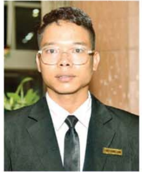
ဒုတပ်ကြပ် သက်ပိုင်လင်း

ကာကွယ်ရေးဦးစီးချုပ်ရုံး(ကြည်း)စစ်ရေး ချုပ်ရုံးမှ ဗိုလ်မှူးကြီးသူရိန်ထွန်း ဦးဆောင် ၍ စစ်မှုထမ်းဆံ/စစ်မှုထမ်းဟောင်း မိသားစုဝင် သား သမီးများမှ ၂၀၂၃-၂၀၂၄ ပညာသင်နှစ် တက္ကသိုလ်ဝင်စာမေးပွဲ အောင်မြင်ပြီး နိုင်ငံတော်အဆင့် ဘက်စုံ ပညာထူးချွန်လူငယ် ရွေးချယ်ခံရသည့် ကျောင်းသား ကျောင်းသူငါးဦး၊ အမှတ် အများဆုံးရရှိသော ကျောင်းသား ကျောင်းသူ ၁၆ ဦး၊ ဂုဏ်ထူး သုံးဘာသာ