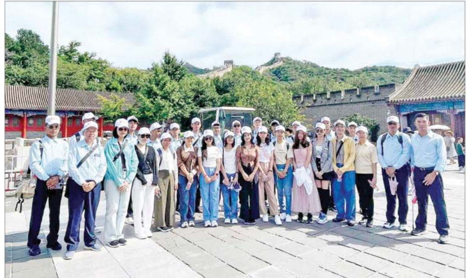
လေ့လာခြင်းများ ဆောင်ရွက်ခဲ့ကြသည့် ထိုသို့ သွားရောက်လေ့လာရာ တွင် နိုင်ငံတော်အဆင့် ဘက်စုံ ပညာထူးချွန်လူငယ် ရွေးချယ်ခံရ သည့် ကျောင်းသား ကျောင်းသူ များက သိရှိလိုသည်များ မေးမြန်း ခဲ့ကြရာ သက်ဆိုင်ရာ နေရာ အလိုက်မှ တာဝန်ရှိသူများက လိုက်လံရှင်းလင်း ပြသခဲ့ကြ ကြောင်း သိရသည်။ သတင်းစဉ်

လေဆိပ်သို့ ရောက်ရှိကြပြီး မြန်မာနိုင်ငံဆိုင်ရာ စစ်သံမှူး ဗိုလ်မှူးချုပ် စော်စော်နိုင်နှင့် တာဝန်ရှိသူများက ကြိုဆိုနှုတ်ဆက်ကြသည်။ သွားရောက်လည်ပတ် အဆိုပါ ထူးချွန်လူငယ်များ ပါဝင်သည့် လေ့လာရေးအဖွဲ့သည် ဩဂုတ် ၂၇ ရက် နံနက်ပိုင်းတွင် ပေကျင်းမြို့ရှိ Tian Tan ပန်းခြံသို့ သွားရောက် လည်ပတ်ခြင်း၊ မွန်လွဲပိုင်းတွင် Ling Guang ဘုရားကျောင်းသို့ သွားရောက်၍ ဘုရားကျောင်းတွင် ကိန်းဝပ် စံပယ်တော်မူသော ဗုဒ္ဓမြတ်စွယ်တော်အား ဖူးမြော်ခြင်းများ ဆောင်ရွက်ခဲ့ကြသည်။ ယနေ့နံနက်ပိုင်းတွင် အဆိုပါ ထူးချွန်လူငယ်များ ပါဝင်သည့် လေ့လာရေးအဖွဲ့သည် ပေကျင်းမြို့ရှိ Great Wall သို့ သွားရောက် လေ့လာခဲ့ကြပြီး မွန်လွဲပိုင်းတွင် နွေရာသီနန်းတော်သို့ သွားရောက်