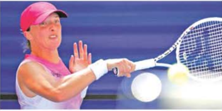
2024 US Open တင်းနစ်ပြိုင်ပွဲ ခုတိယအဆင့်သို့ Iga Swiatek တက်ရောက်

နယူးယောက်စ် ဩဂုတ် ၂၀ အဆင့်တွင် ရုရှားတင်းနစ်မယ် အမေရိကန်နိုင်ငံ၊ နယူးယောက်စ်မြို့တွင် ကျင်းပပြုလုပ်လျက်ရှိသော အမျိုးသမီးတင်းနစ်ပြိုင်ပွဲဖြစ်သည့် 2024 US Open တင်းနစ်ပြိုင်ပွဲ ခုတိယအဆင့်သို့ ပိုလန်တင်းနစ်မယ် Iga Swiatek တက်ရောက်ခဲ့သည်။ အဆိုပါ ပိုလန်တင်းနစ်မယ် Iga Swiatek သည် 2024 US Open တင်းနစ်ပြိုင်ပွဲ ပထမ အဆင့်တွင် ရုရှားတင်းနစ်မယ် Kamilla Rakhimova အား ၆-၄၊ ၇-၆ ဖြင့် အနိုင်ရရှိကာ ခုတိယအဆင့်သို့ တက်ရောက်ခဲ့ခြင်း ဖြစ်သည်။ 2024 US Open တင်းနစ်ပြိုင်ပွဲ ခုတိယအဆင့်တွင် ပိုလန်တင်းနစ်မယ် Iga Swiatek နှင့် ဂျပန်တင်းနစ်မယ် Ena Shibahara တို့ ယှဉ်ပြိုင်ကစားသွားမည် ဖြစ်သည်။ (အပေါ်ပုံ)(NGB)