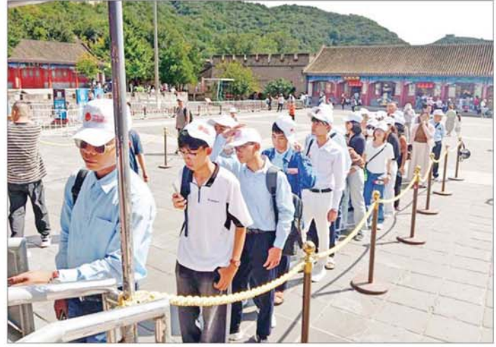
၂၀၂၃-၂၀၂၄ ပညာသင်နှစ် တက္ကသိုလ်ဝင်စာမေးပွဲတွင် ထူးချွန်စွာအောင်မြင်ခဲ့သည့် ကျောင်းသား ကျောင်းသူများနှင့် ဂုဏ်ထူးဖြင့်အောင်မြင်သည့်စစ်သည်များ ပါဝင်သော မျိုးဆက်သစ် ထူးချွန်လူငယ်မောင်မယ်များ တရုတ်ပြည်သူ့သမ္မတနိုင်ငံ ပေကျင်းမြို့ရှိ အထင်ကရနေရာများတွင် လေ့လာကြစဉ်။