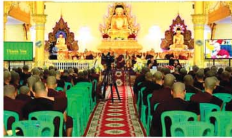
(I), Thesis(II) အတန်းစုံမှ ကြောင်း သိရသည်။ (အပေါ်ပုံ) စာတမ်း(၈)စောင် ဖတ်ကြားကြ (၀၄၅)

တက္ကသိုလ်တွင် နှင်းသဘင်ခန်းမ တွင် ဩဂုတ် ၂၇ ရက် နံနက် ၇ နာရီခွဲမှ ညနေ ၄ နာရီခွဲအထိ ကျင်းပရာ နိုင်ငံတော်ပရိယတ္တိ သာသနာ့တက္ကသိုလ်(မန္တလေး) ပါမောက္ခချုပ်ဆရာတော်ကြီး အမှူးပြုသော သင်ကြားစီမံဆရာ တော်များ တက်ရောက်ကြ သည်။ စာတမ်းဖတ်ပွဲတွင် ပထမနှစ်၊ ဒုတိယနှစ်၊ တတိယနှစ်၊ စတုတ္ထ နှစ်၊ M.A(I),M.A(II),Thesis