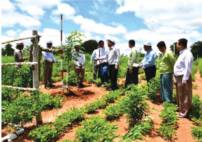
ညောင်ဦး ၊ ဩဂုတ် ၂၉ ၊ မန္တလေးတိုင်းဒေသကြီး ညောင်ဦးခရိုင် ညောင်ဦးမြို့နယ် ကျောက်ပန်းတောင်း-ညောင်ဦး ကားလမ်းမကြီး၊ လမ်းဘေး ဝဲ၊ ယာတစ်လျှောက်နှင့် ပုဂံ-ချောက် ကားလမ်းမကြီး လမ်းဘေး ဝဲ၊ ယာတို့တွင် စိုက်ပျိုးထားသည့်