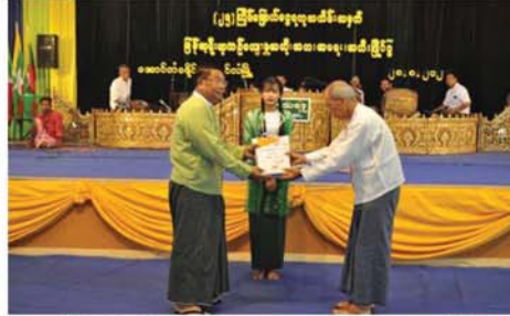
(၂၅)ကြိမ်မြောက် ပြန်ဟရီရာ အသို၊ အကာ၊ အရေး၊ အစီမံပြင်ပွဲ သိုဇ်အဆင့် ဆုချီးမြှင့်ပွဲကျင်းပ

တိုင်းဒေသကြီး သယံဇာတနှင့် သဘာဝပတ်ဝန်းကျင်ထိန်းသိမ်းရေးဝန်ကြီးဌာန၊ ဝန်ကြီးဦးရွှေဇင်နှင့်အဖွဲ့သည် ညောင်ဦး-ကျောက်ပန်းတောင်းကားလမ်းဘေးရှိ အပူပိုင်းဒေသ စိမ်းလန်းစိုပြည်ရေးဦးစီးဌာန၊ စိုက်ခင်းနှင့်လမ်းဘေး ဝဲ၊ ယာ စိမ်းလန်းစိုပြည်ရေးသစ်တောစိုက်ခင်းတို့အားကြည့်ရှုစစ်ဆေးခဲ့ပြီး မွန်းလွဲ ၁ နာရီတွင် ရွှေစည်းခုံစေတီ