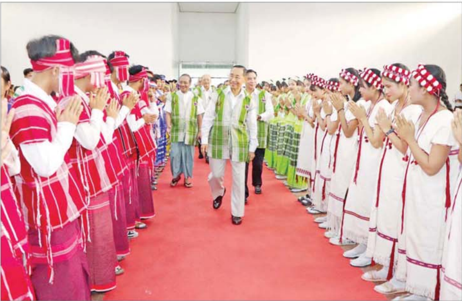
နိုင်ငံတော်စီမံအုပ်ချုပ်ရေးကောင်စီအဖွဲ့ဝင် မန်းငြိမ်းမောင် ကရင်ရိုးရာဝါခေါင်လ ချည်ဖြူဖွဲ့ မင်္ဂလာအခမ်းအနား တက်ရောက်လာကြသူများအား ရှင်းလင်းနှီးနှီးနှုတ်ဆက်စဉ်။

သတ်မှတ်နေရာများသို့ သယ် ဆောင်ခြင်း၊ ဘိုးဘွားများ နေရာယူခြင်းတို့ ဆောင်ရွက်ကြ သည်။ ပေးအပ်ချီးမြှင့် ဆက်လက်၍ နိုင်ငံတော်စီမံ အုပ်ချုပ်ရေးကောင်စီအဖွဲ့ဝင်၊ ပြည်ထောင်စုဝန်ကြီး၊ ပဲခူးတိုင်း ဒေသကြီးဝန်ကြီးချုပ်နှင့် ဇနီး၊ တိုင်းဒေသကြီးတရားလွှတ်တော် တရားသူကြီးချုပ်၊ အစိုးရအဖွဲ့ဝင် ဝန်ကြီးများနှင့် ၎င်းတို့၏ ဇနီးများ၊ ဌာနဆိုင်ရာအကြီးအကဲများအား ချည်ဖြူဖွဲ့ပေးကြပြီး ကရင်အဘိုး အဘွားများအတွက် ထောက်ပံ့ငွေ အား နိုင်ငံတော်စီမံအုပ်ချုပ်ရေး ကောင်စီအဖွဲ့ဝင်ကလည်းကောင်း၊ ပဲခူးတိုင်းဒေသကြီး ကရင်စာပေ နှင့် ယဉ်ကျေးမှုကော်မတီအတွက် ထောက်ပံ့ငွေအား ပြည်ထောင်စု ဝန်ကြီးက လည်းကောင်း၊ ကရင် ရိုးရာဒုးယိမ်းအဖွဲ့များအတွက် ဂုဏ်ပြုချီးမြှင့်ငွေအား ပဲခူးတိုင်း ဒေသကြီး ဝန်ကြီးချုပ်ကလည်း ကောင်း ပေးအပ်ချီးမြှင့်ကြသည်။ ထို့နေ့က ညောင်လေးပင်ခရိုင် ကရင်စာပေနှင့် ယဉ်ကျေးမှု