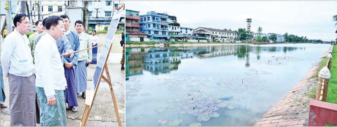
နိုင်ငံတော်စီမံအုပ်ချုပ်ရေးကောင်စီဥက္ကဋ္ဌ နိုင်ငံတော်ဝန်ကြီးချုပ် ဗိုလ်ချုပ်မှူးကြီး မင်းအောင်လှိုင် ဟံသာဝတီ နေပြည်တော် သာယာဝတီတံခါးအနီးရှိ ဟံသာဝတီမြို့ဟောင်းကျုံးအား ကြည့်ရှုစစ်ဆေးစဉ်။