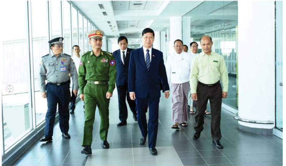
tion Local Seminar between Yunnan, China and Southeast Asian Countries)အား ကုမင်းမြို့၌ ဩဂုတ် ၂၈ ရက်မှ ဩဂုတ် ၂၉ ရက်အထိ ကျင်းပခဲ့ကြောင်း သိရသည်။ (မန္တလေးစနေစဉ်)

ဒေသတွင်း အကတိလိုက်စားမှုတိုက်ဖျက်ရေးတွင် အရှေ့တောင်အာရှနိုင်ငံများနှင့် နိုင်ငံတကာကူးလူးဖလှယ်မှုနှင့် ပူးပေါင်းဆောင်ရွက်မှုများ အားကောင်းလာစေရန်၊ စီးပွားရေးလုပ်ငန်းများမြှင့်တင်ရန်၊ နယ်စပ်ဖြတ်ကျော် အကတိလိုက်စားမှုကို တားဆီးနှိမ်နင်းရေးနှင့် ပတ်သက်သောအစီအမံများ ဆောင်ရွက်ရန်နှင့် လိုက်လျောညီထွေမှု တည်ဆောက်ရန်တို့အတွက် ရည်ရွယ်ချက်ပေးသည့် တရုတ်ပြည်သူ့သမ္မတနိုင်ငံ၊ ယူနန်ပြည်နယ်နှင့် အရှေ့တောင်အာရှနိုင်ငံများဆိုင်ရာ (Belt and Road Initiative)၏ ပွင့်လင်းမြင်သာစွာ တည်ဆောက်ရေး နှီးနှောဖလှယ်ပွဲ (The Belt and Road Integrity Construction