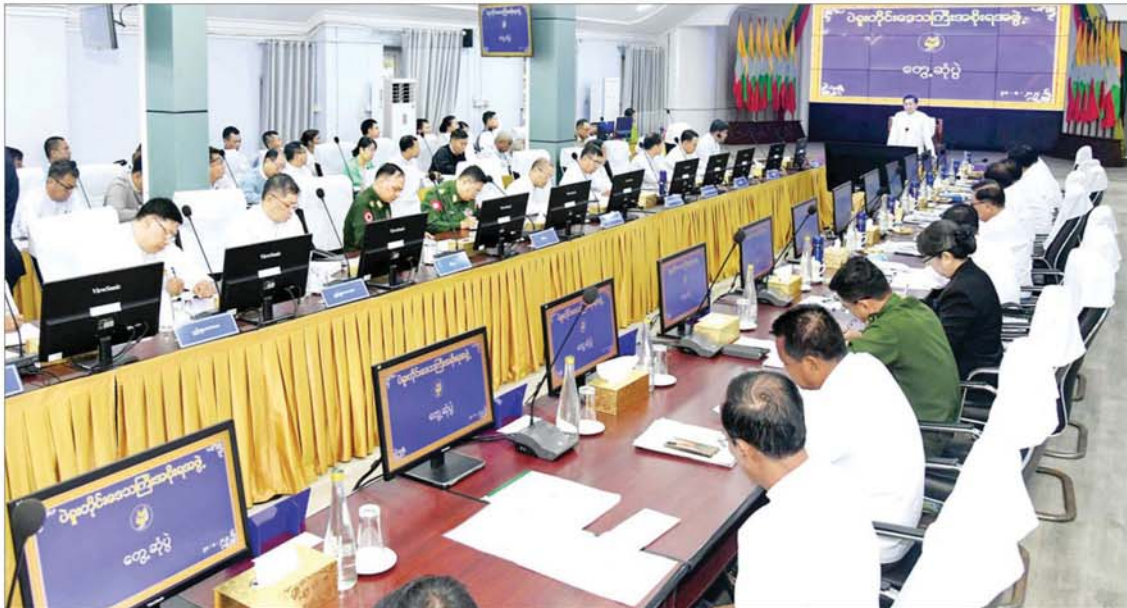
နိုင်ငံတော်စီမံအုပ်ချုပ်ရေးကောင်စီဥက္ကဋ္ဌ နိုင်ငံတော်ဝန်ကြီးချုပ် ဗိုလ်ချုပ်မှူးကြီး မင်းအောင်လှိုင် ပဲခူးတိုင်းဒေသကြီးအစိုးရအဖွဲ့ဝင်များအား တွေ့ဆုံအမှာစကားပြောကြားစဉ်။

ထိုနောက် နိုင်ငံတော်စီမံအုပ်ချုပ်ရေးကောင်စီဥက္ကဋ္ဌ နိုင်ငံတော်ဝန်ကြီးချုပ်က မြန်မာနိုင်ငံ၏ ခေတ်အဆက်ဆက် နိုင်ငံရေးဖြစ်ပေါ် ပြောင်းလဲခဲ့မှုအခြေအနေများ၊ ၂၀၂၀ ပြည့်နှစ် ပါတီနဲ့ ဒီမိုကရေစီ အထွေထွေရွေးကောက်ပွဲတွင် မဲမသမာမှုများဖြစ်ပေါ်ခဲ့သည့် အခြေအနေများနှင့် မဲမသမာမှုများကို တာဝန်ရှိသူများက ပြေငြိမ်းဆောင်ရွက်ပေးခြင်း မရှိခဲ့သည့် အခြေအနေများ၊ နိုင်ငံတော်