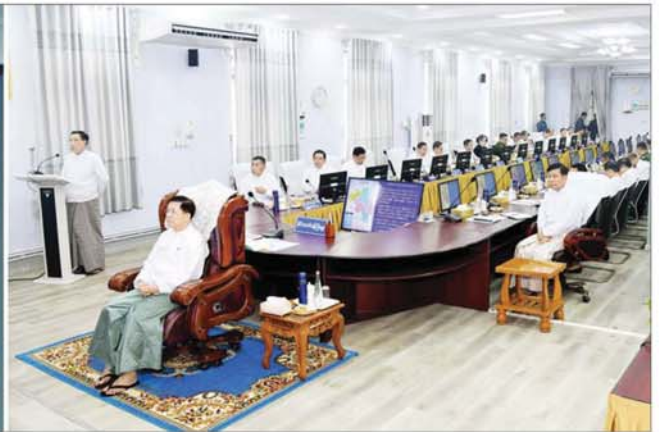
နိုင်ငံတော်စီမံအုပ်ချုပ်ရေးကောင်စီဥက္ကဋ္ဌ နိုင်ငံတော်ဝန်ကြီးချုပ် ဝိုလ်ချုပ်မှူးကြီး မင်းအောင်လှိုင်အား ပဲခူးတိုင်းဒေသကြီးဝန်ကြီးချုပ် ဦးမျိုးဆွေဝင်းက ရှင်းလင်းတင်ပြခြင်း။