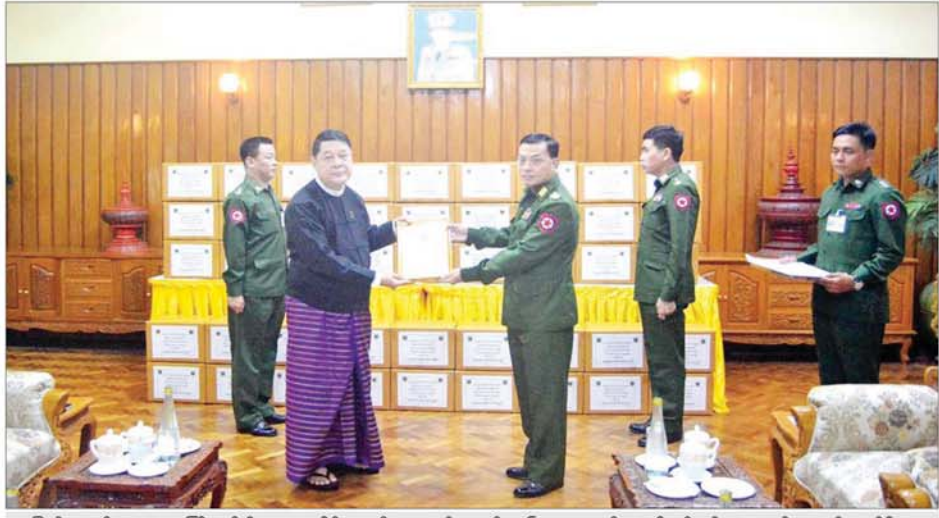
ပြည်ထောင်စုတရားသူကြီးချုပ် ဦးသာဌေး၊ နိုင်ငံတော်ကာကွယ်ရေးနှင့် လုံခြုံရေးတာဝန်များကို စွမ်းစွမ်းတမံ ထမ်းဆောင်လျက်ရှိသော လုံခြုံရေးတပ်ဖွဲ့ဝင်များအတွက် ဂုဏ်ပြုချီးမြှင့်ငွေနှင့် စားသောက်ဖွယ်ရာများ ပေးအပ်စဉ်။

နေပြည်တော် ဩဂုတ် ၃၀ နိုင်ငံတော် ကာကွယ်ရေးနှင့် လုံခြုံရေးတာဝန်များကို စွမ်းစွမ်း တမံ ထမ်းဆောင်လျက်ရှိသော လုံခြုံရေးတပ်ဖွဲ့ဝင်များ အတွက် စေတနာရှင် အလှူရှင်များက ဂုဏ်ပြု ချီးမြှင့်ငွေများနှင့် စားသောက်ဖွယ်ရာများ လာရောက် ဂုဏ်ပြုပေးအပ်လျက်ရှိသည်။ တက်ရောက် ထိုသို့ ပေးအပ်လျက်ရှိရာ ဩဂုတ် ၂၉ ရက်နေ့ ယနေ့တိုတွင် ပြည်ထောင်စု တရားလွှတ်တော် ချုပ် ဝန်ထမ်းမိသားစုများ၊ သာသနာရေးနှင့် ယဉ်ကျေးမှုဝန်ကြီးဌာန ဝန်ထမ်း မိသားစုများနှင့် ပြည်ထောင်စု လွှတ်တော်ရုံး၊ ပြည်သူ့လွှတ်တော်ရုံးနှင့် အမျိုးသား လွှတ်တော်ရုံး ဝန်ထမ်းမိသားစု များက ဂုဏ်ပြုချီးမြှင့်ငွေများနှင့် စားသောက်ဖွယ်ရာများ ဂုဏ်ပြု ပေးအပ်ခြင်းကို နေပြည်တော် တိုင်းစစ်ဌာနချုပ်ရှိ ပေါင်းလောင်း ရိပ်သာ၌ ပြုလုပ်ရာ ပြည်ထောင်စု တရားလွှတ်တော်ချုပ် ပြည်ထောင် စုတရားသူကြီးချုပ် ဦးသာဌေး၊ နေပြည်တော်တိုင်း စစ်ဌာနချုပ် တိုင်းမှူး ဗိုလ်ချုပ်မှူးမင်း၊ သာသနာရေး ဝန်ကြီးဌာနမှ ဒုတိယဝန်ကြီး၊ လွှတ်တော်ရုံးများ နှင့် ဌာနဆိုင်ရာများမှ တာဝန်ရှိသူ များ တက်ရောက်ကြသည်။ ထိုသို့ပေးအပ် လှူဒါန်းရာတွင် ပြည်ထောင်စုတရားလွှတ်တော်ချုပ်