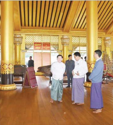
နိုင်ငံတော်စီမံအုပ်ချုပ်ရေးကောင်စီဥက္ကဋ္ဌ နိုင်ငံတော်ဝန်ကြီးချုပ် ဝိုလ်ချုပ်မှူးကြီး မင်းအောင်လှိုင် ပဲခူးမြို့ ကမ္ဘောဇသာဒီရွှေနန်းတော်တွင် ကြည့်ရှုစစ်ဆေးစဉ်။