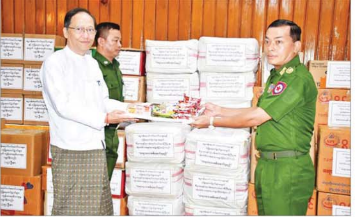
ပြည်ထောင်စုဝန်ကြီး ဒေါက်တာသက်ခိုင်ဝင်း လုံခြုံရေးတပ်ဖွဲ့ဝင်များအတွက် ဂုဏ်ပြုငွေနှင့် စားသောက်ဖွယ်ရာများ ပေးအပ်လှူဒါန်းရာ တိုင်းမှူးက လက်ခံရယူစဉ်။