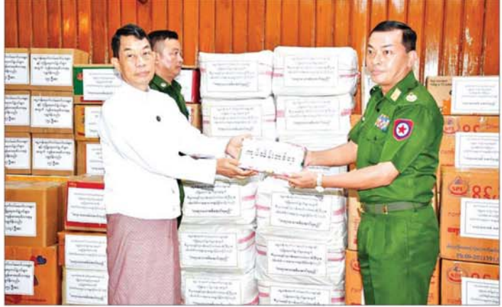
ပြည်ထောင်စုဝန်ကြီး ဦးထွန်းအုံ လုံခြုံရေးတပ်ဖွဲ့ဝင်များအတွက် ဂုဏ်ပြုငွေနှင့် စားသောက်ဖွယ်ရာများ ပေးအပ်လှူဒါန်းရာ တိုင်းမှူးက လက်ခံရယူစဉ်။

သည့် ငွေကျပ်သိန်းတစ်ရာနှင့် ငွေကျပ် သိန်းနှစ်ရာတန်ဖိုးရှိ စားသောက်ဖွယ်ရာ များကို ပြည်ထောင်စု ဝန်ကြီးများနှင့် တာဝန်ရှိသူများက တိုင်းမှူးထံ ဂုဏ်ပြုပေးအပ်ရာ တိုင်းမှူးက ဂုဏ်ပြုမတ်တမ်းလွှာ ပြန်လည်ပေးအပ်ပြီး ကျေးဇူးတင်စကား ပြောကြားသည်။ အဆိုပါ စားသောက်ဖွယ်ရာများ၏ လက်ဝယ်အရောက်ဆက်လက် ပို့ဆောင်ပေးသွားမည်ဖြစ်ကြောင်း သိရသည်။ သတင်းစဉ်