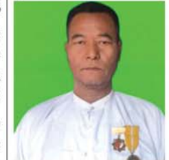
(၉၆)ကြိမ်မြောက် သွေးလှူဒါန်း

မန္တလေးတက္ကသိုလ် ကျန်းမာရေးစောင့်ရှောက်မှုကော်မတီ အနေဖြင့် အဖွဲ့တည်ထောင်သည့် ရက်မှစပြီး ၂၀၂၄ ခု ဩဂုတ် ၂ ရက်အထိ နာမကျန်းဖြစ်သော ဆရာကြီး၊ ဆရာမကြီး စုစုပေါင်း ၃၀၄ ဦးတို့အား ကျန်းမာရေးစောင့်ရှောက်မှုဂါရဝပြုငွေကျပ် ၅၀၅ သိန်း ပေးအပ်နိုင်ခဲ့ကြောင်း သိရသည်။ (အပေါ်ပုံ)(ကဆ)