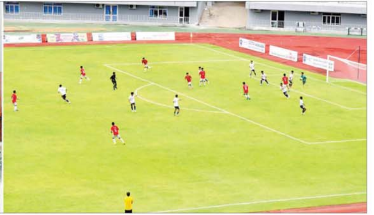
နိုင်ငံတော်စီမံအုပ်ချုပ်ရေးကောင်စီဥက္ကဋ္ဌ နိုင်ငံတော်ဝန်ကြီးချုပ် ဗိုလ်ချုပ်မှူးကြီး မင်းအောင်လှိုင် ၂၀၂၄ ခုနှစ် ဝန်ကြီးဌာနပေါင်းစုံတက္ကသိုလ်များဘောလုံးပြိုင်ပွဲ ဗိုလ်လုပွဲအဖြစ် ပညာရေးဝန်ကြီးဌာန ကိုယ်စားပြုအသင်းနှင့် နယ်စပ်ရေးရာဝန်ကြီးဌာနကိုယ်စားပြုအသင်းတို့ ယှဉ်ပြိုင်ကစားနေမှုကို ကြည့်ရှုအားပေးစဉ်။

ဝ ရှေ့မှ ဌာနဆိုင်ရာ တာဝန်ရှိသူများ ပြိုင်ပွဲကျင်းပရေး ကော်မတီဝင်များနှင့် တာဝန်ရှိသူများ ပြိုင်ပွဲဝင်အသင်းများမှ အုပ်ချုပ်သူနှင့် နည်းပြများအားကစားသမားများ ဝန်ကြီးဌာနပေါင်းစုံ တက္ကသိုလ်များမှ ကျောင်းသား ကျောင်းသူများနှင့် ဆရာ ဆရာမများ၊ ဝန်ကြီးဌာနများမှ ဝန်ထမ်းမိသားစုများ၊ အားကစားဝါသနာရှင် ပြည်သူများ တက်ရောက်ကြည့်ရှုအားပေးကြသည်။ ဦးစွာ နိုင်ငံတော်စီမံအုပ်ချုပ်ရေးကောင်စီဥက္ကဋ္ဌ နိုင်ငံတော်ဝန်ကြီးချုပ်နှင့် တက်ရောက်လာကြသူများသည် ၂၀၂၄ ခုနှစ် ဝန်ကြီးဌာနပေါင်းစုံတက္ကသိုလ်များ ဘောလုံးပြိုင်ပွဲ ဗိုလ်လုပွဲအဖြစ် ပညာရေးဝန်ကြီးဌာန ကိုယ်စားပြုအသင်းနှင့် နယ်စပ်ရေးရာဝန်ကြီးဌာနကိုယ်စားပြုအသင်းတို့ ယှဉ်ပြိုင်ကစားမှုကို ကြည့်ရှုအားပေးသည်။ အဆိုပါပွဲစဉ်တွင် နှစ်ဖက်အသင်းများသည် ဗိုလ်လုပွဲသို့ တက်ရောက်လာကြသည့် အသင်းများဖြစ်သည်နှင့်အညီ တစ်ဖက်နှင့်တစ်ဖက် အပြန်အလှန်အကြိတ်