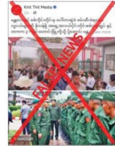
ဆောင်ရွက်နေခြင်းသာ ဖြစ် ကြောင်း၊ စစ်မှုထမ်းဆောင်ခြင်းနှင့် ပတ်သက်၍ ပြည်သူ့စစ်မှုထမ်း

စစ်မှုထမ်းဆောင်ရန် အတွက် ပေါ်တောဆွဲဖမ်းဆီးမှုများကို လုံခြုံ ရေးတပ်ဖွဲ့ဝင်များက လုပ်ဆောင် နေသည့်သတင်းမှာ မှန်ကန်မှုမရှိ ကြောင်း၊ လုံခြုံရေးတပ်ဖွဲ့ဝင်များ အနေဖြင့် တာဝန်ခံပြည်သူများ၏ လုပ်ပေးပေးပို့မှုအရ အကြမ်းဖက် လုပ်ရပ်များ လုပ်ဆောင်မှုမရှိစေ ရန်အတွက် လိုအပ်သည့် နယ်မြေ လုံခြုံရေး ဆောင်ရွက်ခြင်း၊ ရှောင်တခင် စစ်ဆေးခြင်းနှင့် လှည့်ကင်း၊ ပတ်ကင်းများကို တာဝန်ခံပြည်သူများနှင့် ပူးပေါင်း