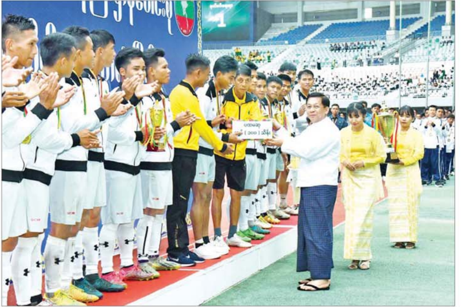
နိုင်ငံတော်စီမံအုပ်ချုပ်ရေးကောင်စီဥက္ကဋ္ဌ နိုင်ငံတော်ဝန်ကြီးချုပ် ဗိုလ်ချုပ်မှူးကြီး မင်းအောင်လှိုင် ပထမဆုရရှိသည့် နယ်စပ်ရေးရာဝန်ကြီးဌာနကိုယ်စားပြုအသင်းအား ဂုဏ်ပြုဆုငွေများ ပေးအပ်ချီးမြှင့်စဉ်။

အနယ် ဖိအားပေးယှဉ်ပြိုင်ကြပြီး ပထမပိုင်းပွဲကစားချိန် ပြီးဆုံးချိန်အထိ ဂိုးရရှိခဲ့မှုမရှိဘဲ ဒုတိယပိုင်းပွဲကစားချိန် ၆၈ မိနစ်တွင် နယ်စပ်ရေးရာဝန်ကြီးဌာန ကိုယ်စားပြုအသင်းက အနိုင်ဂိုးသွင်းယူရရှိခဲ့ကာ ပွဲကစားချိန်ပြီးဆုံးချိန်တွင် ၁ ဂိုး-ဂိုးမရှိဖြင့် အနိုင်ရဗိုလ်ခွဲသွားခဲ့သည်။ ပြိုင်ပွဲအပြီးတွင် ဆုချီးမြှင့်ခြင်းအခမ်းအနားကို ဆက်လက်ကျင်းပရာ ပြိုင်ပွဲတွင် အကောင်းဆုံး (ဂိုးသမား) ဆုနှင့် အကောင်းဆုံး (နောက်တန်း) ဆုကို ပြည်ထောင်စုဝန်ကြီးများဖြစ်ကြသည့် ဒေါက်တာညွန့်ဖေနှင့် ဦးကိုကိုလှိုင်တို့က လည်းကောင်း၊ အကောင်းဆုံး (အလယ်တန်း) ဆု၊ အကောင်းဆုံး (ရှေ့တန်း) ဆု၊ ဂိုးသွင်းအများဆုံးအားကစားသမားဆုနှင့် ပွဲစဉ်တစ်လျှောက် အကောင်းဆုံးအားကစားသမားဆုရရှိသူများကို ကောင်စီအဖွဲ့ဝင်များဖြစ်ကြသည့် ဦးရန်ကျော်၊ ဦးကျော်စိမ်း၊ ခွန်စံလှိုင်၊ ဒေါက်တာတရွှေတို့က လည်းကောင်း တစ်ဦးချင်းအကောင်းဆုံးဆုတံဆိပ်များနှင့် ဂုဏ်ပြုဆုငွေများ ပေးအပ်ချီးမြှင့်ကြသည်။