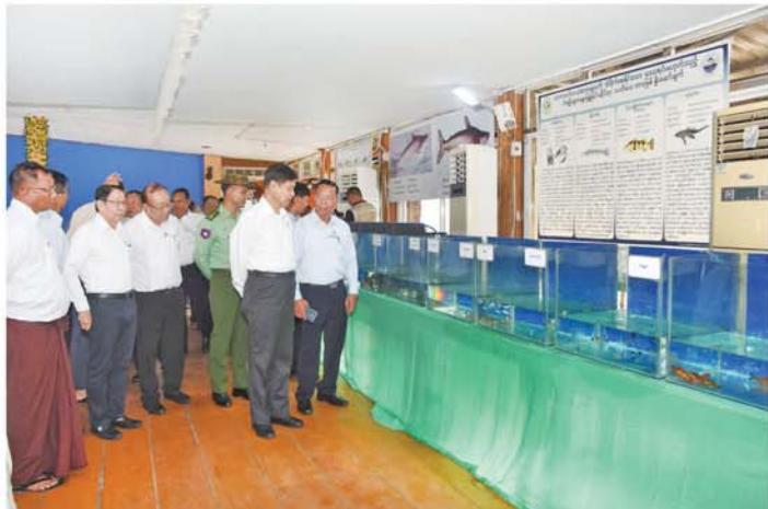
(မန္တလေးနေ့စဉ်)

တိုင်းဒေသကြီး ဝန်ကြီးချုပ်နှင့်အဖွဲ့သည် ငါးလုပ်ငန်းဦးစီးဌာနမှပြသထားသည့် ပြခန်းများအား လှည့်လည်ကြည့်ရှုအားပေးပြီး တိုင်းဒေသကြီးဝန်ကြီးချုပ် ဦးဆောင်၍ အစိုးရအဖွဲ့ဝန်ကြီးများ၊ ဌာနဆိုင်ရာများမှ တာဝန်ရှိသူများနှင့် တက်ရောက်လာကြသူများက ဧရာဝတီမြစ်အတွင်း ငါးမြစ်ချင်း၊ ငါးခုံးမကြီးစသည့် ၂ လက်မအရွယ် ငါးသားပေါက်ကောင်ရေ ၄ ဒသမ ၉ သိန်းကို ငါးမျိုးစိုက်ထည့်ပေးခဲ့ကြောင်း သိရသည်။