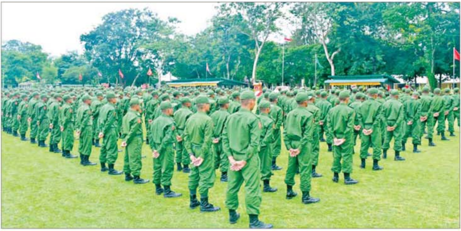
ပြည်သူ့စစ်မှုထမ်း သင်တန်းအမှတ်စဉ်(၅) သင်တန်းဖွင့်ပွဲ ကျင်းပစဉ်။

နေပြည်တော် စက်တင်ဘာ ၉ နိုင်ငံတော် ကာကွယ်ရေးနှင့် လုံခြုံရေးတာဝန်ထမ်းဆောင်နိုင် ရန်အတွက် ပြည်သူ့စစ်မှုထမ်း သင်တန်းအမှတ်စဉ် (၅)တွင် ပါဝင်တက်ရောက်ကြမည့် အရည် အချင်းကိုကန့်သတ် နိုင်ငံသား ကောင်းများသည် သက်ဆိုင်ရာ တိုင်းစစ်ဌာနချုပ် နယ်မြေများရှိ သင်တန်းကျောင်း အသီးသီးသို့ ရောက်ရှိ၍ လိုအပ်သည့်ကြိုတင် ပြင်ဆင်မှုများကို ဆောင်ရွက် ကြပြီး ယနေ့နံနက်ပိုင်းတွင် အဆိုပါ သင်တန်းကျောင်း အသီး သီး၌ ပြည်သူ့စစ်မှုထမ်း သင်တန်း အမှတ်စဉ်(၅) သင်တန်းဖွင့်ပွဲများ ပြုလုပ်ကြသည်။ သင်တန်းဖွင့်ပွဲ များတွင် သင်တန်းကျောင်းများ အလိုက် ကျောင်းအုပ်ကြီးများက သင်တန်းဖွင့် အမှာစကားများ ပြောကြားကြသည်။ အဆိုပါ သင်တန်းဖွင့်ပွဲများသို့ နေပြည်တော်ကောင်စီ ဥက္ကဋ္ဌ၊ တိုင်းဒေသကြီးနှင့် ပြည်နယ် ဝန်ကြီးချုပ်များ၊ တိုင်းမှူးများနှင့် တာဝန်ရှိသူများ တက်ရောက်၍ ပြည်သူ့စစ်မှုထမ်း သင်တန်း အမှတ်စဉ်(၅)မှ သင်တန်းသား များအားတွေ့ဆုံကာ သင်တန်း သားများအတွက် ဂုဏ်ပြုချီးမြှင့် ငွေများနှင့် ထောက်ပံ့ပစ္စည်းများ ပေးအပ်ကြပြီး သင်တန်းသားများ အား ရင်းရင်းနှီးနှီး လိုက်လံ နှုတ်ဆက် အားပေးခဲ့ကြသည်။ ပြည်ထောင်စု မပြိုကွဲရေး၊ တိုင်းရင်းသား စည်းလုံးညီညွတ် မှုမပြိုကွဲရေးနှင့် အချုပ်အခြာ