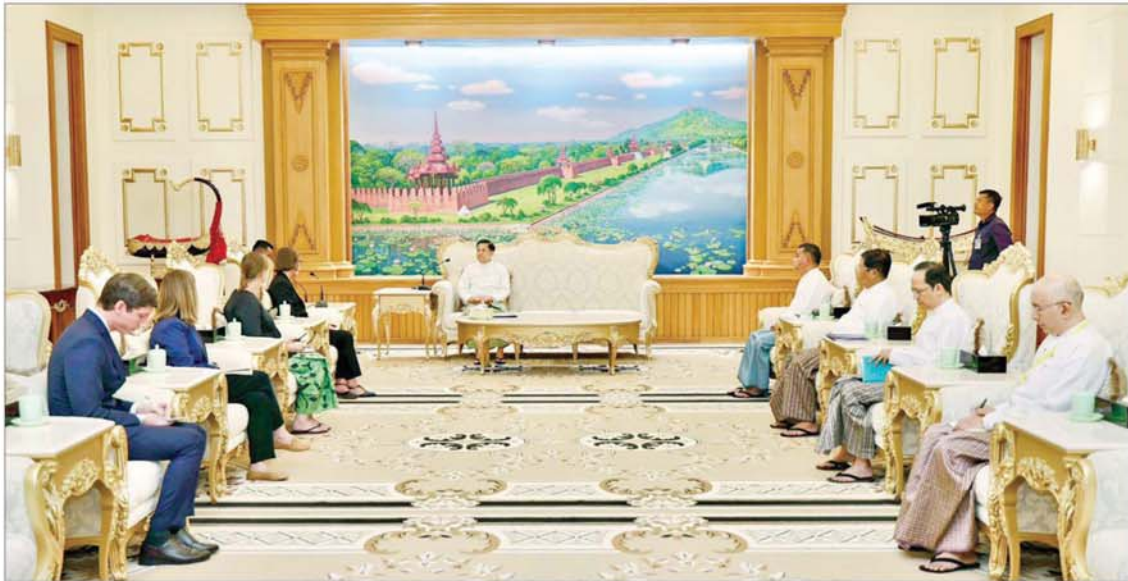
နိုင်ငံတော်စီမံအုပ်ချုပ်ရေးကောင်စီဥက္ကဋ္ဌ နိုင်ငံတော်ဝန်ကြီးချုပ် ဗိုလ်ချုပ်မှူးကြီး မင်းအောင်လှိုင် အပြည်ပြည်ဆိုင်ရာ ကြက်ခြေနီကော်မတီ (International Committee of the Red Cross - ICRC) ဥက္ကဋ္ဌ Ms. Mirjana Spoljaric Egger ဦးဆောင်သည့် ကိုယ်စားလှယ်အဖွဲ့အား လက်ခံတွေ့ဆုံစဉ်။

အမြင်ချင်းဖလှယ်ဆွေးနွေး ထိုသို့တွေ့ဆုံရာတွင် အပြည်ပြည်ဆိုင်ရာ ကြက်ခြေနီ ကော်မတီအနေဖြင့် မြန်မာနိုင်ငံ၌ လူသားချင်းစာနာထောက်ထားမှုဆိုင်ရာ အကူအညီပေးရေး ကိစ္စရပ်များ ဆောင်ရွက်လျက်ရှိမှုအခြေအနေများ၊ အကူအညီလိုအပ်လျက်ရှိသည့် ပြည်သူများလက်ဝယ်သို့ လိုအပ်သည့် ကူညီထောက်ပံ့မှုများ အမှန်တကယ် ရောက်ရှိစေရေးနှင့် မသက်ဆိုင်သည့် အဖွဲ့အစည်းများထံသို့ မရောက်ရှိစေရေး သက်ဆိုင်ရာဝန်ကြီးဌာနများနှင့် ပူးပေါင်းဆောင်ရွက်ရန် လိုအပ်မှုအခြေအနေများ၊ တပ်မတော်အနေဖြင့် ကိုနိုဗာ ကွန်ဗင်းရှင်းနှင့်ဆိုင်ဆောင်ရွက်လျက်ရှိမှု အခြေအနေများနှင့် ပတ်သက်၍ရင်းနှီး ပွင့်လင်းစွာ အမြင်ချင်းဖလှယ် ဆွေးနွေးခဲ့ကြသည်။ အဆိုပါတွေ့ဆုံပွဲသို့ နိုင်ငံတော်စီမံ (International Committee of the Red Cross-ICRC) ဥက္ကဋ္ဌနှင့်အတူ ကိုယ်စားလှယ်အဖွဲ့ဝင်များ တက်ရောက်ခဲ့ကြကြောင်း အတွင်းရေးမှူး ဗိုလ်ချုပ်ကြီး ရဲဝင်းဦး၊