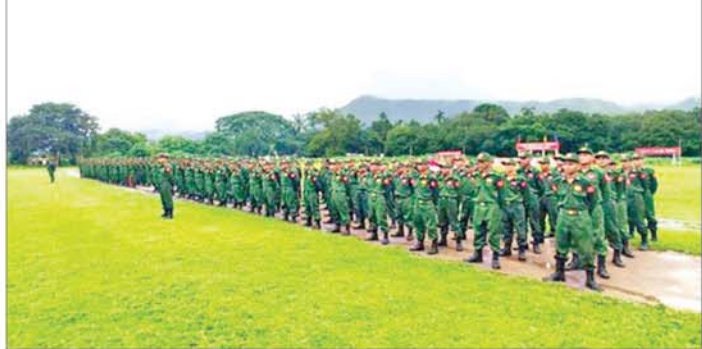
ပြည်သူ့စစ်မှုထမ်း သင်တန်းအမှတ်စဉ်(၅) သင်တန်းဖွင့်ပွဲ ကျင်းပစဉ်။