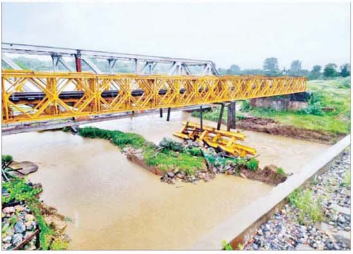
ရန်ကုန်-မန္တလေးရထားလမ်းပိုင်း ရှမ်းရွာနှင့် ရမည်းသင်းဘူတာအကြား ရေတိုက်စားမှုကြောင့် တံတားအမှတ်(၅၂၉) LST ဒေါက်တိုင်ပြတ်ထွက်မှုကိုတွေ့ရစဉ်။