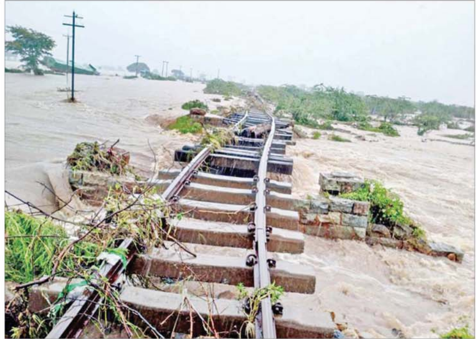
သာစည်-ရွှေညောင်လမ်းပိုင်း လှိုင်းတက်နှင့်ဘုရားငါးဆူကြား တံတားရေတိုက်စားမှုကို တွေ့ရစဉ်။

ဘူတာယာဒ်ဝင်းအတွင်း သံလမ်းမျက်နှာပြင်အထက် ၁၀ လက်မခန့် ရေကျော်နေခြင်းတို့ကြောင့် ယနေ့ နံနက်ပိုင်းမှ စတင်၍ ရထားလမ်းပိုင်းများအား ယာယီပိတ်သိမ်းခဲ့ရသည်။ ထို့အတူ တောင်ကြီးမြို့နယ်အတွင်း စက်တင်ဘာ ၉ရက်မှစ၍ မိုးသည်းထန်စွာ ရွာသွန်းမှုကြောင့် ရွှေညောင်-တောင်ကြီးလမ်းပိုင်း၊ ထီသိမ်-ပေါမုဘူတာအကြား တောင်ကြီးမြို့သို့ ရေပေးဝေသည့် ထီသိမ်ကန်မှ ရေများလျှံပြီး ရထားလမ်းတူးမြောင်း တာပေါင်ရေတိုက်စားမှုကြောင့် တာပေါင်ပြိုကျပြီး ရထားလမ်း ပိတ်ဆို့ခြင်းတို့ ဖြစ်ပေါ်ခဲ့သည်။