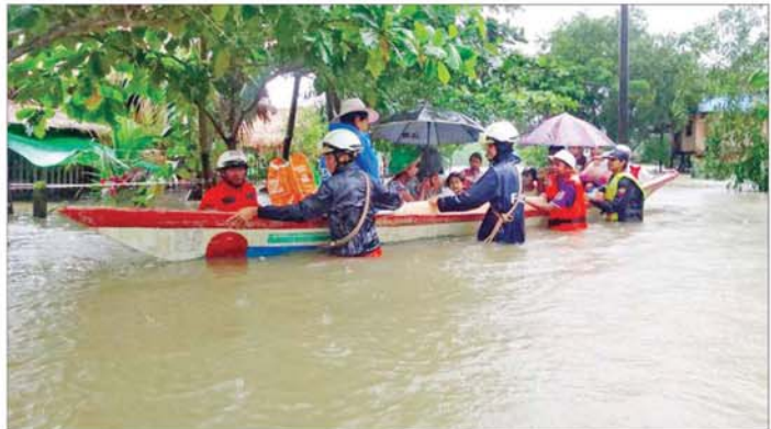
ကျိုက်ထိုမြို့နယ်၌ ရေဘေးသင့်ပြည်သူများအား ကူညီကယ်ဆယ်ရေးလုပ်ငန်းများ ဆောင်ရွက်နေစဉ်။