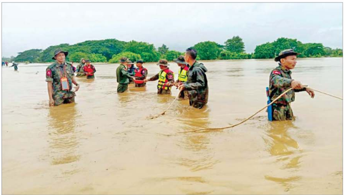
နေပြည်တော် ပုဗ္ဗသီရိမြို့နယ် ဆင်ကဲကြီးရွာနှင့် ဝေယျာသီရိမြို့နယ် သိုက်ချောင်းကျေးရွာကို ဆက်သွယ်ထားသော ကွန်ကရစ်လမ်း(မြို့ပတ်လမ်း) ရေကျော်သဖြင့် နယ်မြေခံတပ်မတော်သားများက ကူညီကယ်ဆယ်ရေးလုပ်ငန်းများ ဆောင်ရွက်စဉ်။

နေပြည်တော် စက်တင်ဘာ ၁၁ တောင်တရုတ် ပင်လယ်ပြင်တွင် ဖြစ်ပေါ်ခဲ့သော တိုင်းပွန်းမုန်တိုင်း ရာဂီ၏ အရှိန်နှင့် ဘင်္ဂလားပင်လယ်အော်အနောက် အလယ်ပိုင်းနှင့် အနောက်မြောက်ပိုင်းတို့တွင် ဖြစ်ပေါ်နေသော မုန်တိုင်းငယ်၏ အရှိန်ကြောင့် နေပြည်တော်ဝန်းကျင်၌ စက်တင်ဘာ ၈ ရက်တွင် နေရာကျကျ၊ ၉ ရက်တွင် နေရာစိပ်စိပ်၊ ၁၀ ရက်နှင့် ၁၁ ရက်တို့တွင် နေရာအနှံ့အပြား မိုးအဆက်မပြတ်ရွာသွန်းခဲ့ပြီး ယနေ့တွင် မိုးရေချိန် အနည်းဆုံး သူညီ ၁၁၀ မီမီ လက်မမှ အများဆုံး ၄၁၀ မီမီ ၂ လက်မ အထိ ရွာသွန်းခဲ့ကာ နေပြည်တော်ကောင်စီနယ်မြေအတွင်း ဖြတ်သန်းစီးဆင်းလျက် ရှိသည့် ငလိုက်ချောင်း၊ ဆင်သေချောင်းနှင့် ပေါင်းလောင်းမြစ်တို့တွင် ရေများ အဆက်မပြတ်ဖြင့်တက်လျက်ရှိသည်။