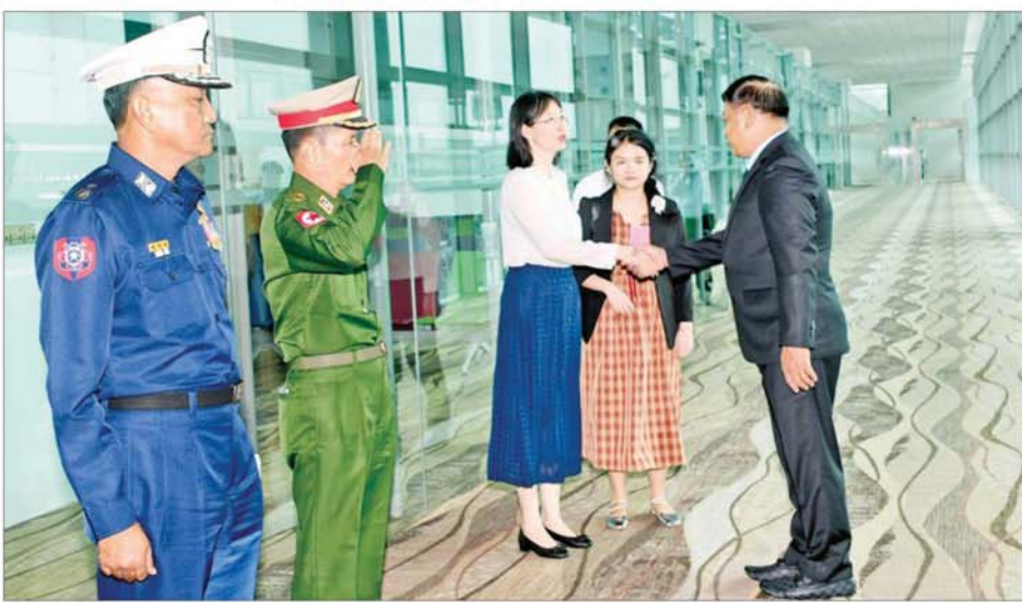
ပြည်သူ့သမ္မတနိုင်ငံသို့ ထွက်ခွာသွားသည့် ဦးဆောင်မှုတစ်ဆက် နိုင်ငံတော် စီမံအုပ်ချုပ်ရေးကောင်စီအဖွဲ့ဝင် ဒုတိယဝန်ကြီးချုပ်နှင့် ပြည်ထောင်စုဝန်ကြီးဗိုလ်ချုပ်ကြီး တင်အောင်စန်း ဦးဆောင်သော မြန်မာကိုယ်စားလှယ်အဖွဲ့အား ရန်ကုန်တိုင်းစစ်ဌာနချုပ် တိုင်းမှူး၊ မြန်မာနိုင်ငံဆိုင်ရာ တရုတ်ပြည်သူ့သမ္မတနိုင်ငံ သံရုံးနှင့် စစ်သံရုံးမှ တာဝန်ရှိသူများနှင့် တပ်မတော်အရာရှိကြီးများက ရန်ကုန်အပြည်ပြည်ဆိုင်ရာလေဆိပ်၌ ဝိုင်းဆောင်ရွက်ဆက်ခံကြကြောင်း သိရသည်။ သတင်းစဉ်

ရန်ကုန် စက်တင်ဘာ ၁၁ နိုင်ငံတော် စီမံအုပ်ချုပ်ရေးကောင်စီအဖွဲ့ဝင် ဒုတိယဝန်ကြီးချုပ်နှင့် ကာကွယ်ရေးဝန်ကြီးဌာန ပြည်ထောင်စုဝန်ကြီးဗိုလ်ချုပ်ကြီး တင်အောင်စန်း ဦးဆောင်သော မြန်မာကိုယ်စားလှယ်အဖွဲ့သည် တရုတ်ပြည်သူ့ သမ္မတနိုင်ငံ အမျိုးသားကာကွယ်ရေးဝန်ကြီးဌာန ဝန်ကြီးဗိုလ်ချုပ်ကြီး တန်ကျွင်း (Admiral Dong Jun) ၏ ဖိတ်ကြားချက်အရ ပေကျင်းမြို့၌ ကျင်းပပြုလုပ်မည့် (၁၁)ကြိမ်မြောက် ပေကျင်းရှန်ကျွန်းဖိုရမ် (11 th Beijing Xiangshan Forum) သို့ တက်ရောက်ရန် ယနေ့ မွန်းလွဲပိုင်းတွင် ရန်ကုန်မြို့မှ လေကြောင်းခရီးဖြင့် တရုတ်