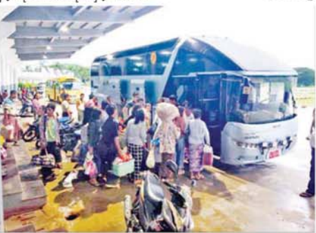
ရန်ကုန်-မန္တလေး အမှတ်(၁၁)အဆန် လူဦးအမြန်ရထားစီးခရီးသည်များအား နေပြည်တော်ဘူတာမှ မန္တလေးသို့ မော်တော်ယာဉ်များဖြင့် ပို့ဆောင်ပေးနေစဉ်။

သာစည်-ရွှေညောင်လမ်းပိုင်းအတွင်း ရထားများ စစ်ဆေးပြင်ပြီးပါက ရထားများ ပုံမှန်အတိုင်း ပြန်လည်ပြေးဆွဲပေးသွားမည်ဖြစ်ကြောင်း မိုးရထားမှ သိရသည်။