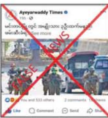
အဆိုပါသတင်းနှင့်ပတ်သက်၍ တာဝန်ရှိသူတစ်ဦး၏ ပြောကြား

နေပြည်တော် စက်တင်ဘာ ၁၁ ချင်းပြည်နယ် မင်းတပ်မြို့တွင် စက်တင်ဘာ ၇ ရက် တစ်ရက်တည်းတွင် အရပ်သား သုံးဦးထက် မနည်း လုံခြုံရေးတပ်ဖွဲ့ဝင်များက ဖမ်းဆီးခေါ်ဆောင်သွားကြောင်း တရားမဝင်ပြည်ဖျက်မီဒီယာများက မဟုတ်မမှန်သတင်းအများများ ရေးသားဖြန့်ဝေလျက်ရှိကြောင်း သိရသည်။