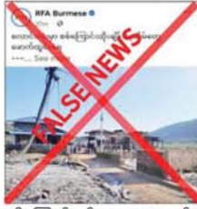
မရှိကြောင်းနှင့် PDF အမည်ခံ အကြမ်းဖက် သမားများက လောင်းလုံမြို့နယ်ရှိ ကျေးရွာအချို့

နေပြည်တော် စက်တင်ဘာ ၁၁ တနင်္လာရက်တိုင်း ဒေသကြီး လောင်းလုံမြို့နယ်ရှိ သဘောဆီဝဲကျေးရွာနှင့် ပြင်ကြီးကျေးရွာတို့ကို စက်တင်ဘာ ၁၀ ရက်က လုံခြုံရေးတပ်ဖွဲ့ဝင်များ ဝင်ရောက် စီးနင်းပြီး နေအိမ်ခြောက်လုံးကို မီးရှို့ဖျက်ဆီးခြင်းနှင့် အဖိုးတန်ပစ္စည်းများကို ယူဆောင်သွားခဲ့ကြောင်း တရားမဝင်ပြည်ဖျက်မီဒီယာများက လုပ်ကြံရေးသား