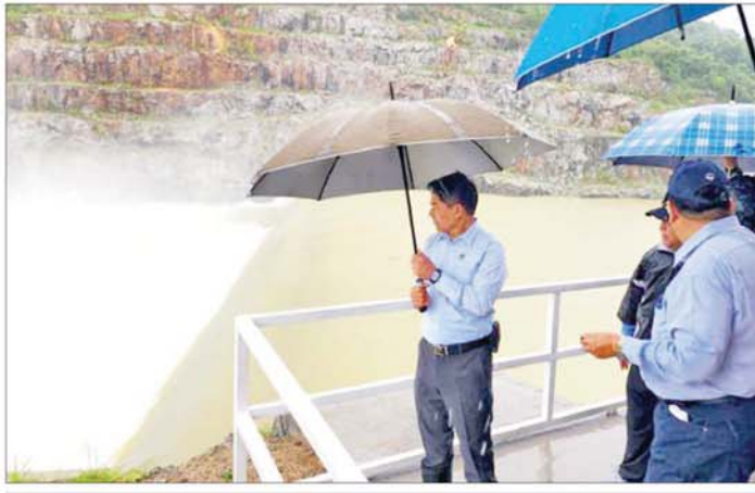
ပြည်ထောင်စုဝန်ကြီး ဦးမင်းနောင် ပေါင်းလောင်းရေလှောင်တံခွန်အား ကြည့်ရှုစစ်ဆေးစဉ်။

နေပြည်တော် စက်တင်ဘာ ၁၁ စိုက်ပျိုးရေး၊ မွေးမြူရေးနှင့် ဆည်မြောင်း ဝန်ကြီးဌာန ပြည်ထောင်စုဝန်ကြီးဦးမင်းနောင်သည် ဆည်မြောင်းနှင့်ရေအသုံးချမှုစီမံခန့်ခွဲရေးဦးစီးဌာန ညွှန်ကြားရေးမှူးချုပ်နှင့် တာဝန်ရှိသူများနှင့်အတူ ပြည်ထောင်စုနယ်မြေ နေပြည်တော်ရှိ ရေဆင်းနှင့် ပေါင်းလောင်းရေလှောင်တံခွန်များ၊ ပင်လောင်းလမ်း ဆုံနေရာ၊ ဆင်သေချောင်းနှင့် ငလိုက်ချောင်းများသို့ သွားရောက်၍ မိုးသည်းထန်စွာ ရွာသွန်းမှုကြောင့် ရေဝင်ရောက်မှုများဖြစ်ပေါ်နေမှုကို ထိန်းသိမ်းစီမံ ဆောင်ရွက်နေမှု၊ တံခွန်များ၏ကြိုခိုင်မှုအခြေအနေ စောင့်ကြည့်စီမံနေမှုနှင့် ချောင်းများ၏ ရေစီးဆင်းမှု အခြေအနေတို့ကို ကွင်းဆင်းကြည့်ရှုစစ်ဆေးပြီး ချောင်းရေမြင့်တက်လာမှုကြောင့် ချောင်းဧရိယာ အတွင်းနှင့် အနိမ့်ပိုင်းနေရာများတွင် ရေဝင်ရောက် မှုများရှိနိုင်ပါက ကြိုတင်အသိပေး ကြေညာမှုများ ဆောင်ရွက်ရန်၊ ကူညီကယ်ဆယ်ရေးလုပ်ငန်းများကို ဆက်စပ်ဌာနအဖွဲ့အစည်းများနှင့် ပူးပေါင်းဆောင်ရွက် ရန်တို့ကို တာဝန်ရှိသူများအား မှာကြားသည်။ ကန်ရေပြည့်အမှတ်သို့ရောက်ရှိ ယနေ့နံနက် ၆ နာရီ ရေမှတ်တိုင်တာမူများအရ ပြည်ထောင်စုနယ်မြေ နေပြည်တော်ရှိ ရေလှောင်တံခွန် များအနက် ပေါင်းလောင်းရေလှောင်တံခွန်ခံသာ ရေပိုလွှဲမှု ၆ ဒသမ ၀၆ ပေ ရေကျော် စီးဆင်းနေပြီး