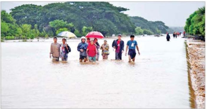
ပြည်ထောင်စုနယ်မြေ နေပြည်တော်၌ မိုးအဆက်မပြတ်ရွာသွန်းမှုကြောင့် လမ်းများပေါ်တွင် ရေကျော်လျက်ရှိသည်ကို တွေ့ရစဉ်။

မရကြောင်း သိရသည်။ အဆိုပါ ရေကြီး ရေလျှံမှုများကြောင့် ရပ်ကွက်၊ ကျေးရွာများမှ လူနှင့် တိရစ္ဆာန်များ ဘေးလွတ်ရာသို့ ရွှေ့ပြောင်းပေးနိုင်ရေး သက်ဆိုင် ရာ နေပြည်တော်ကောင်စီ မြို့နယ်၊ ရပ်ကွက်များနှင့် ကျေးရွာများ အလိုက် တာဝန်ရှိသူများ၊ တပ်မတော်သားများနှင့် မြန်မာ နိုင်ငံရဲတပ်ဖွဲ့ဝင်များ၊ မီးသတ် တပ်ဖွဲ့ဝင်များ၊ ကြက်ခြေနီတပ်ဖွဲ့ ဝင်များ၊ ပရဟိတအသင်းအဖွဲ့ များက အချိန်နှင့်တစ်ပြေးညီ ကူညီ ကယ်ဆယ်ရေးလုပ်ငန်းများ ကို အင်တိုက်အားတိုက်ဖြင့် တက်ကြွစွာ ဆောင်ရွက်ပေးလျက် ရှိသည်။ အလားတူ မွန်ပြည်နယ် ကျိုက်ထိုမြို့နယ်တွင် မိုးသည်း ထန်စွာရွာသွန်း၍ တောင်ကျရေ များ စီးဆင်းလာမှုကြောင့် ကဒတ် ချောင်းရေ မြင့်တက်လာကာ