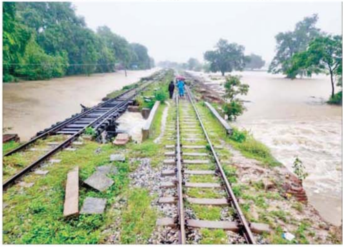
ရန်ကုန်-မန္တလေးရထားလမ်းပိုင်း ရမည်းသင်းနှင့် အင်ကျင်းကန်ဘူတာအကြား ရထားလမ်းနှင့် တံတားများရေတိုက်စားမှုကိုတွေ့ရစဉ်။