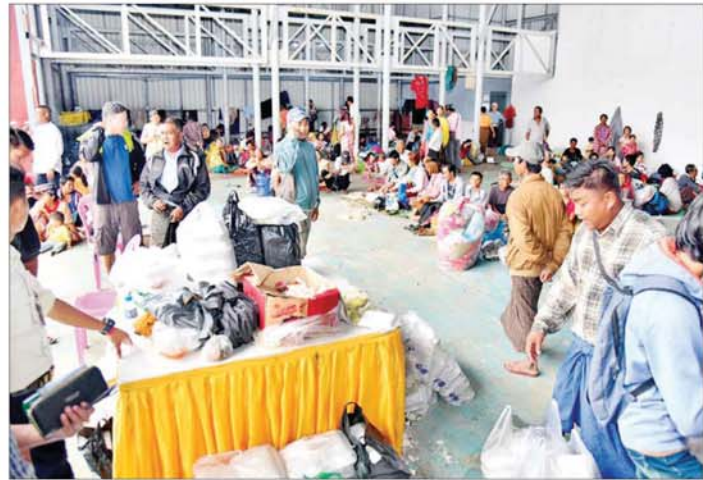
တပေါင်ကွင်း ယာယီရေဘေးရှောင်စခန်း၌ ခိုလှုံလျက်ရှိသည့် ရေဘေးသင့်ပြည်သူများကို တွေ့ရစဉ်။

၀ ရှေ့မှ အဆင့်ဆင့်ပြောင်းရွှေ့ နေရာချ ထားပေးလျက်ရှိသည်။ ကုသမှုများဆောင်ရွက်ပေး သက်ဆိုင်ရာရေဘေးကယ်ဆယ် ရေးစခန်းများသို့ ရောက်ရှိလာကြ သည့် ရေဘေးသင့်ပြည်သူများကို ကျန်းမာရေးဝန်ကြီးဌာန ကုသ ရေးဦးစီးဌာနမှ တာဝန်ရှိသူများ နှင့် ဝန်ထမ်းများက သာမန်ထိရ သက်ရောက်မှု၊ နှာစေး၊ ချောင်းဆိုး၊ များနာရောဂါများကို ကုသပေး လျက်ရှိပြီး သာမန်ထိရသက်ရ ခံမှုများကို ပိုမိုထိခိုက်သည့် လူနာ များကို ဆေးရုံကြီးများသို့ ပို့ဆောင် ၍ ကုသမှုများဆောင်ရွက်ပေး လျက်ရှိသည်။ ထို့ပြင် စေတနာရှင်ပြည်သူများ၊ တပ်မတော် မိသားစုဝင်များ၊ ဝန်ထမ်းများ၊ အသင်းအဖွဲ့များ