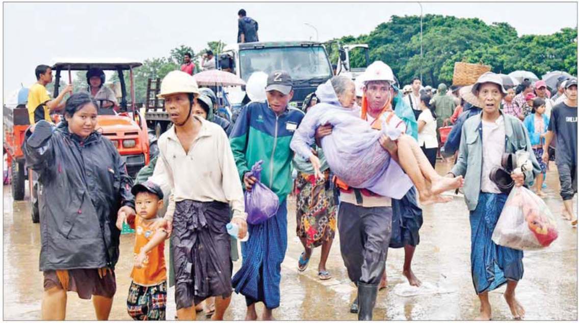
ကူညီကယ်ဆယ်ရေးအဖွဲ့များက ရေဘေးသင့်ပြည်သူများအား ရေဘေးလွတ်ရာ ယာယီရေဘေးကယ်ဆယ်ရေးစခန်းများသို့ ပြောင်းရွှေ့ပေးစဉ်။

နေပြည်တော် စက်တင်ဘာ ၁၂ နေပြည်တော် ကောင်စီနယ်မြေအတွင်း မိုးသည်းထန်စွာရွာသွန်းမှုကြောင့် မြစ်ရေ ချောင်းရေများ မြင့်တက်လာပြီး ပျဉ်းမနားမြို့နယ်၊ တပ်ကုန်းမြို့နယ်၊ ဇေယျာသီရိမြို့နယ်နှင့် ပုဗ္ဗသီရိမြို့နယ်တို့မှ ရပ်ကွက်၊ ကျေးရွာများတွင် ရေနစ်မြုပ်မှုများ ဖြစ်ပွားလျက်ရှိသည့် အတွက် လတ်တလောတွင် ယာယီရေဘေးရှောင်စခန်းများ ဖွင့်လှစ်ပြီး ကူညီကယ်ဆယ်ရေးလုပ်ငန်းများ ဆောင်ရွက်ပေးလျက်ရှိသည်။ ပြောင်းရွှေ့နေရာချထားပေးအဆိုပါ ရပ်ကွက်၊ ကျေးရွာများမှ ရေဘေးသင့်ပြည်သူများကို တပ်မတော်သားများ၊ မြန်မာနိုင်ငံရဲတပ်ဖွဲ့ဝင်များ၊ မီးသတ်တပ်ဖွဲ့ဝင်များ၊ အုပ်ချုပ်ရေးဆိုင်ရာအဖွဲ့အစည်းများ၊ မြန်မာနိုင်ငံကြက်ခြေနီအသင်း၊ လူမှုရေးအသင်းအဖွဲ့များနှင့် ပြည်သူများက ရေဘေးလွတ်ရာ ယာယီ ရေဘေးကယ်ဆယ်ရေးစခန်းများသို့ စက်လှေများ၊ မော်တော်ယာဉ်များဖြင့် စာမျက်နှာ ၅ သို့ ၀