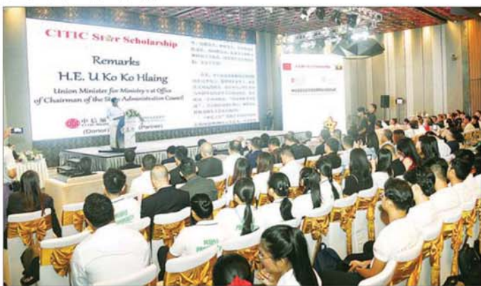
ပြည်ထောင်စုဝန်ကြီး ဦးကိုကိုလှိုင် CITIC Myanmar Scholarship ပေးအပ်ပွဲအခမ်းအနားတွင် အမှာ စကားပြောကြားစဉ်။

ရန်ကုန် စက်တင်ဘာ ၁၂ နိုင်ငံတော်စီမံအုပ်ချုပ်ရေးကောင်စီ ဥက္ကဋ္ဌရုံး ဝန်ကြီးဌာန (၂) ပြည်ထောင်စုဝန်ကြီး ဦးကိုကိုလှိုင် သည် ယနေ့ နံနက်ပိုင်းတွင် ရန်ကုန်မြို့၊ မင်္ဂလာတောင်ညွန့် မြို့နယ် ဝင်းဒမ်ဂရမ်း ရန်ကုန် ဟိုတယ်၌ ကျင်းပပြုလုပ်သည့် CITIC Myanmar နှင့် တရုတ်နိုင်ငံ ကျေးလက်ဒေသ ဖွံ့ဖြိုးတိုးတက် ရေးဖောင်ဒေးရှင်း (China Foundation For Rural Development-CFRD) တို့ ပူးပေါင်းကျင်းပသော CITIC Star Scholarship ပေးအပ် ပွဲအခမ်းအနားသို့ တက်ရောက် ချီးမြှင့်သည်။