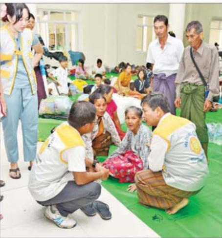
မင်္ဂလာဗျူဟာ ယာယီရေဘေးရှောင်စခန်း၌ ရေဘေးသင့်ပြည်သူ များအား ဆေးဝါးကုသမှုလုပ်ငန်းများ ဆောင်ရွက်ပေးစဉ်။

အခြေအနေမရှိကြောင်း၊ အဆိုပါ ချောင်းဘေး တစ်လျှောက်တွင် နေထိုင်လျက်ရှိသည့် လူနေအိမ် များမှ အိမ်ထောင်စုများကို အရေး ပေါ် ရွှေ့ပြောင်းထားရှိနိုင်ရေး ယာယီရေဘေးရှောင်စခန်း ၁၆ ခုကို စီစဉ်ဆောင်ရွက်လျက်ရှိ သည်။ ကူညီကယ်ဆယ်နေရာချထား နေပြည်တော်ကောင်စီနယ်မြေ အတွင်း လတ်တလောတွင် ရေဘေးသင့်သည့် ရပ်ကွက်၊ ကျေးရွာအုပ်စု ၄၃ စုမှ ရေဘေး သင့်ပြည်သူများကို သက်ဆိုင်ရာ မြို့နယ်အလိုက် ဖွင့်လှစ်ထားသည့် ယာယီရေဘေးရှောင်စခန်း ၃၅ ခု ၌ ကူညီကယ်ဆယ်နေရာချထား ပြီး ကျန်းမာရေးစောင့်ရှောက်မှု များပေးလျက်ရှိကြောင်း သိရ သည်။ သတင်းစဉ်