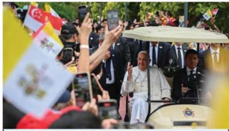
အာရှ-ပစိဖိတ်စရီးစဉ်၏ နောက်ဆုံးဌာနဖြစ်သော စင်ကာပူ နိုင်ငံသို့ စက်တင်ဘာ ၁၁ရက်က ပုပ်ရဟန်းမင်းကြီး ဖရန်စစ် ရောက်ရှိလာရာ စောင့်ကြည့်ပွဲတစ်ခုကြည့်သူများကို တွေ့ရစဉ်။ Mon