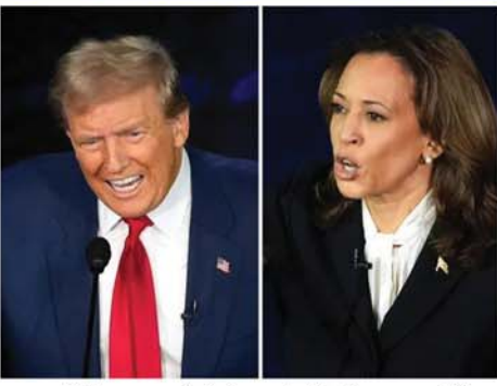
အဆိုပါ စကားစစ်ထိုးပွဲသည် အထက်တန်းကျောင်း စကားရည်လှပွဲမျိုး မဟုတ်သဖြင့် အနိုင်၊ အရှုံး သတ်မှတ်စရာ

ဝါရှင်တန် စက်တင်ဘာ ၁၂ ၂၀၂၄ ခုနှစ် အမေရိကန်သမ္မတ ရွေးကောက်ပွဲအတွက် စက်တင်ဘာ ၁၀ရက် ညပိုင်းက ပြုလုပ်သော စကားစစ်ထိုးပွဲတွင် ဒေါ်နယ်လ်ထရပ်စ်နှင့် ကာမလာဟ်ရစ် နယ်လ်ထရပ်စ်အခြေစိုက် သတင်းမီဒီယာများက လိုရာဆွဲပြီး ကောက်ချက်ချနေကြောင်း အယ်လ်ဂျာဇီးယားသတင်းဌာနက ဖော်ပြသည်။ ယင်းစကားစစ်ထိုးမှု အစီအစဉ်၌ ဒီမိုကရက်တစ် သမ္မတလောင်း ကာမလာဟ်ရစ် အနိုင်ရကာ ရီပတ်ဘလီကန် သမ္မတလောင်း ဒေါ်နယ်လ်ထရပ်စ် ခွဲသည်ဟု မီဒီယာအများစုက ဖော်ပြခဲ့သည်။ ကာမလာဟ်ရစ်က ဒေါ်နယ်လ်ထရပ်စ်၏ စိတ်ကို ဆွပေးပြီး ပြောဆိုရာမှ အချက်အလက်အများ၊ စကားအများများ ထရပ်ဘက်မှ ထုတ်ဖော်ပြောဆိုခဲ့သည်။ သို့ရာတွင် ထရပ်စ်အနေဖြင့် မိမိ၏ မူဝါဒများကို ထုတ်ဖော်ပြောသွားနိုင်ခဲ့ရာ ၎င်းအနိုင်ရသည့် ပွဲဟု ဆိုသင့်ကြောင်း ရီပတ်ဘလီကန် အားပေးထောက်ခံသူများက မှတ်ချက်ချသည်။