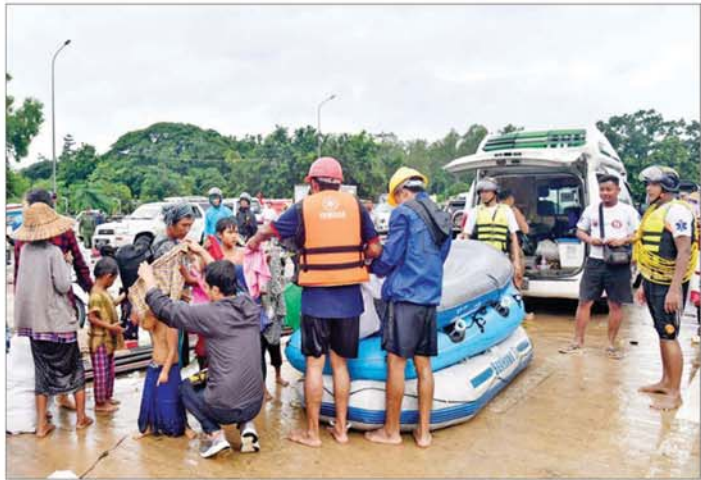
စေတနာရှင်ပြည်သူများက ရေဘေးသင့်ပြည်သူများအား အဝတ်အထည်များပေးလှူစဉ်။

( ၉-၉-၂၀၂၄ ရက်နေ့တွင် နိုင်ငံတော်စီမံအုပ်ချုပ်ရေးကောင်စီဥက္ကဋ္ဌ နိုင်ငံတော် ဝန်ကြီးချုပ် ဗိုလ်ချုပ်မှူးကြီး မင်းအောင်လှိုင် ရှမ်းပြည်နယ် အစိုးရအဖွဲ့ဝင်များ၊ ပြည်နယ်နှင့် ခရိုင်အဆင့် ဌာနဆိုင်ရာတာဝန်ရှိသူများအား ပြောကြားသည့် အမှာ စကားမှ ကောက်နုတ်ချက် )